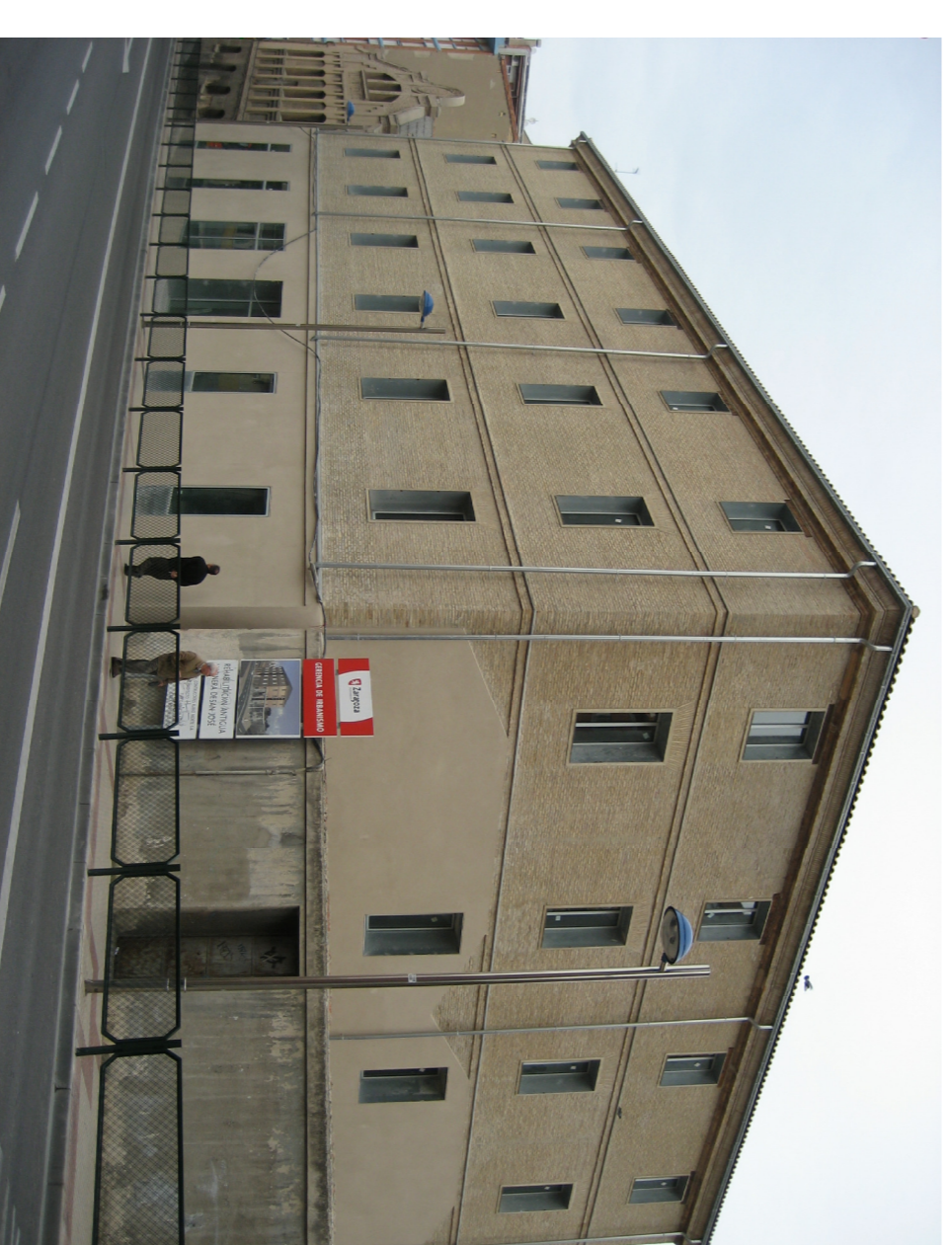
VISTA desde Avda. SAN JOSÉ