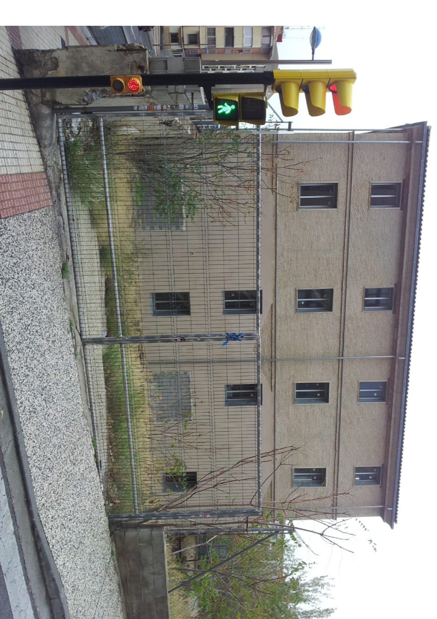
VISTA desde c/ LAPUYADE

PROYECTO BÁSICO y de EJECUCIÓN para ACONDICIONAMIENTO PARCIAL de la ANTIGUA FABRICA de HARINAS en AVENIDA SAN JOSÉ 201-203 ZARAGOZA