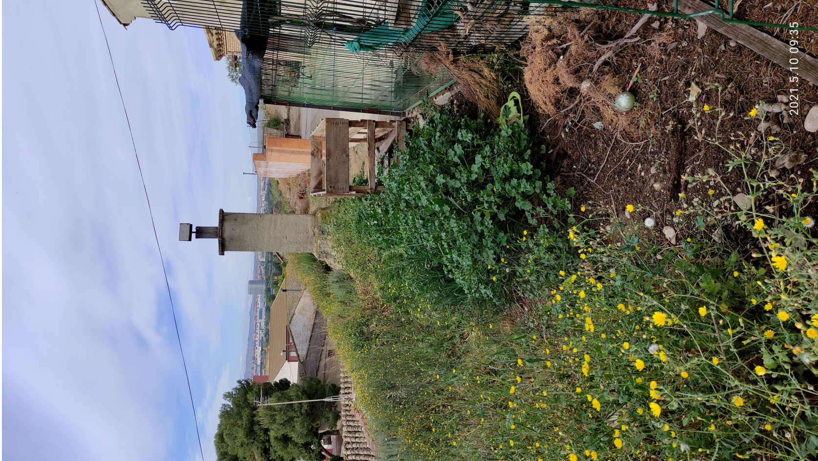
ANEXO3 FICHA TECNICA CL. ALMACEN15 (parte2).doc

Expediente: 1.641.910/2019 Referencia tramit@: 20230036173 (445556) Emplazamiento: CL. Almacén, 15 (JSL) Asunto: Ejecución subsidiaria de solera