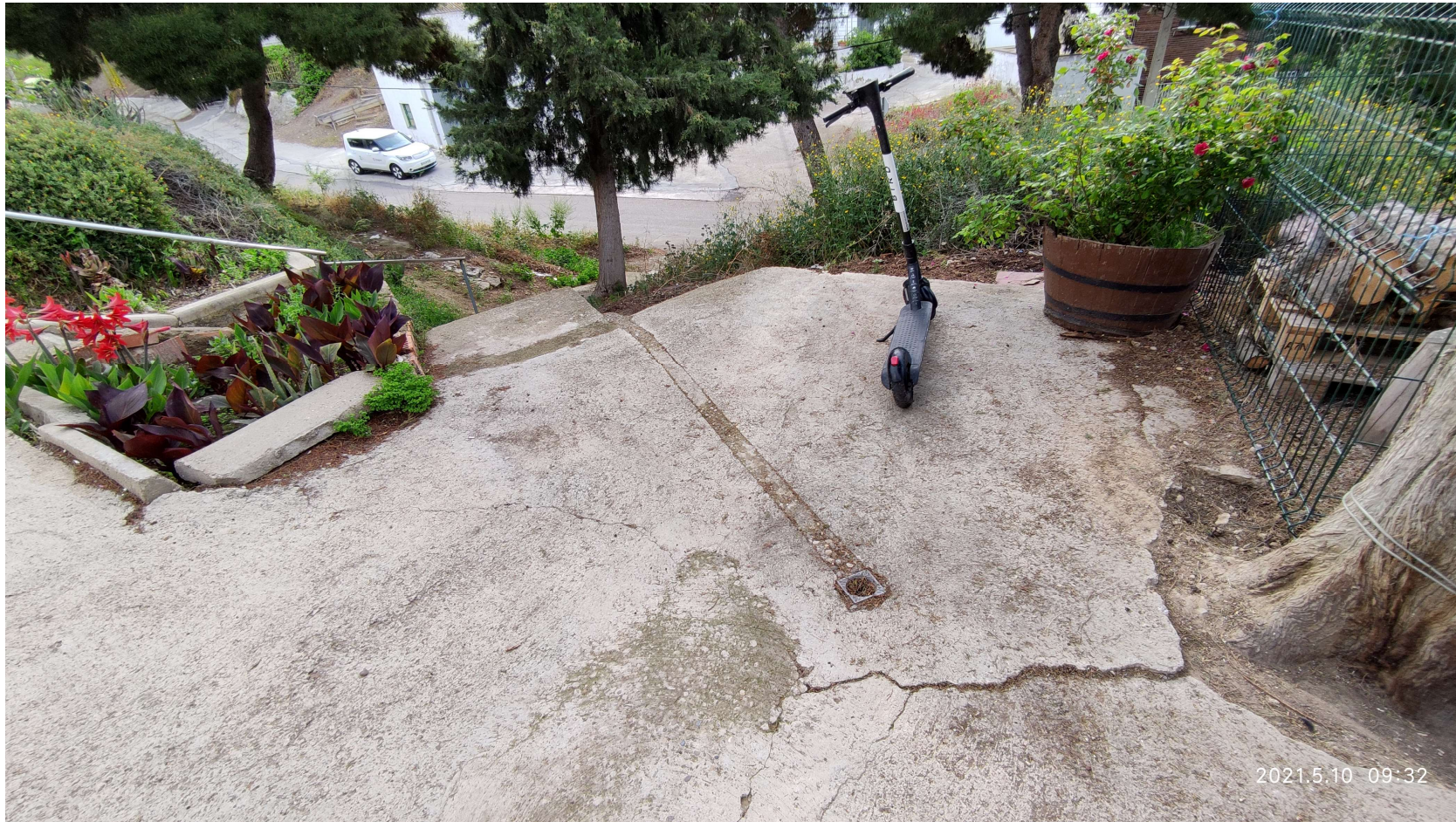
ANEXO3 FICHA TECNICA CL. ALMACEN15 (parte2).doc

Expediente: 1.641.910/2019 Referencia tramit@: 20230036173 (445556) Emplazamiento: CL. Almacén, 15 (JSL) Asunto: Ejecución subsidiaria de solera