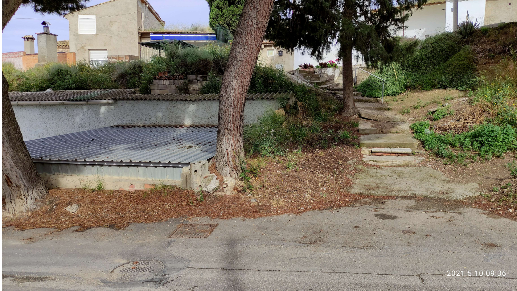
ANEXO3 FICHA TECNICA CL. ALMACEN15 (parte2).doc

Expediente: 1.641.910/2019 Referencia tramit@: 20230036173 (445556) Emplazamiento: CL. Almacén, 15 (JSL) Asunto: Ejecución subsidiaria de solera