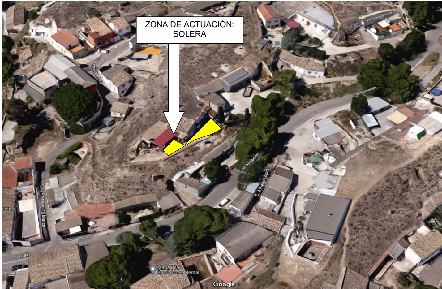
Vista aérea de la zona de actuación en el barrio de Juslibol, Cl. Almacen 15. Fuente Google Earth . Acceso 8/6/2022

Expediente: 1.641.910/2019 Referencia tramit@: 20230036173 (445556) Emplazamiento: CL. Almacén, 15 (JSL) Asunto: Ejecución subsidiaria de solera