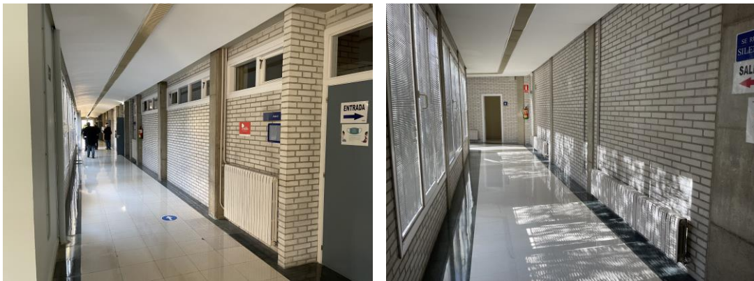
Fotos de los pasillos en los que se realizará la separación física entre ambos usos.

Esta organización del edificio hace que sea muy sencilla la delimitación y separación del mismo en dos zonas diferenciadas para usos distintos manteniendo la seguridad que necesita la academia de la Policía.