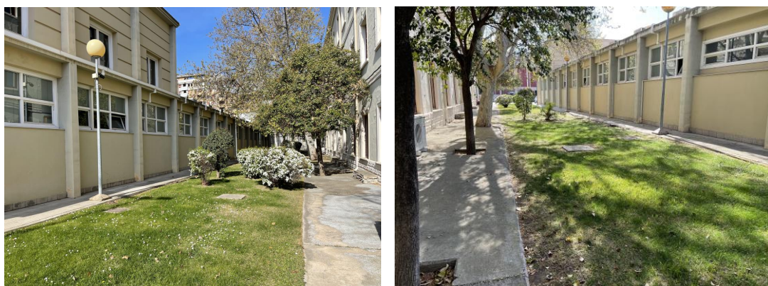
Fotos del jardín exterior donde se realizará el vallado de separación con la zona de la Policía y la pista de petanca y las nuevas salidas del edificio a esta zona exterior.