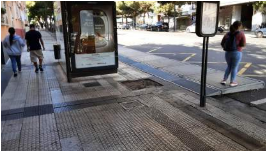
Foto del alcorque matrícula 24_51