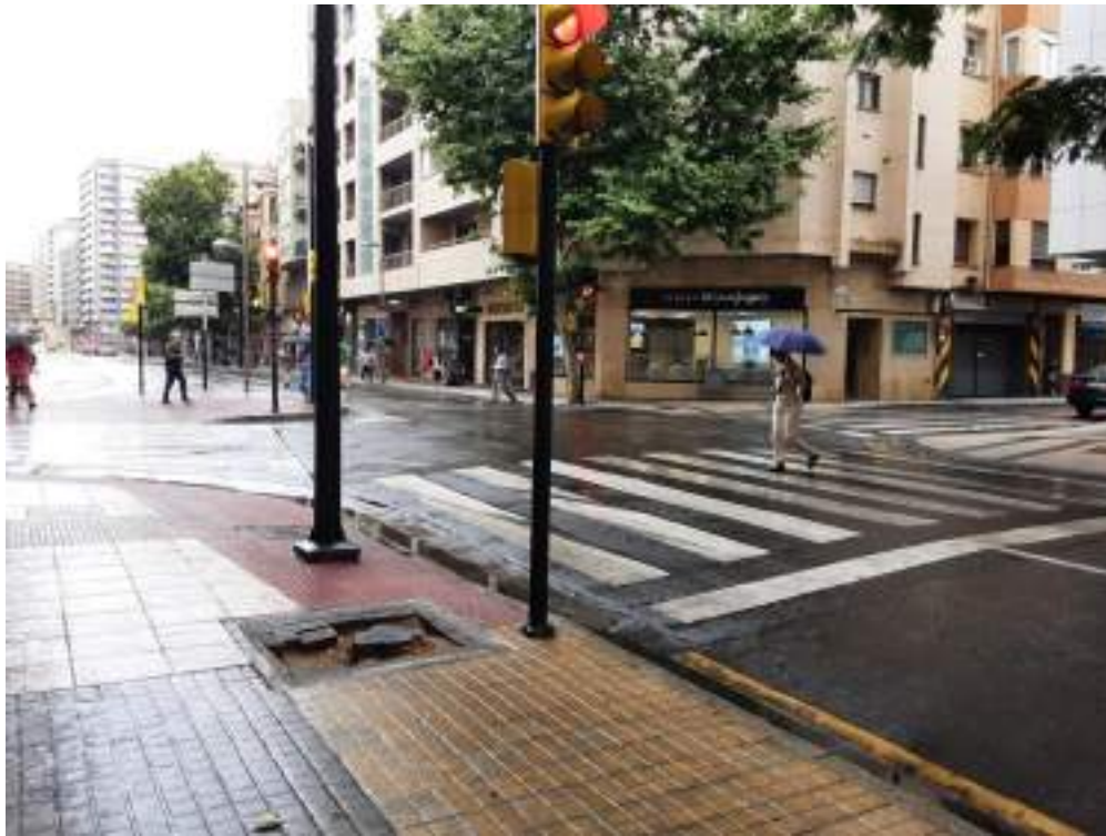
Foto del alcorque matrícula 18_135