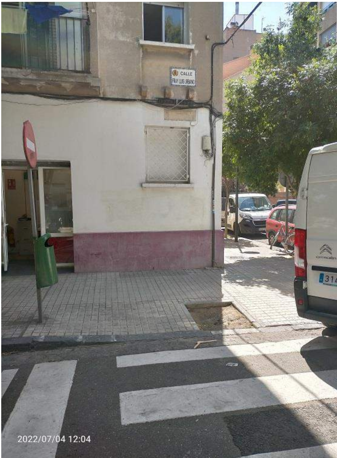
Foto del alcorque matrícula 09_150

Documento firmado digitalmente. Para verificar la validez de la firma acceda a https://www.zaragoza.es/verifica Ayuntamiento de Zaragoza - http://www.zaragoza.es