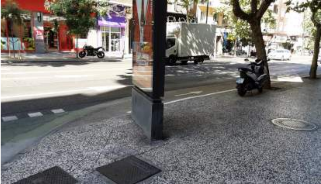
Foto del alcorque matrícula 32_237