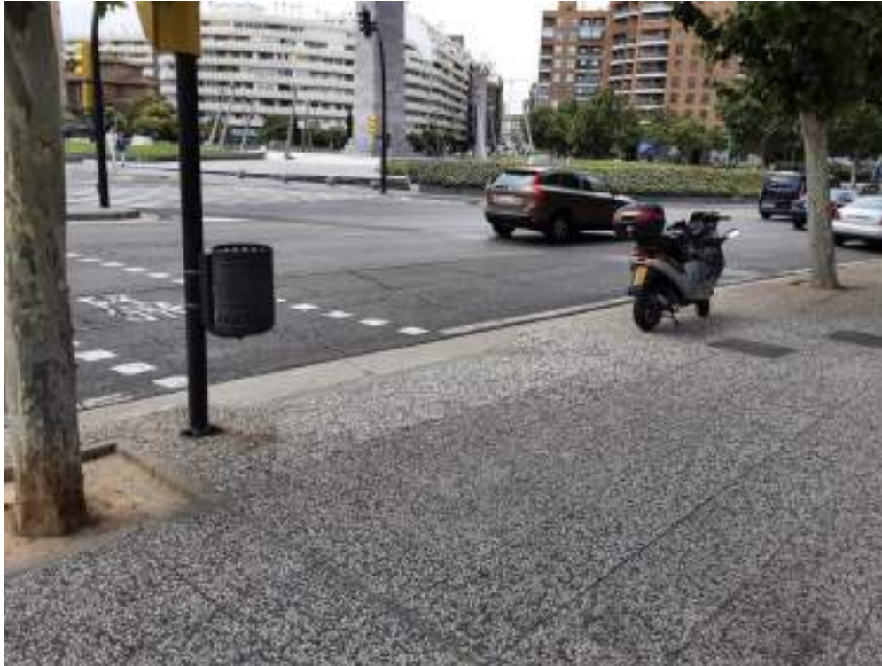
Foto del alcorque matrícula 45_867