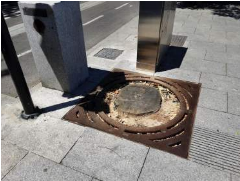
Foto del alcorque matrícula 1_174b

Documento firmado digitalmente. Para verificar la validez de la firma acceda a https://www.zaragoza.es/verifica Ayuntamiento de Zaragoza - http://www.zaragoza.es