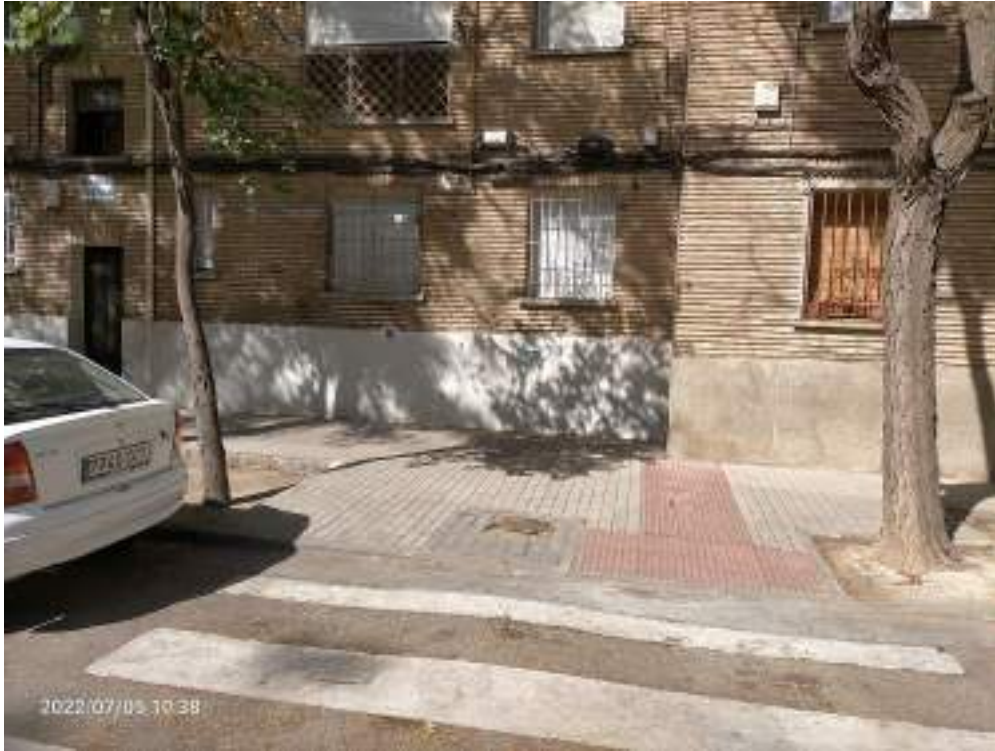
Foto del alcorque matrícula 24_1162