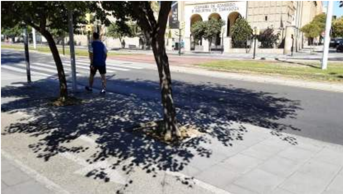
Foto del alcorque matrícula 30_118