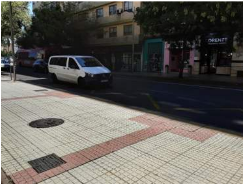
Foto del alcorque matrícula 15_547a

Documento firmado digitalmente. Para verificar la validez de la firma acceda a https://www.zaragoza.es/verifica Ayuntamiento de Zaragoza - http://www.zaragoza.es