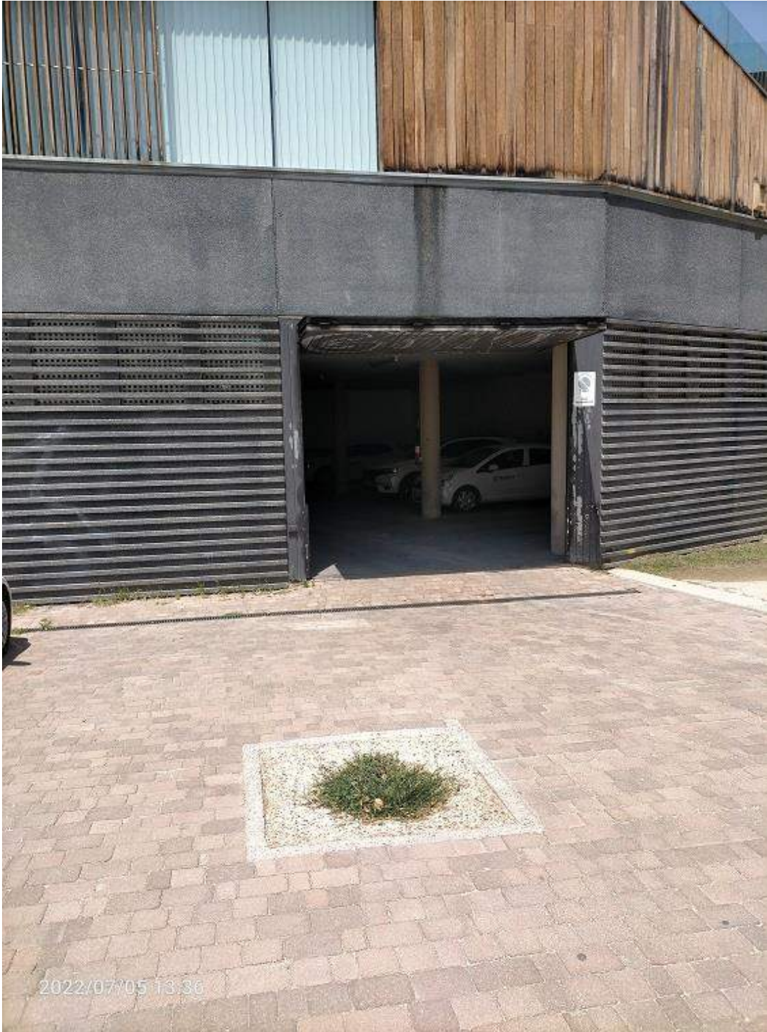
Foto del alcorque matrícula 02_673

Documento firmado digitalmente. Para verificar la validez de la firma acceda a https://www.zaragoza.es/verifica Ayuntamiento de Zaragoza - http://www.zaragoza.es