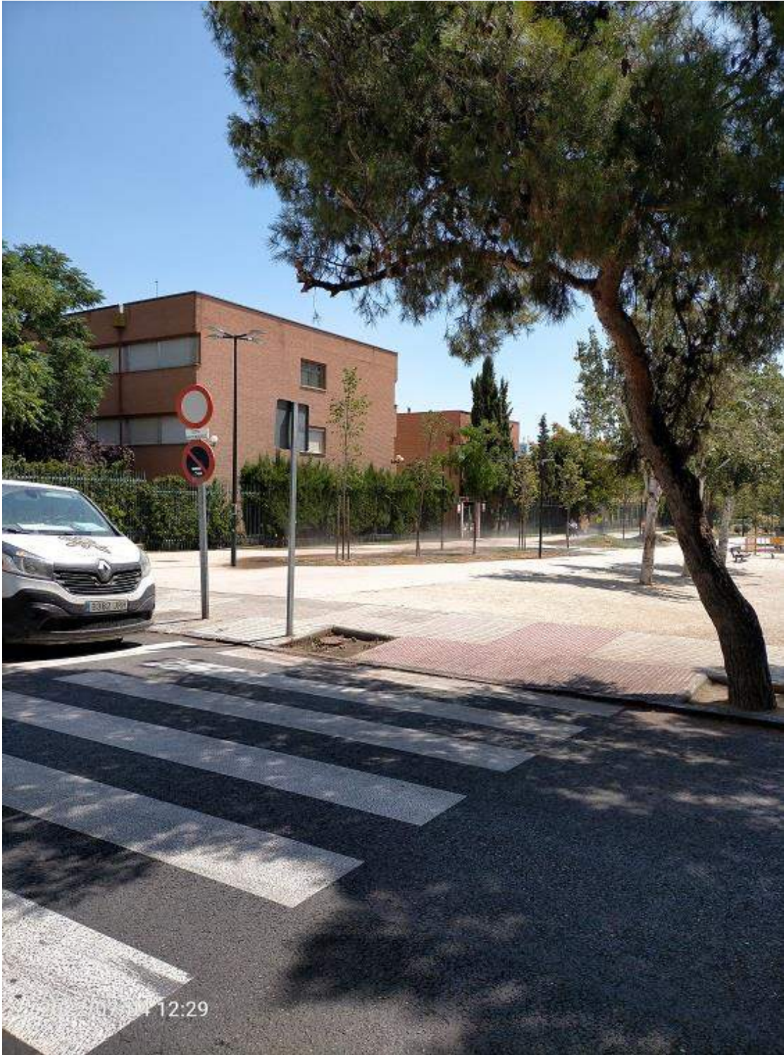
Foto del alcorque matrícula 10_340

Documento firmado digitalmente. Para verificar la validez de la firma acceda a https://www.zaragoza.es/verifica Ayuntamiento de Zaragoza - http://www.zaragoza.es