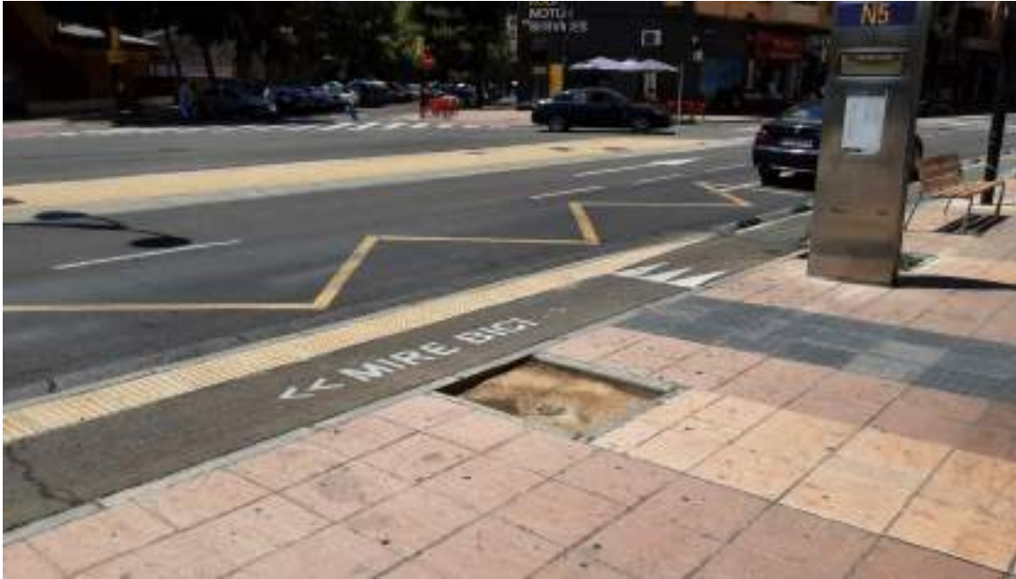
Foto del alcorque matrícula 09_2152