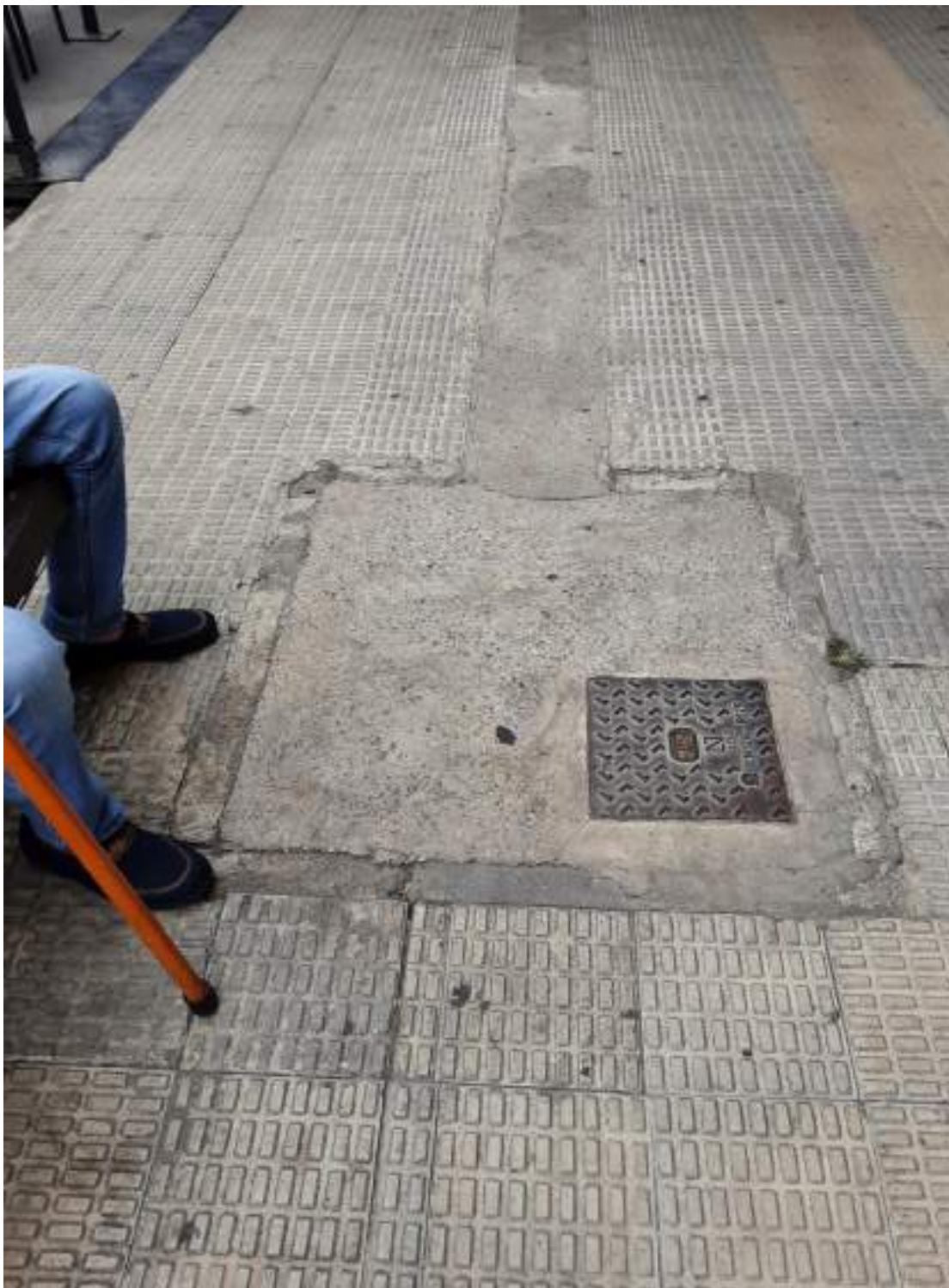
Foto del alcorque matrícula 45_6017

Documento firmado digitalmente. Para verificar la validez de la firma acceda a https://www.zaragoza.es/verifica Ayuntamiento de Zaragoza - http://www.zaragoza.es