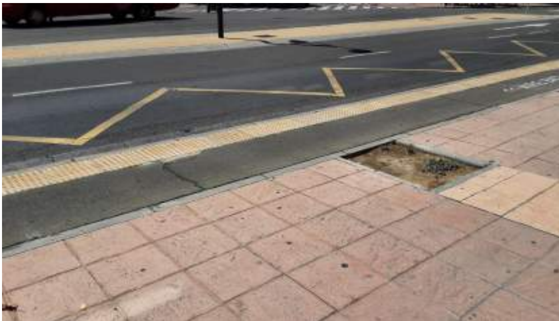
Foto del alcorque matrícula 09_2150