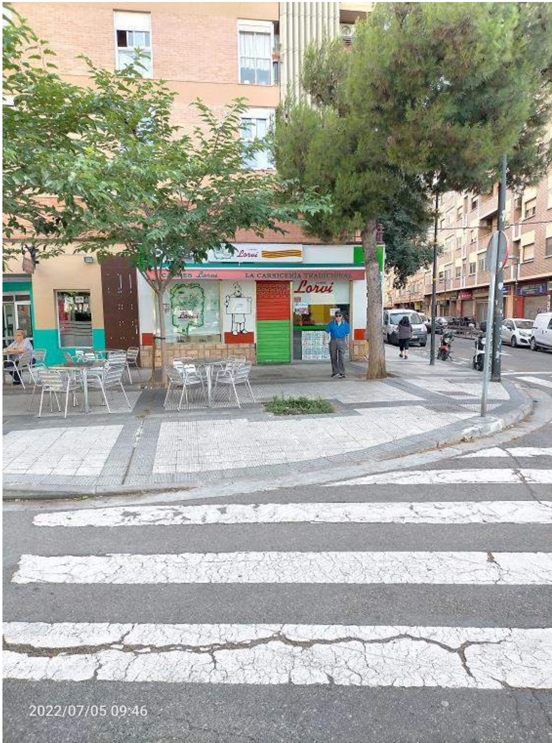
Foto del alcorque matrícula 22_413

Documento firmado digitalmente. Para verificar la validez de la firma acceda a https://www.zaragoza.es/verifica Ayuntamiento de Zaragoza - http://www.zaragoza.es