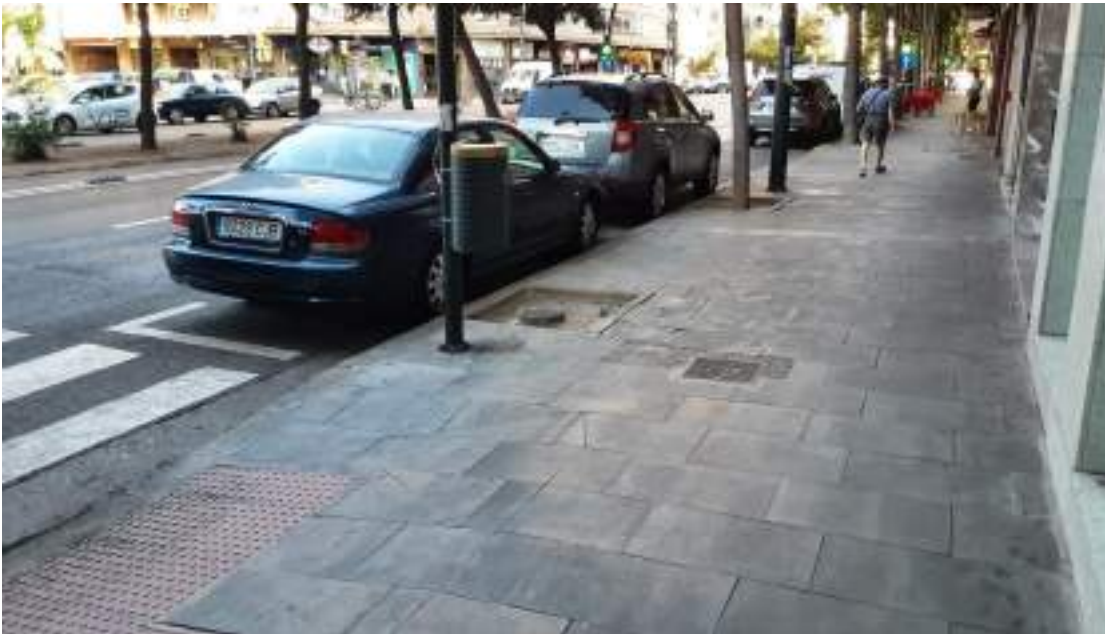
Foto del alcorque matrícula 21_99

Documento firmado digitalmente. Para verificar la validez de la firma acceda a https://www.zaragoza.es/verifica Ayuntamiento de Zaragoza - http://www.zaragoza.es