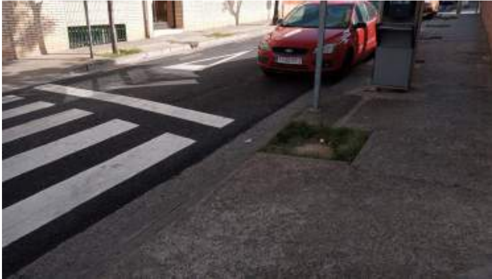
Foto del alcorque matrícula 57_666