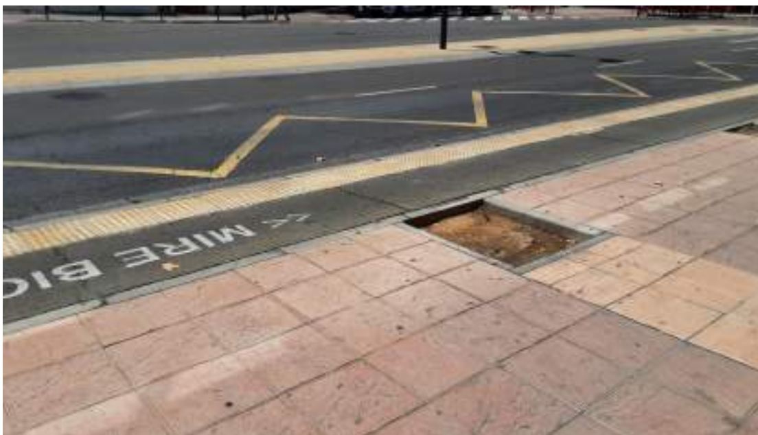
Foto del alcorque matrícula 09_2151

Documento firmado digitalmente. Para verificar la validez de la firma acceda a https://www.zaragoza.es/verifica Ayuntamiento de Zaragoza - http://www.zaragoza.es