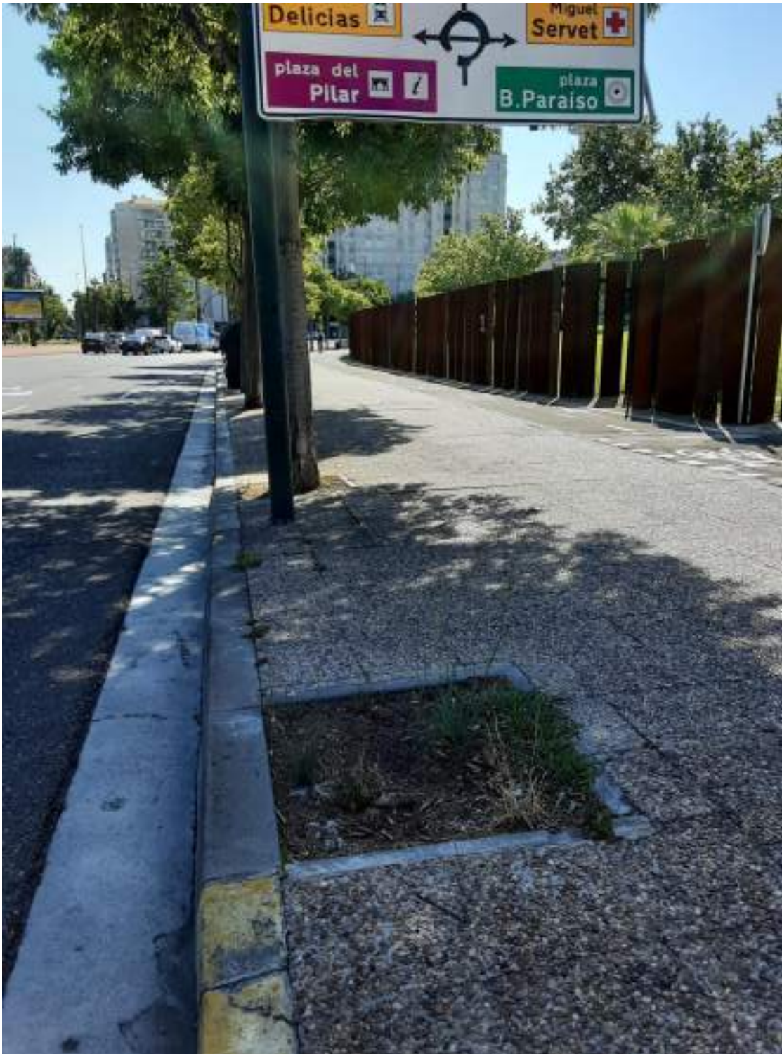
Foto del alcorque matrícula 58_239a

Documento firmado digitalmente. Para verificar la validez de la firma acceda a https://www.zaragoza.es/verifica Ayuntamiento de Zaragoza - http://www.zaragoza.es