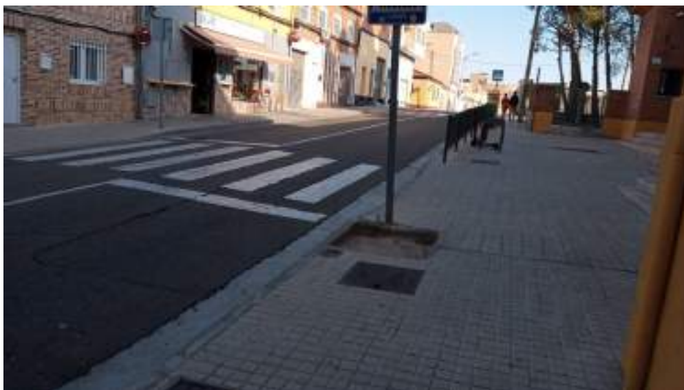
Foto del alcorque matrícula 56_4053

Documento firmado digitalmente. Para verificar la validez de la firma acceda a https://www.zaragoza.es/verifica Ayuntamiento de Zaragoza - http://www.zaragoza.es