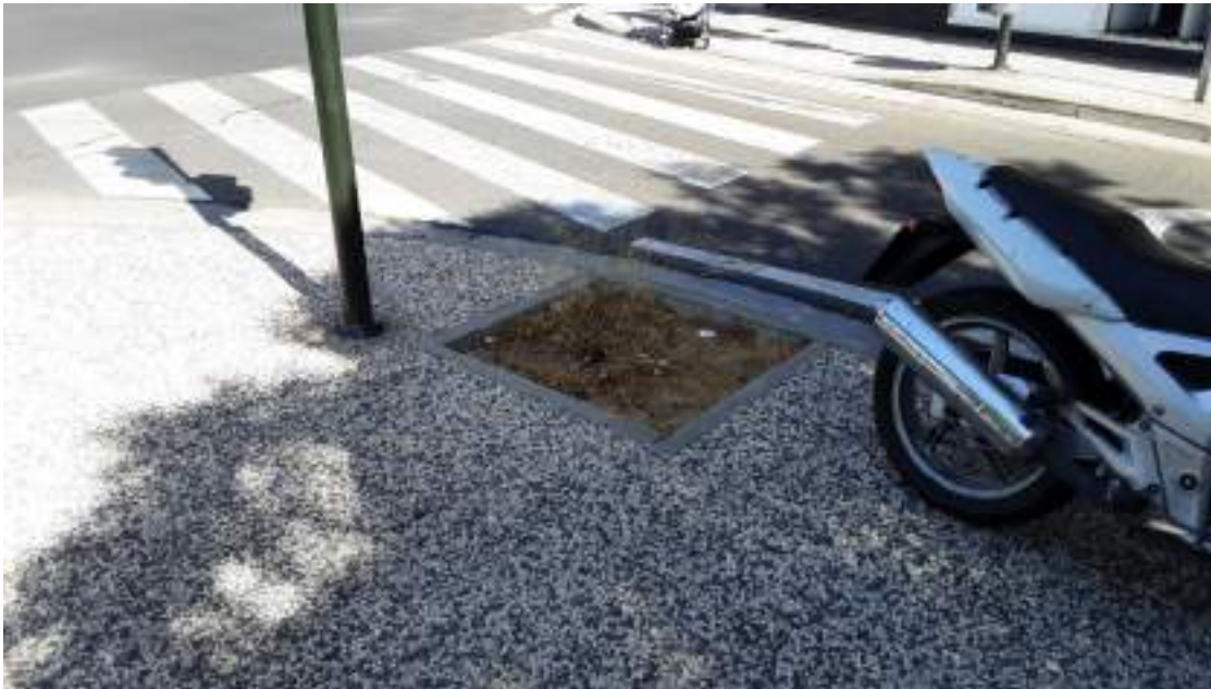
Foto del alcorque matrícula 31_322