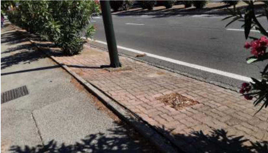
Foto del alcorque matrícula 30_5010