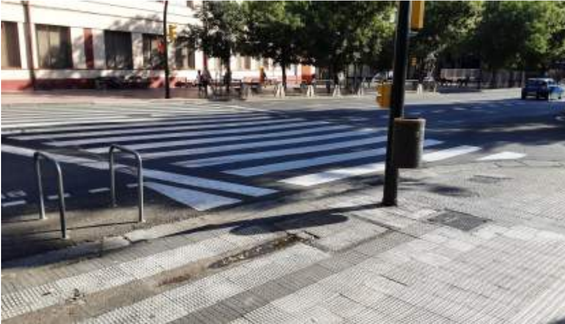
Foto del alcorque matrícula 24_55