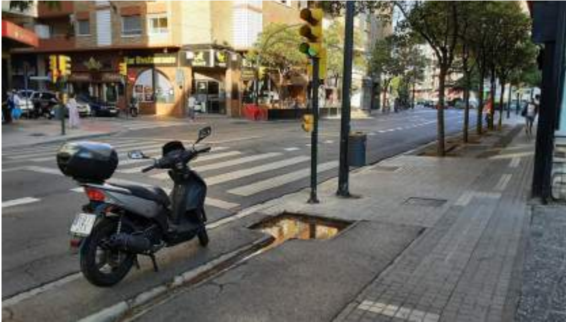
Foto del alcorque matrícula 19_38