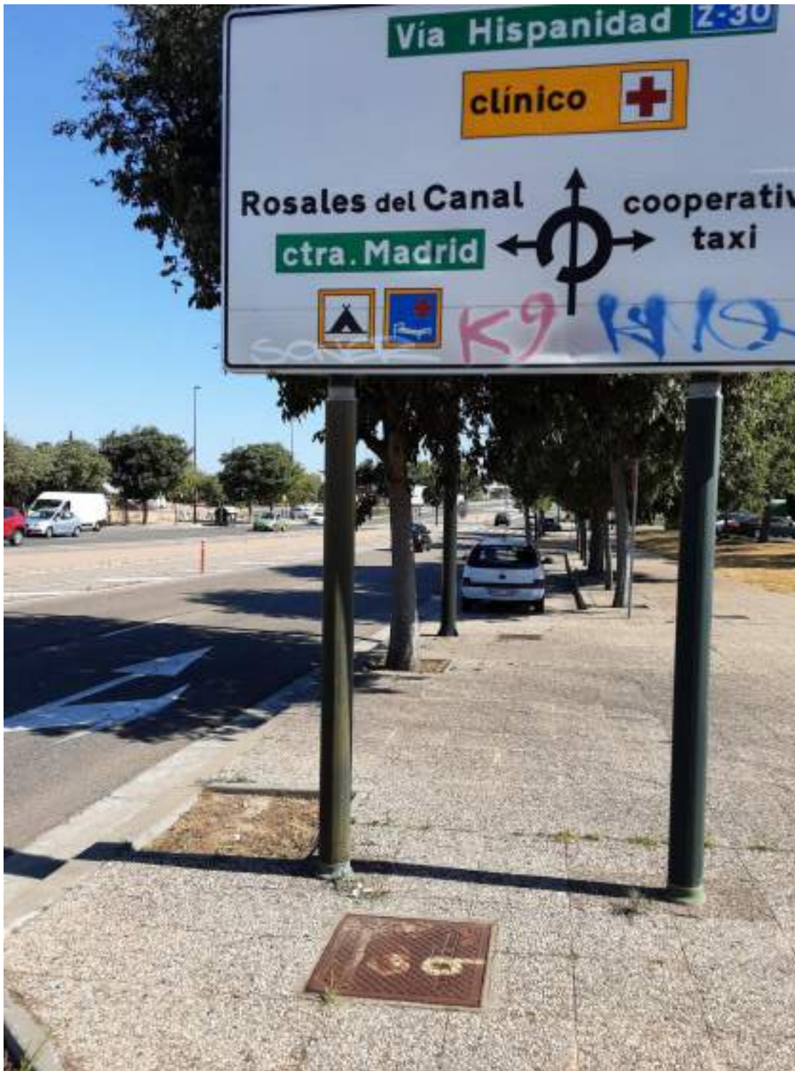
Foto del alcorque matrícula 60_288

Documento firmado digitalmente. Para verificar la validez de la firma acceda a https://www.zaragoza.es/verifica Ayuntamiento de Zaragoza - http://www.zaragoza.es