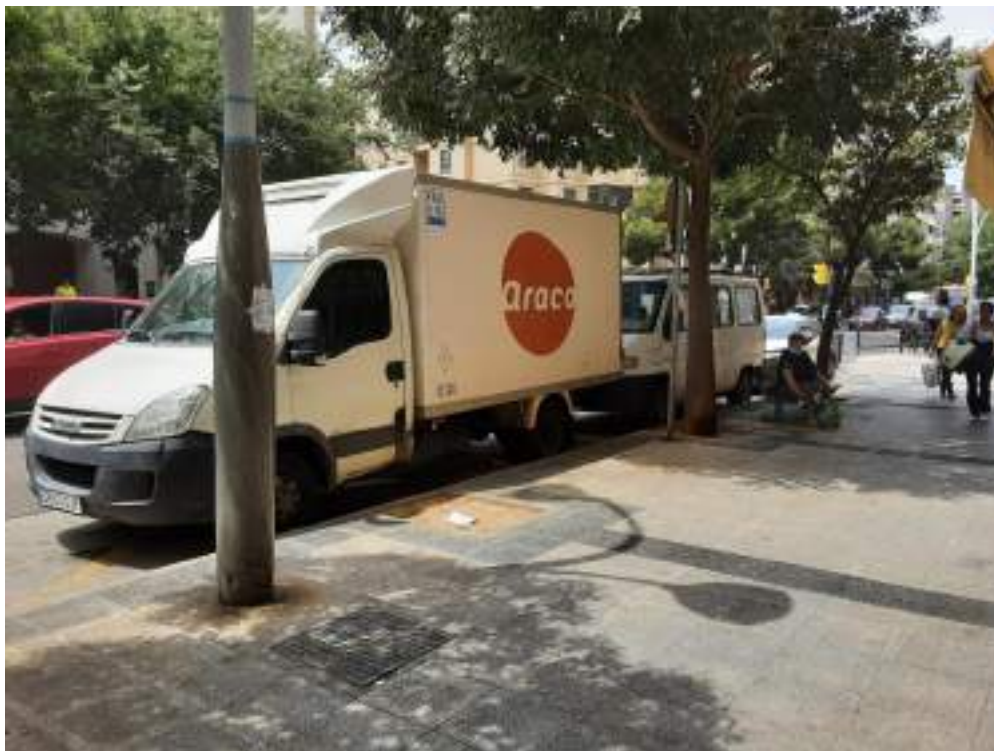
Foto del alcorque matrícula 45_707a