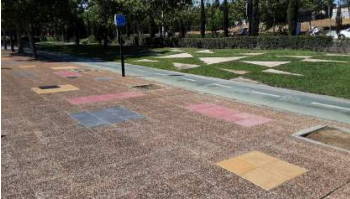
Foto del alcorque matrícula 28_249