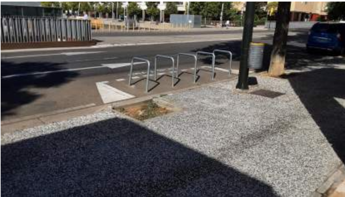
Foto del alcorque matrícula 27_502

Documento firmado digitalmente. Para verificar la validez de la firma acceda a https://www.zaragoza.es/verifica Ayuntamiento de Zaragoza - http://www.zaragoza.es