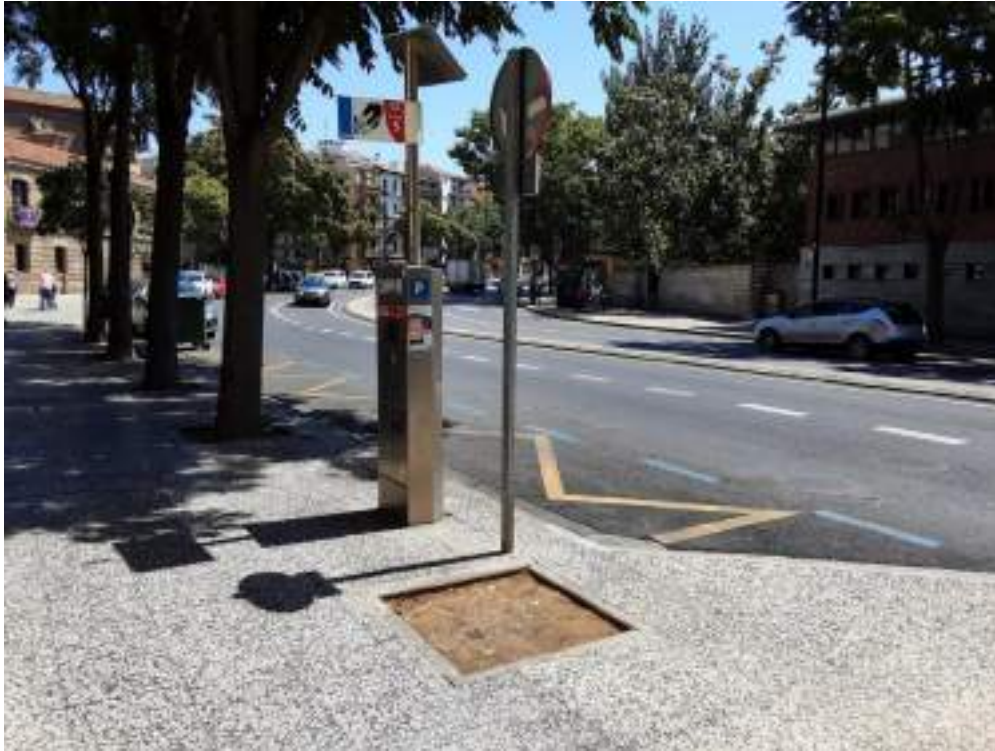
Foto del alcorque matrícula 5_532