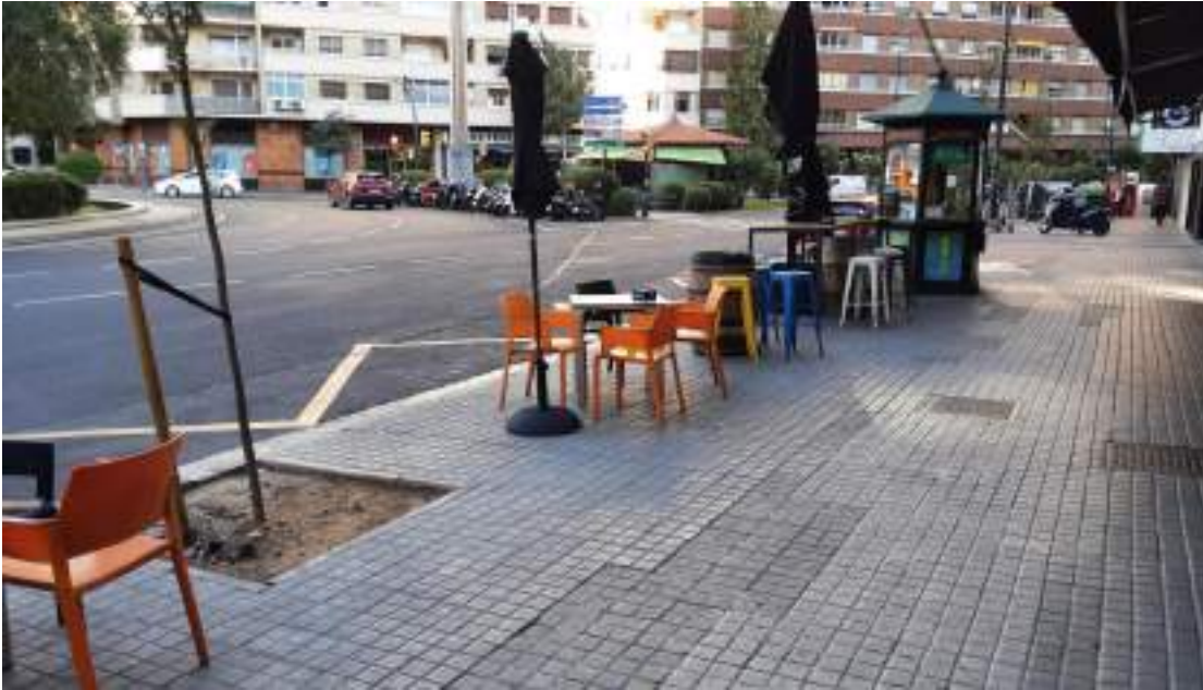
Foto del alcorque matrícula 19_48