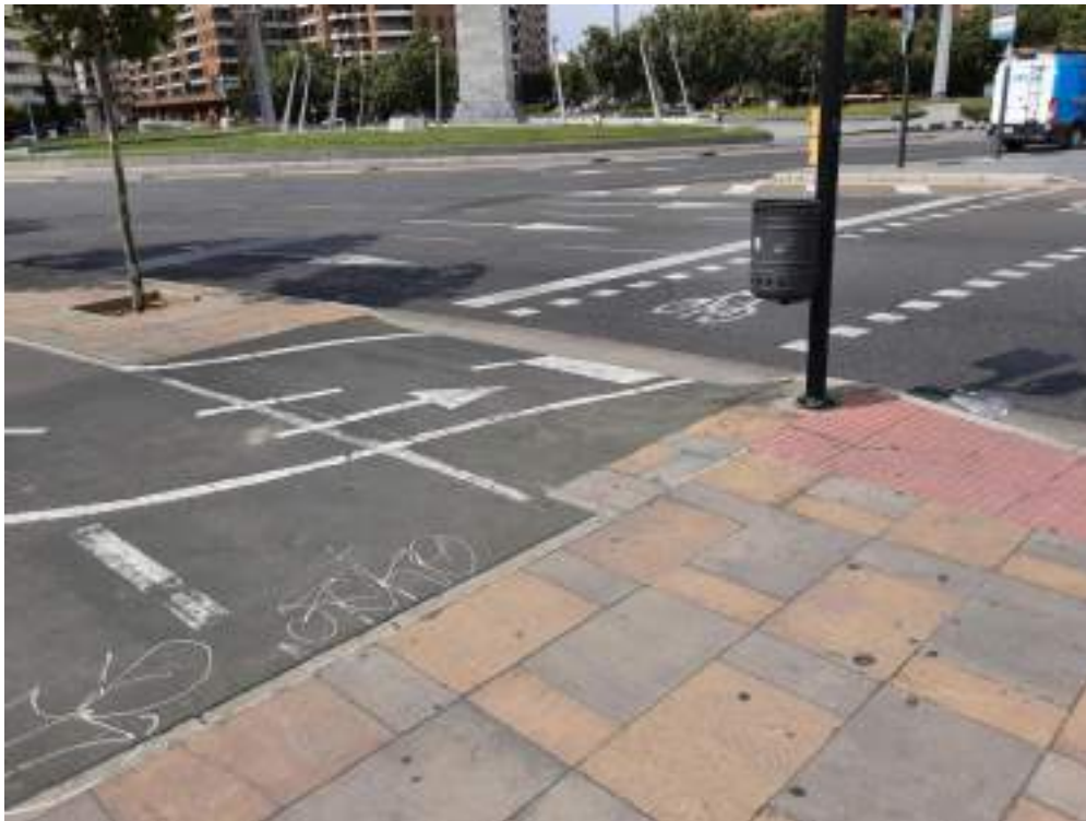
Foto del alcorque matrícula 2_6

Documento firmado digitalmente. Para verificar la validez de la firma acceda a https://www.zaragoza.es/verifica Ayuntamiento de Zaragoza - http://www.zaragoza.es