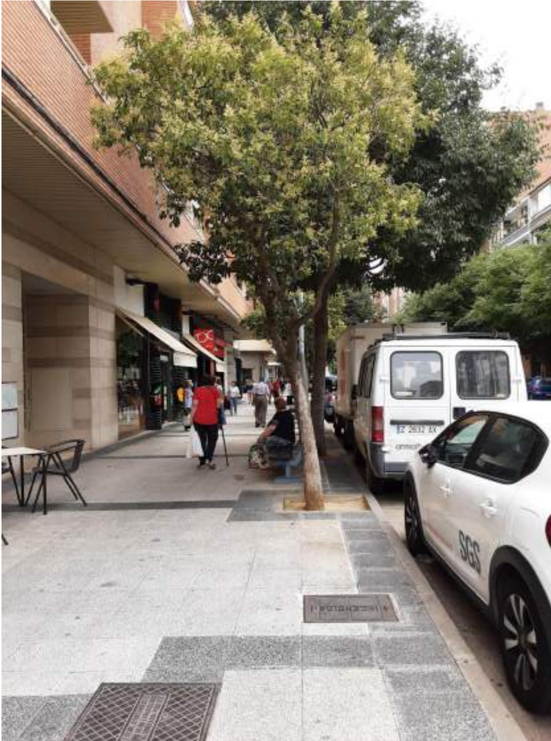
Foto del alcorque matrícula 45_705

Documento firmado digitalmente. Para verificar la validez de la firma acceda a https://www.zaragoza.es/verifica Ayuntamiento de Zaragoza - http://www.zaragoza.es