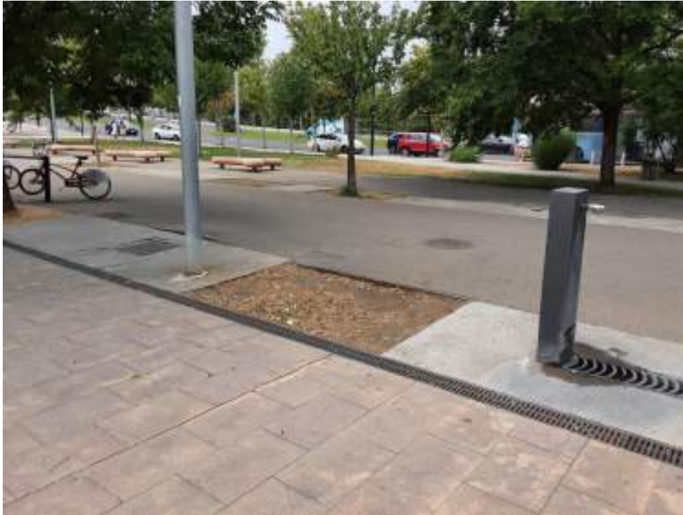
Foto del alcorque matrícula 45_2838