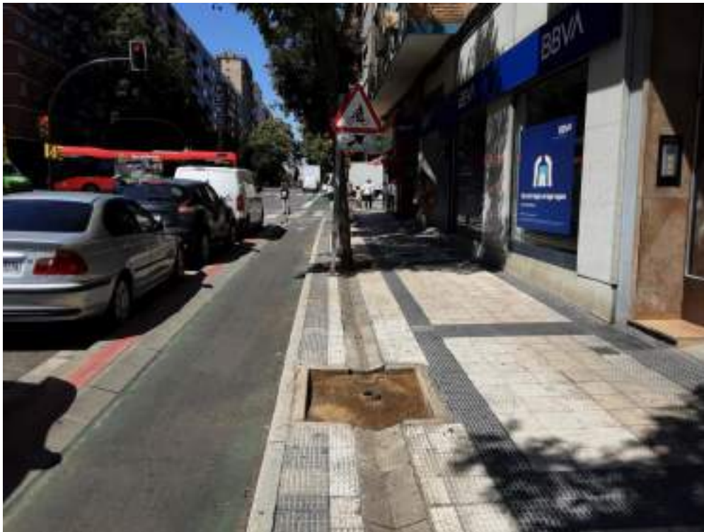
Foto del alcorque matrícula 7_862

Documento firmado digitalmente. Para verificar la validez de la firma acceda a https://www.zaragoza.es/verifica Ayuntamiento de Zaragoza - http://www.zaragoza.es