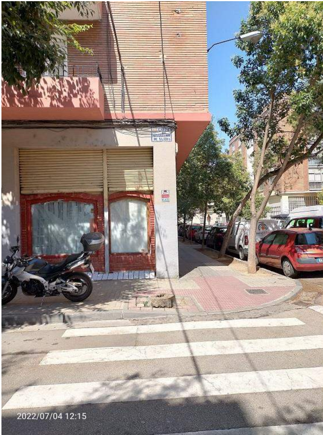
Foto del alcorque matrícula 09_434

Documento firmado digitalmente. Para verificar la validez de la firma acceda a https://www.zaragoza.es/verifica Ayuntamiento de Zaragoza - http://www.zaragoza.es