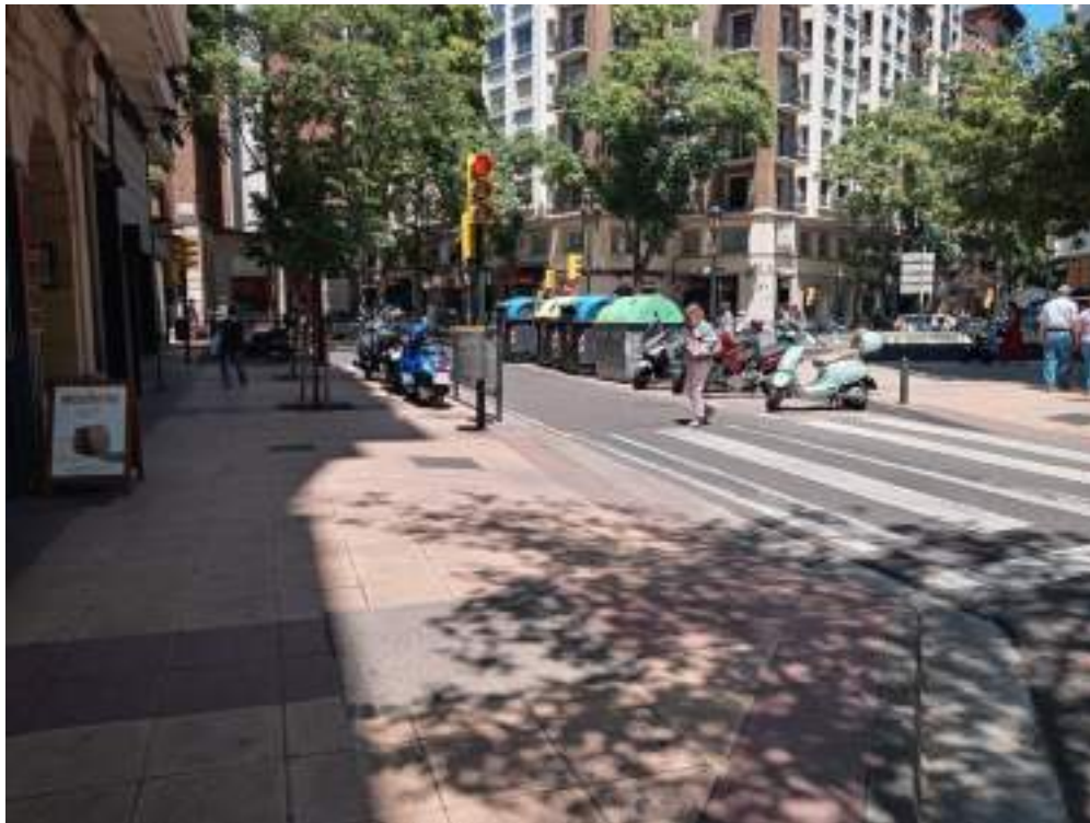
Foto del alcorque matrícula 14_382