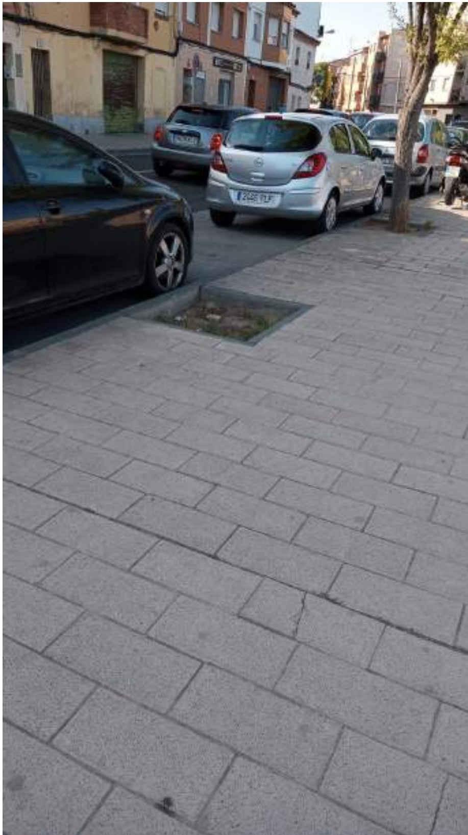
Foto del alcorque matrícula 56_8217

Documento firmado digitalmente. Para verificar la validez de la firma acceda a https://www.zaragoza.es/verifica Ayuntamiento de Zaragoza - http://www.zaragoza.es