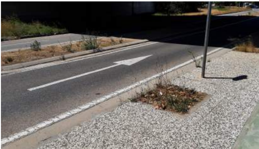
Foto del alcorque matrícula 87_168

Documento firmado digitalmente. Para verificar la validez de la firma acceda a https://www.zaragoza.es/verifica Ayuntamiento de Zaragoza - http://www.zaragoza.es