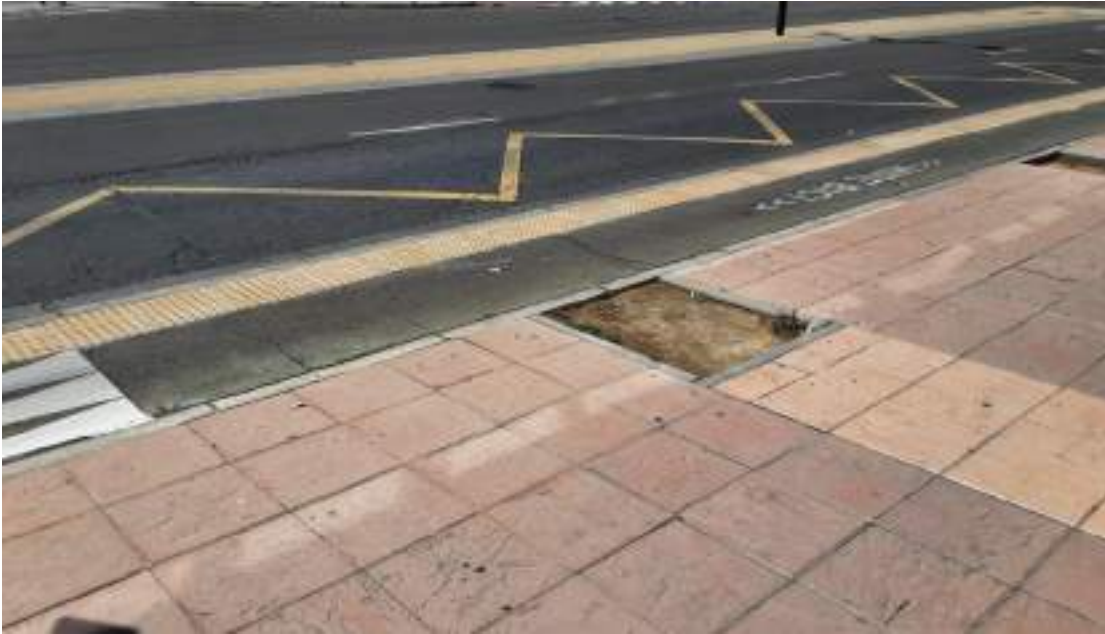
Foto del alcorque matrícula 09_2381