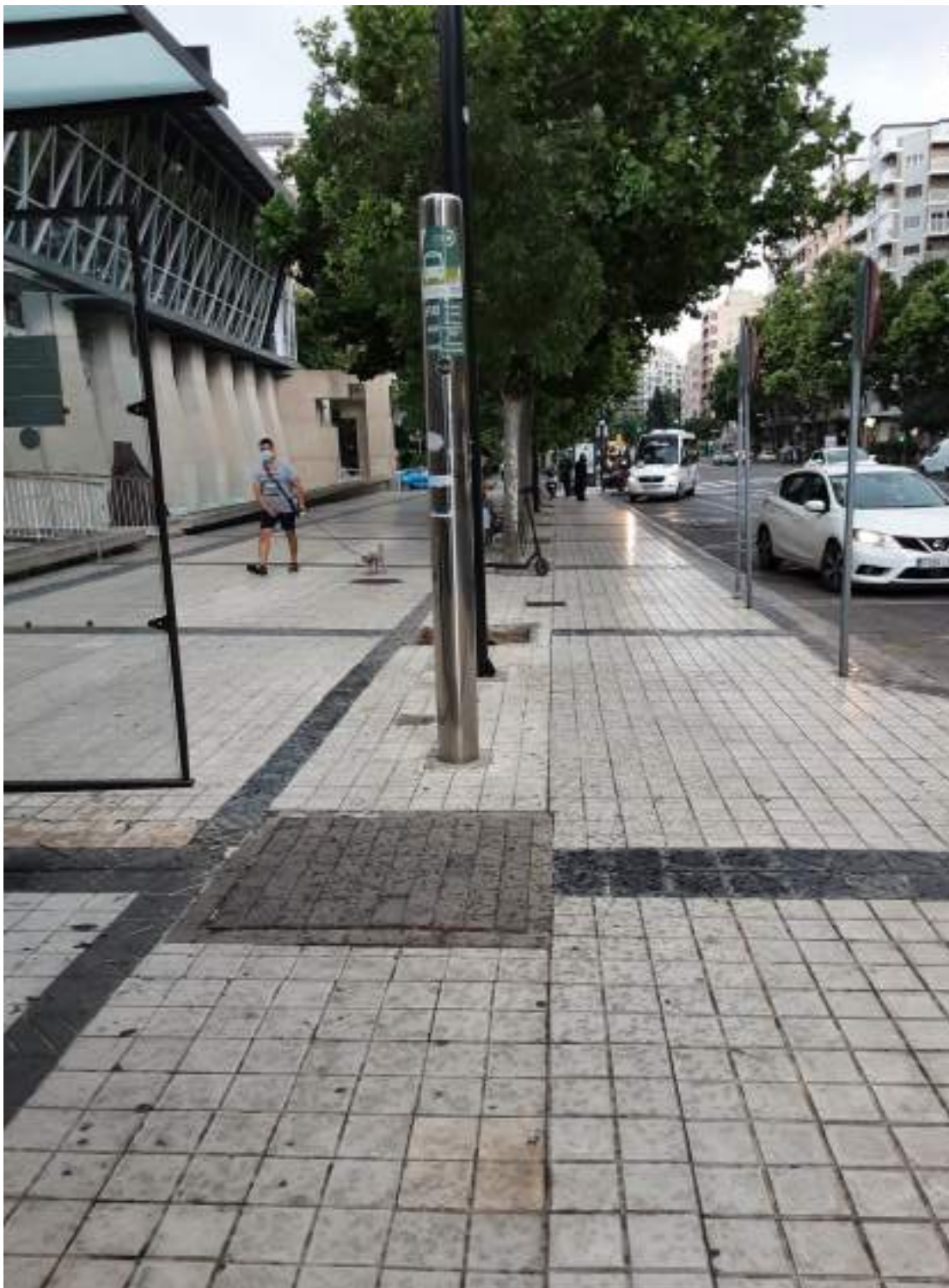
Foto del alcorque matrícula 3_60

Documento firmado digitalmente. Para verificar la validez de la firma acceda a https://www.zaragoza.es/verifica Ayuntamiento de Zaragoza - http://www.zaragoza.es