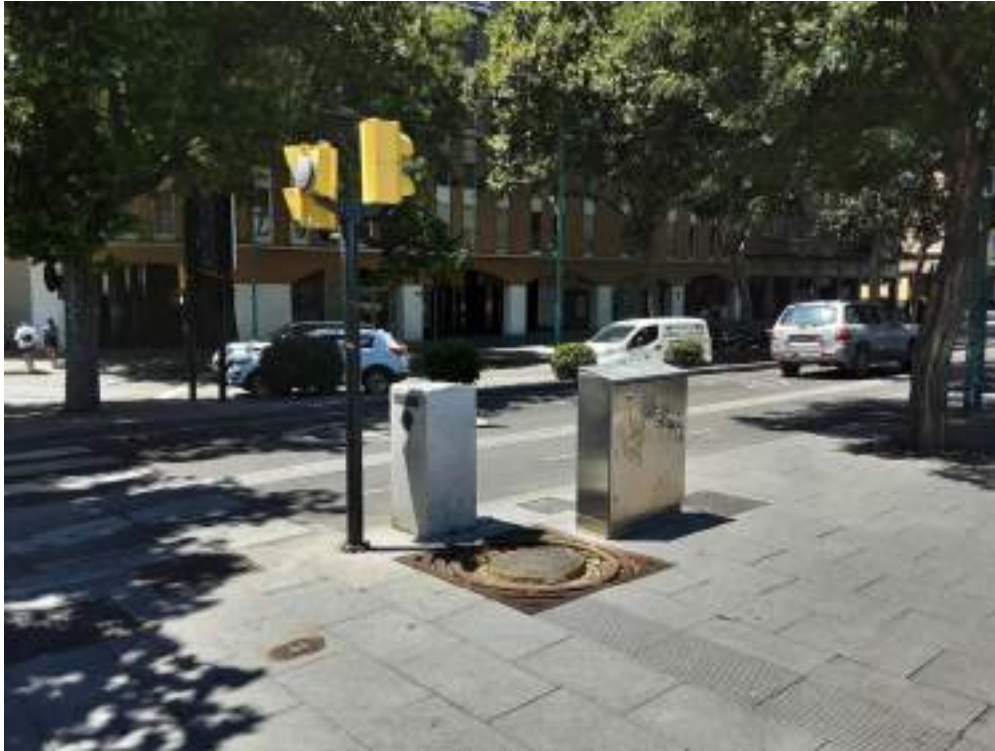
Foto del alcorque matrícula 1_174a