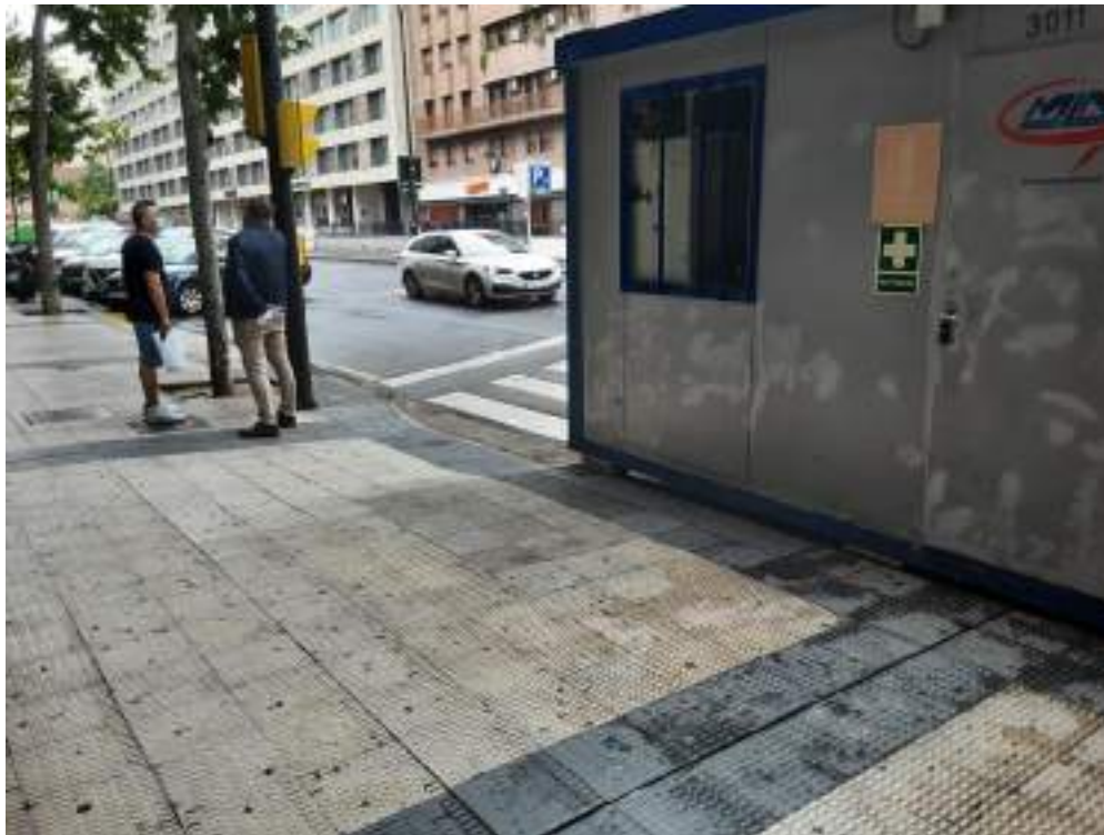
Foto del alcorque matrícula 4_399