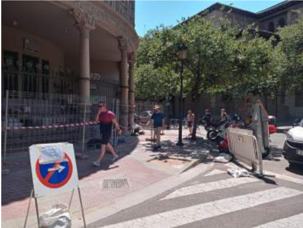
Foto del alcorque matrícula 05_690