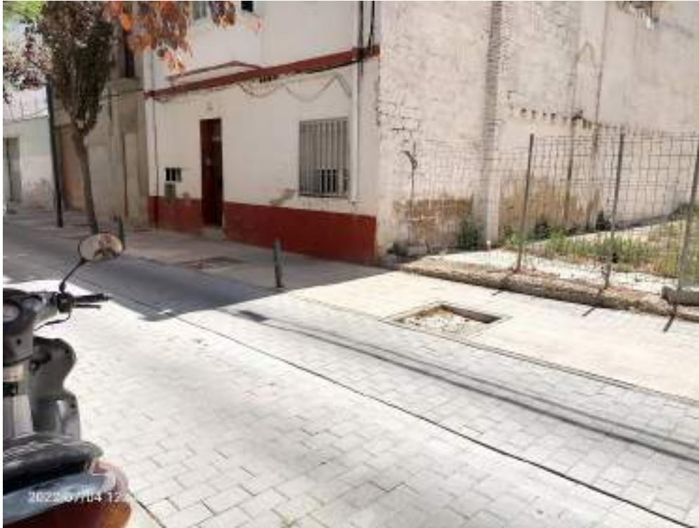
Foto del alcorque matrícula 10_1104