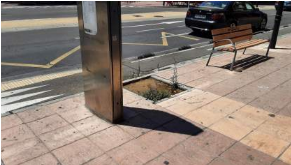
Foto del alcorque matrícula 09_2153