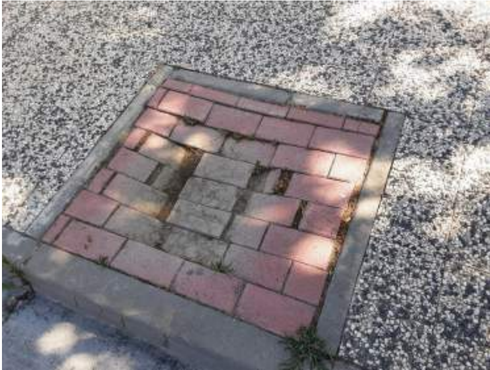
Foto del alcorque matrícula 59_599b