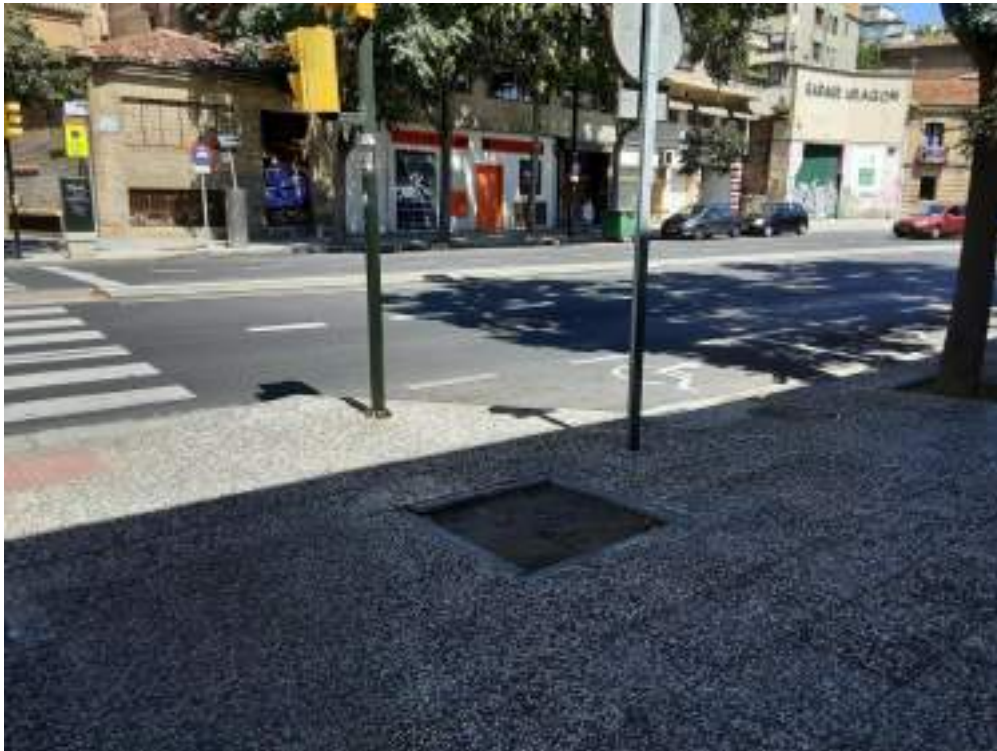
Foto del alcorque matrícula 13_24