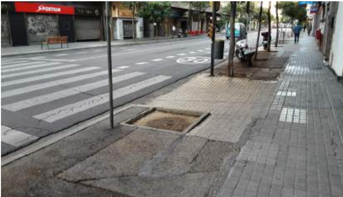
Foto del alcorque matrícula 19_19