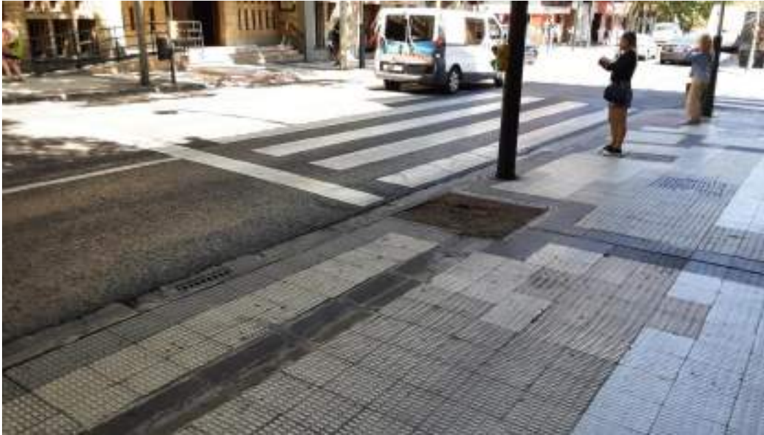
Foto del alcorque matrícula 37_2598