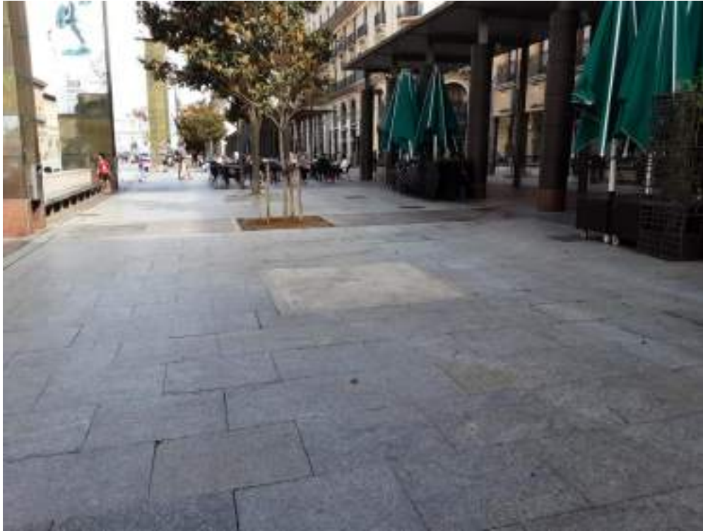
Foto del alcorque matrícula 1_826