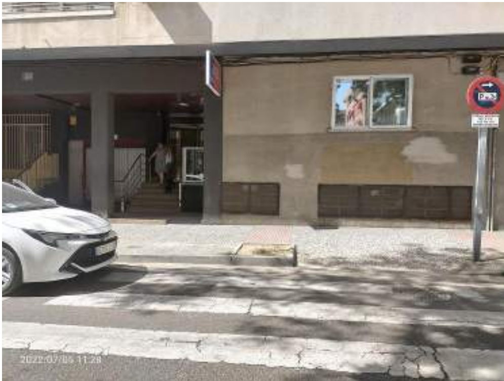
Foto del alcorque matrícula 35_231

Documento firmado digitalmente. Para verificar la validez de la firma acceda a https://www.zaragoza.es/verifica Ayuntamiento de Zaragoza - http://www.zaragoza.es