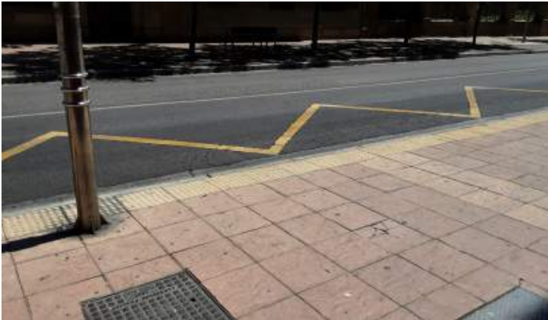
Foto del alcorque matrícula 11_897