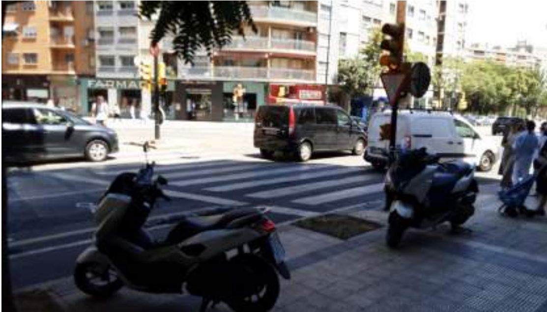
Foto del alcorque matrícula 12_1