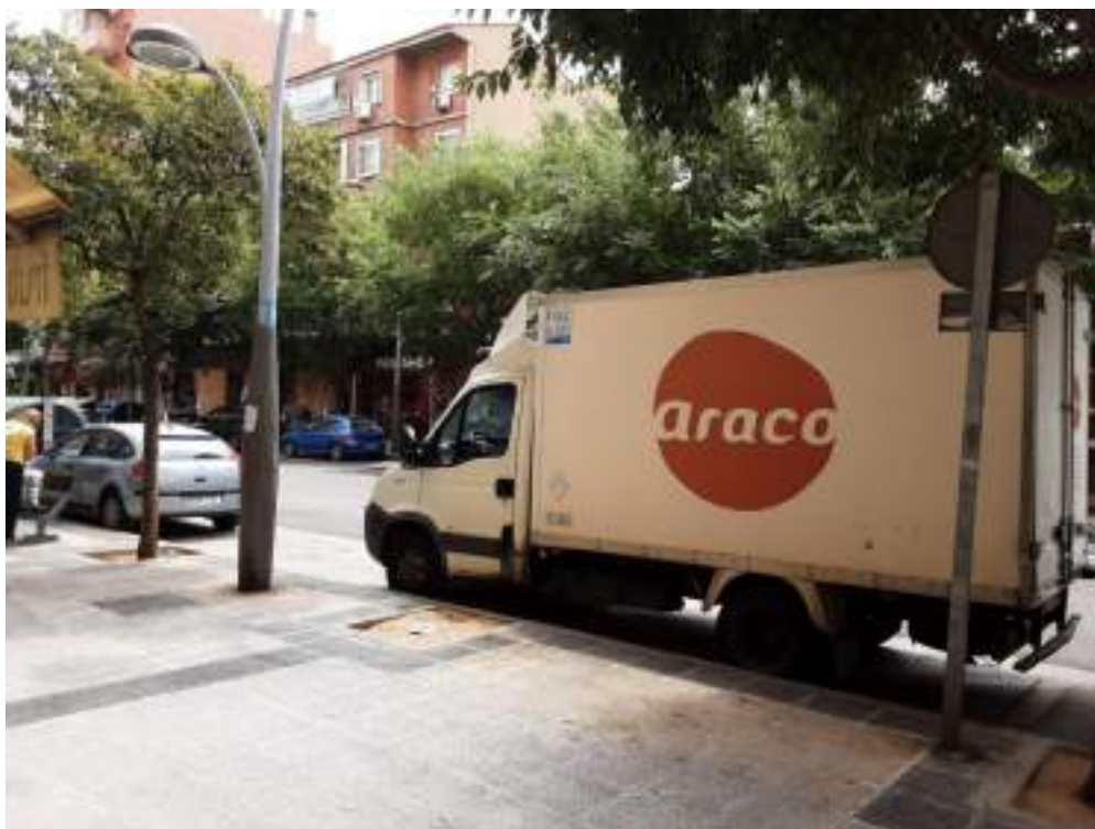
Foto del alcorque matrícula 45_707b

Documento firmado digitalmente. Para verificar la validez de la firma acceda a https://www.zaragoza.es/verifica Ayuntamiento de Zaragoza - http://www.zaragoza.es