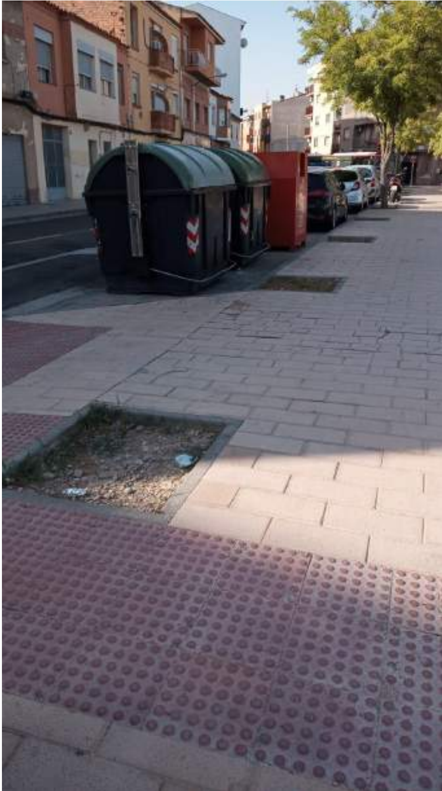
Foto del alcorque matrícula 56_8214

Documento firmado digitalmente. Para verificar la validez de la firma acceda a https://www.zaragoza.es/verifica Ayuntamiento de Zaragoza - http://www.zaragoza.es