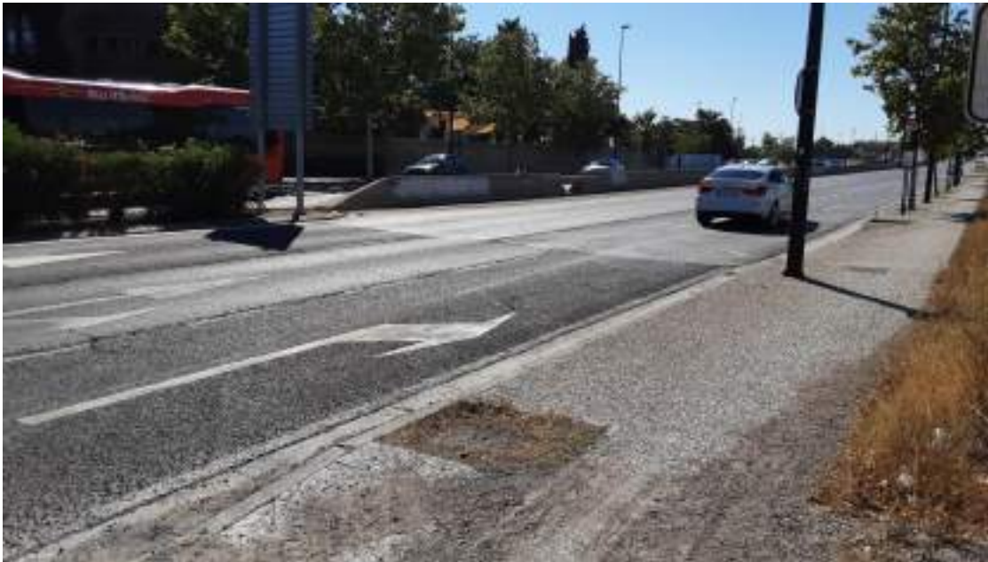
Foto del alcorque matrícula 38_982