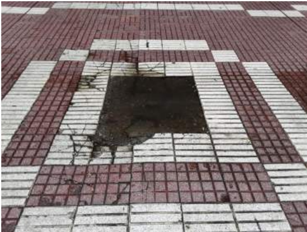
Foto del alcorque matrícula 04_377

Documento firmado digitalmente. Para verificar la validez de la firma acceda a https://www.zaragoza.es/verifica Ayuntamiento de Zaragoza - http://www.zaragoza.es