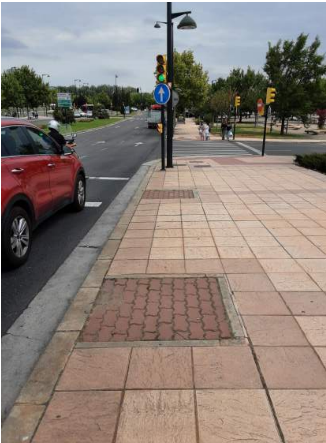
Foto del alcorque matrícula 45_2611 y 2612

Documento firmado digitalmente. Para verificar la validez de la firma acceda a https://www.zaragoza.es/verifica Ayuntamiento de Zaragoza - http://www.zaragoza.es