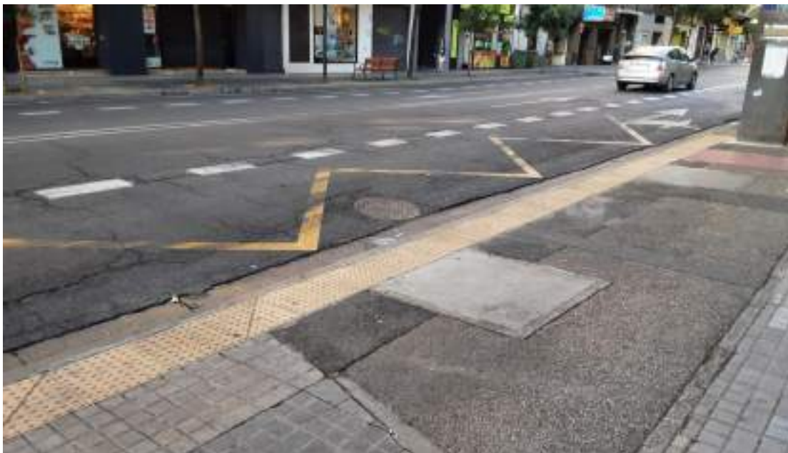
Foto del alcorque matrícula 19_27