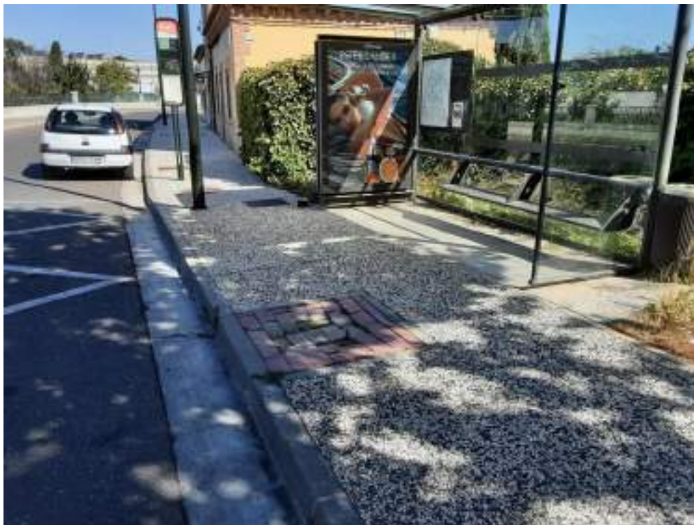
Foto del alcorque matrícula 59_599a

Documento firmado digitalmente. Para verificar la validez de la firma acceda a https://www.zaragoza.es/verifica Ayuntamiento de Zaragoza - http://www.zaragoza.es