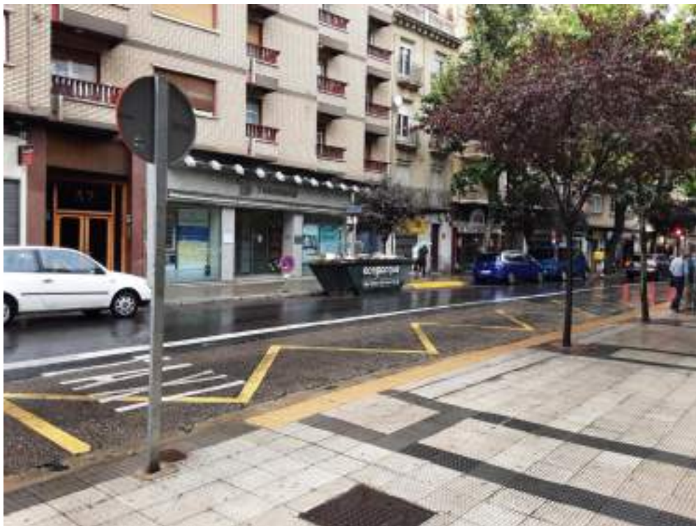
Foto del alcorque matrícula 18_136

Documento firmado digitalmente. Para verificar la validez de la firma acceda a https://www.zaragoza.es/verifica Ayuntamiento de Zaragoza - http://www.zaragoza.es