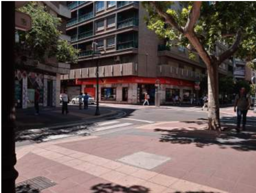
Foto del alcorque matrícula 04_313