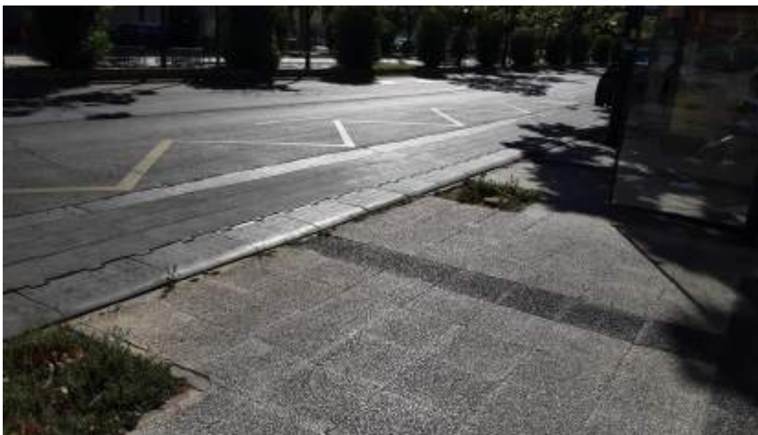
Foto del alcorque matrícula 16_8

Documento firmado digitalmente. Para verificar la validez de la firma acceda a https://www.zaragoza.es/verifica Ayuntamiento de Zaragoza - http://www.zaragoza.es