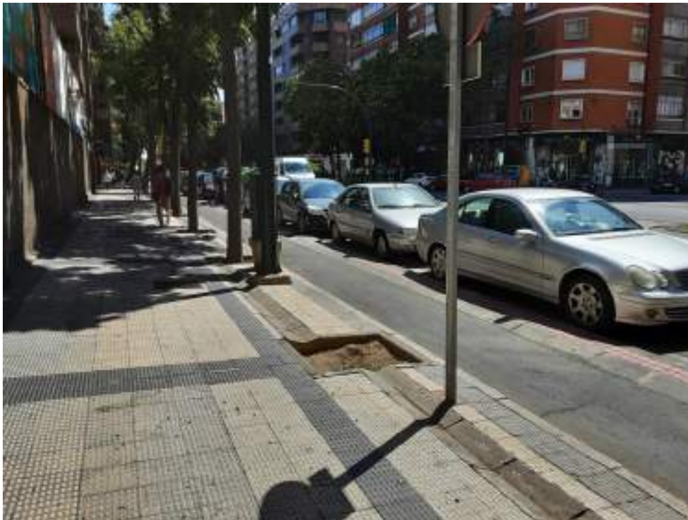
Foto del alcorque matrícula 13_179b

Documento firmado digitalmente. Para verificar la validez de la firma acceda a https://www.zaragoza.es/verifica Ayuntamiento de Zaragoza - http://www.zaragoza.es