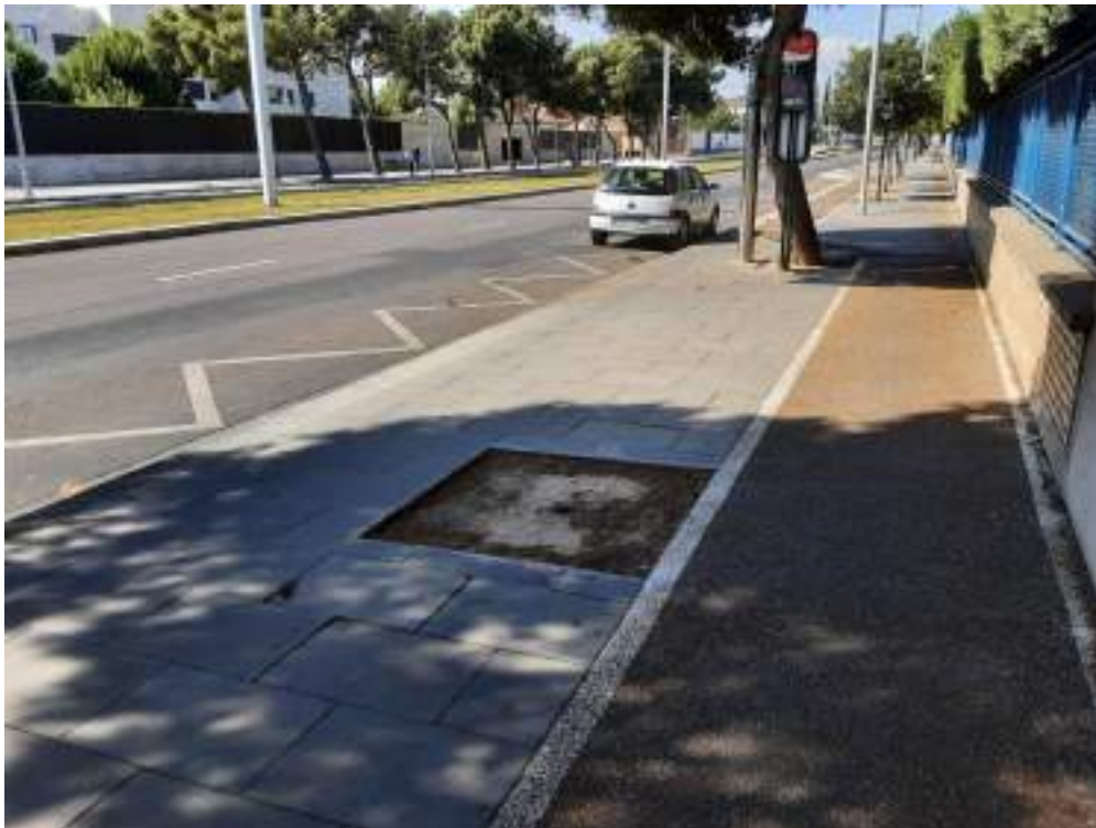
Foto del alcorque matrícula 60_7a

Documento firmado digitalmente. Para verificar la validez de la firma acceda a https://www.zaragoza.es/verifica Ayuntamiento de Zaragoza - http://www.zaragoza.es