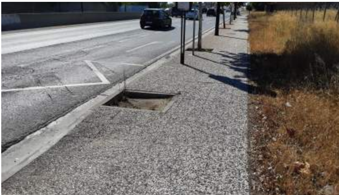
Foto del alcorque matrícula 38_983

Documento firmado digitalmente. Para verificar la validez de la firma acceda a https://www.zaragoza.es/verifica Ayuntamiento de Zaragoza - http://www.zaragoza.es