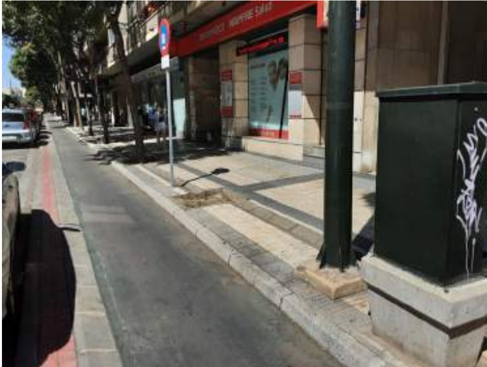
Foto del alcorque matrícula 13_179a