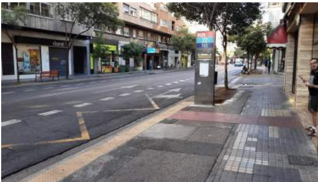
Foto del alcorque matrícula 19_28

Documento firmado digitalmente. Para verificar la validez de la firma acceda a https://www.zaragoza.es/verifica Ayuntamiento de Zaragoza - http://www.zaragoza.es