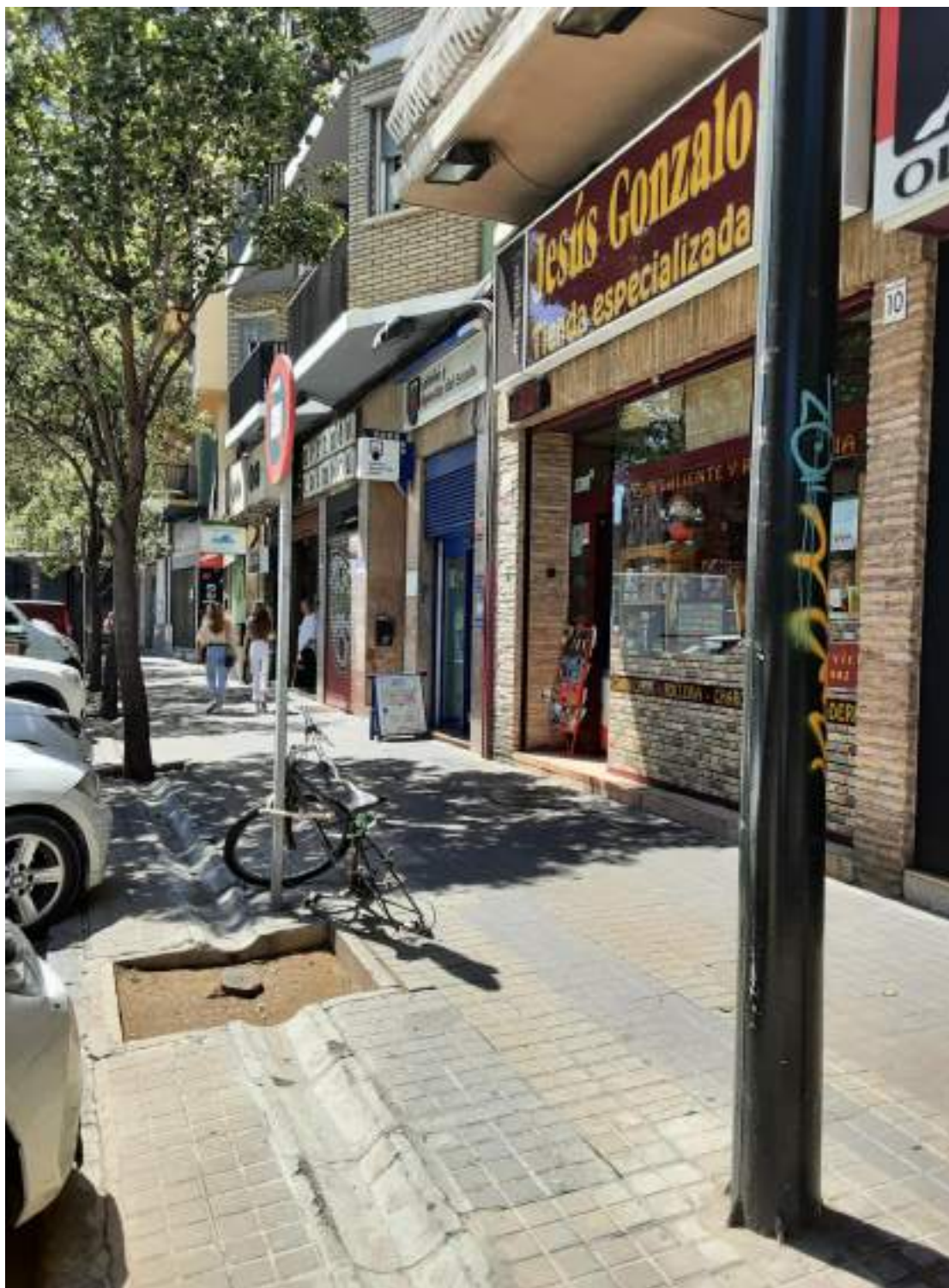
Foto del alcorque matrícula 13_60

Documento firmado digitalmente. Para verificar la validez de la firma acceda a https://www.zaragoza.es/verifica Ayuntamiento de Zaragoza - http://www.zaragoza.es