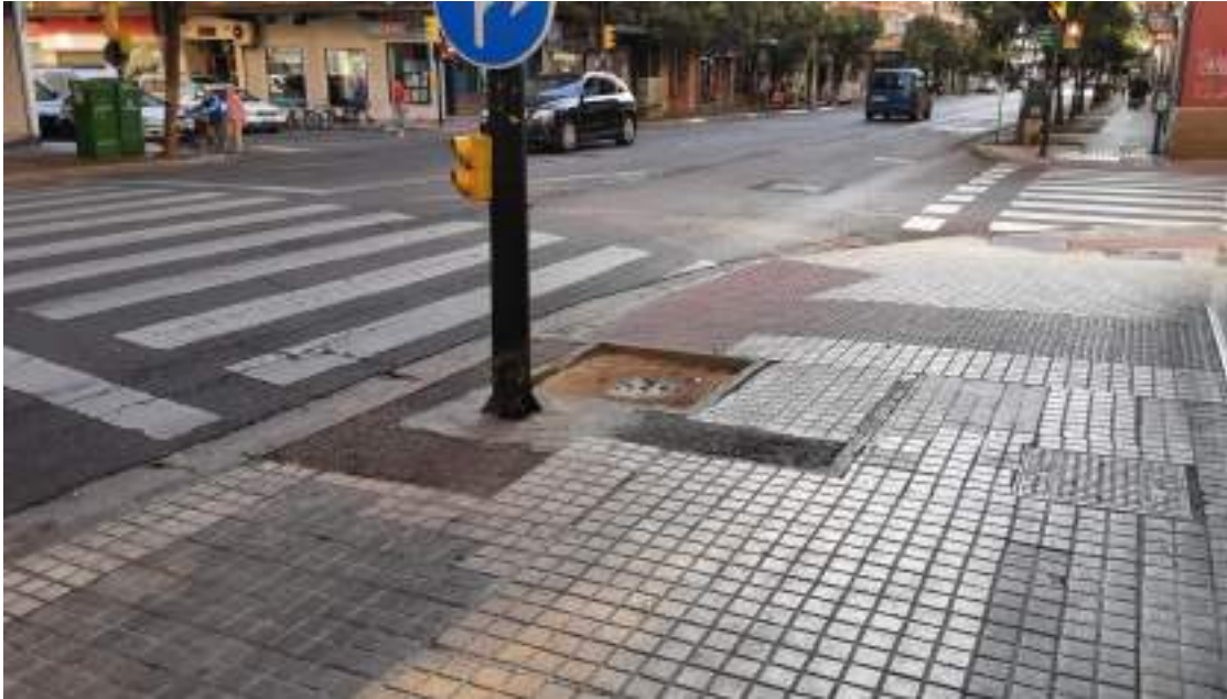
Foto del alcorque matrícula 25_138