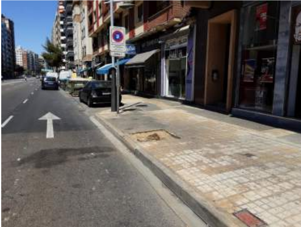
Foto del alcorque matrícula 17_83