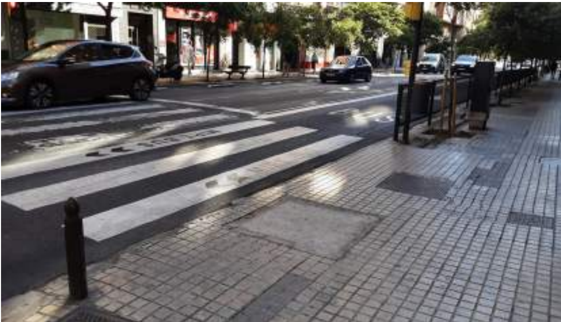
Foto del alcorque matrícula 26_38