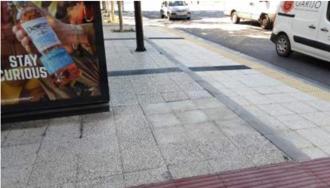
Foto del alcorque matrícula 11_403

Documento firmado digitalmente. Para verificar la validez de la firma acceda a https://www.zaragoza.es/verifica Ayuntamiento de Zaragoza - http://www.zaragoza.es