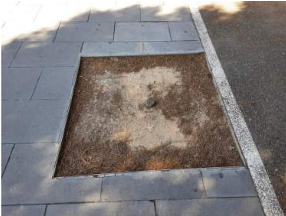
Foto del alcorque matrícula 60_7b