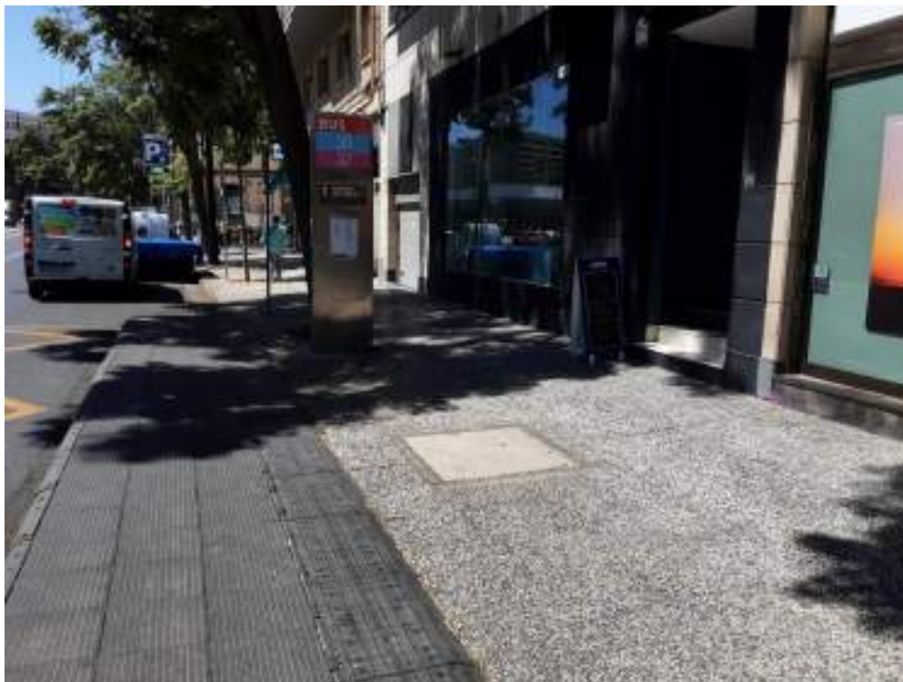
Foto del alcorque matrícula 5_527

Documento firmado digitalmente. Para verificar la validez de la firma acceda a https://www.zaragoza.es/verifica Ayuntamiento de Zaragoza - http://www.zaragoza.es