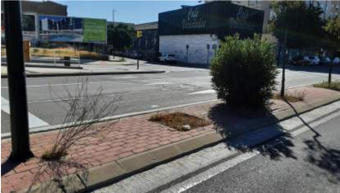
Foto del alcorque matrícula 11_474