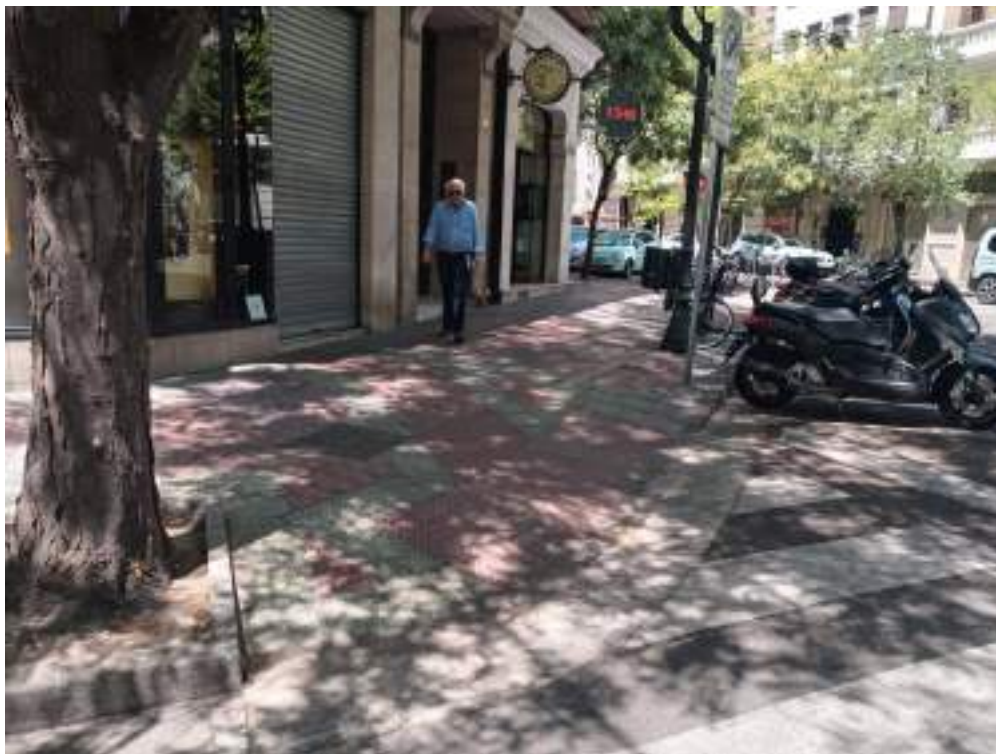
Foto del alcorque matrícula 05_233

Documento firmado digitalmente. Para verificar la validez de la firma acceda a https://www.zaragoza.es/verifica Ayuntamiento de Zaragoza - http://www.zaragoza.es