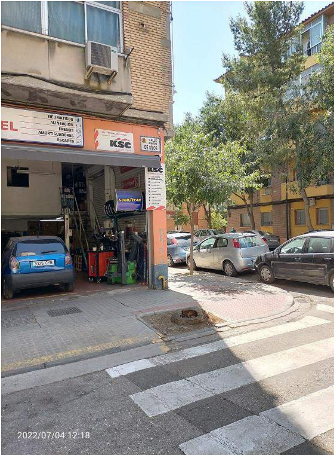
Foto del alcorque matrícula 09_472

Documento firmado digitalmente. Para verificar la validez de la firma acceda a https://www.zaragoza.es/verifica Ayuntamiento de Zaragoza - http://www.zaragoza.es