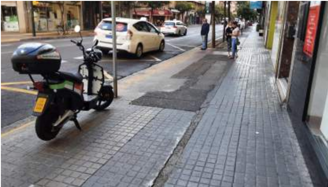
Foto del alcorque matrícula 25_154