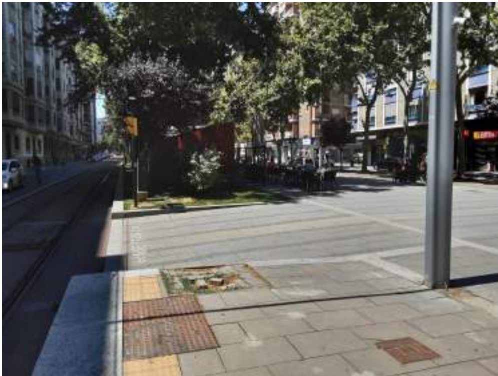
Foto del alcorque matrícula 17_240

Documento firmado digitalmente. Para verificar la validez de la firma acceda a https://www.zaragoza.es/verifica Ayuntamiento de Zaragoza - http://www.zaragoza.es