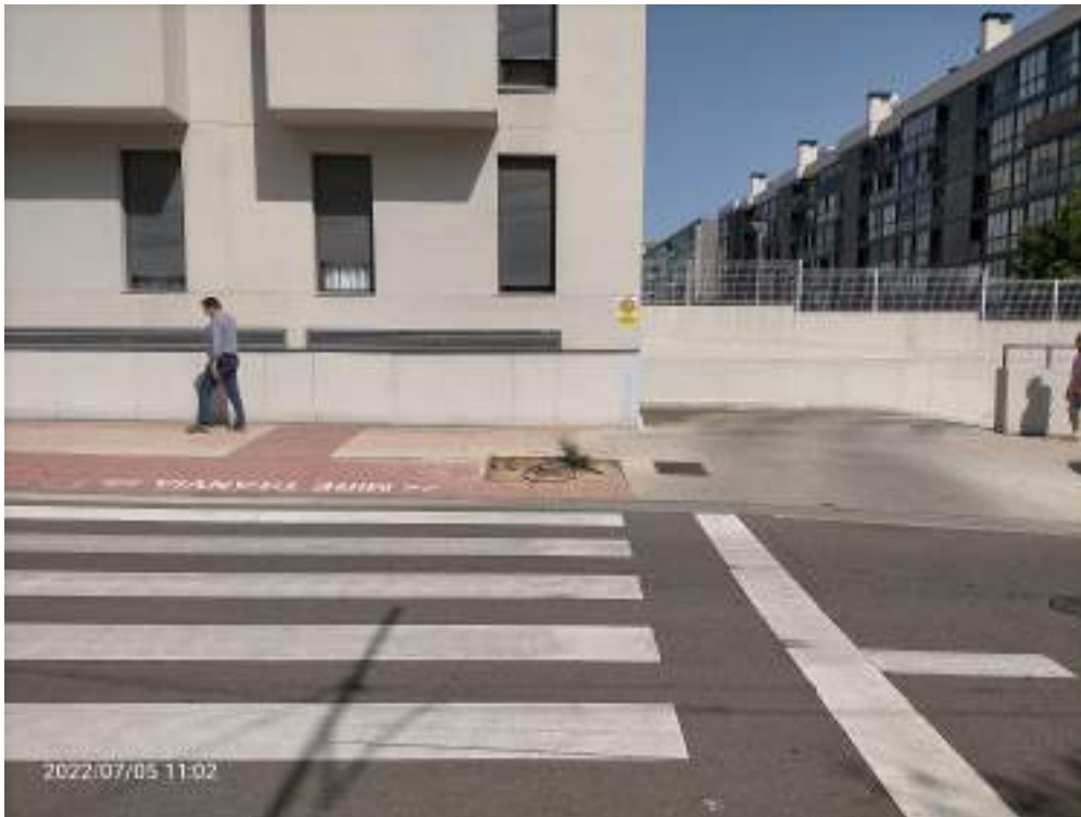
Foto del alcorque matrícula 89_5855

Documento firmado digitalmente. Para verificar la validez de la firma acceda a https://www.zaragoza.es/verifica Ayuntamiento de Zaragoza - http://www.zaragoza.es