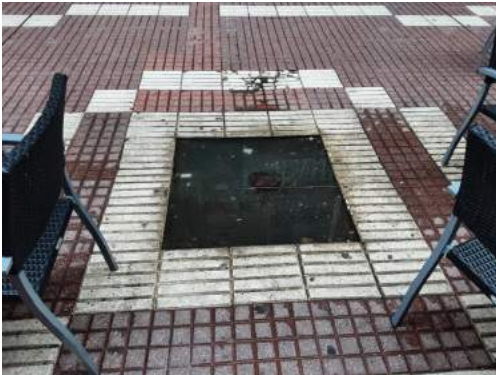
Foto del alcorque matrícula 04_378