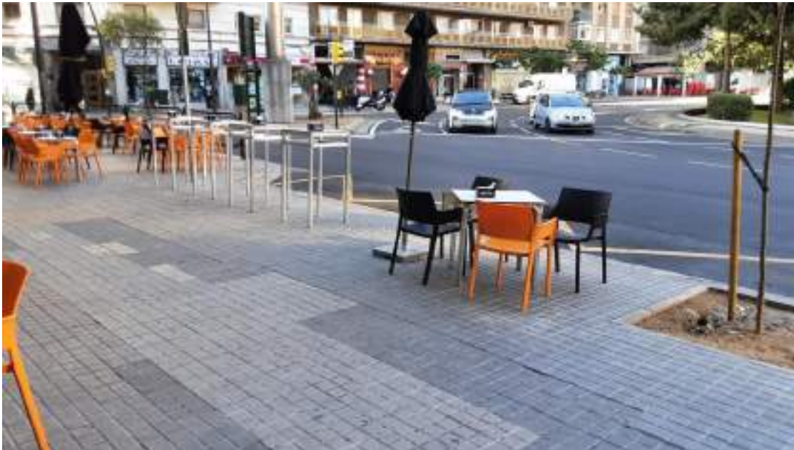
Foto del alcorque matrícula 19_46