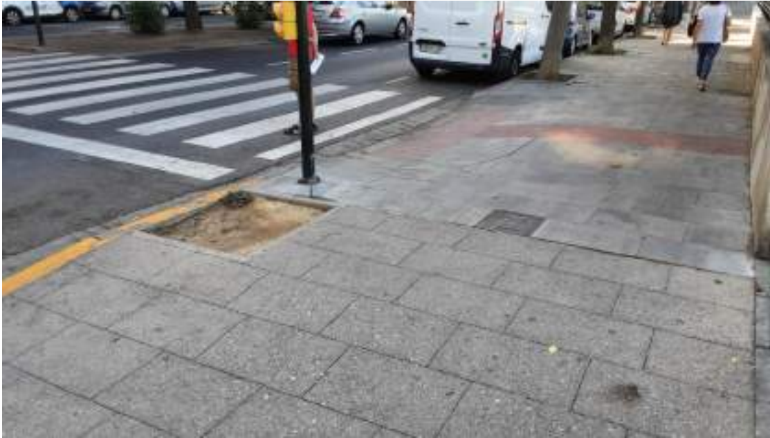
Foto del alcorque matrícula 22_275