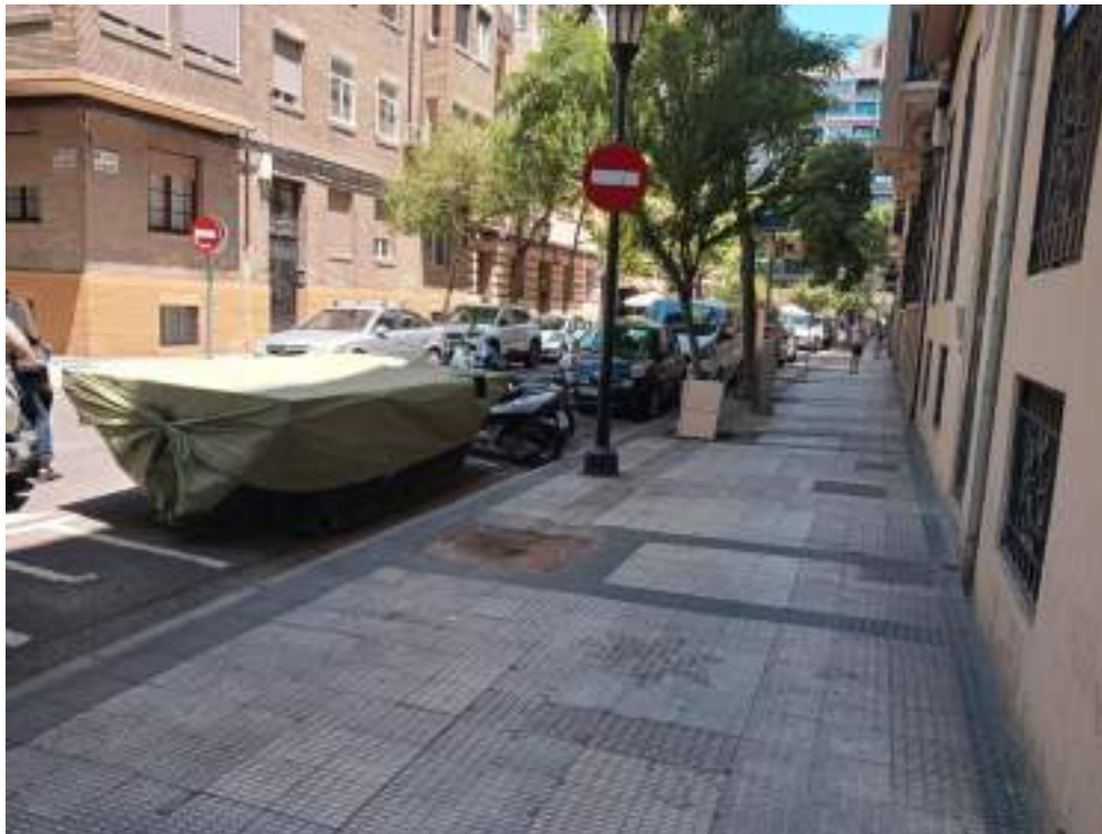
Foto del alcorque matrícula 18_211

Documento firmado digitalmente. Para verificar la validez de la firma acceda a https://www.zaragoza.es/verifica Ayuntamiento de Zaragoza - http://www.zaragoza.es