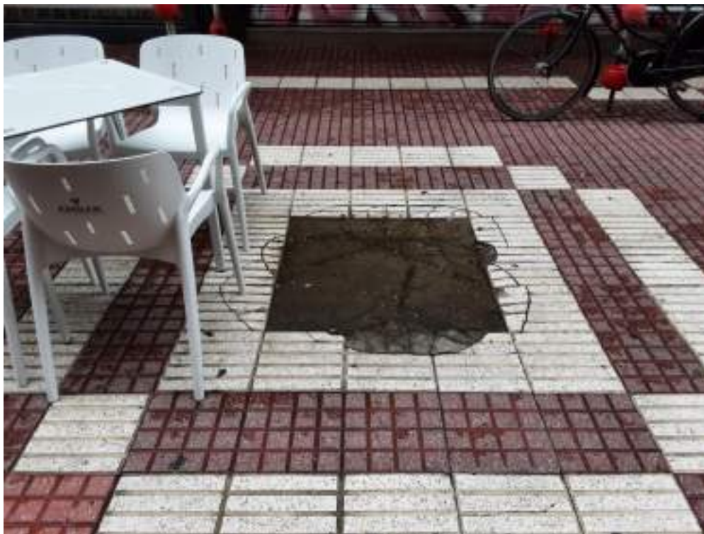
Foto del alcorque matrícula 04_375

Documento firmado digitalmente. Para verificar la validez de la firma acceda a https://www.zaragoza.es/verifica Ayuntamiento de Zaragoza - http://www.zaragoza.es