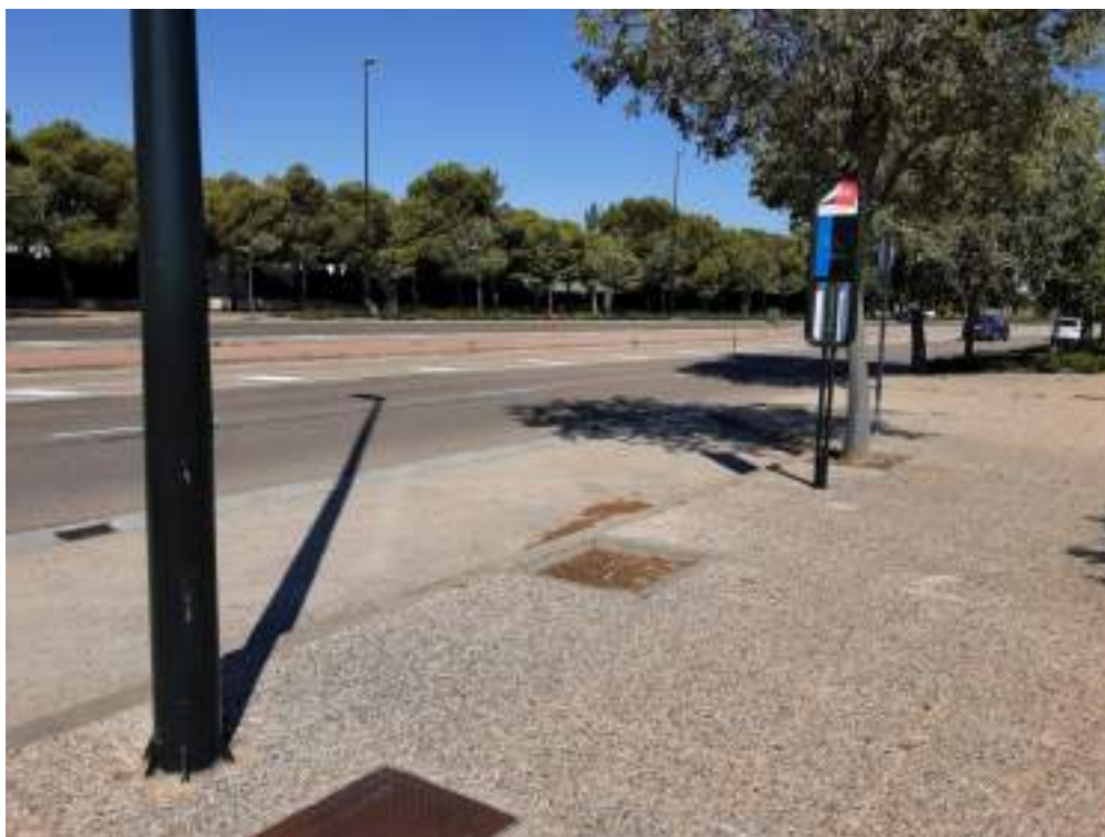
Foto del alcorque matrícula 60_285

Documento firmado digitalmente. Para verificar la validez de la firma acceda a https://www.zaragoza.es/verifica Ayuntamiento de Zaragoza - http://www.zaragoza.es