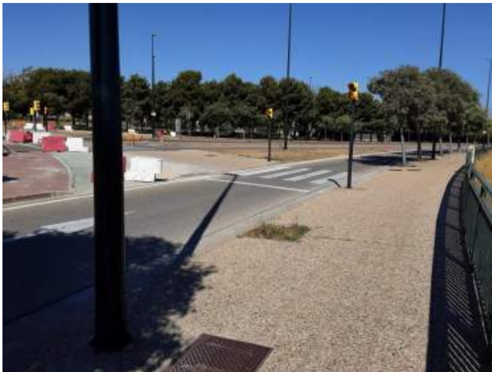
Foto del alcorque matrícula 60_269