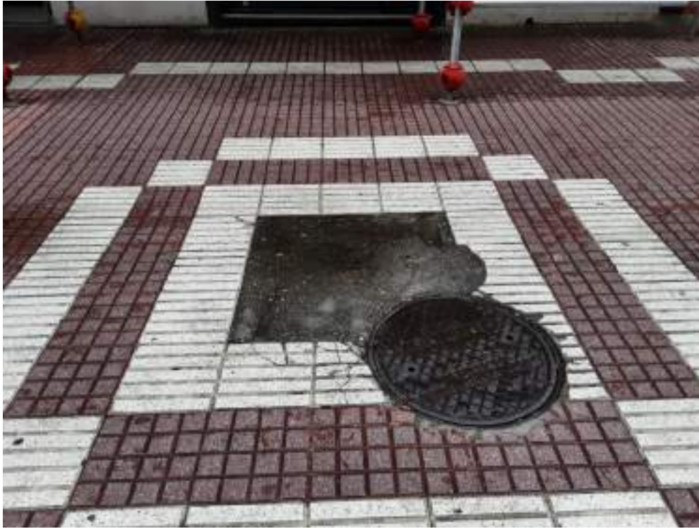
Foto del alcorque matrícula 04_376