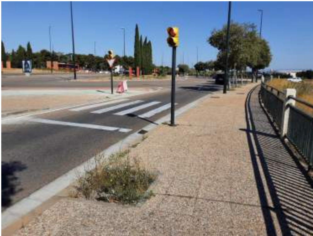
Foto del alcorque matrícula 60_255

Documento firmado digitalmente. Para verificar la validez de la firma acceda a https://www.zaragoza.es/verifica Ayuntamiento de Zaragoza - http://www.zaragoza.es