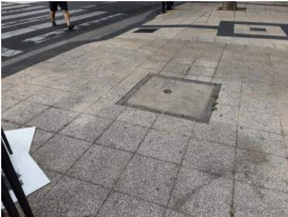
Foto del alcorque matrícula 45_893

Documento firmado digitalmente. Para verificar la validez de la firma acceda a https://www.zaragoza.es/verifica Ayuntamiento de Zaragoza - http://www.zaragoza.es