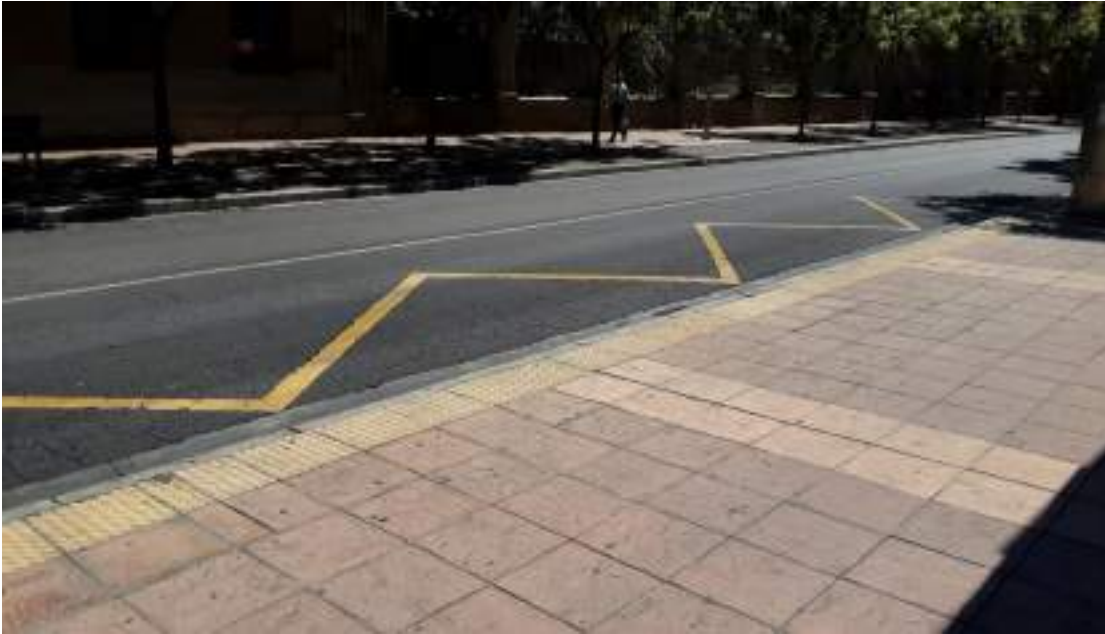
Foto del alcorque matrícula 11_914