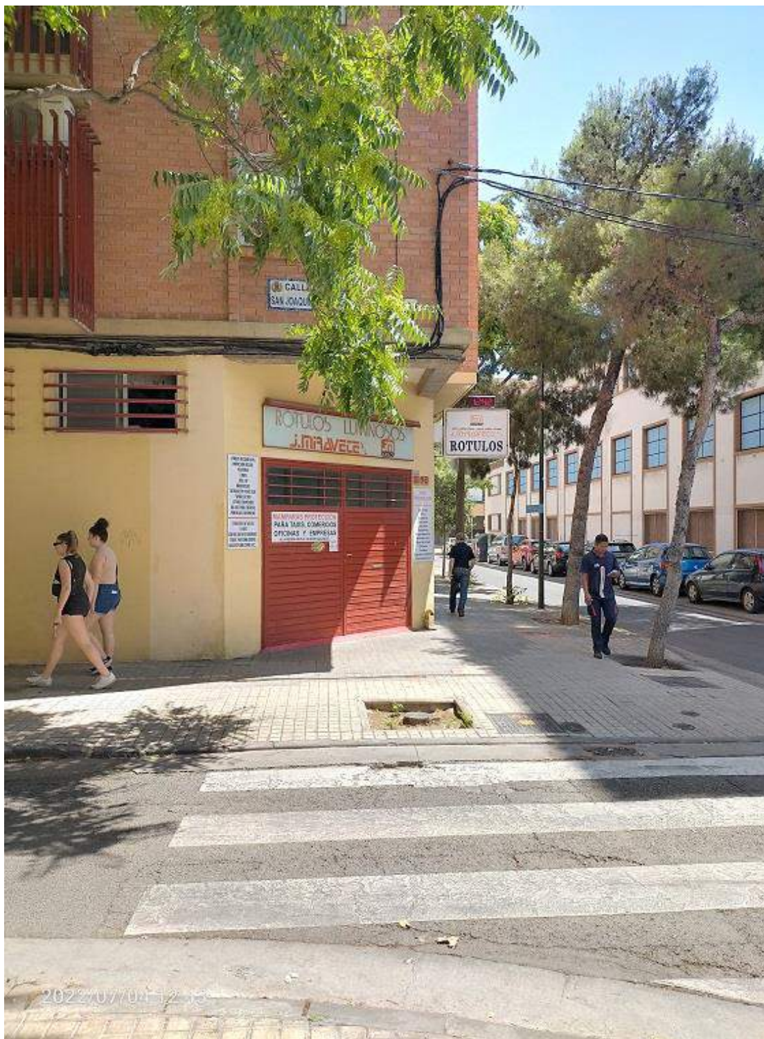
Foto del alcorque matrícula 10_497

Documento firmado digitalmente. Para verificar la validez de la firma acceda a https://www.zaragoza.es/verifica