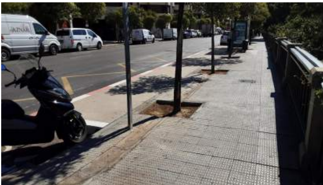
Foto del alcorque matrícula 30_123