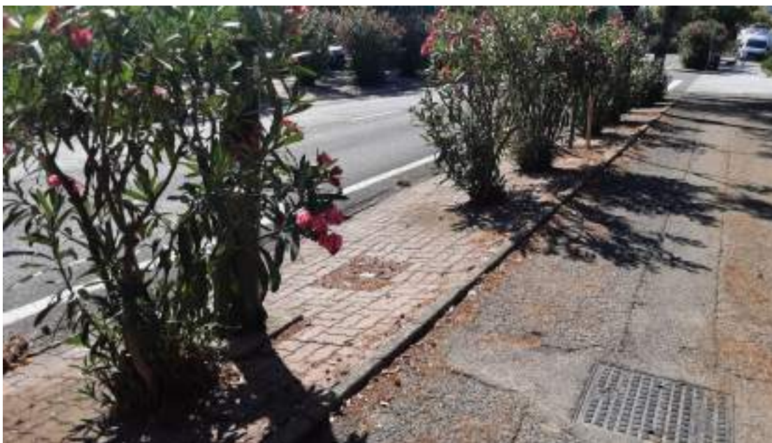
Foto del alcorque matrícula 30_202

Documento firmado digitalmente. Para verificar la validez de la firma acceda a https://www.zaragoza.es/verifica Ayuntamiento de Zaragoza - http://www.zaragoza.es