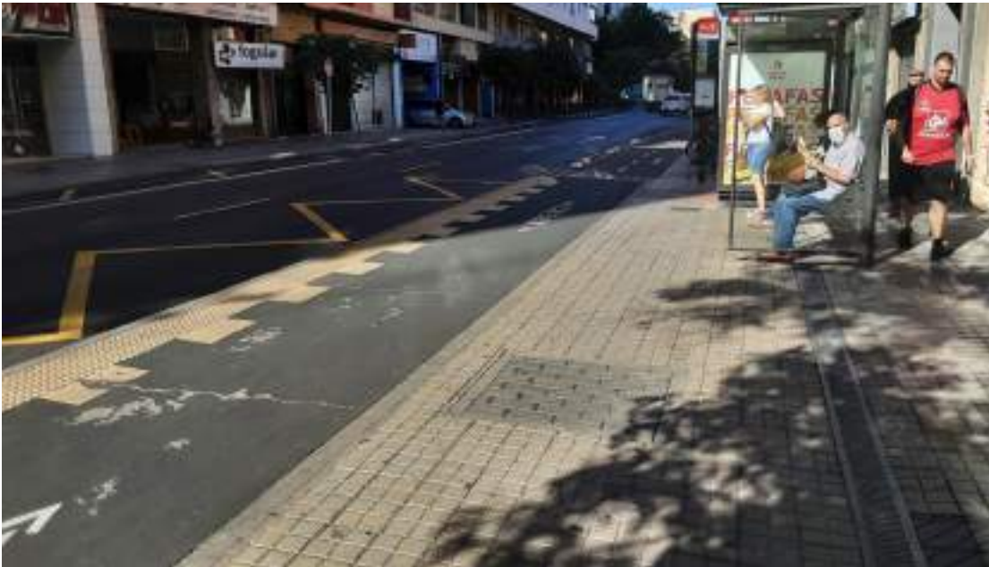
Foto del alcorque matrícula 25_22

Documento firmado digitalmente. Para verificar la validez de la firma acceda a https://www.zaragoza.es/verifica Ayuntamiento de Zaragoza - http://www.zaragoza.es