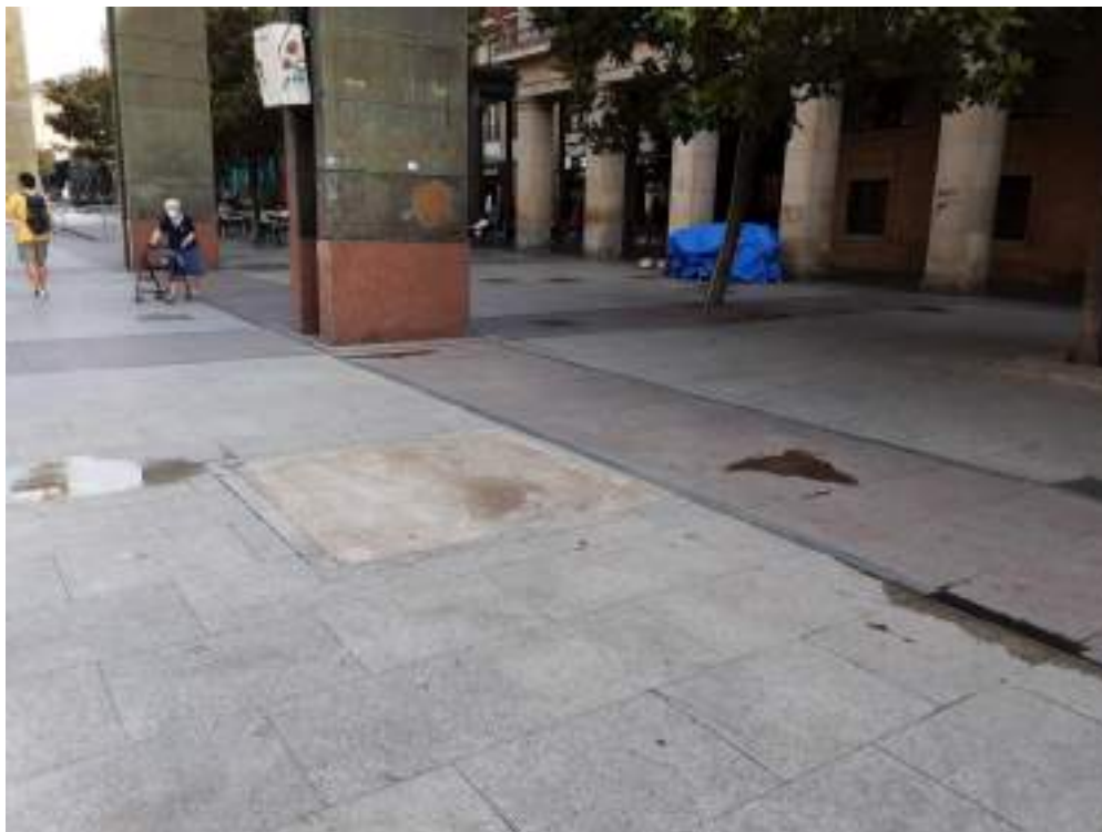
Foto del alcorque matrícula 1_809a