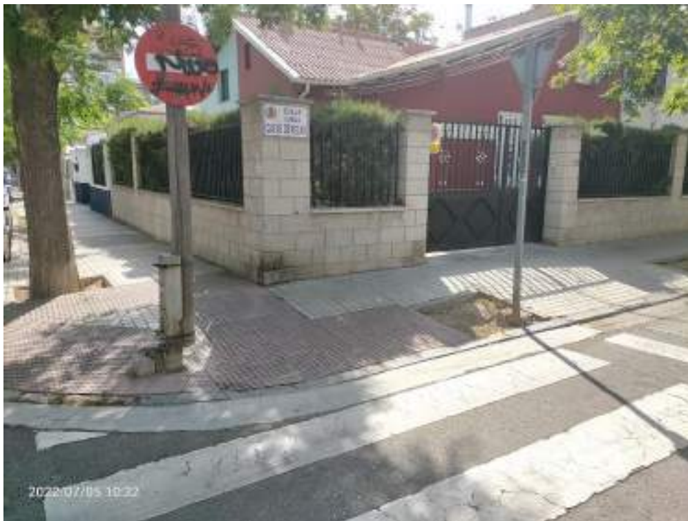
Foto del alcorque matrícula 24_620

Documento firmado digitalmente. Para verificar la validez de la firma acceda a https://www.zaragoza.es/verifica Ayuntamiento de Zaragoza - http://www.zaragoza.es