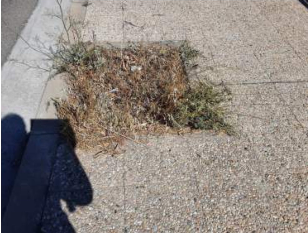
Foto del alcorque matrícula 60_220b