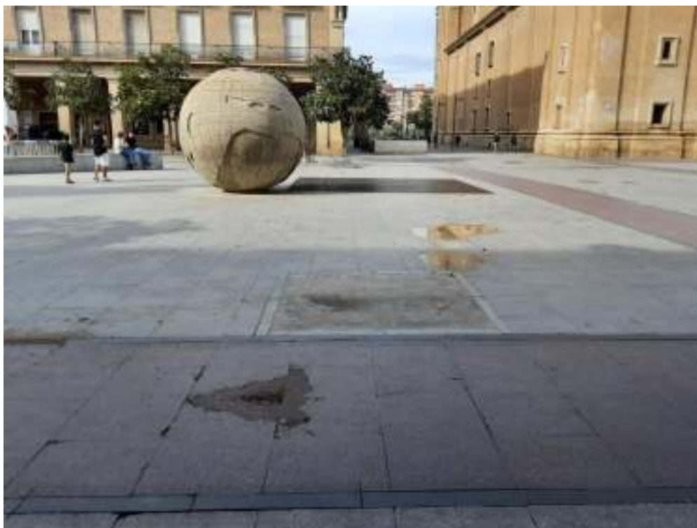
Foto del alcorque matrícula 1_809b

Documento firmado digitalmente. Para verificar la validez de la firma acceda a https://www.zaragoza.es/verifica Ayuntamiento de Zaragoza - http://www.zaragoza.es