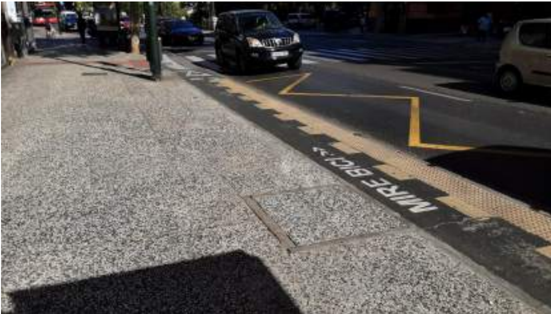
Foto del alcorque matrícula 33_395

Documento firmado digitalmente. Para verificar la validez de la firma acceda a https://www.zaragoza.es/verifica Ayuntamiento de Zaragoza - http://www.zaragoza.es