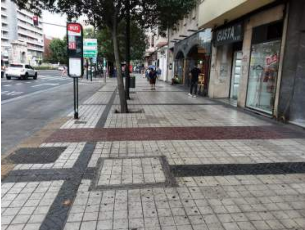
Foto del alcorque matrícula 18_498