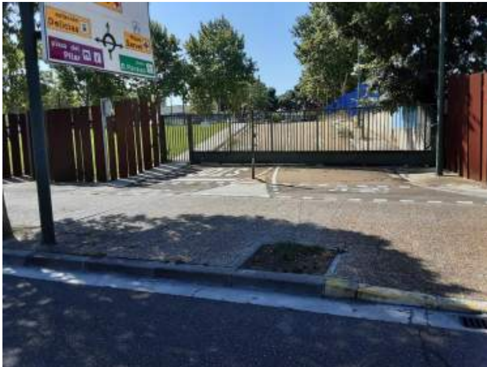
Foto del alcorque matrícula 58_239b