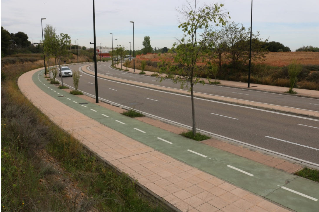
Punto de acceso