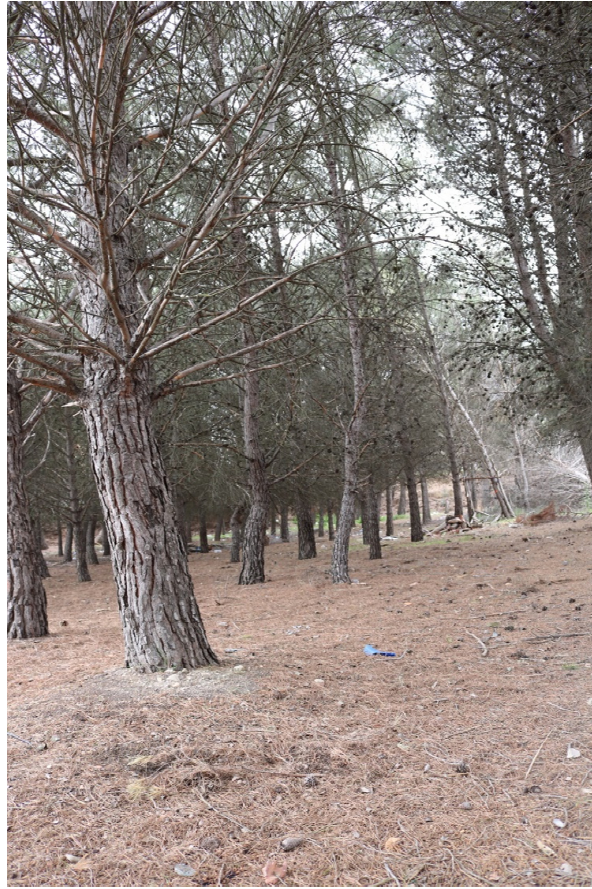
Ejemplo del estado del pinar. Ejemplo de residuos.