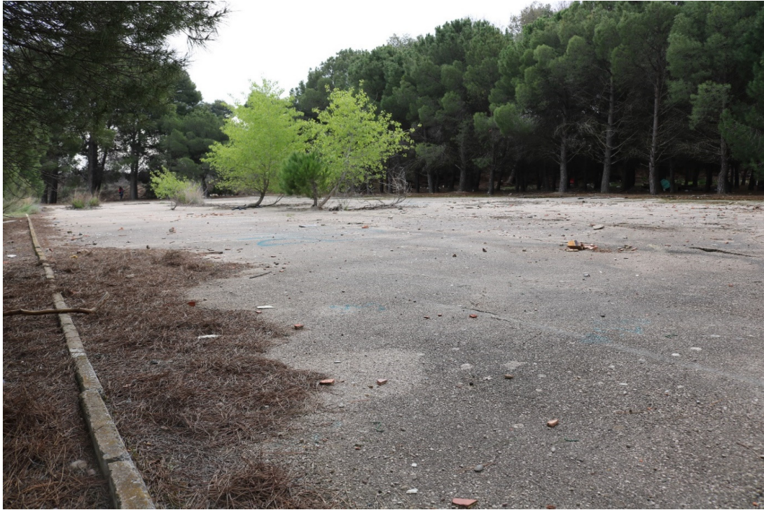
Pista deportiva y vistas del pinar