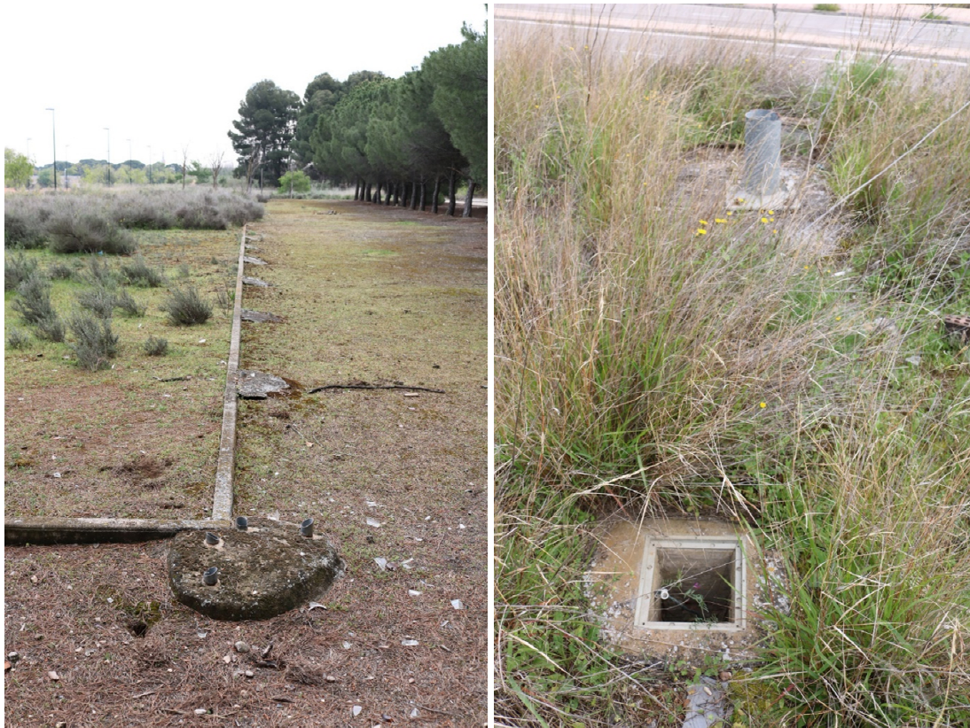
Vista de superficie delimitada por bordillo, con restos de vallado y antiguo alumbrado.

Documento firmado digitalmente. Para verificar la validez de la firma acceda a https://www.zaragoza.es/verifica Ayuntamiento de Zaragoza - http://www.zaragoza.es