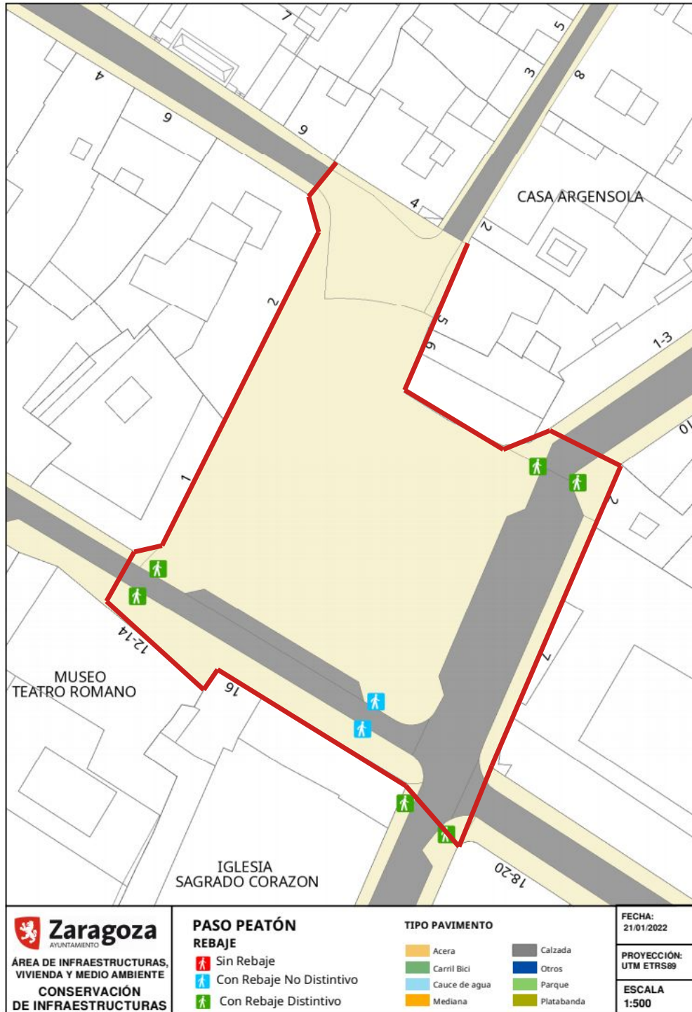
Entorno de la Plaza San Pedro Nolasco y zona de proyecto

Documento firmado digitalmente. Para verificar la validez de la firma acceda a https://www.zaragoza.es/verifica