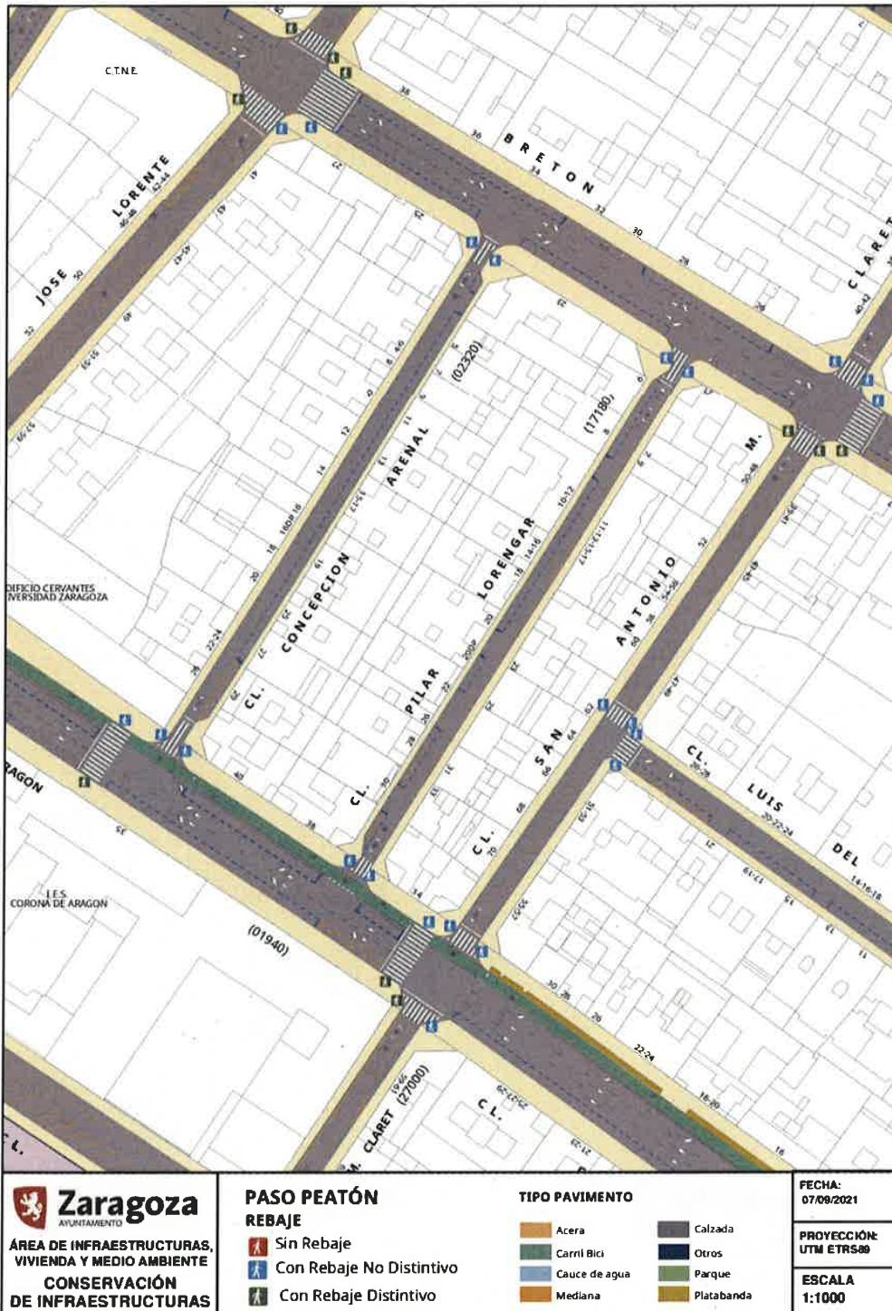
Entorno de las Calles Pilar Lorengar y Concepción Arenal

Documento firmado digitalmente. Para verificar la validez de la firma acceda a https://www.zaragoza.es/verifica Ayuntamiento de Zaragoza - http://www.zaragoza.es