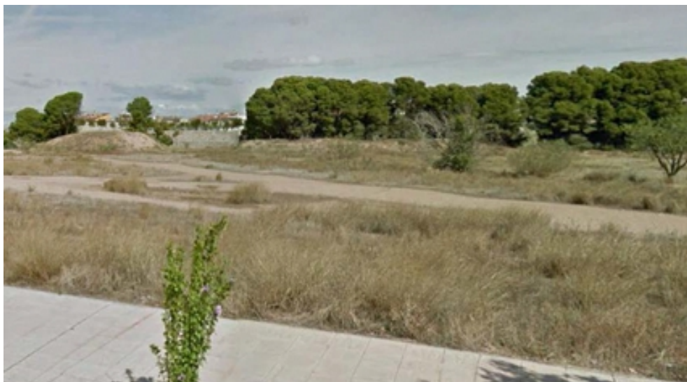
Foto 3. -Vista general de la parcela de intervención entre Canal Imperial y calle Juan Bautista de La Salle.