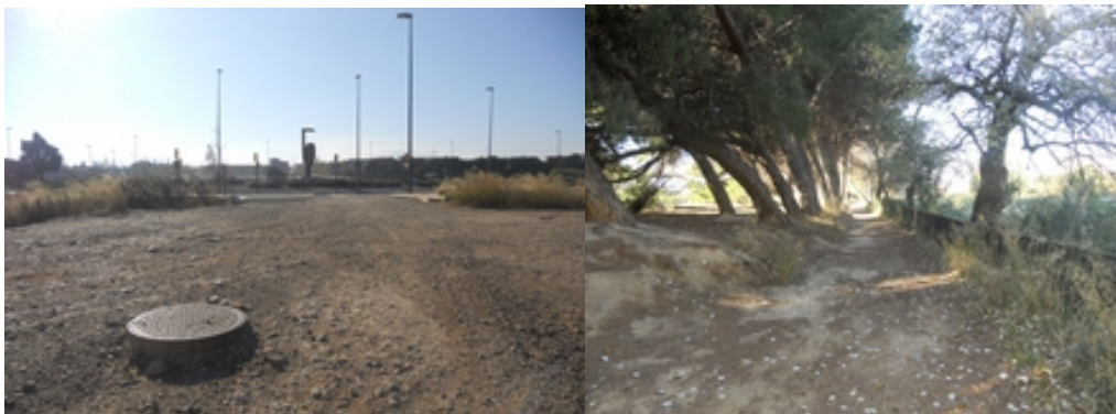
Foto 1 y 2. -Acceso desde el Sur a través de la rotonda del futuro vial y Vista del camino existente en la margen derecha del Canal