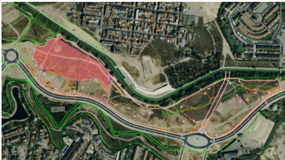
Figura 1.- Ámbito del que se dispone de topografía previa