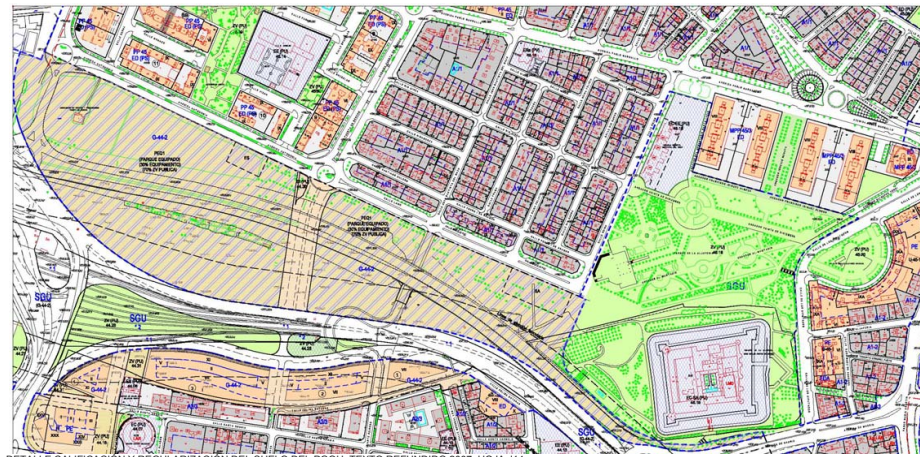
DETALLE CALIFICACIÓN Y REGULIZACIÓN DEL SUELO DEL PGOU, TEXTO REFUNDIDO 2007, HOJA J14. MILLA DIGITAL CALIFICADA COMO PARQUE EQUIPADO CON 70% DE SUPERFICIE PARA ZONAS VERDES Y EL 30% PARA EQUIPAMIENTOS