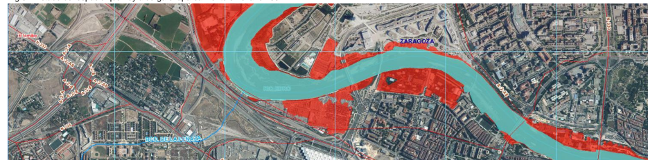
Fig.03: Riesgo de inundabilidad. Periodo de Retorno de 10años