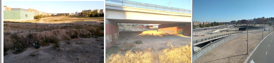
VISTA DE LA MANZANA MILLA DIGITAL DESDE EL EDIFICIO ETOPIA