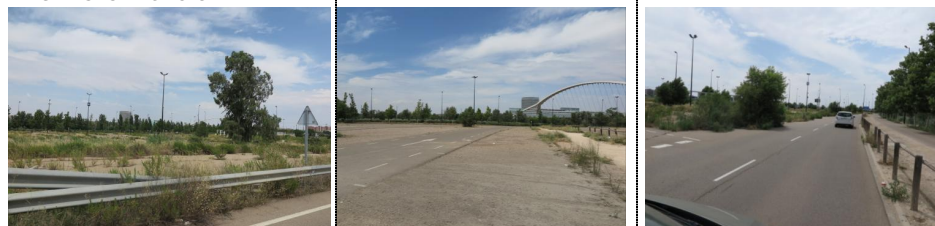
Fig.03: Estado actual del aparcamiento. La falta de uso y el tipo de pavimentación basado en sistemas permeables ha favorecido la recolonización de la vegetación.