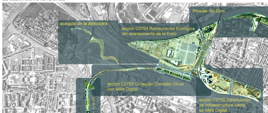
Fig.01: relación de acciones para la formación de la Red Verde urbana de conexión entre barrios y éstos con su entorno natural