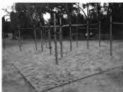
IDE Street Workout Parque José Antonio Labordeta