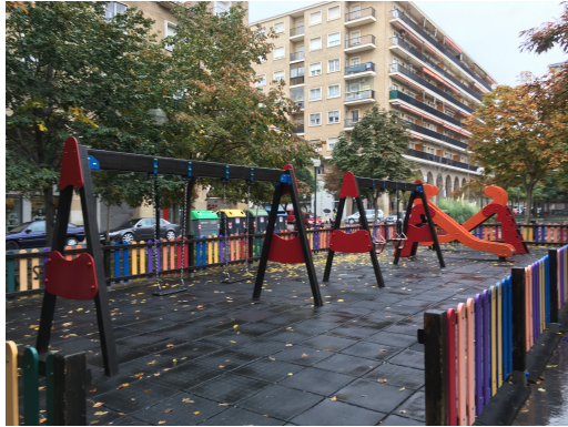
Fotografías área contigua

Documento firmado digitalmente. Para verificar la validez de la firma acceda a null/VerificacionAction.action Ayuntamiento de Zaragoza - http://www.zaragoza.es