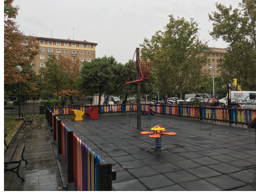
Fotografías área a remodelar