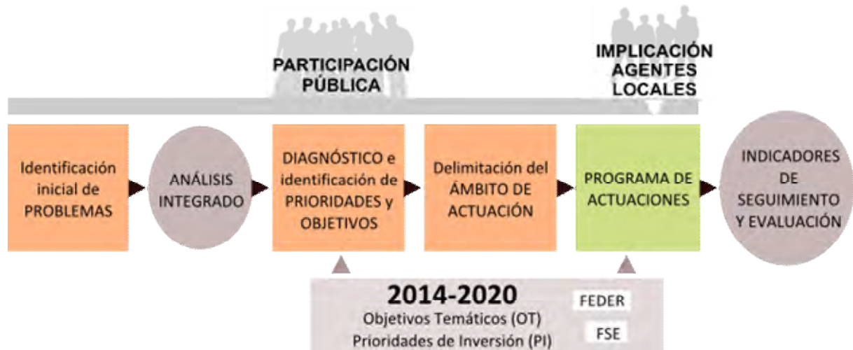
Figura 1. Diagrama orientativo de desarrollo de la estrategia integrada.

En este contexto, conviene subrayar aquellos principios que orientan el referido artículo 7 del Reglamento FEDER y que deberían guiar la elaboración de las estrategias integradas de desarrollo urbano sostenible: