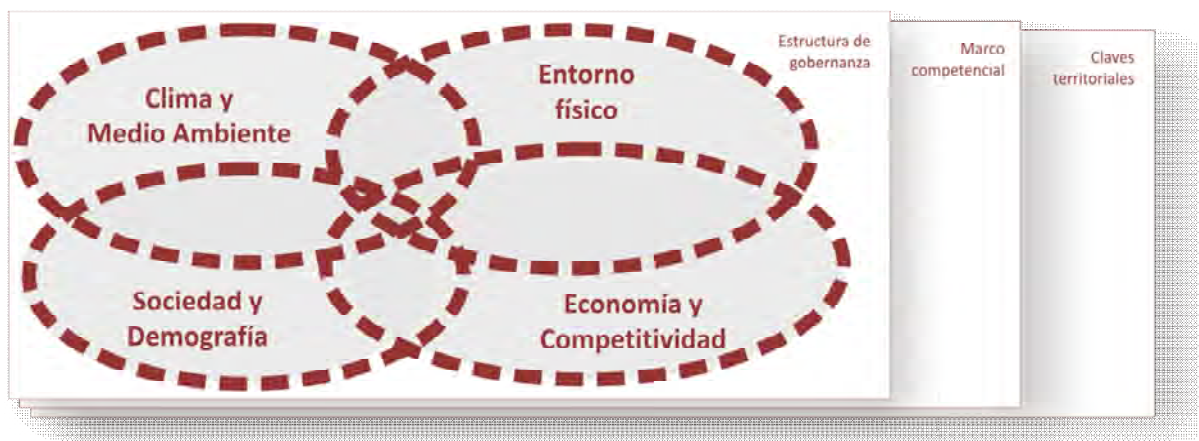
Figura 2. Principales ámbitos del análisis integrado.

El objeto de este análisis es conocer en profundidad las principales debilidades y amenazas que afectan al entorno urbano así como sus fortalezas, y los principales factores y claves territoriales de su desarrollo para abordar los múltiples retos a los que se enfrentan las áreas urbanas, transformando éstos en oportunidades.