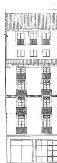
ALZADO "A" (PZA. ESPAÑA)

INTERVENCIÓNES PERMITIDAS Y ELEMENTOS A CONSERVAR.