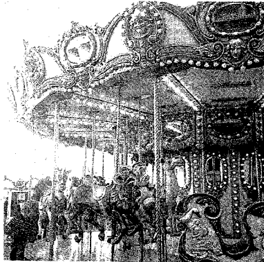
► 'Tiovivo eterno', de @mariaserberben.