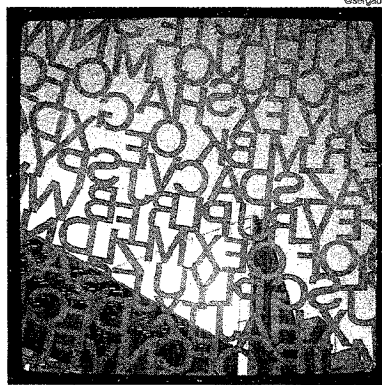
► 'Juegos de palabras', de @sergaus.