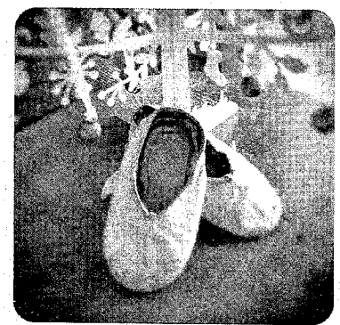
► 'Esperando a los Magos', de @ello.