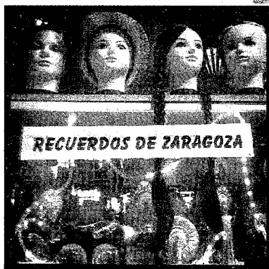
► 'Recuerdos de Zaragoza', de @abru.