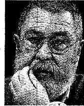
Cándido Méndez

SEVILLA. El secretario general de UGT, Cándido Méndez, manifestó ayer que tienen «la voluntad» de alcanzar un acuerdo sobre la reforma laboral para presentarlo la próxima semana antes del Consejo de Ministros, aunque debe ser «equilibrado y razonable». Méndez explicó en una entrevista del programa 'La calle de en medio' de Canal Sur Radio que se han agotado «los márgenes que razonablemente se pueden alcanzar» y que hay una serie de reivindicaciones por parte de la patronal que rebasan «de una manera excesiva cualquier tipo de límites», por lo que espera que rebajen esas pretensiones. Aunque las posiciones entre las partes siguen alejadas sobre todo en materia de contratos y despidos, parece más cercana la posibilidad de alcanzar un acuerdo.