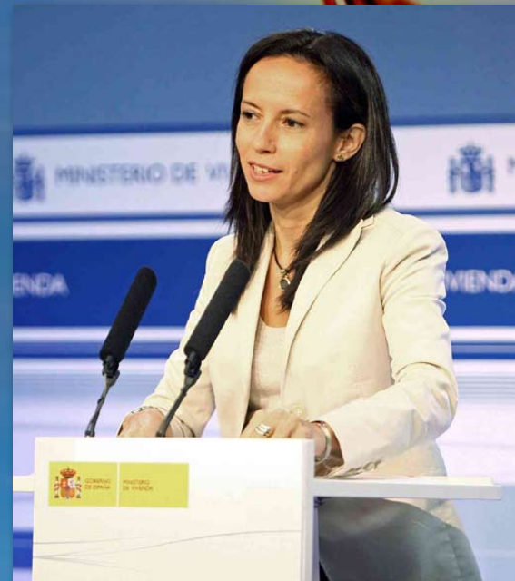
Beatriz Corredor, archive