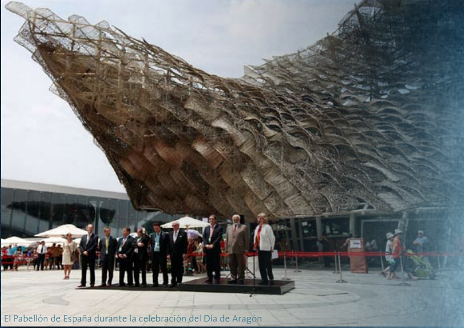
El Pabellón de España durante la celebración del Día de Aragón