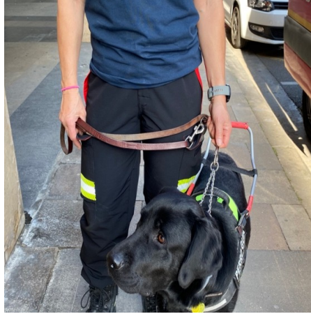
Foto 3. Zonas de Sujeción