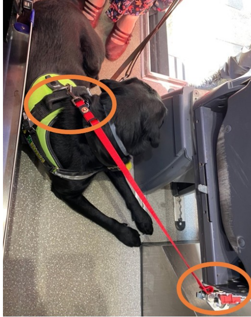
Foto 5. Sujeción en cabina asistencial