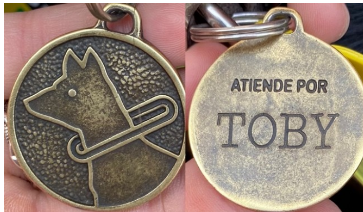
Foto 1. Placa identificativa perro guía

Este documento contiene datos no especialmente protegidos