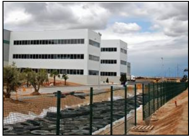
Figura 9. Depósito de Laminación-Infiltración de pluviales relleno con neumáticos usados. Zaragoza.

En síntesis, se implanta una alternativa innovadora y medioambientalmente viable a la gestión tradicional del agua de lluvia, convirtiendo lo que inicialmente era un problema en una oportunidad de realizar una Gestión Eficiente del Agua, y convirtiendo un desecho a tratar, en un recurso natural que proporciona ahorros en el consumo de agua potable y energía.