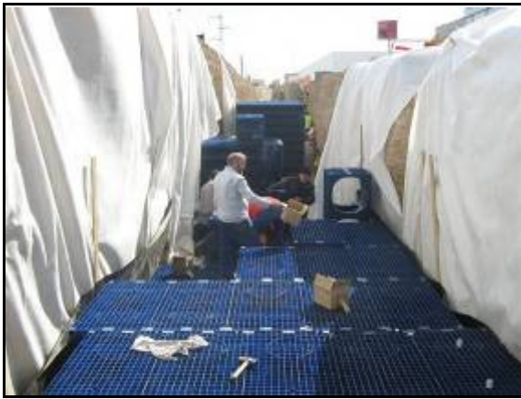
Figura 8. Depósito de Reutilización de pluviales formado por elementos reticulares. Zaragoza.

La construcción se realiza utilizando nuevos materiales que se adaptan a las necesidades particulares del proyecto: se emplean estructuras modulares reticulares de polipropileno (reciclables) que envueltas con una lámina impermeable conforman el depósito de reutilización, y ruedas de neumáticos usados (reciclados) que envueltas en geotextil crean el espacio necesario para la retención temporal del agua y permiten la infiltración del agua en el terreno. De este modo, se rellena la zanja excavada hasta la cota del pavimento adyacente, y sobre un geocompuesto de refuerzo se vierte una capa de gravas como acabado superficial, que además permite el paso del agua a su través y no genera escorrentía.