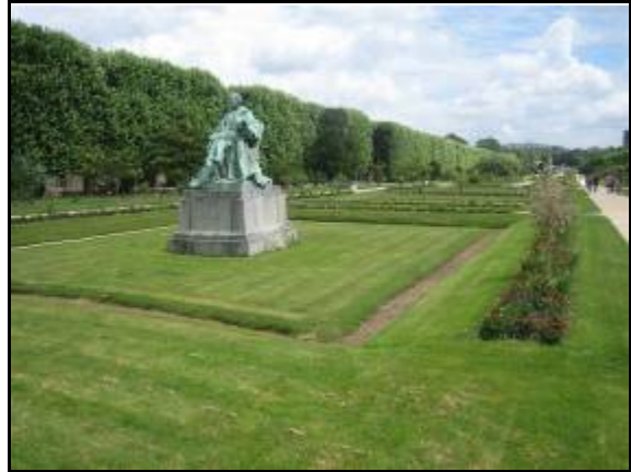
Figura 6. Depósito de Detención-Infiltración. París.

Contemplar el agua de lluvia como un recurso natural, permite realizar una gestión hídrica más eficiente, contando con el aprovechamiento de las aguas pluviales, bien para su reutilización o para su infiltración al subsuelo.