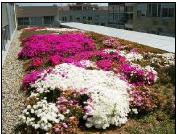
Figura 3. Cubierta Ecológica. Consell Comarcal. Barcleona.

Por su parte, se consideran medidas estructurales aquellas que gestionan la escorrentía contaminada mediante actuaciones que contengan, en mayor o menor grado, algún elemento constructivo, o supongan la adopción de criterios urbanísticos ad hoc . Las medidas estructurales más utilizadas son: Cubiertas Ecológicas ( Green Roofs ), Superficies Permeables ( Porous/Permeable Paving ), Franjas Filtrantes ( Filter Strips ), Pozos y Zanjas de Infiltración ( Soakaways & Infiltration Trenches ), Drenes Filtrantes ( Filter Drains ), Cunetas Verdes ( Swales ), Depósitos de Infiltración ( Infiltration Basins ), Depósitos de Detención ( Detention Basins ), Estanques de Retención ( Retention Ponds ) y Humedales ( Wetlands ).