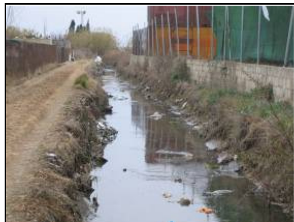
Figuras 1 y 2. Problemas de inundaciones y contaminación asociados al drenaje convencional.