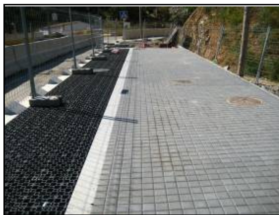
Figura 11. Franja de captación y transporte de las escorrentías en la Urb. Torre Baró, Barcelona.

Con la introducción de la red de SUDS en el ámbito de proyecto se cumple el objetivo principal de aprovechamiento de las aguas pluviales para riego y/o limpieza viaria, reduciendo de este modo tanto el consumo de agua potable en la ciudad como el volumen de agua a transportar y depurar por el sistema unitario municipal.