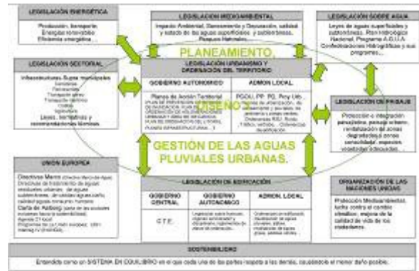
Figura 7. Implicaciones del Urbanismo y la Ordenación del Territorio en la Gestión de Aguas Pluviales Urbanas (Valls, G. y Perales, S., 2008).

Como se ha visto, ya está ampliamente reconocido a nivel mundial que se necesita un cambio en la manera de gestionar el agua de lluvia en entornos urbanos. Para que España pase a formar parte del grupo de países que están convencidos de que el camino a seguir es la implantación de la filosofía de los SUDS, se precisa un esfuerzo coordinado de todos los entes implicados (ciudadanía, administraciones, universidades, empresas, etc.).