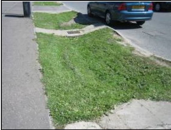
Figura 5. Cuneta verde. Dundee. Escocia.