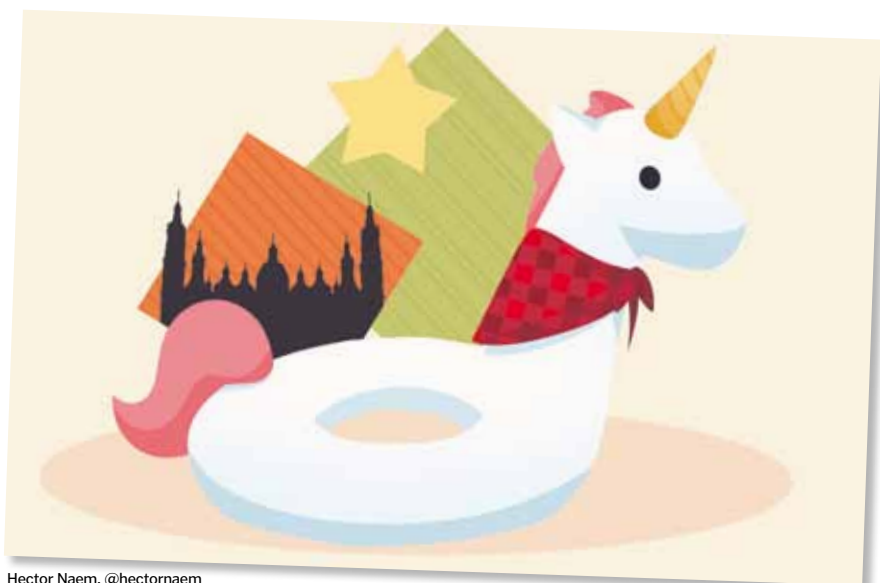
Hector Naem. @hectornaem

22/07/2019-26/07/2019. Lugar: Barbastro. Inscripciones hasta: 15/07/2019.