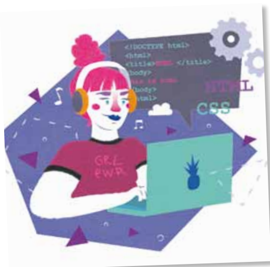
Elisa Sancho. @elisasancho_

01/07/2019-31/07/2019. Lugar: Centro Cultural Ánade. Zaragoza. Precio: 300€. Inscripciones hasta: 30/06/2018