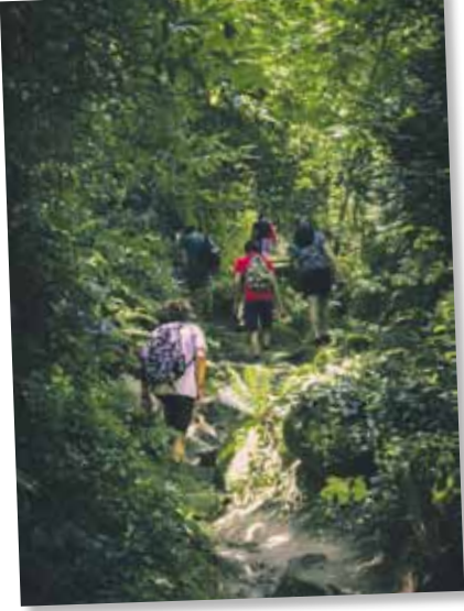
Íñigo Franco Gonzalo. @ifg_12

01/04/2019-30/12/2019. Lugar: Jaca. Precio: 250 € (4 días). Inscripciones hasta: 2 semanas antes del curso programado.