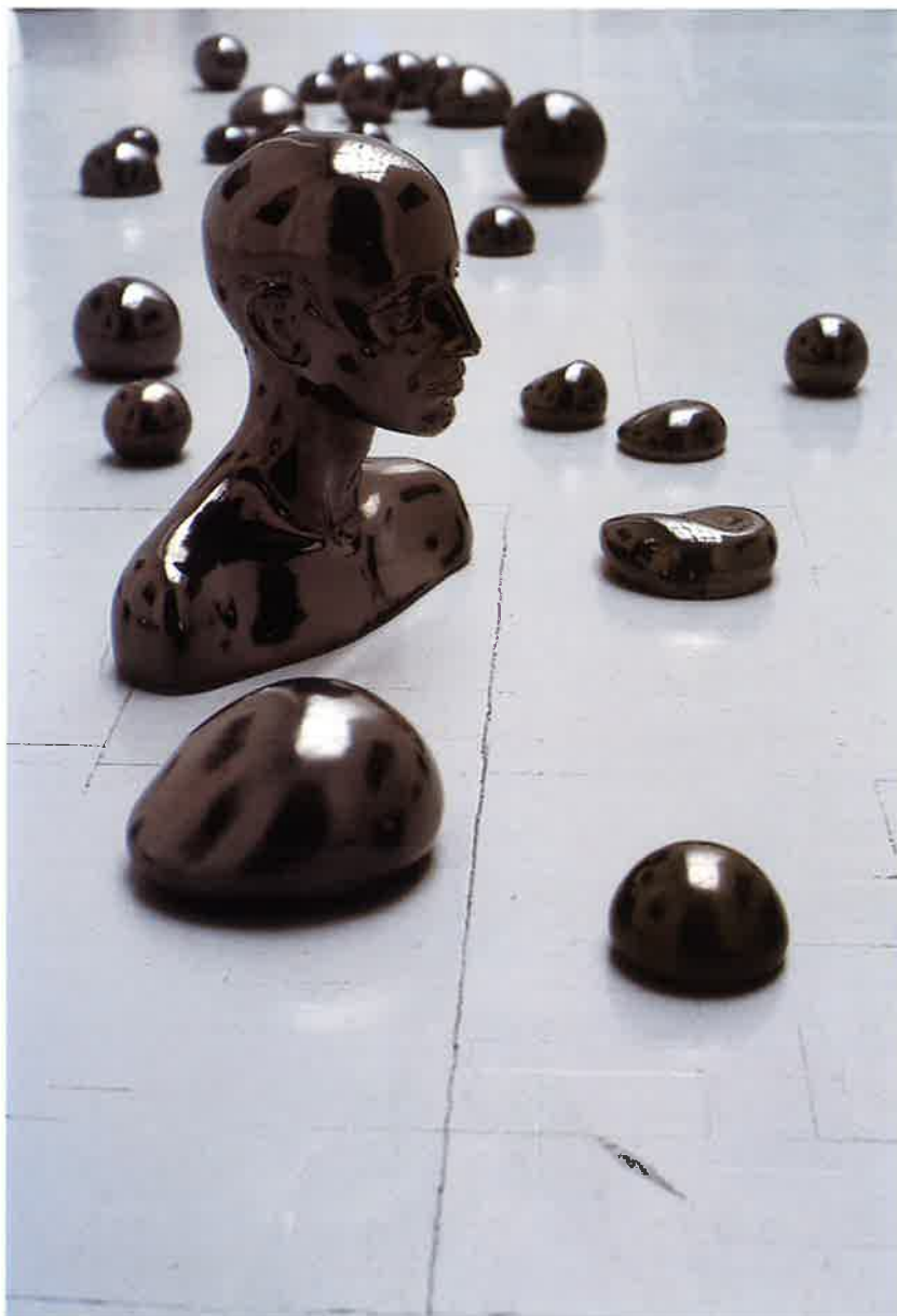
PEARLS, 2002 Cerámica vitrificada Instalación de medidas variables