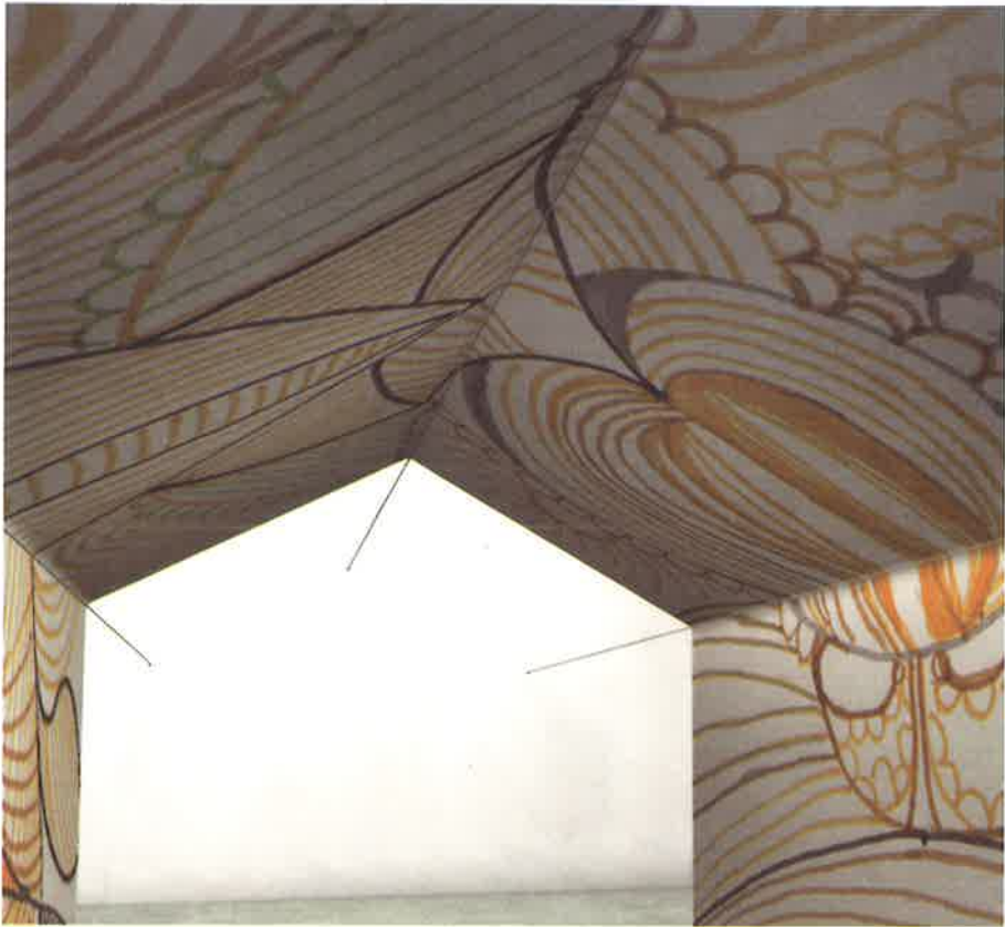
Detalle SIN TITULO, 2000 lela / lentes 700 x 400 x 350 cm simulación digital