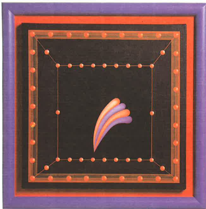
GEOMETRIC HOUSE [OF LOVE], 1996 acrílico / tela 90 x 90 cm