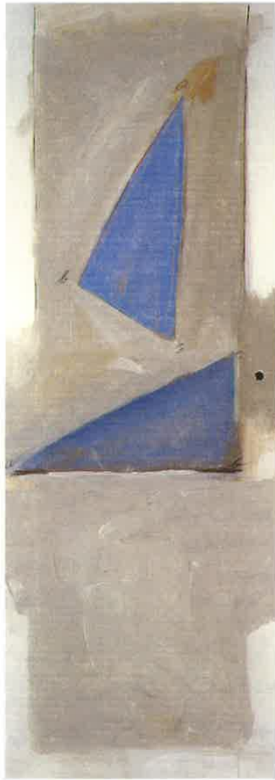
LA BUSQUEDA DEL TRIANGULO, 1999 Mixta sobre puerta DM. 202 x 72 cm (anverso y reverso)