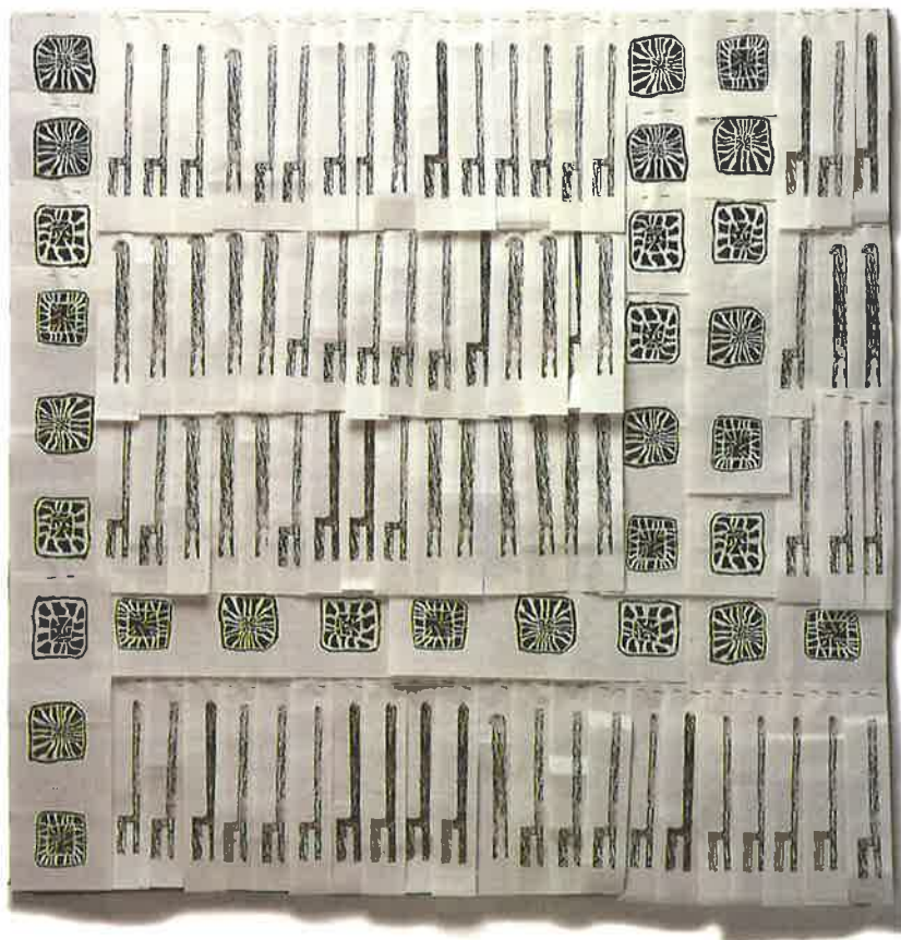
PLEGARIAS. 1998 Aguafuerte y linóleo / papel china 100 x 100 cm.