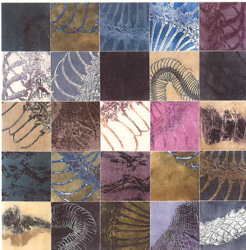
DE LA SERIE "OSAME". 1998 Grabado calcográfico / papel 100 x 100 cm.

LOLA SOLLA , Pontevedra, 1959. Licenciada en Bellas Artes, Universidad de BB.AA. de Pontevedra.