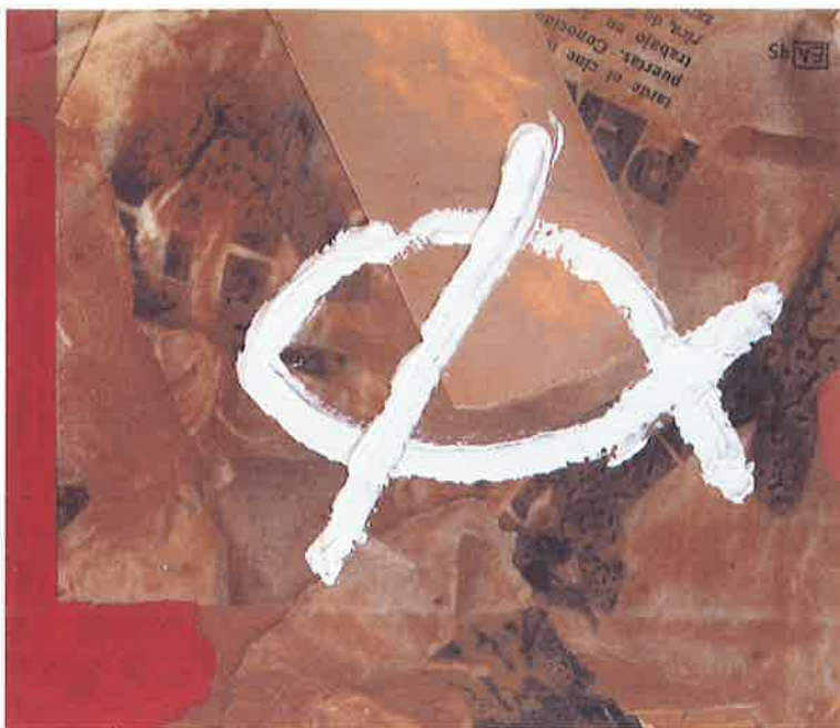
SIN TÍTULO. 1997 Mixta/Madera, 18 x 21 cm.