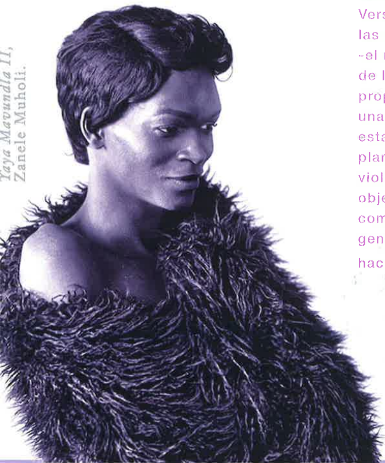
Yaya Maundla II, Zanele Muholi.

Pese al aciago panorama, la artista mexicana Lía la Novia Sirena vehicula un discurso empapado de optimismo: sus performances ocupan el espacio público convirtiendo éste en un lugar de celebración y a sus viandantes en los invitados a su fiesta particular. Versionando los ritos que marcan las edades de la mujer en México -el rito de los Quince Años y el rito de la Novia- Lía nos habla de su propia transición, haciendo de ésta una cita festiva a la que todxs estamos invitados. A través de este planteamiento, Lía subvierte las violencias de las que ella misma es objeto, convirtiendo los afectos y el compartir en una forma radical y genuinamente transgresora de hacer pedagogía.