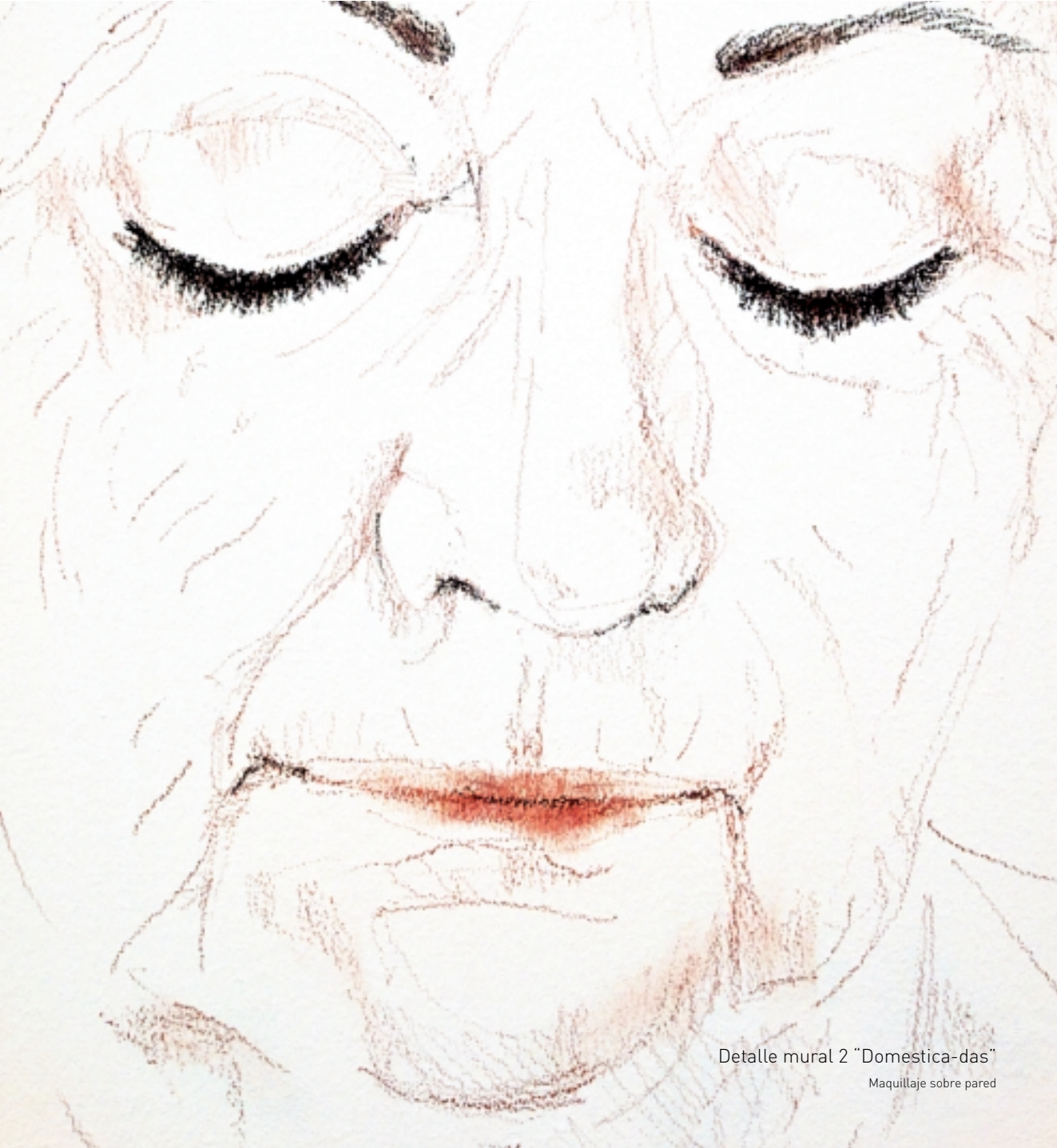
Detalle mural 2 "Domestica-das"