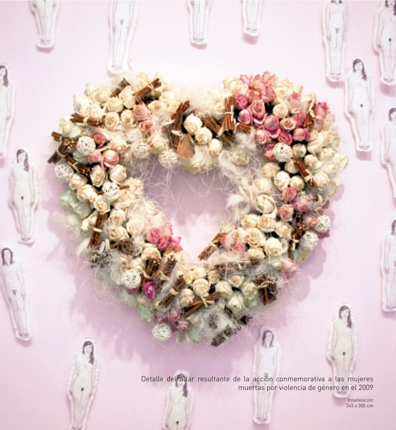
Detalle del altar resultante de la acción conmemorativa a las mujeres muertas por violencia de género en el 2009