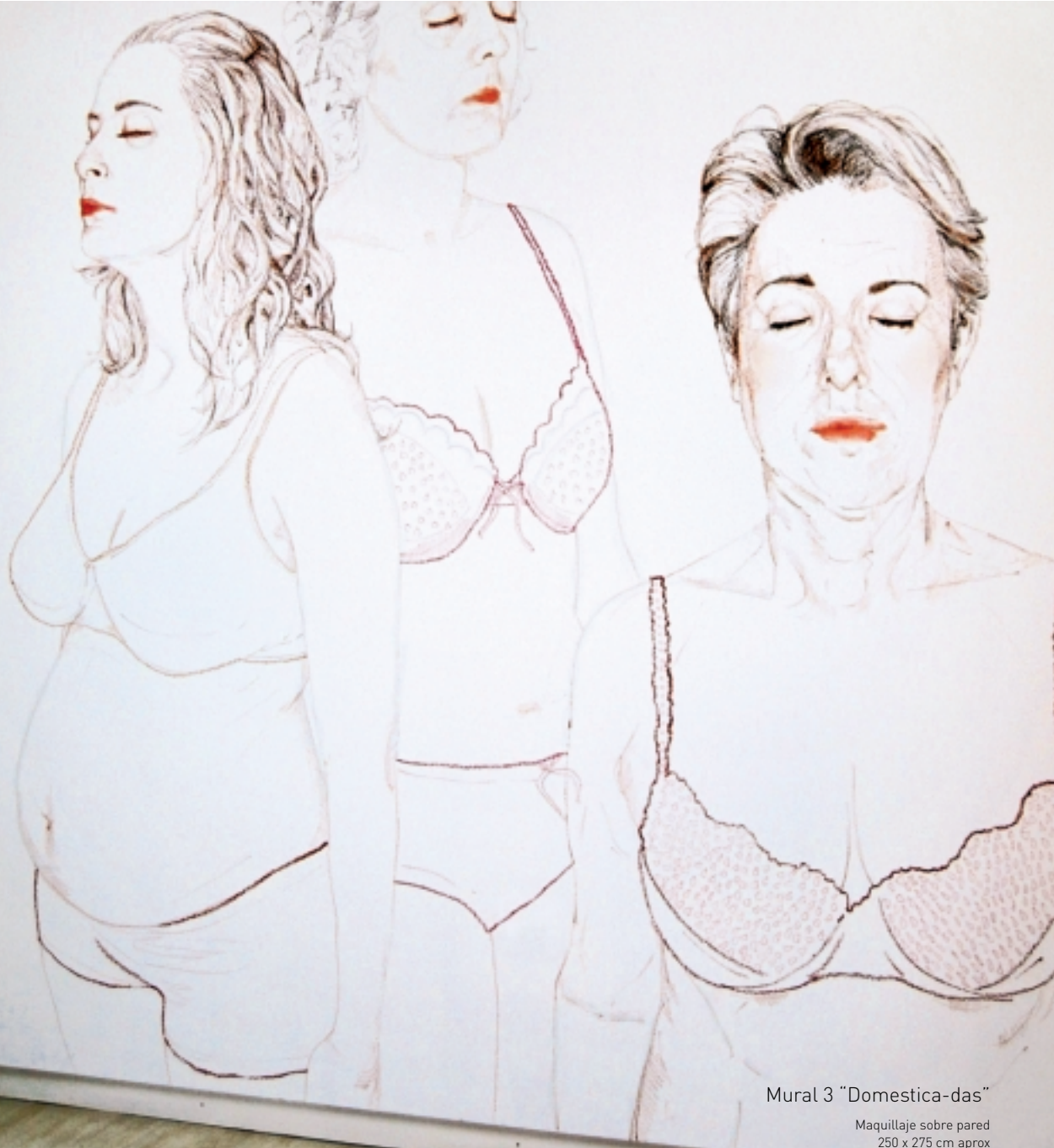
Mural 3 "Domestic-das"

Maquillaje sobre pared 250 x 275 cm aprox