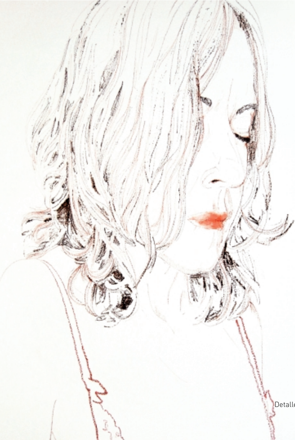
Detalle mural 1 "Domestica-das"