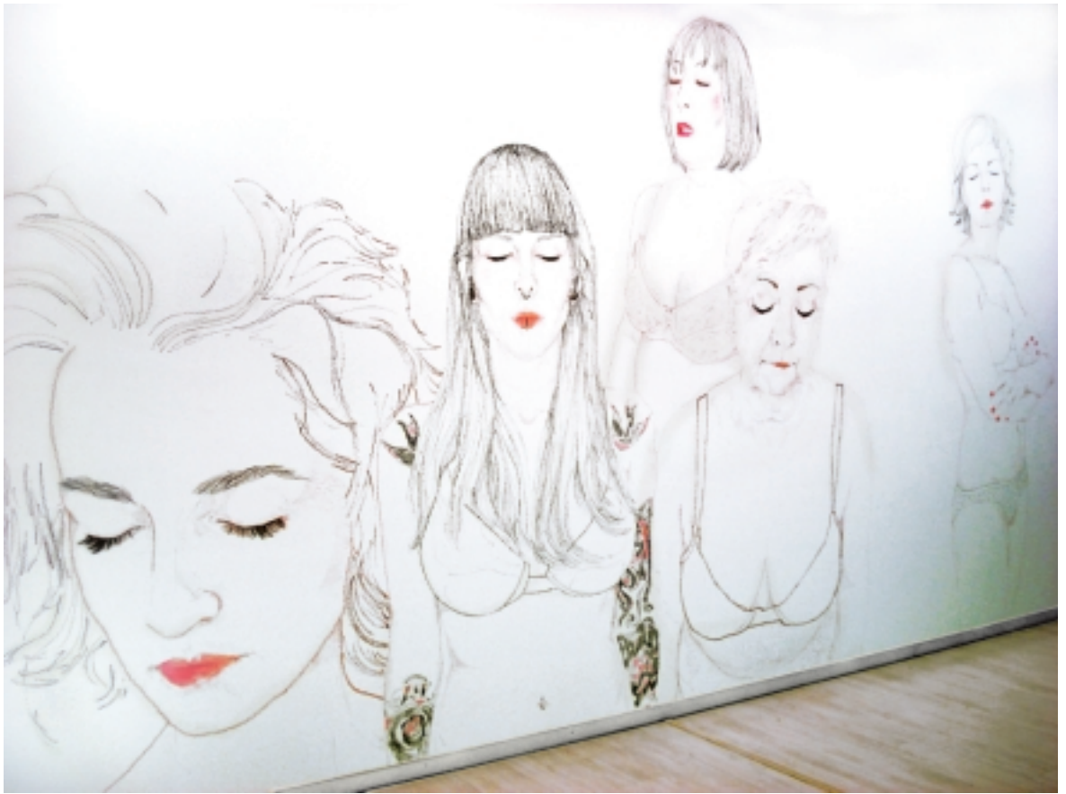
Mural 2 "Domestica-das"

Maquillaje sobre pared 500 x 275 cm aprox