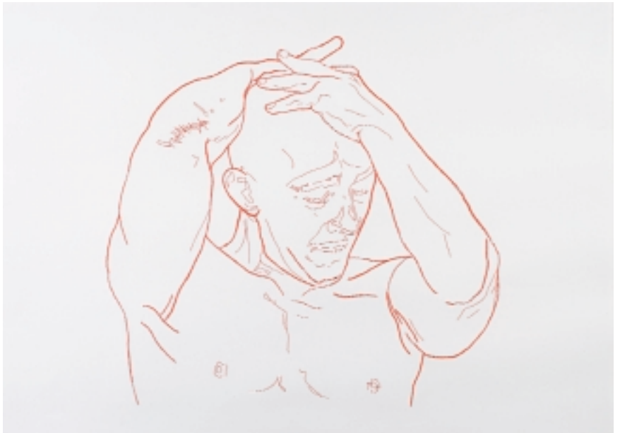
Man under Construction, 2008 Díptico. Hilo / papel 100 x 70 cm c/u