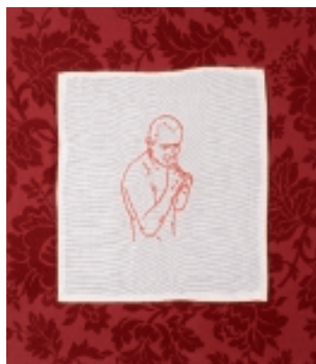
Masculinity, 2008 Serie de tres piezas 50 x 50 cm c/u Hilo / tela con fondo de Damasco