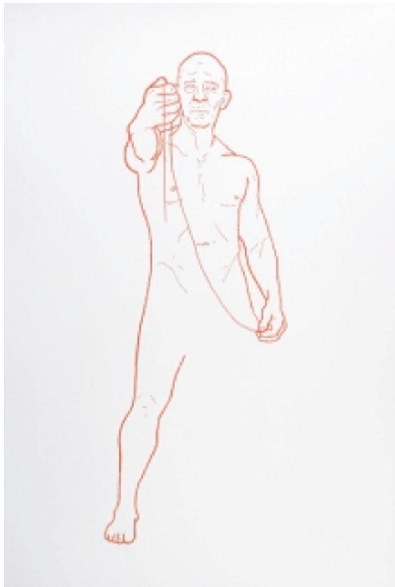
Masculinity construction . 2008 Díptico. Hilo / papel 112 x 76 cm c/u