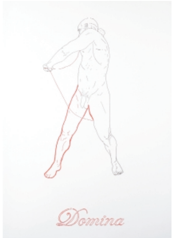
If you are a man. 2008 Hilo, tinta y gouache / papel Serie de 5 piezas 100 x 70 cm c/u