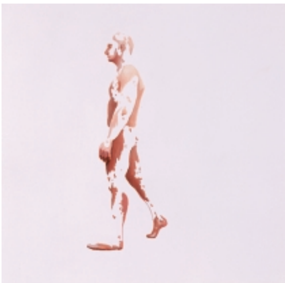
Construction . 2008 Serie de 5 piezas 50 x 50 cm c/u Acrílico / papel