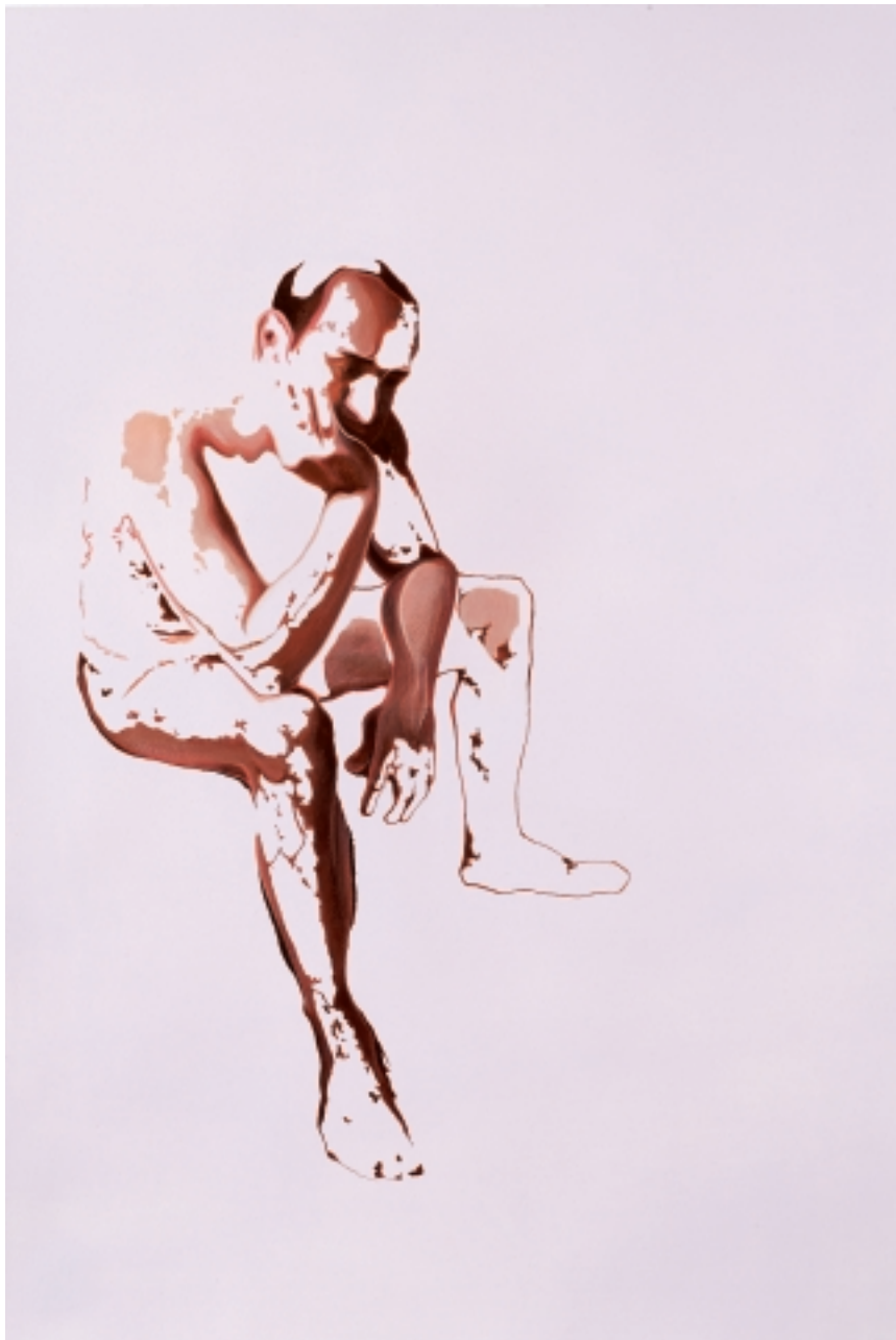
Construction . 2008 Acrílico / papel 70 x 50 cm