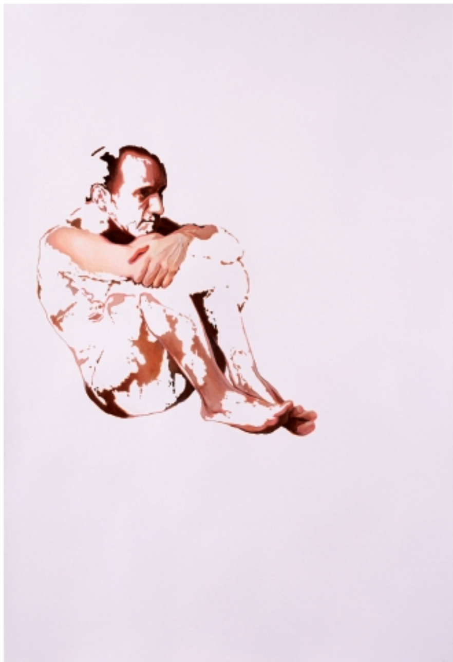
Construction . 2008 Acrílico / papel 70 x 50 cm