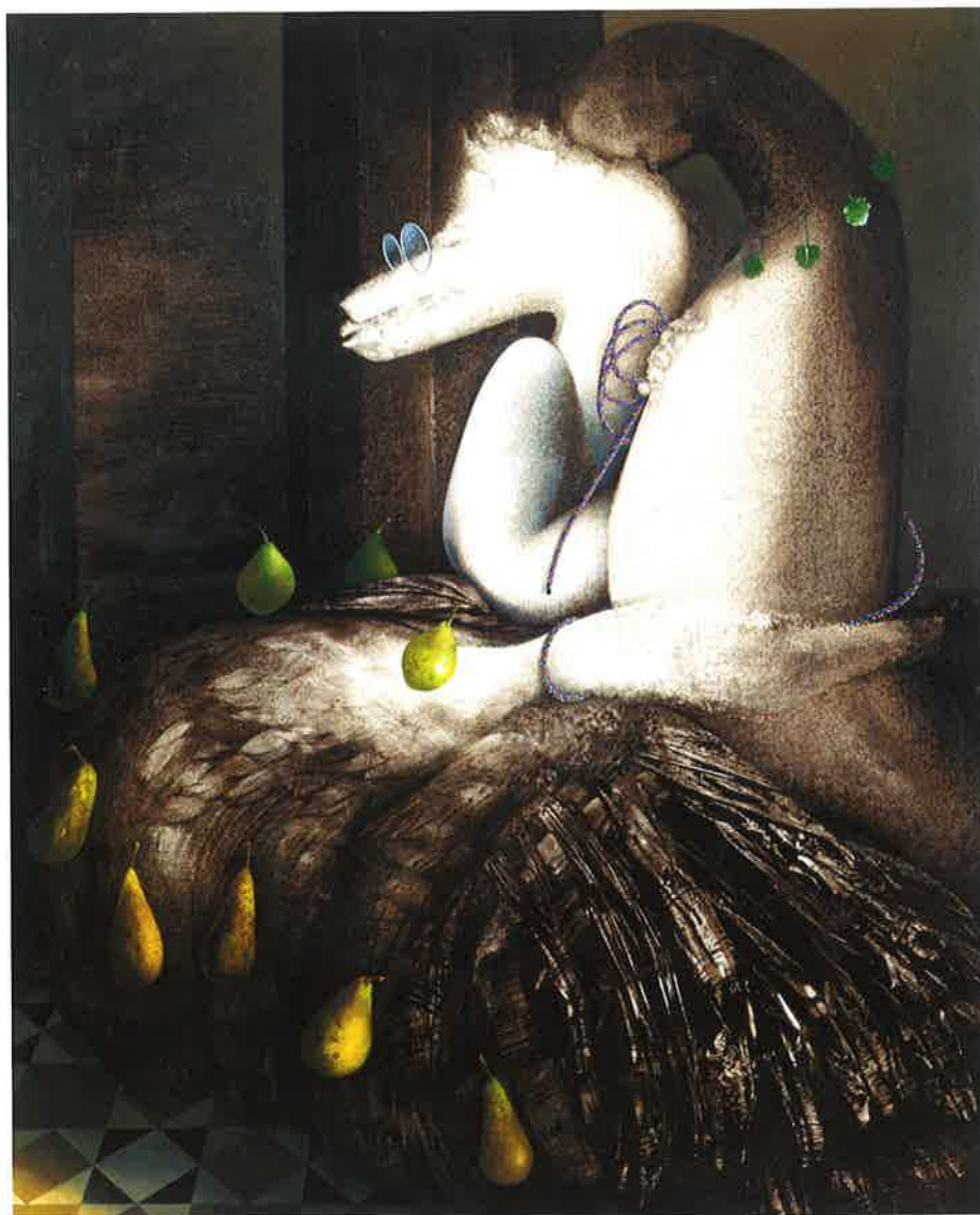
Leda, el pato y uno de calcedonia , 1989 Óleo sobre tela, 162 x 130