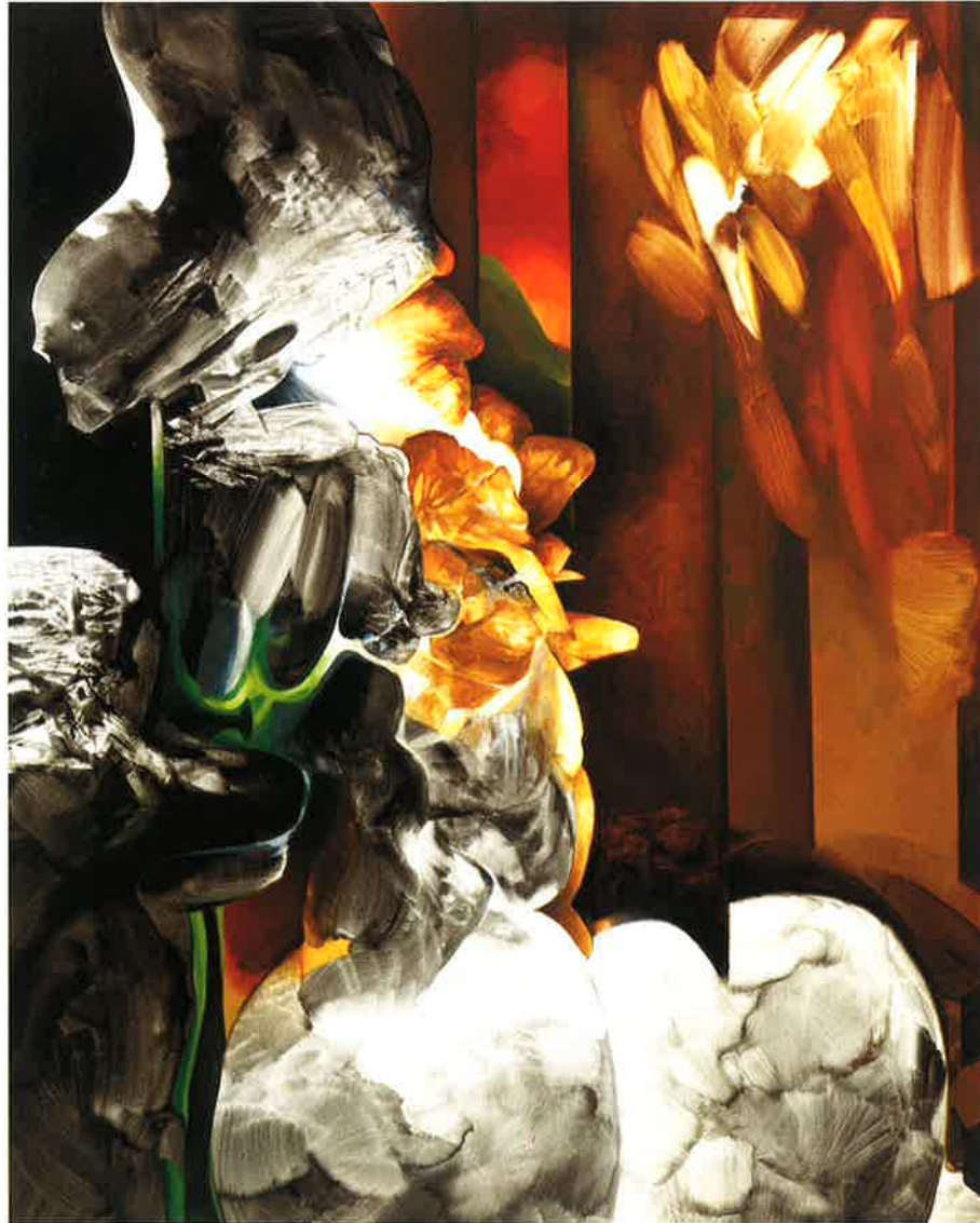
Personaje entre columnas, 2002 Óleo sobre tela, 162 x 130