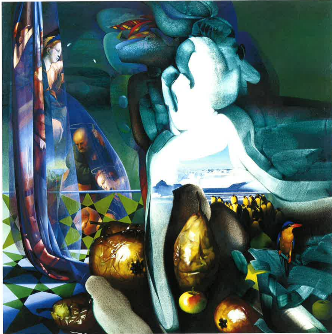
Personaje glacial en el trópico, 1997 Óleo sobre tela, 150 x 150