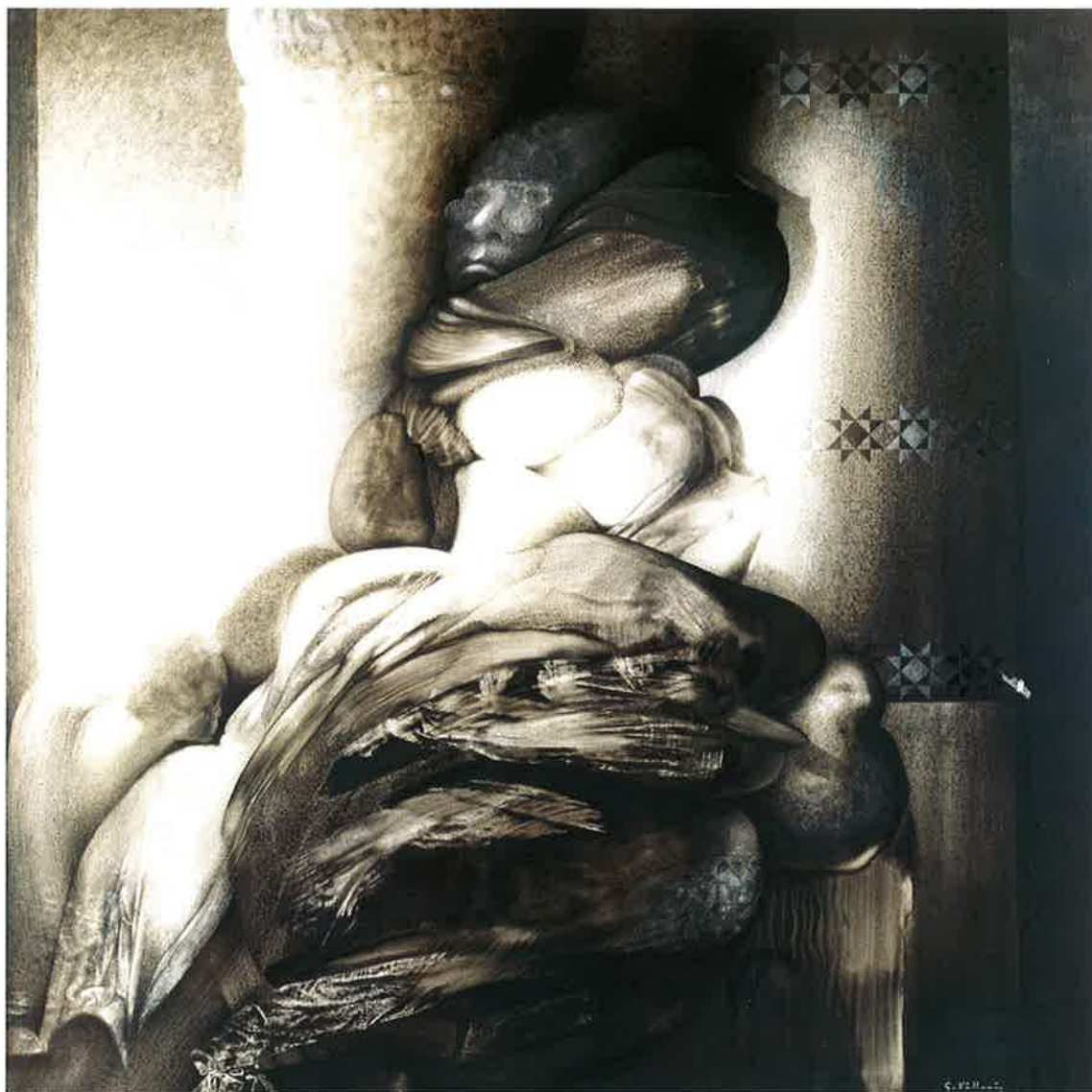
Personaje negro , 1989 Óleo sobre tela, 150 x 150