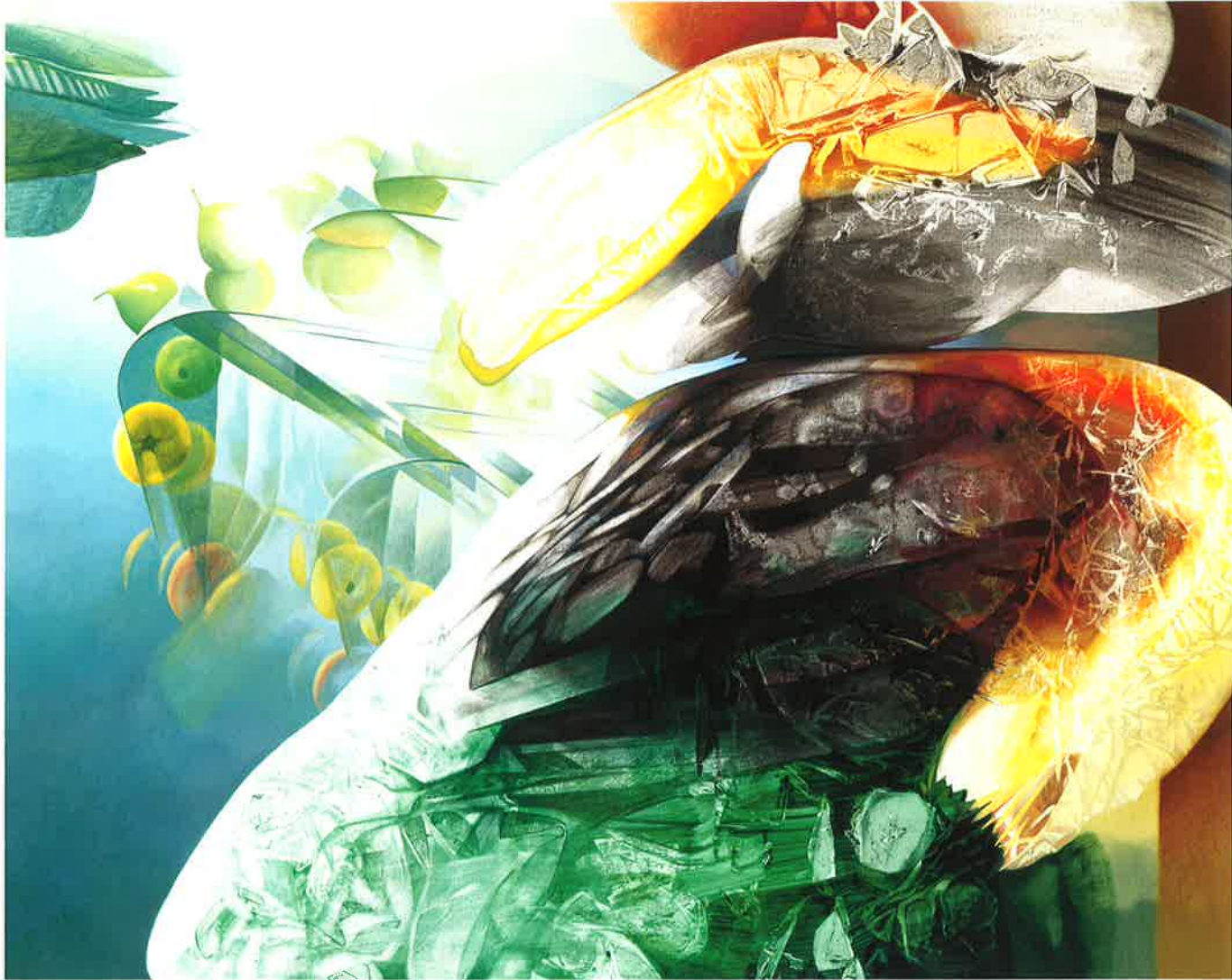
Personaje sombreado por delante del espejo roto, 2002 Óleo sobre tela, 130 x 162