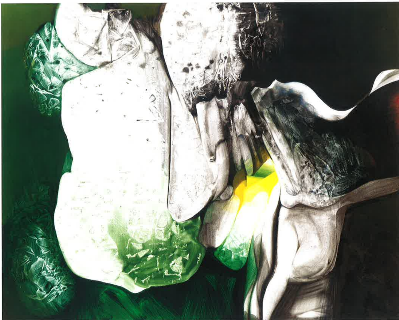
Saturno , 2002 Óleo sobre tela, 130 x 162