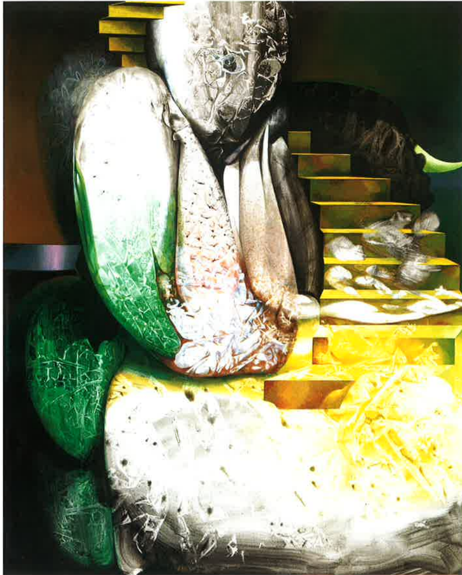
Escalera bajando por un personaje, 2002 Óleo sobre tela, 162 x 130