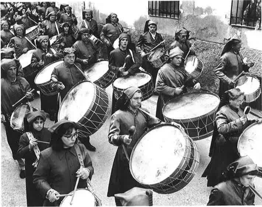
Tambores y Bombos. Calanda, Fotografía: Jordi Urioz.

San Antón, cuando era viejo, Le quitaron el pellejo Y se hicieron un tambor, Toca, que toca, San Antón.