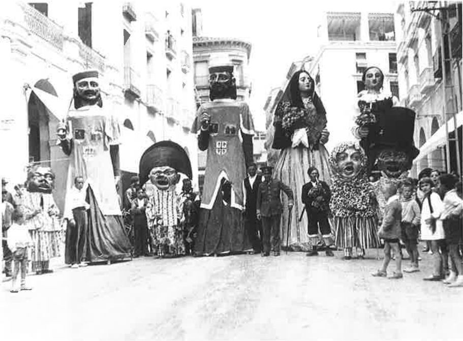
Gaitero con gigantes, y cabezudos, en Huesca.