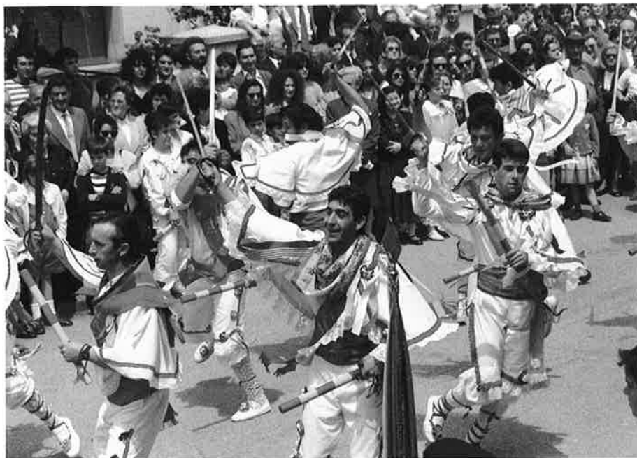
Danzantes de Tardienta.

1.2.5. Almirez. Dance de Jorcas. Lucía Pérez.