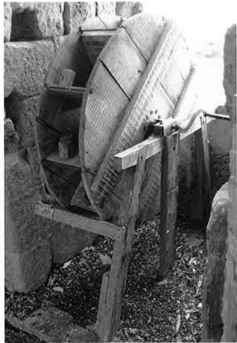
Matraca de torre. Albelda.

Al eco los Sancristanos Repicaron las matracas Por más fiesta, porque en otras Suelen chiflar las campanas.