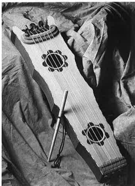
Chicotén construido por La Charamella. Primer Premio del V Concurso de Artesanía organizado por el Gobierno de Aragón.