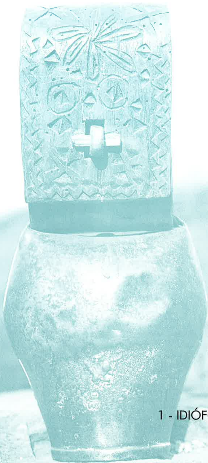
1 - IDIÓFONOS