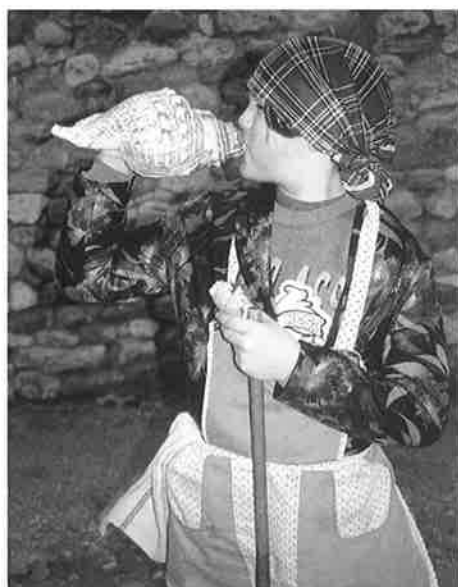
Caracola . Cuevas de Almadén.