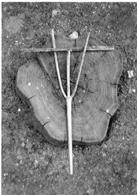
Tricolotraco (tocador, tica-tac, bailarina...)