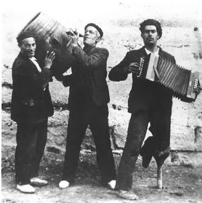
Acordeón. Colección del Ayuntamiento de Pertusa.