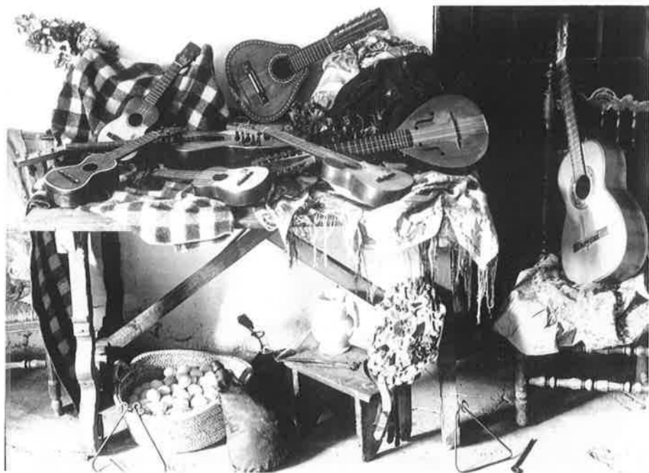
Instrumentos después de la Ronda. Bolea.

...con la sangre bullindo'n las venas y templando con fe la guitarra, lo guitarró, requinto u bandurria pa la fiesta de la Sanchuanada.