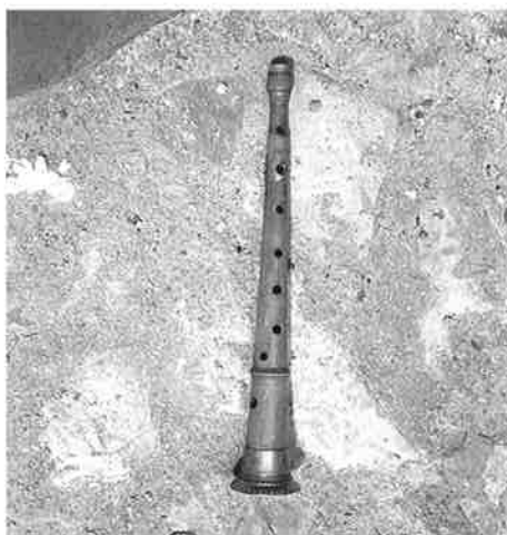
Dulzaina de José Jiménez El gato de Albarracín.