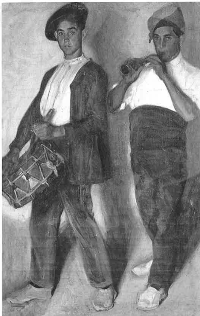
Tamborileros. Cuadro de Marín Bagüés, 1916. Óleo sobre lienzo, 123 x 80. Museo de Zaragoza.