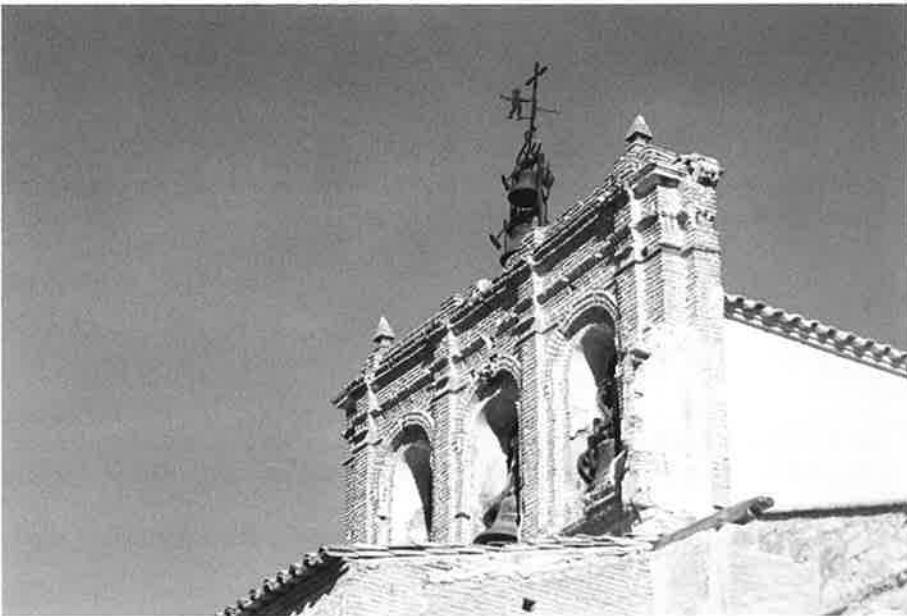
Campanario. Velilla de Ebro.