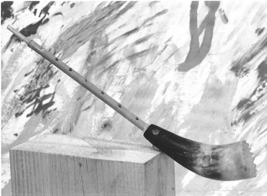
Fabiol de bana.