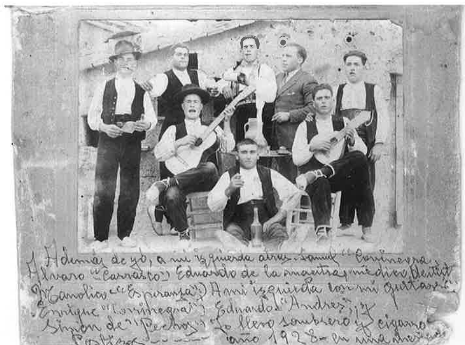
Merienda en Iglesuela del Cid

La guitarra, de Barbastro Las cuerdas, de Tamarite; Y el Cantador soy, señores, De Serveto pa servirles.