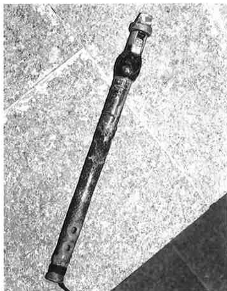
Chiflo de Yebra de Basa.

4.5.1. Chiflo . Reproducción de un original de Jaca.