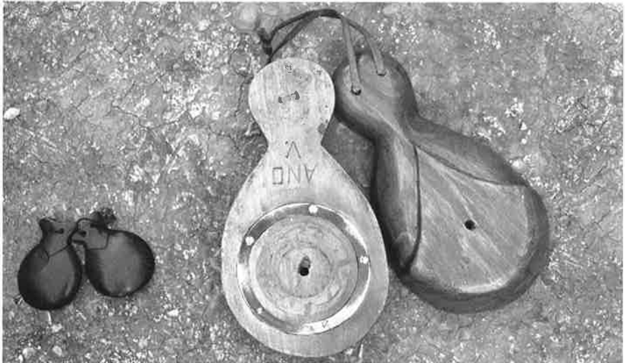
Castañuela del Mayoral. Dance de Cetina.