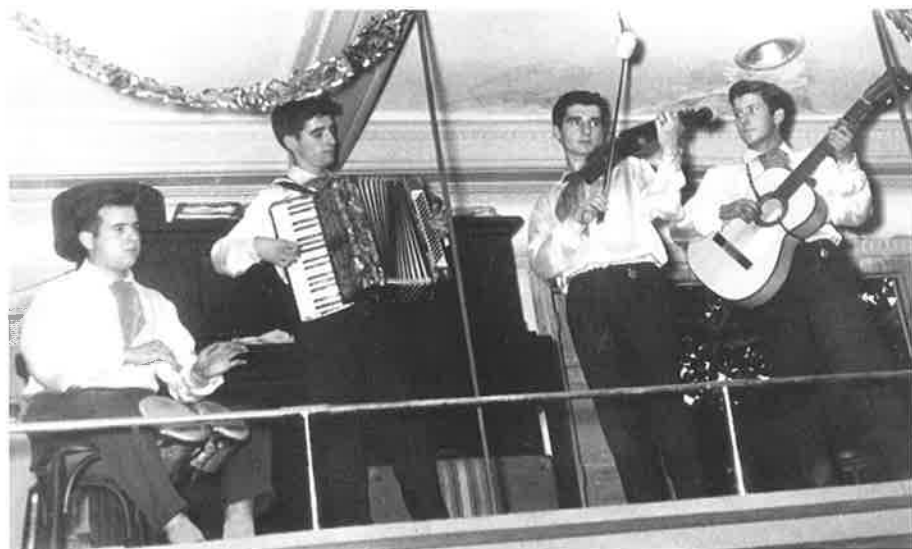
Conjunto Los Nápoli. Zaragoza.

4.12. BANDAS, ORQUESTINAS Y CONJUNTOS. A lo largo del siglo XX, fueron generalizándose nuevas agrupaciones que inicialmente convivirían con las formas tradicionales y, mas adelante, acabarían por desplazarlas. Los instrumentos antiguos trataban de adaptarse a los nuevos repertorios, pero acabaron siendo destronados por otros artefactos modernos mucho más adecuados al gusto del momento. Dejamos aquí una breve pincelada acerca de un largo proceso que, en nuestra opinión, sigue abierto. Vaya con ello nuestro sincero homenaje a todos los músicos que, en cualquier época y con cualquier instrumento, han sabido vivir y transmitir emociones y sentimientos.