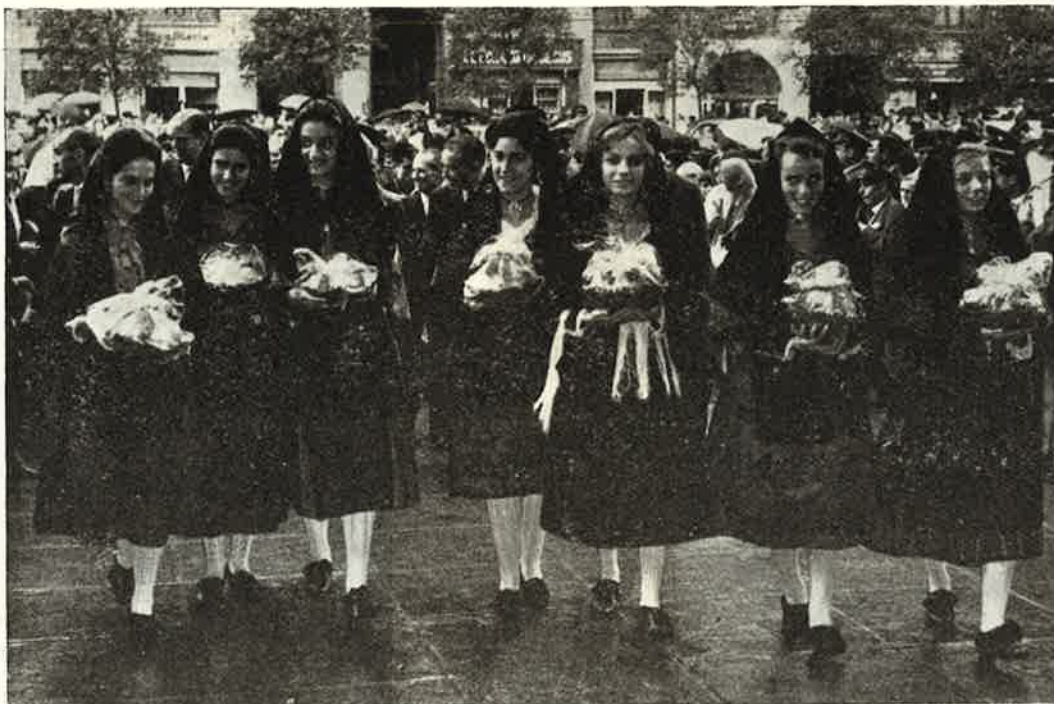
La Reina y sus Damas en el acto de la ofrenda