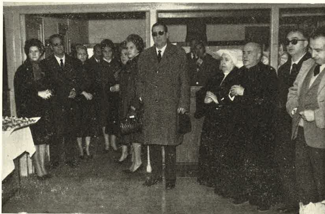
Un aspecto de la inauguración de las comidas de invierno

Los beneficiarios acuden a los centros de reparto, que se hallan instalados en la Casa de Amparo y barrios de Venecia, San José, Delicias, Valdefierro, Oliver y Arrabal, provistos de recipientes, y reciben cada uno de ellos una ración de comida caliente, magníficamente condimentada por las religiosas de la Casa de Amparo en las cocinas de este establecimiento municipal.