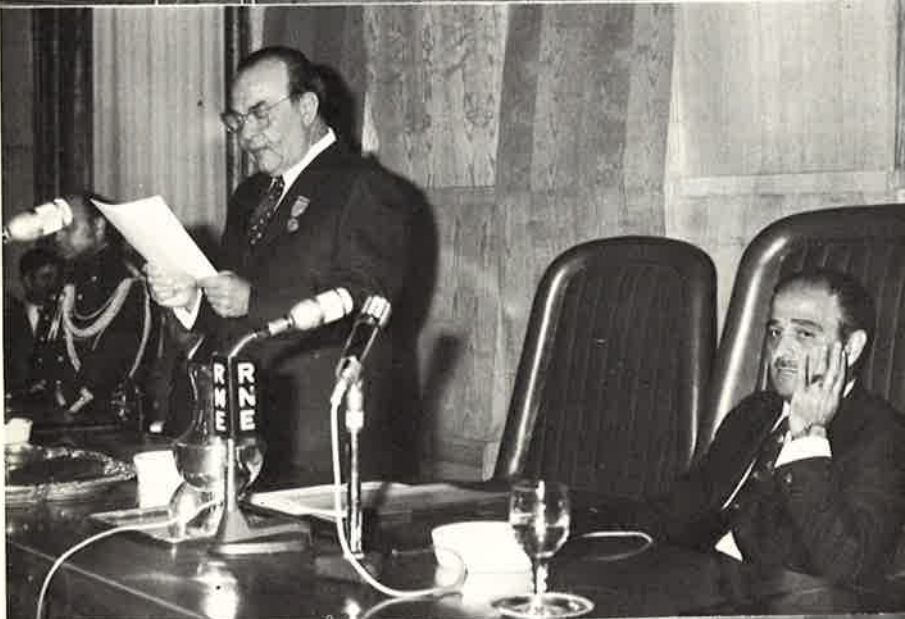
Aspecto de la intervención del Sr. Alier.