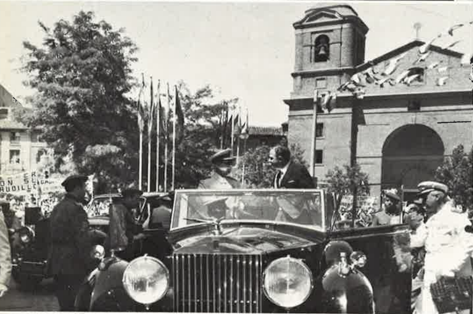
Preliminares del triunfal recorrido por las calles de la ciudad.