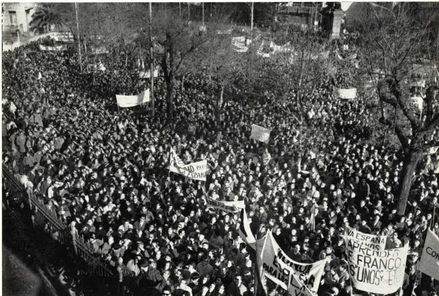
Otro aspecto de la plaza de Aragón.

su sacrificio siempre que es preciso para mantener el orden y velar por la paz y la tranquilidad de los españoles.