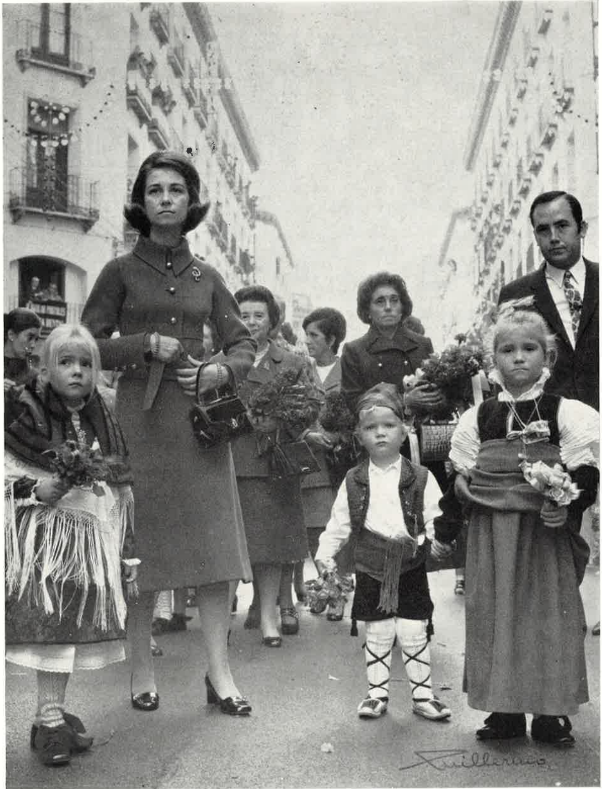
La Princesa Sofía y los Infantes por la calle de Alfonso I.