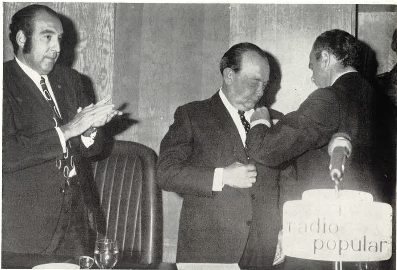
Momento de imposición de la medalla.