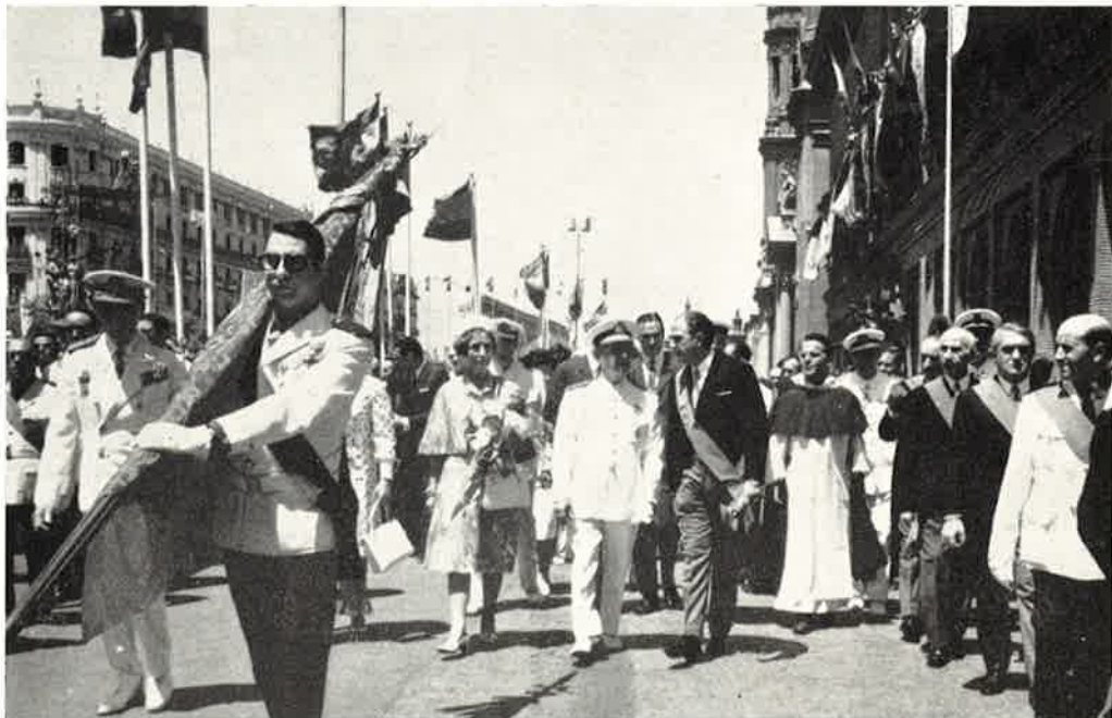
Desde la Basílica del Pilar, presidiendo la Corporación Municipal, SS. EE. se dirigen al Palacio Municipal.