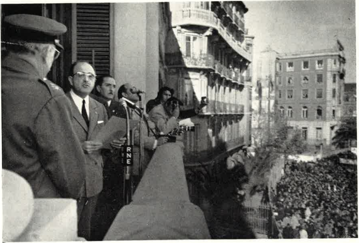
Intervención del Alcalde.