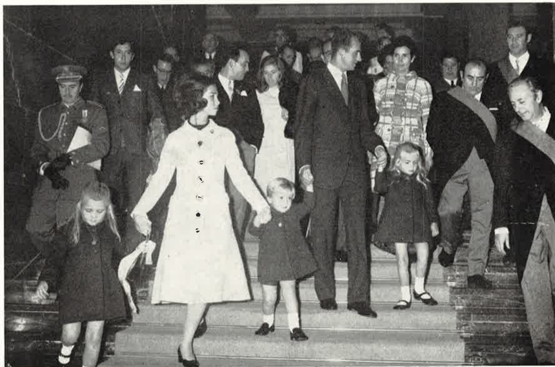
Simpática fotografía de SS. AA. RR. e hijos abandonando el Palacio Municipal.

En la noche del 11 de octubre, en el majestuoso salón de recepciones de la Casa Consistorial, bellamente dispuesto y maravillosamente adornada la mesa con un jardín natural en su centro, fue ofrecida una cena de gala a SS. AA. RR., a la que concurrieron alrededor de un centenar de invitados, terminando con expresivos brindis a cargo del Alcalde y del Príncipe de España y culminando con la actuación de un cuadro de jota, que mereció los unánimes elogios de SS. AA. e invitados.