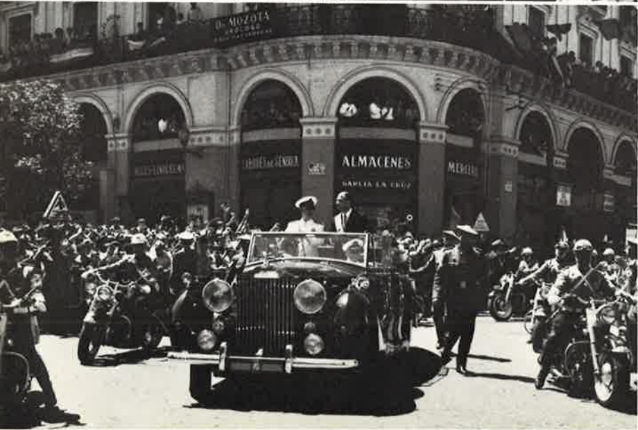
El coche de S. E. enfilando la plaza del Pilar.