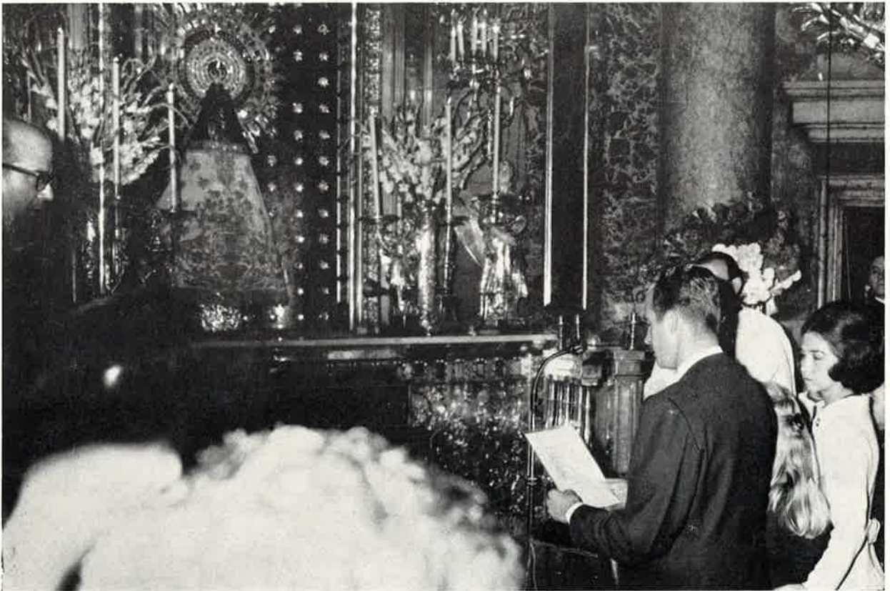
S. A. R. el Príncipe de España hace ofrenda de su matrimonio e hijos a la Santísima Virgen del Pilar.