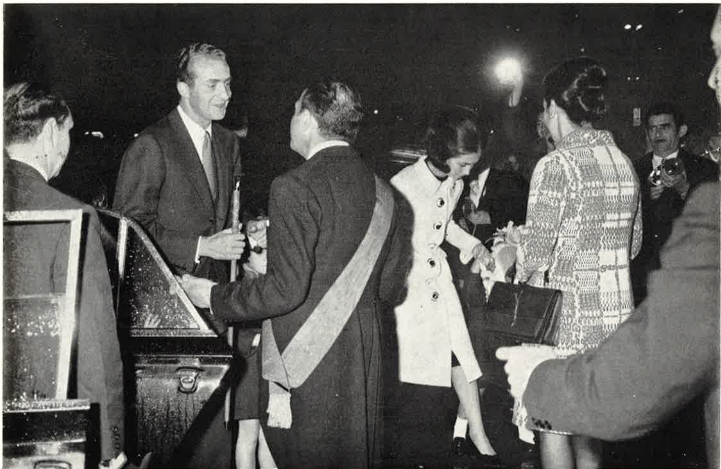
El Alcalde, Sr. Horno Liria, ofrece el bastón de mando al Príncipe.