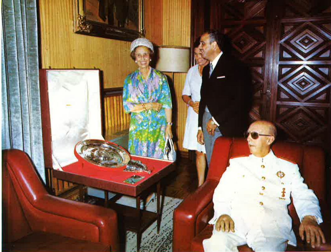
El Caudillo y señora, con los señores de Horno Liria, en el despacho de la Alcaldía.