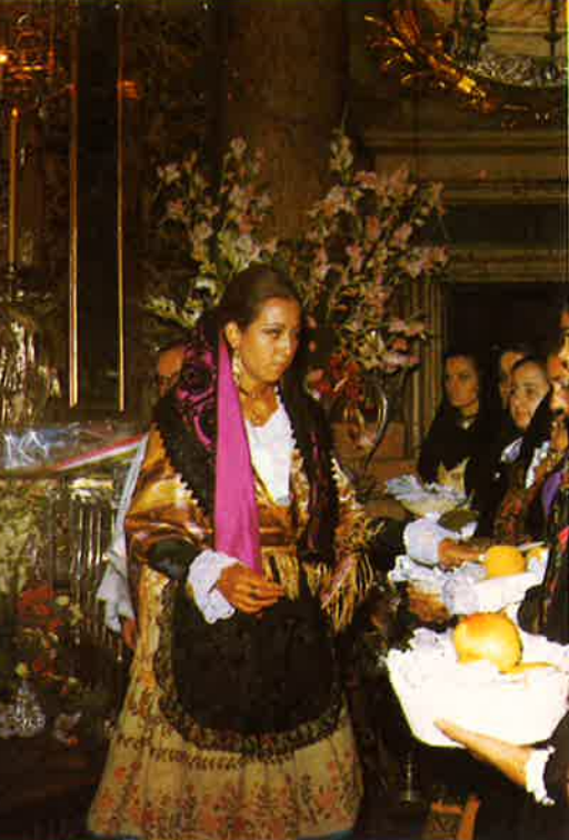
Santa Capilla: ofrenda de frutos a la Sma. Virgen.