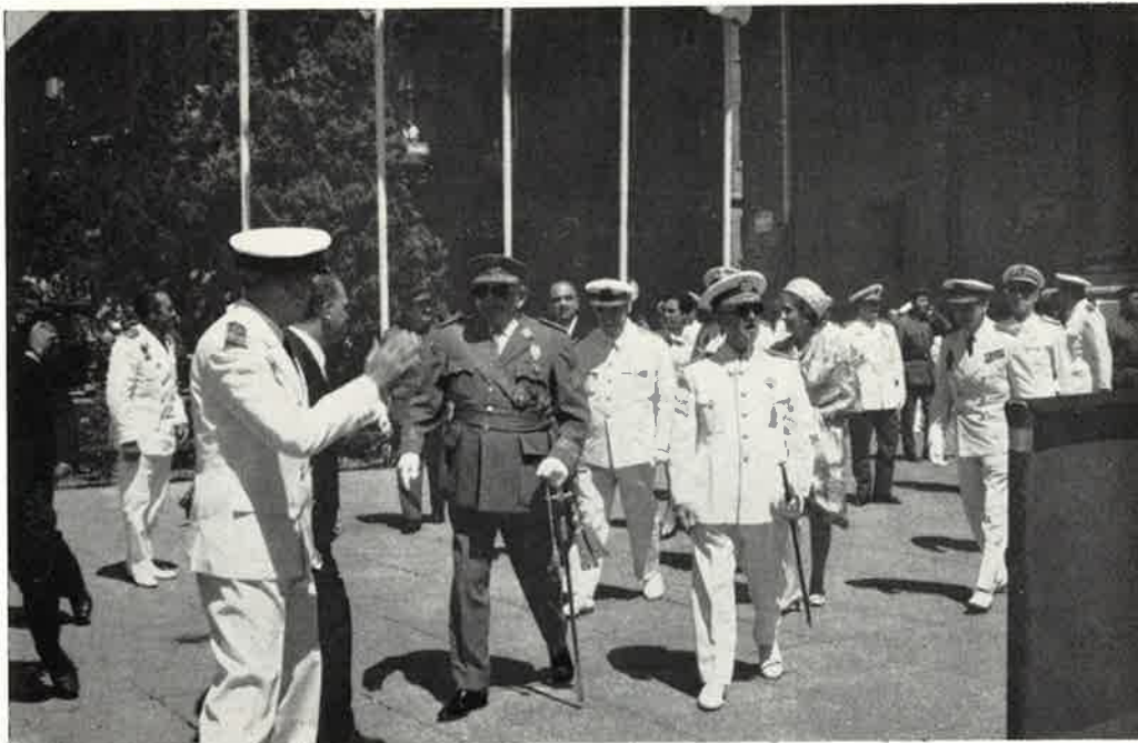
Revista de las fuerzas en la plaza del Pilar.