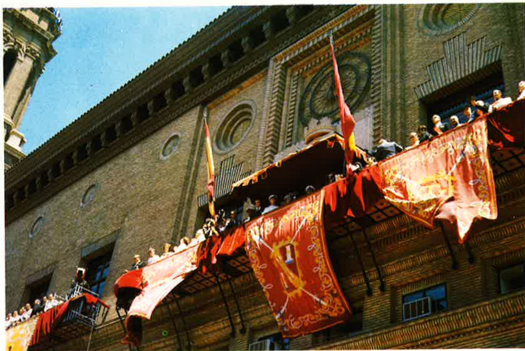
También el cierzo, tan característico de nuestra tierra, se sumó a los actos.