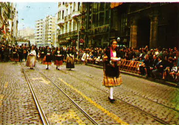
La comitiva por la calle del Coso.