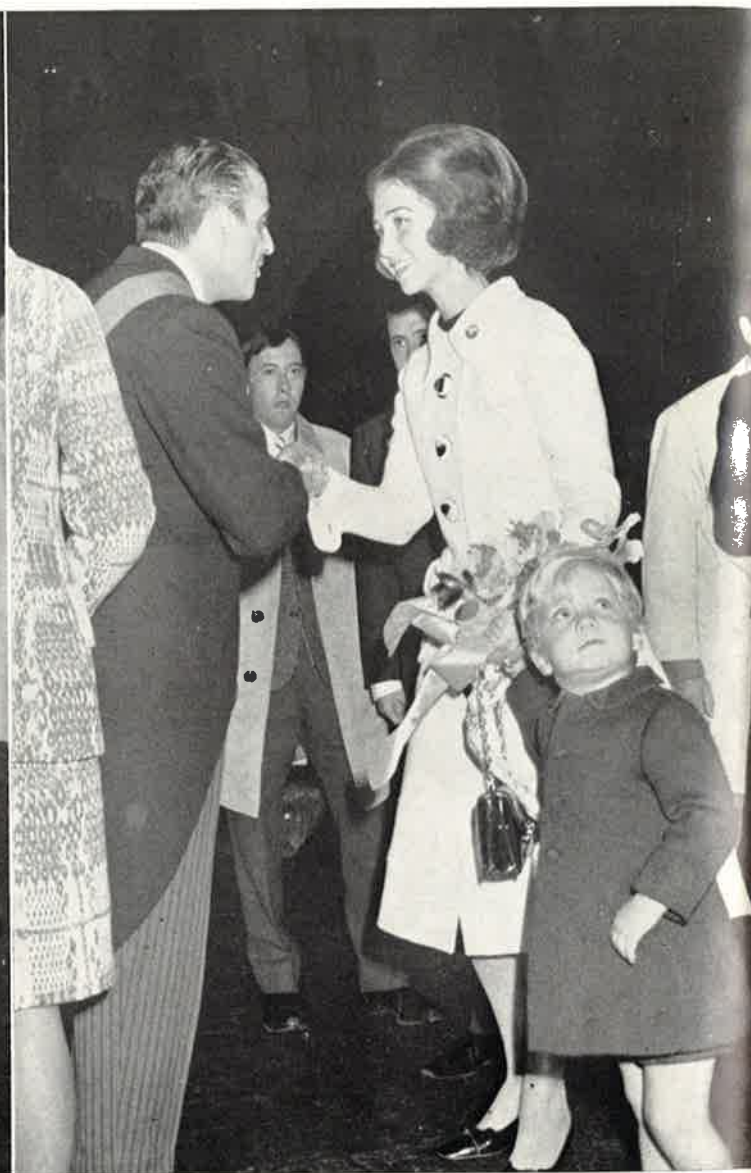
El Alcalde ofrece sus respetos a la Princesa de España. A los ojazos azules del Infante Felipe no se les escapa nada de cuanto le rodea.