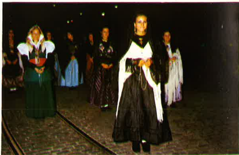
Las Reinas de Huesca y Teruel, acompañan a la de Zaragoza en la procesión del Rosario.