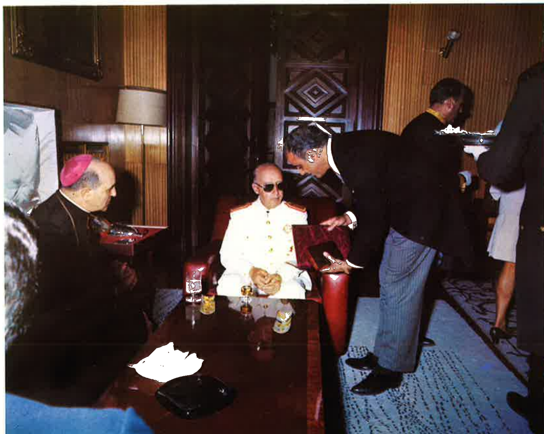
El Alcalde ofrece a S. E. algunas de las publicaciones municipales.