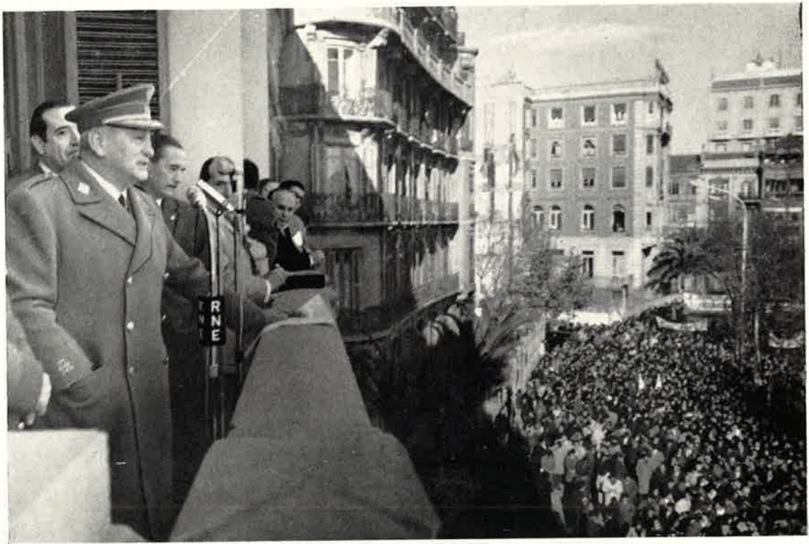
Habla el Capitán General.