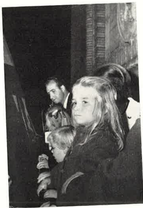
Un primer plano de la Infanta Cristina, presenciando la Cabalgata del Pregón de Fiestas.