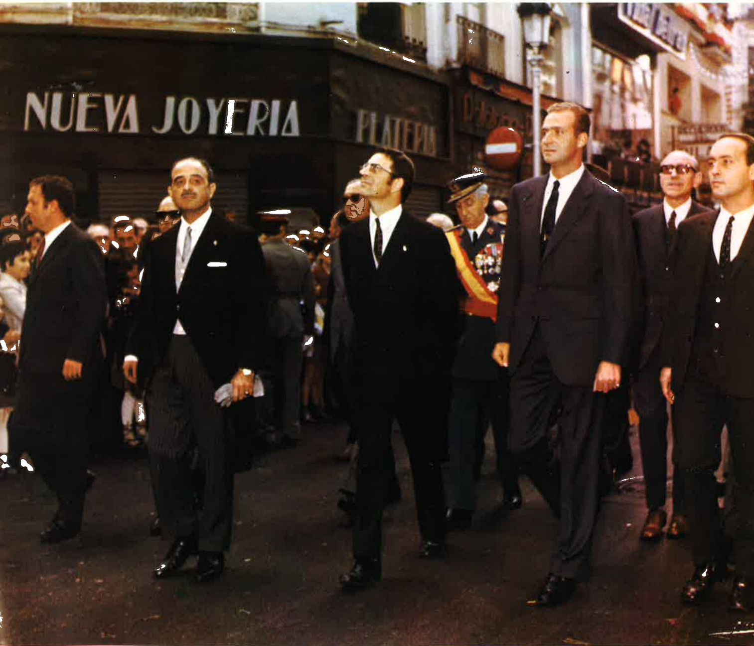
Reportaje gráfico en color de la visita de SS. AA. RR. los Príncipes de España