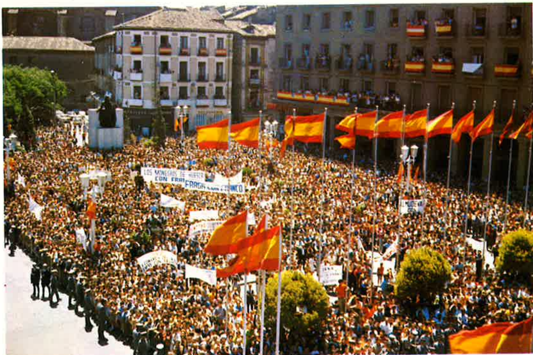
El monumento a Goya emerge de entre la multitud.