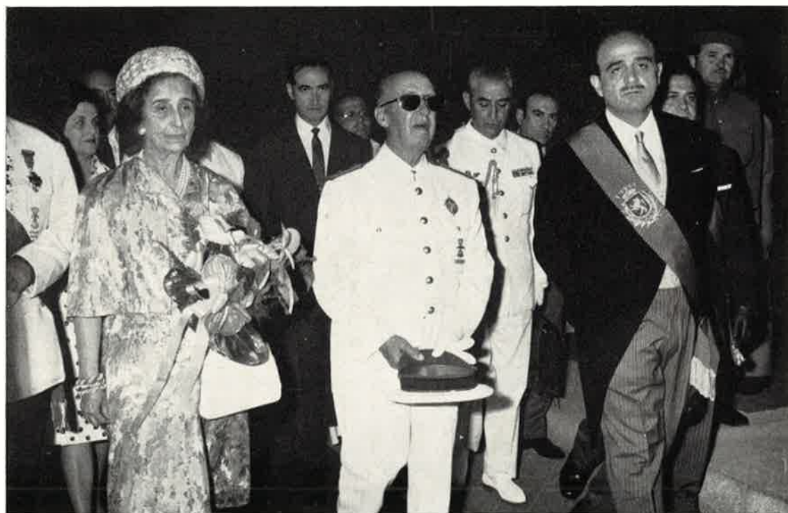
El Caudillo y señora, acompañados por el Alcalde, salen de la Casa Consistorial.