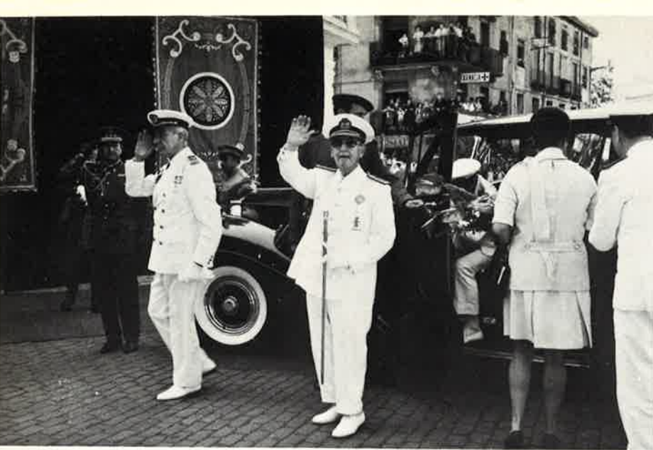
El Caudillo corresponde a las aclamaciones. La señora del Alcalde se adelanta para ofrecer un ramo de flores a D. a Carmen Polo de Franco.