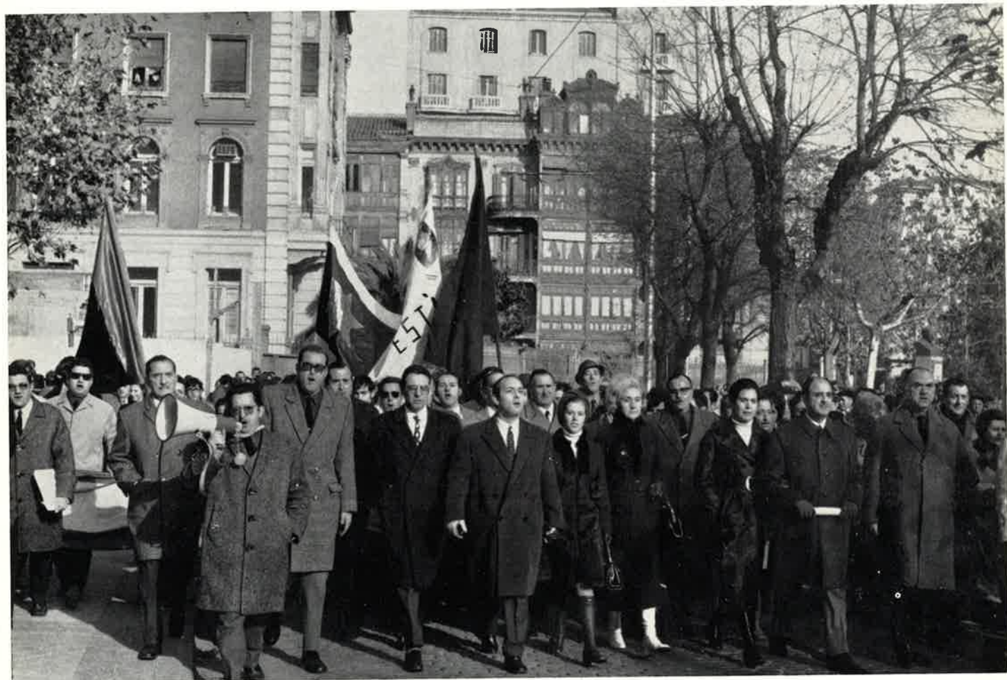
Las autoridades locales, con sus esposas, encabezando la manifestación.

En nombre de la Comisión Coordinadora para este acto de afirmación nacional, yo os digo: