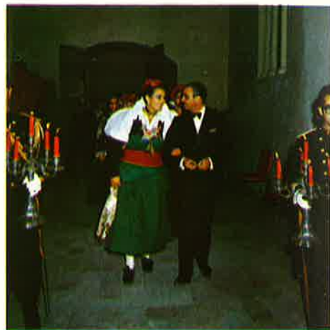
Castillo de la Aljafería: Llega la Reina acompañada del Alcalde.