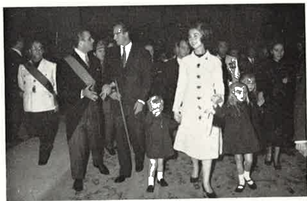
El Infante Felipe no parece ser muy partidario de los fogozanos de los fotógrafos.