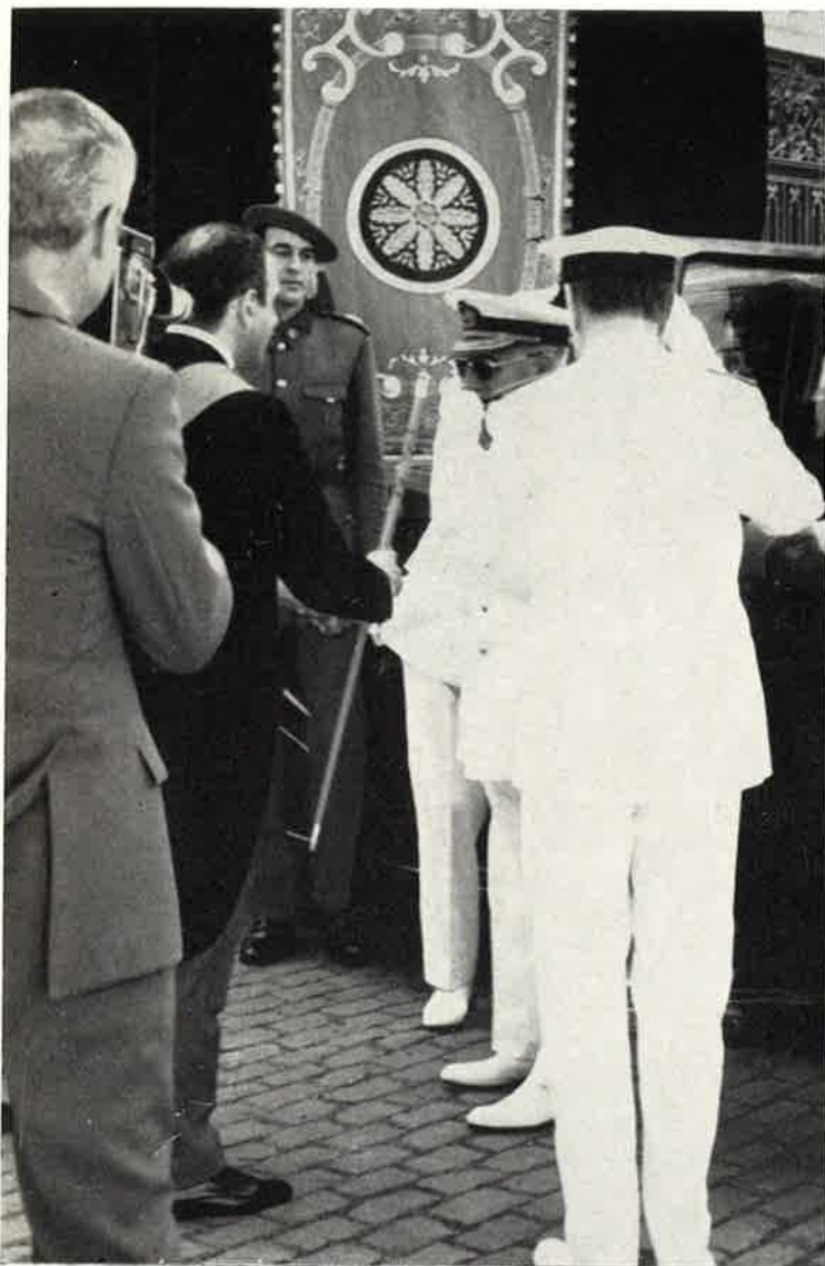
Al descender del coche, el Alcalde ofrece a S. E. el bastón de mando.