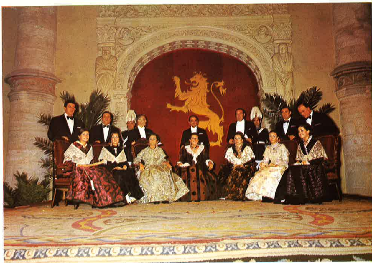
La Reina y sus Damas, escoltadas por el Alcalde y Tenientes de Alcalde, durante la proclamación.