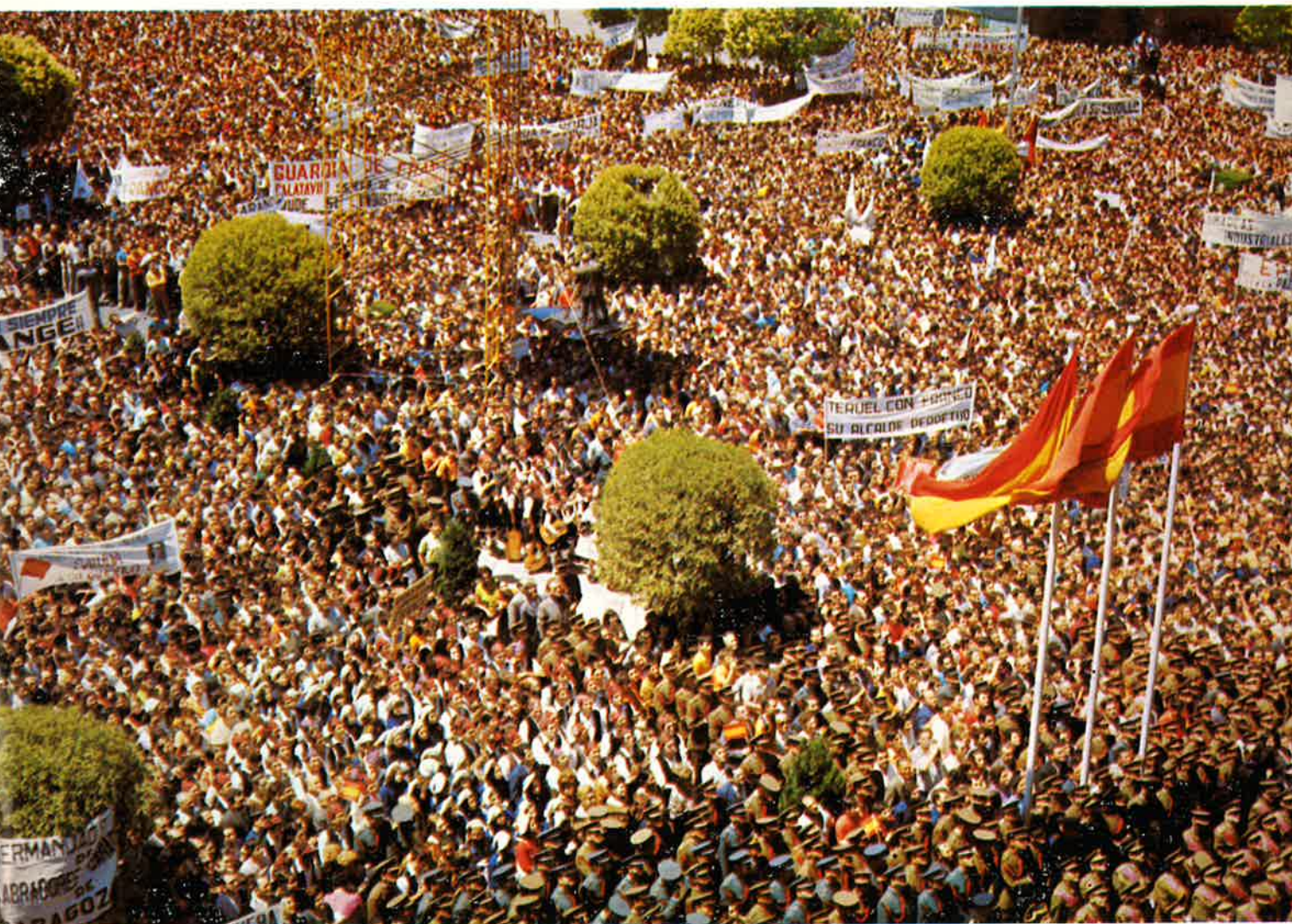
Aragón entero con su Caudillo.