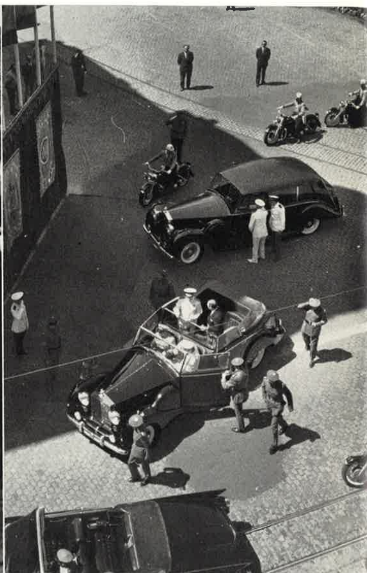
En la plaza del Portillo, el Generalísimo, acompañado del Alcalde, ocupa un coche descubierto.