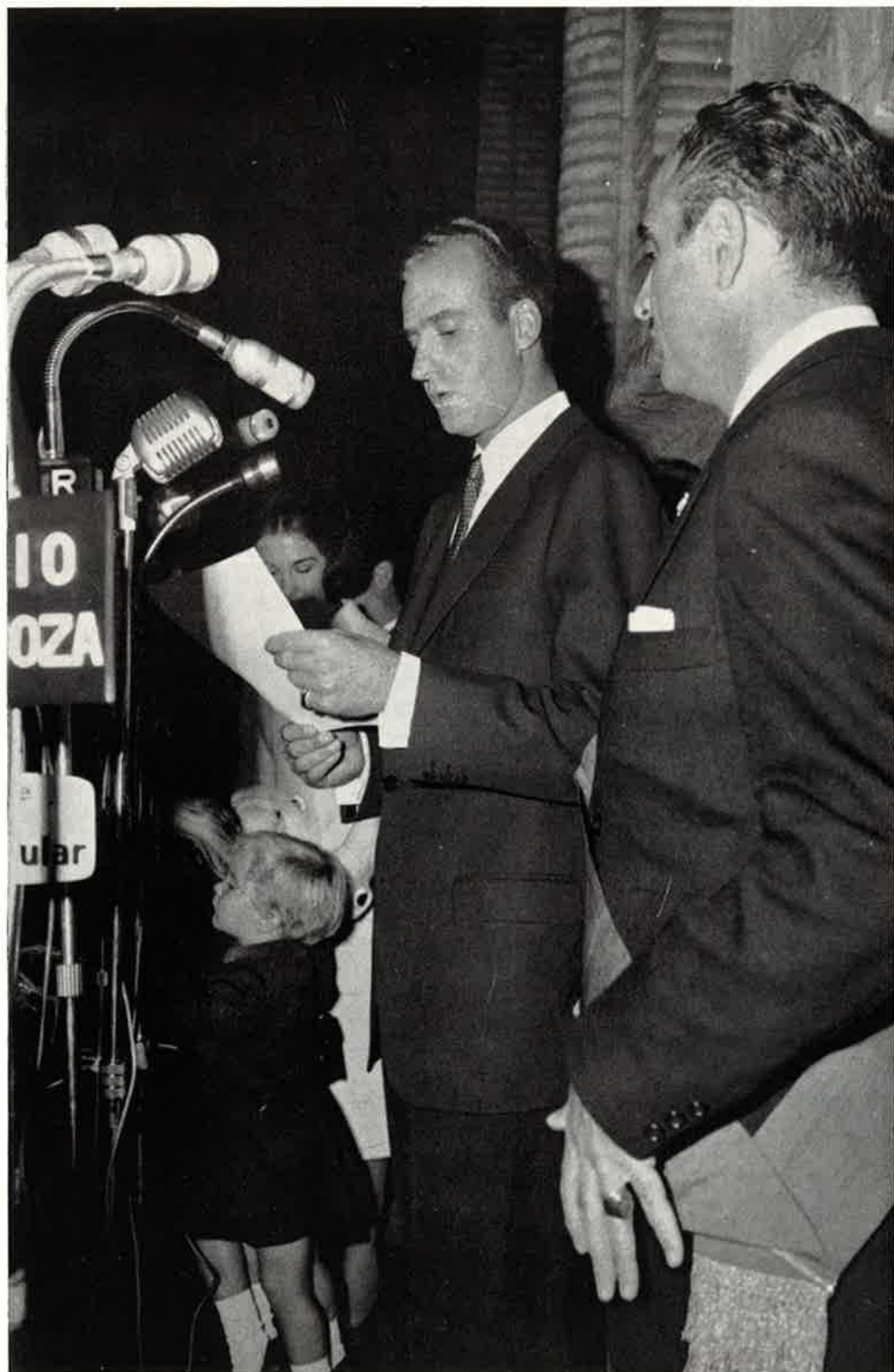
Palabras del Príncipe al pueblo aragonés, desde el Palacio Municipal.