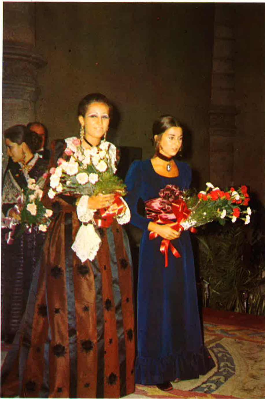
Tras intercambiarse ramos de flores, las Reinas entrante y saliente posan para los fotógrafos.