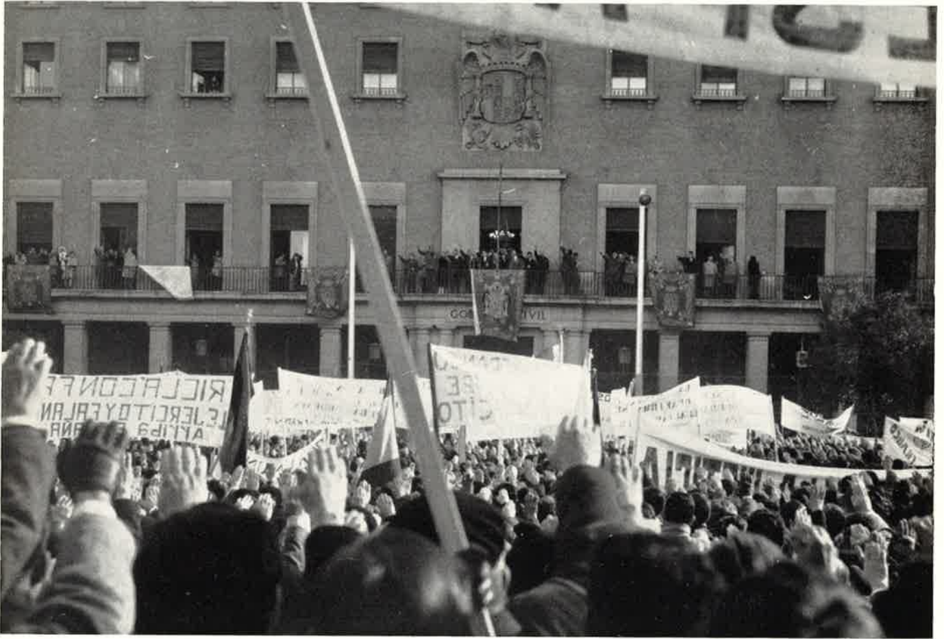
Entonando el Cara al sol ante el Gobierno Civil.

vosotros y vuestros hijos, aquí presentes también y que tienen la misma sangre brava y heroica, a luchar derrochando valor para defender el honor y la unidad de España.