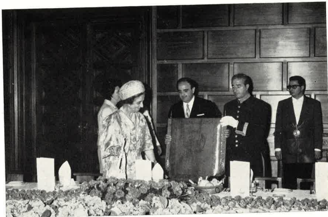
D.ª Carmen Polo de Franco ocupa su sitio en la mesa.