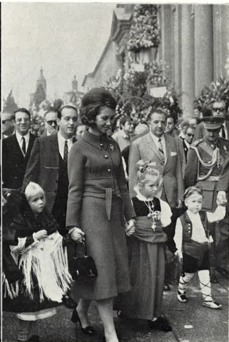
Los Infantes concurren a la Ofrenda de Flores a la Virgen vestidos con traje regional aragonés.