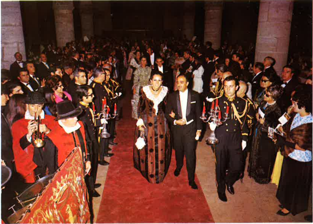
La comitiva encabezada por la Reina y el Alcalde, se dirigen al estrado.