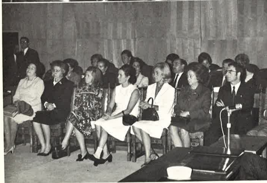
Las esposas de las autoridades ocupan un lugar de honor en el Salón de Sesiones.