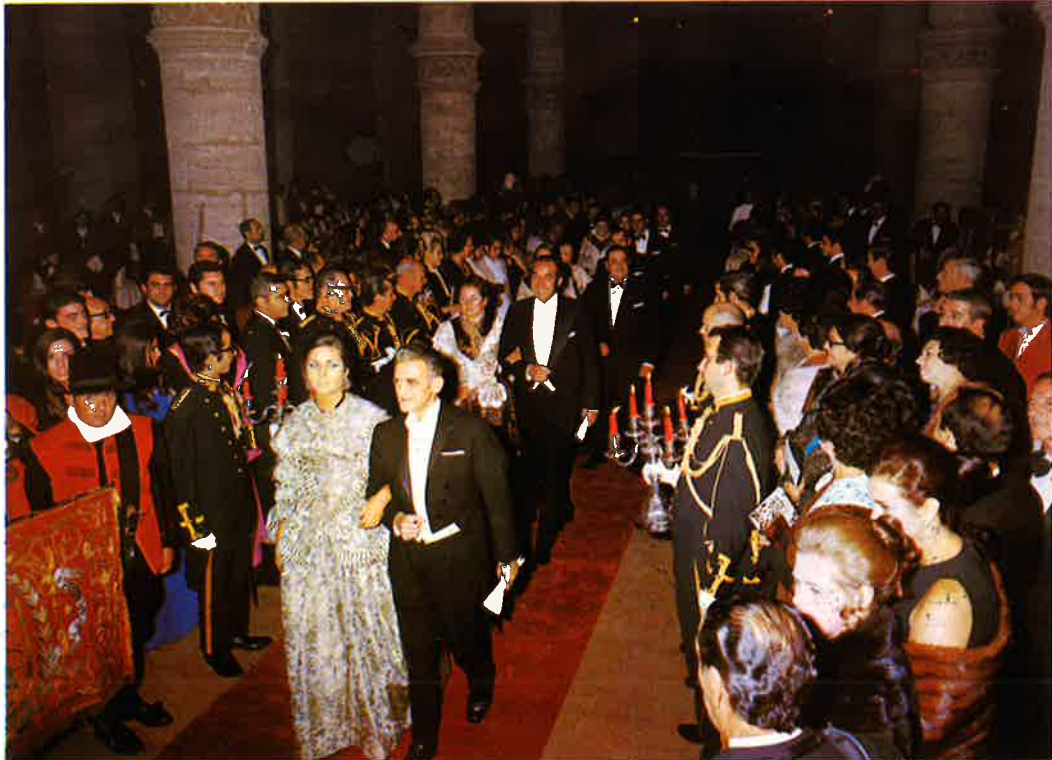
Aspecto del brillante cortejo.