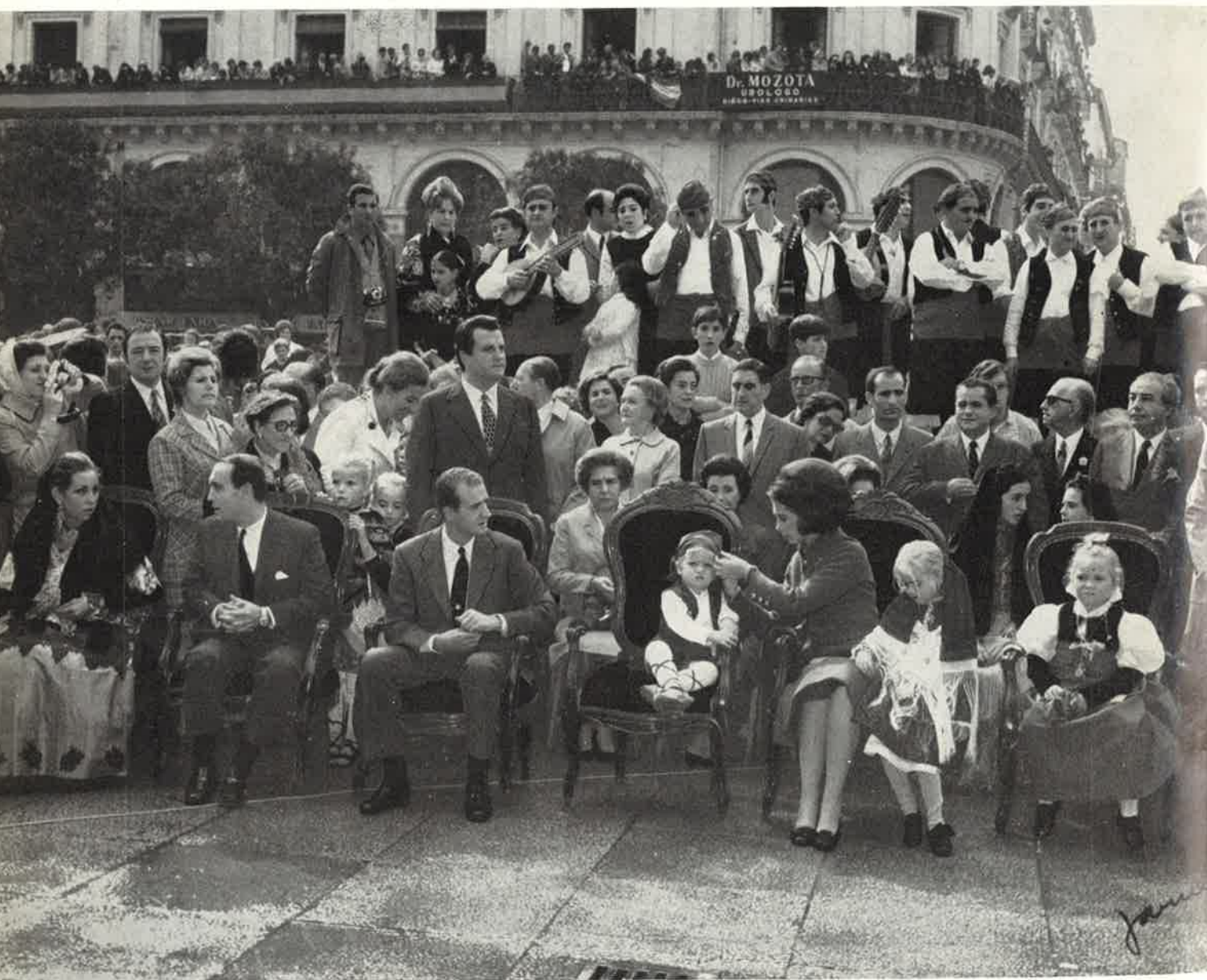
En la Plaza del Pilar, durante el acto de la Ofrenda de Flores.