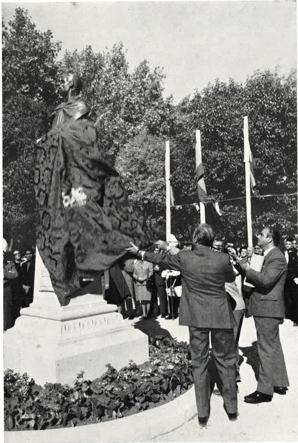
Descubriendo el busto.