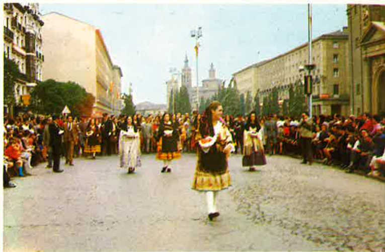
Llegada a la Plaza del Pilar de la Reina de las Fiestas.