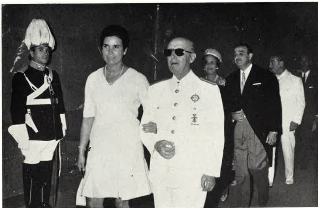
SS. EE., a quienes acompañan el Alcalde y señora, se dirigen al Salón Municipal de Recepciones.