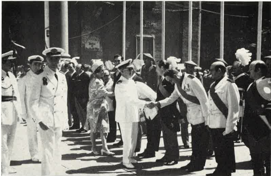
SS. EE. saludan a la Corporación Municipal.