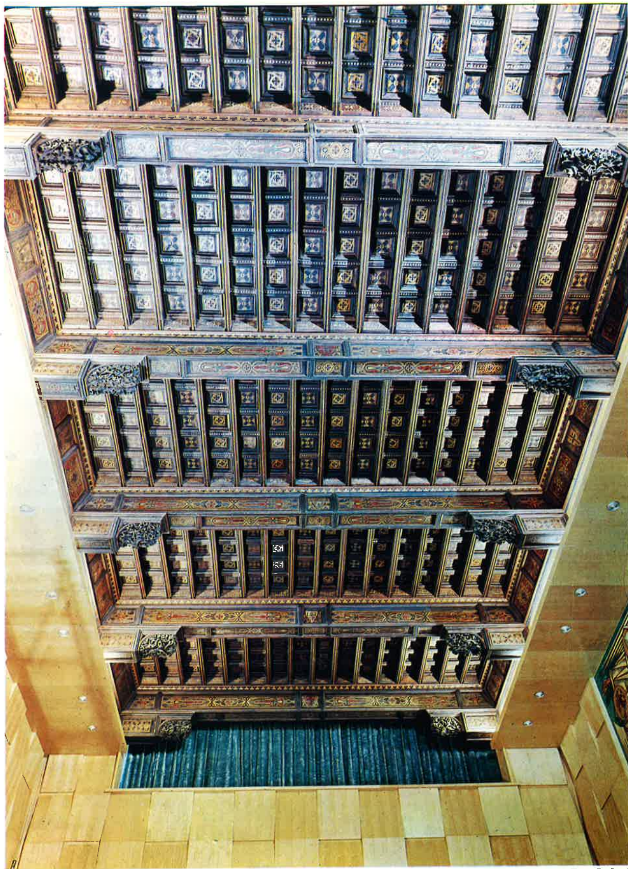
Artesonado del salón de sesiones.