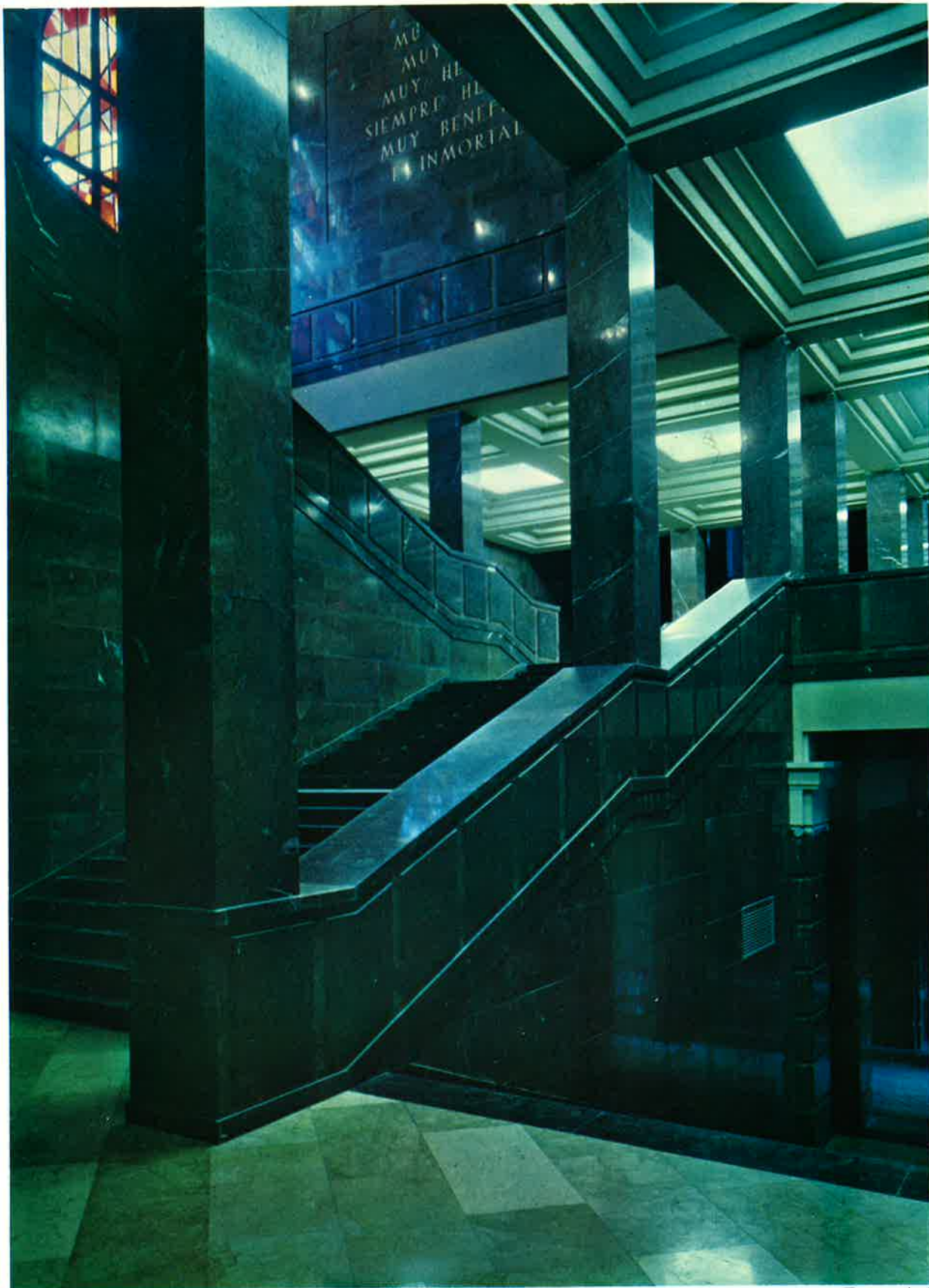
Escalera de honor.