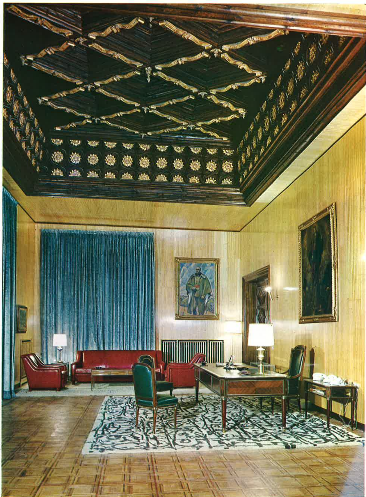
Despacho del Sr. Alcalde.