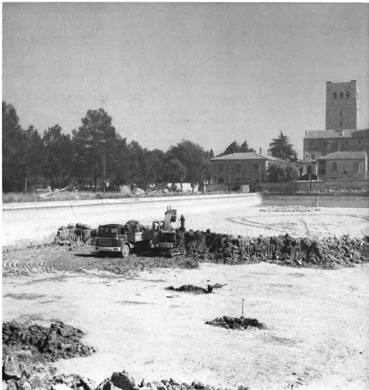
Limpieza de barro en los depósitos del Parque de Pignatelli.