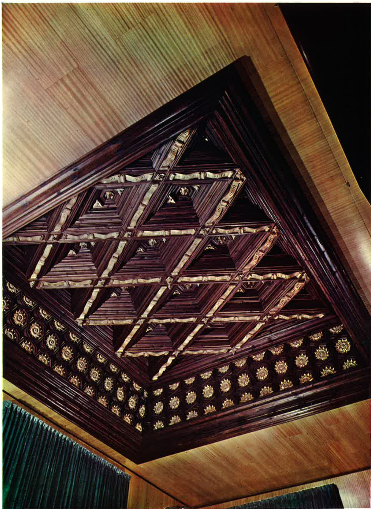
Artesonado del despacho del Sr. Alcalde.