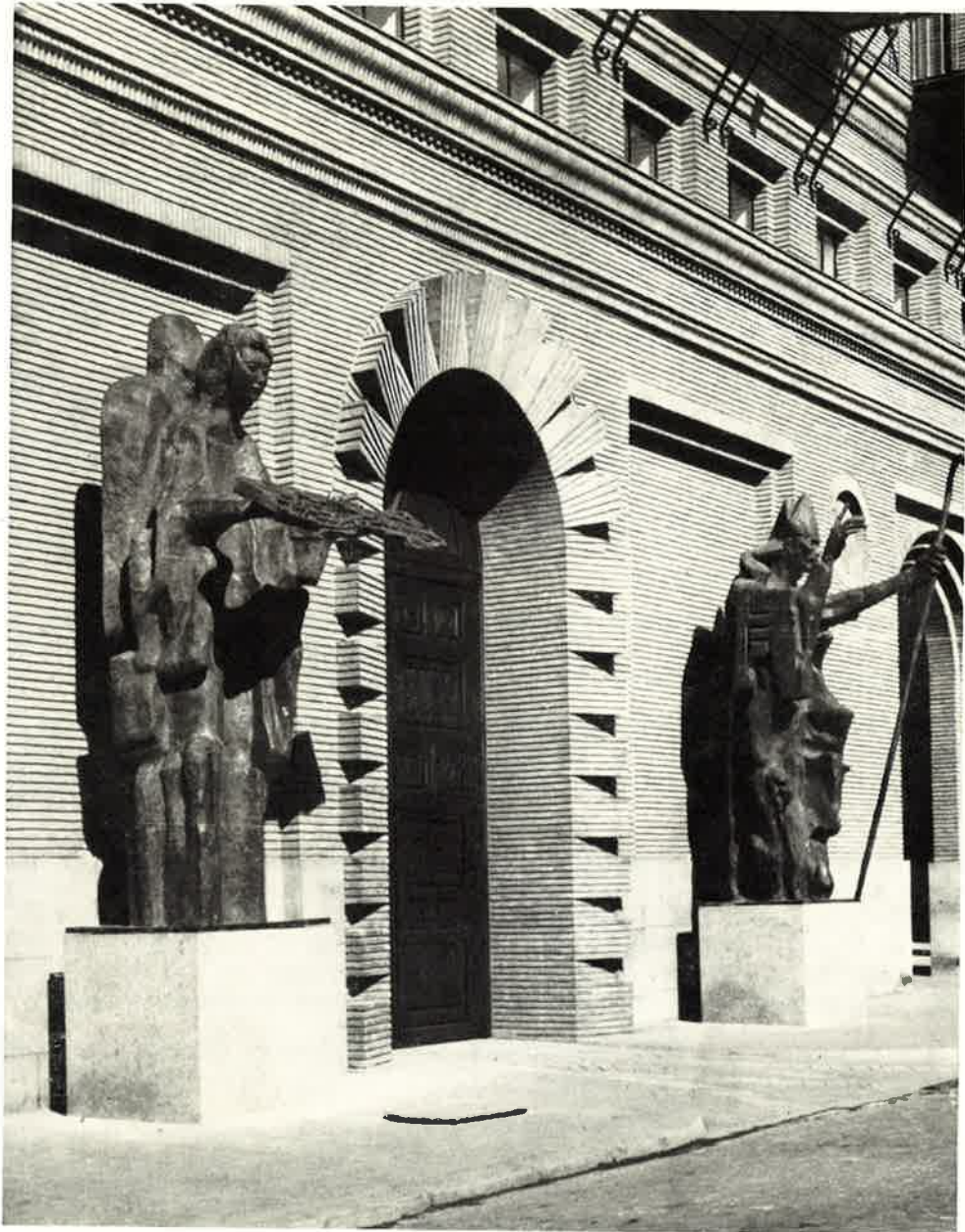
Puerta principal y esculturas de Pablo Serrano.