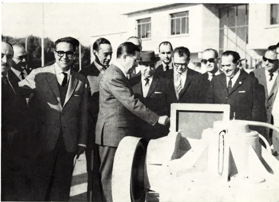
Inauguración de las nuevas instalaciones por el Ministro de Obras Públicas, Excmo. señor don Federico Silva Muñoz.