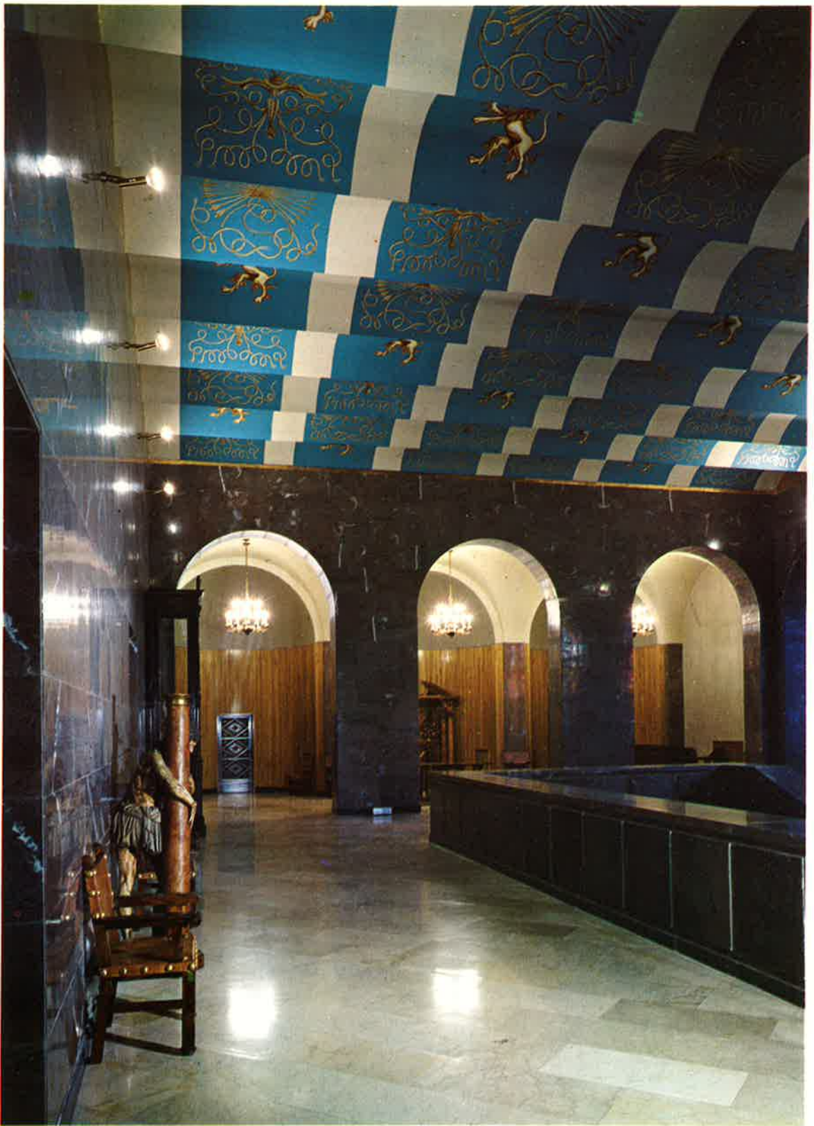
Pasillos de la planta noble.