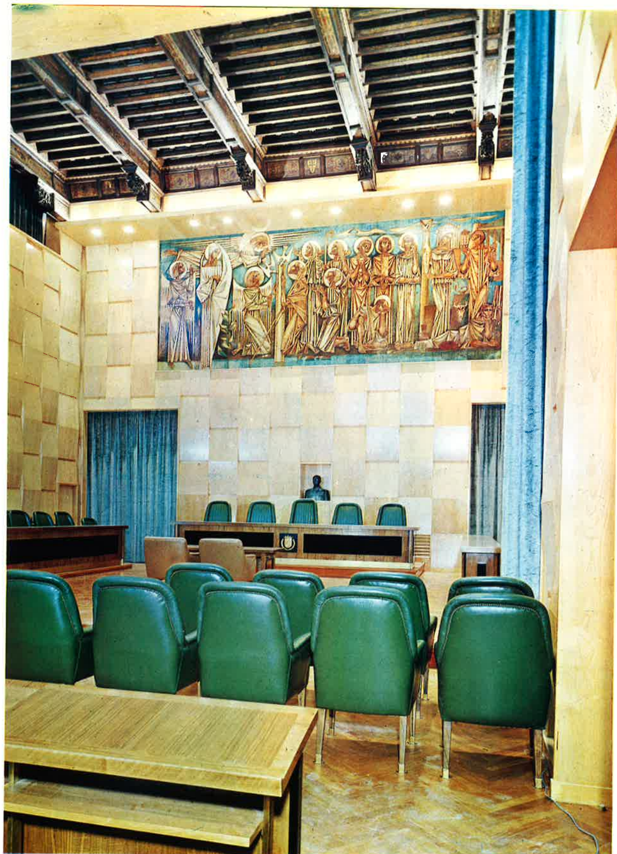
Salón de sesiones.