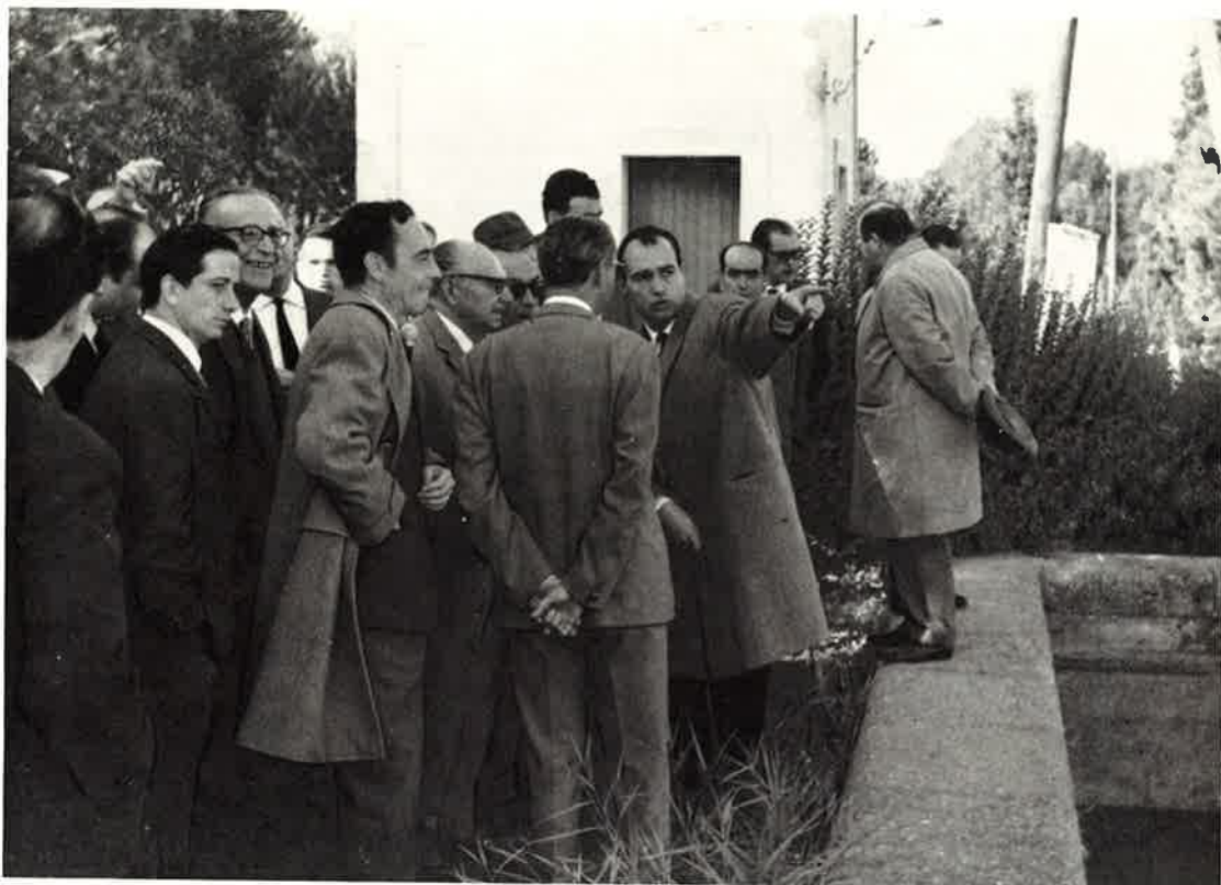
Visita del entonces Ministro de Obras Públicas, Excmo. Sr. D. Jorge Vigón Suero-Díaz, a las obras de la estación clarificadora.