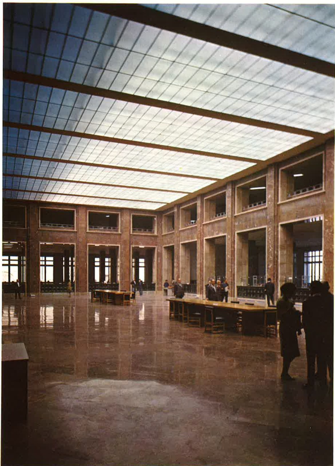
Sala de público.