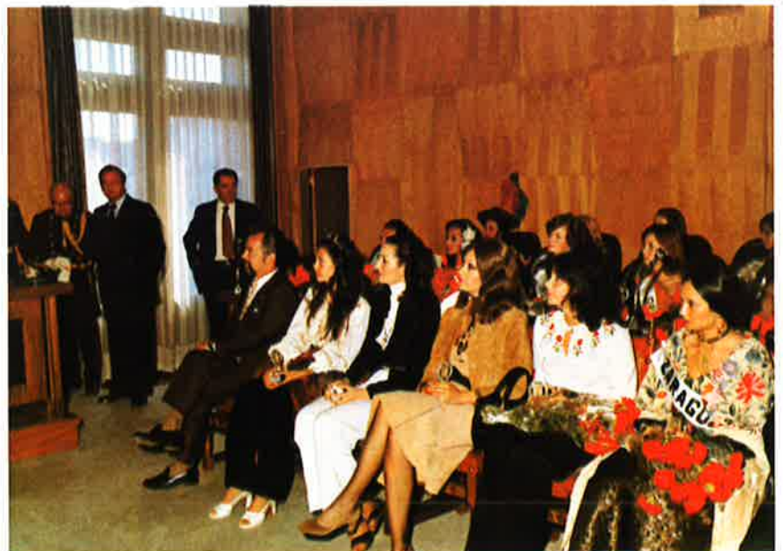
Las «Majas», acompañadas del presidente de la Comisión de Cultura, en el salón de sesiones del Excmo. Ayuntamiento.