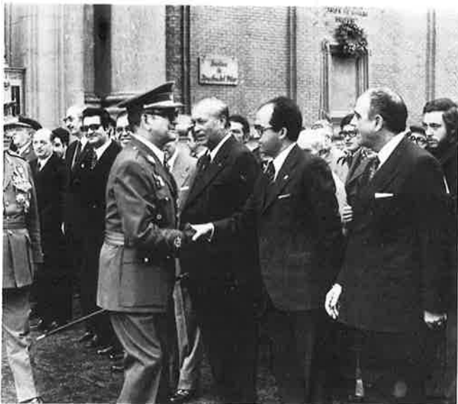
El nuevo Capitán General, D. Manuel de Lara del Cid, saludando a las autoridades, en la puerta de la Basílica del Pilar.