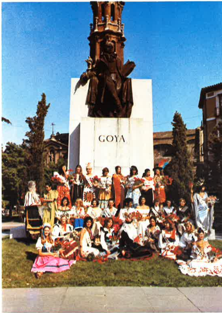
Las «Majas» posando en el monumento a don Francisco de Goya, rindiendo homenaje internacional a la belleza, al genial pintor de Fuentodos, inspirador de la «Maja».