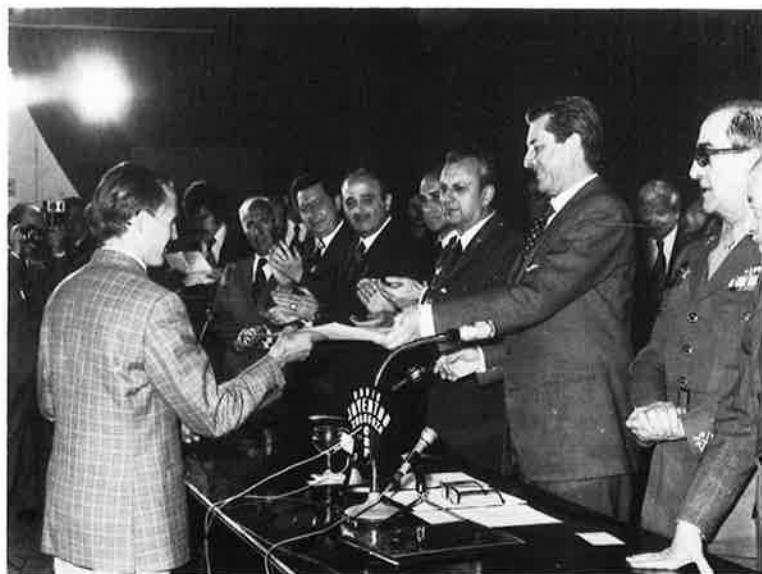
El Ministro de Agricultura, D. Tomás Allende y García-Baxter, repartiendo los premios en «Fima».