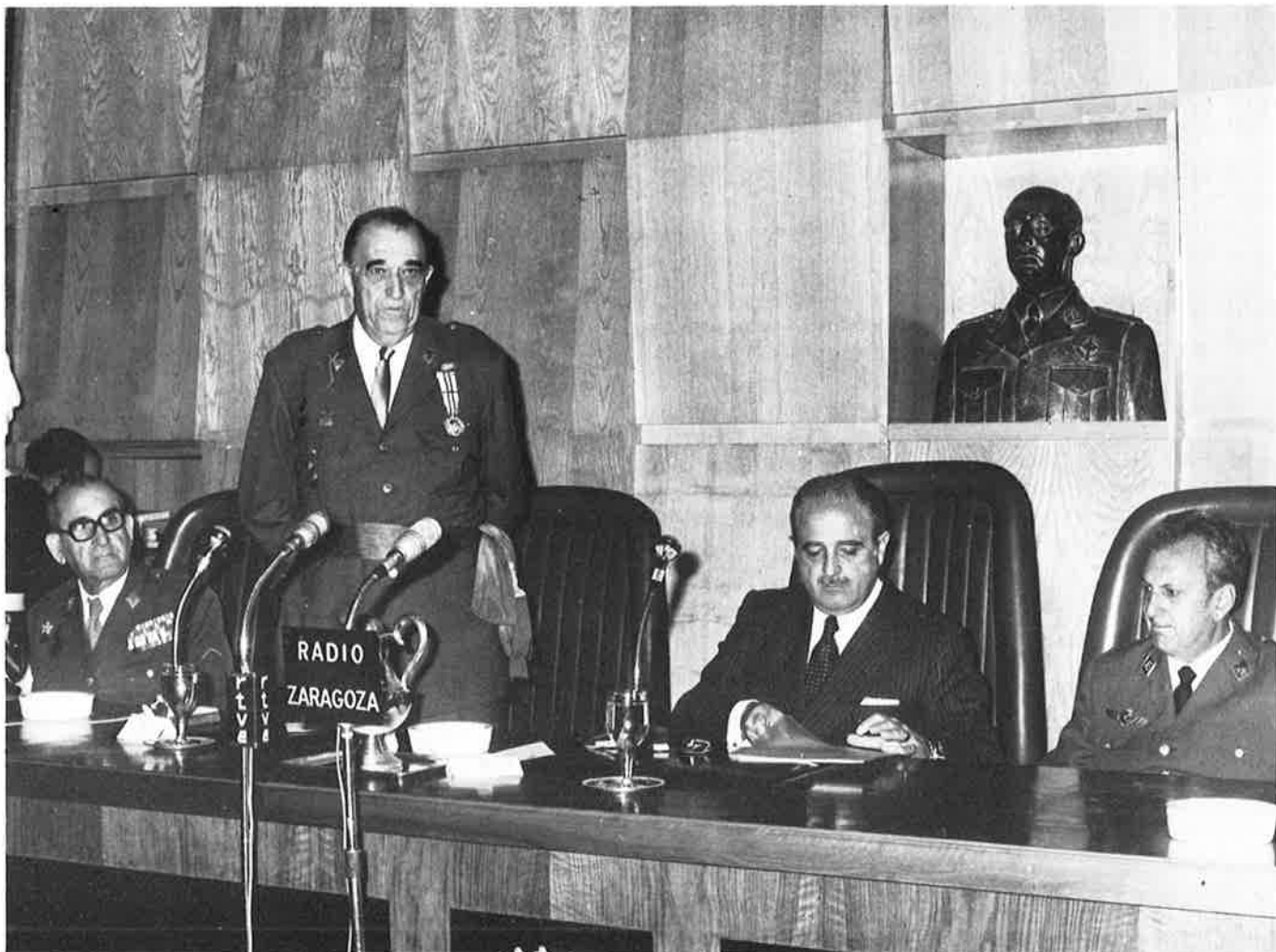
El General Boch de la Barrera agradeciendo el título.

Cuando se acallaron los aplausos con que la intervención del nuevo hijo adoptivo de la ciudad fue acogida, el Alcalde levantó la sesión.