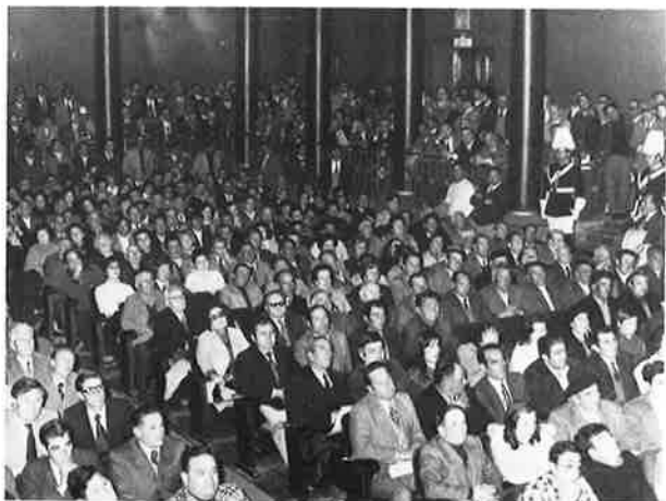
El salón de actos durante la entrega de premios.

Por estos motivos, nuestra política de producciones es bien clara. No vamos a descuidar nuestra agricultura de exportación, pero hemos de poner el acento en lograr un grado deseable de autoabastecimiento a precios competitivos, reduciendo al mínimo posible nuestras importaciones de productos básicos mediante una más plena y mejor utilización de nuestros propios recursos y teniendo siempre presente que los hombres son el principal activo de nuestra agricultura.