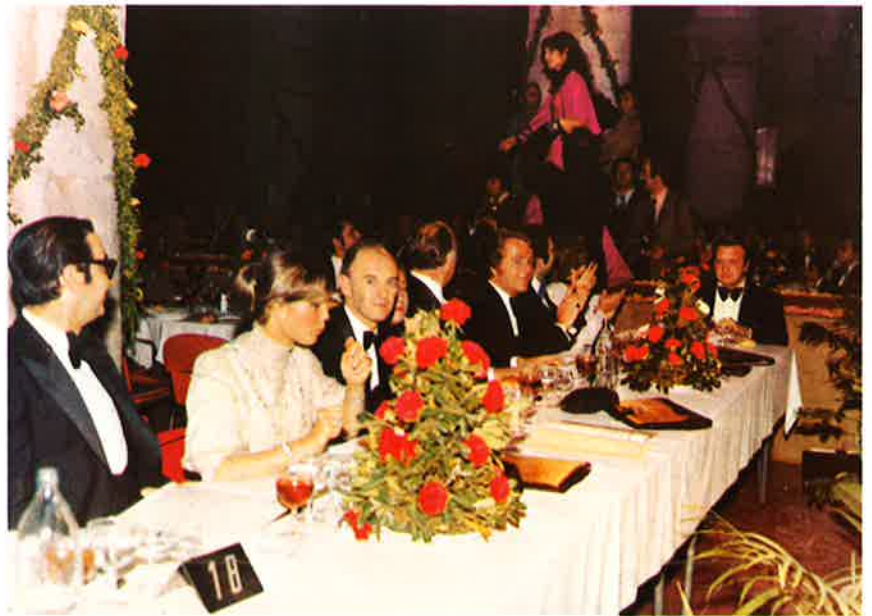
El jurado que en el Palacio de la Lonja eligió a la «Maja Internacional» 1975.