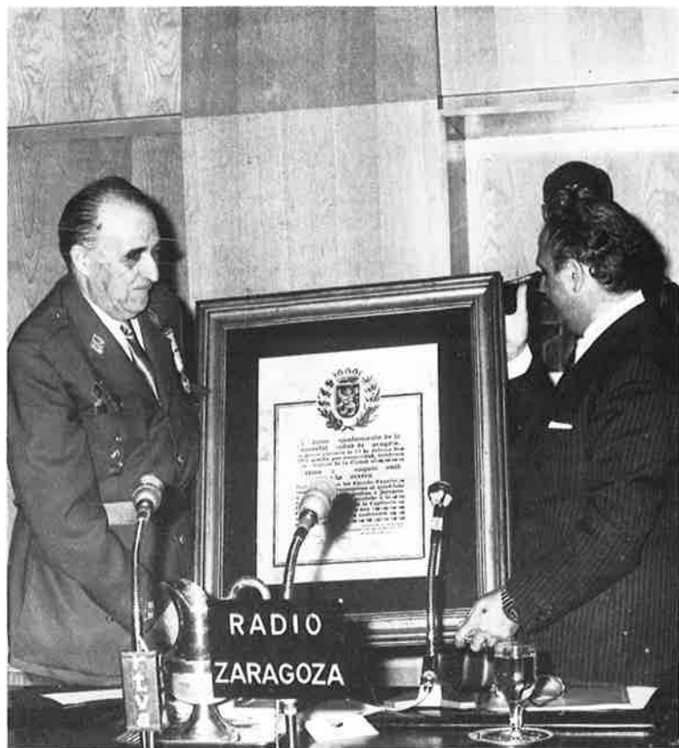
El General, recibiendo de manos del Alcalde el título de hijo adoptivo.