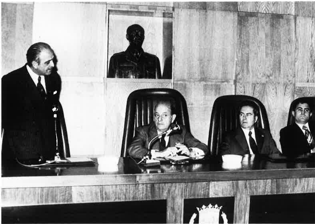
El Alcalde, Sr. Horno Liria, pronunciando unas palabras con motivo de la clausura de las IV Jornadas de Estudio de los Problemas de los Barrios.

tra marcha con las obras de agua y vertido, a punto de ser una feliz realidad culminada. Acometimos después la planificación para paliar el caos y la anarquía que amenazan asfixiar la futura expansión y el desarrollo de nuestra ciudad; hemos, por consiguiente, de planificar con un amplio sentido de comarcalización.