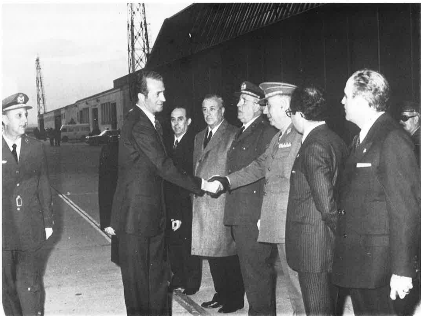
S. A. R. el Príncipe de España, saludando a las autoridades que fueron a recibirle a su llegada a Zaragoza.