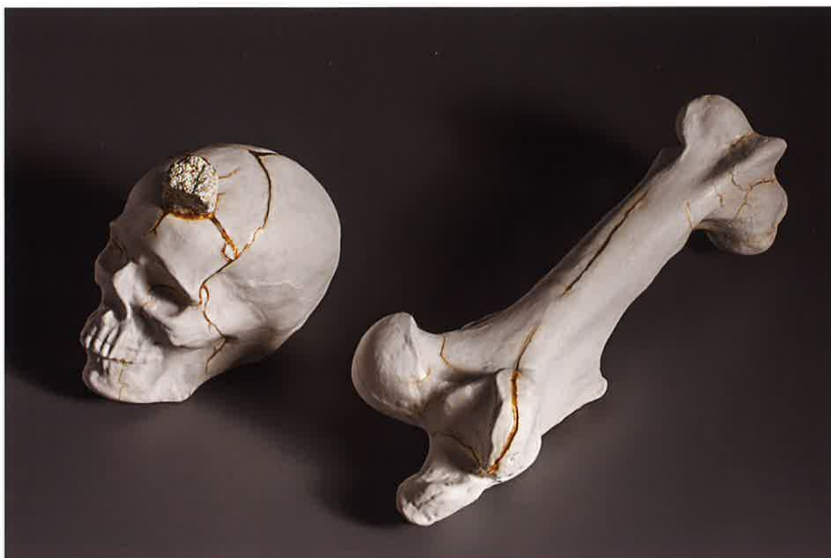
Muerte Kintsugi , 2017. Porcelana, resina y oro, medidas variables.