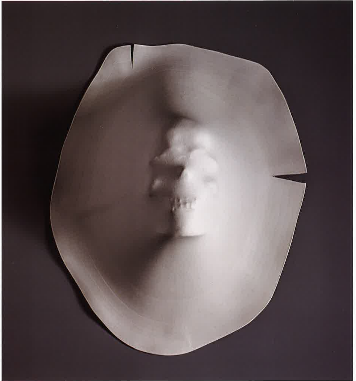
Espectro , 2017. Porcelana, 16 x 33 x 43