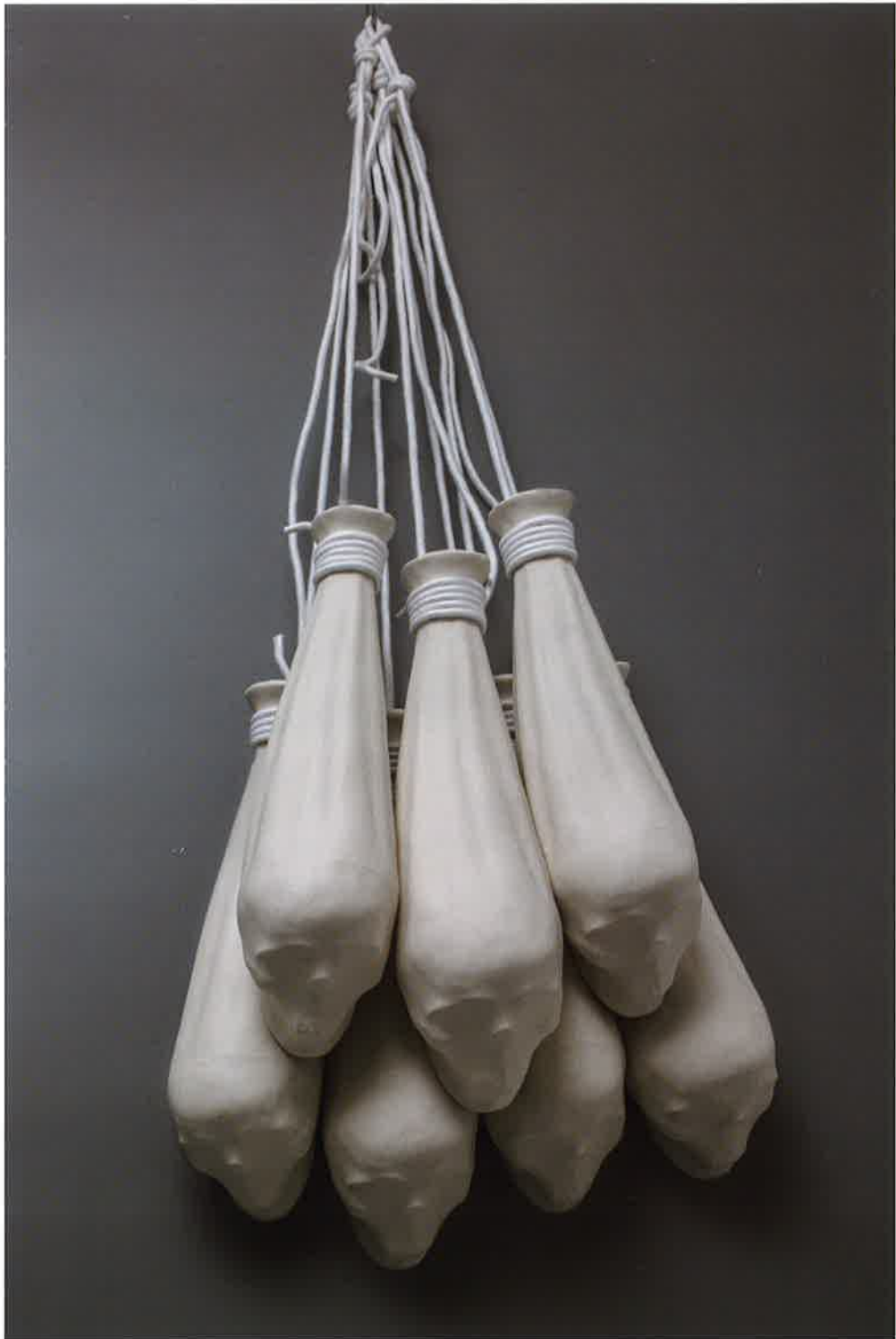
Descenso espectral, 2017. Porcelana y cuerda, medidas variables