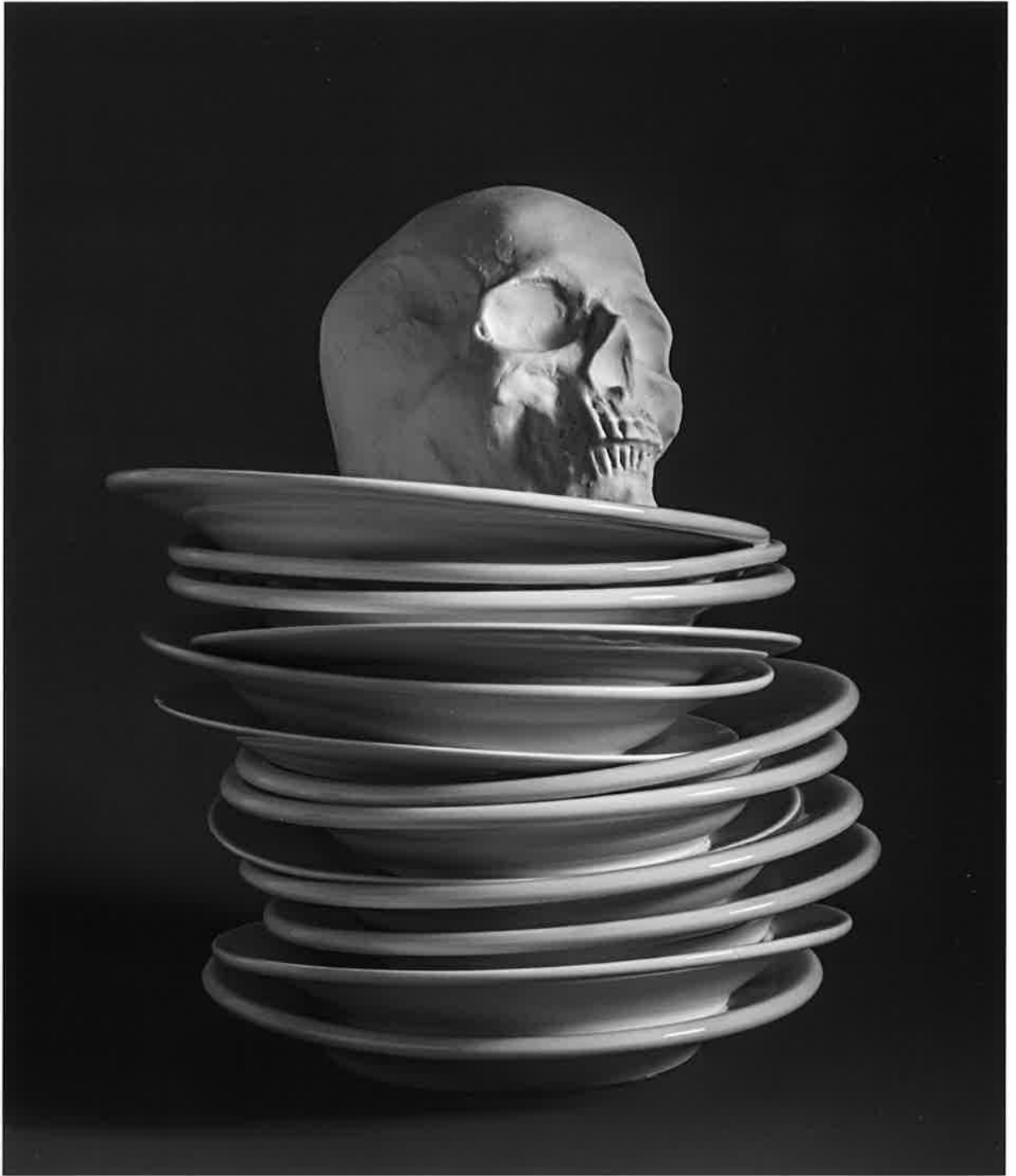
La última cena (detalle)