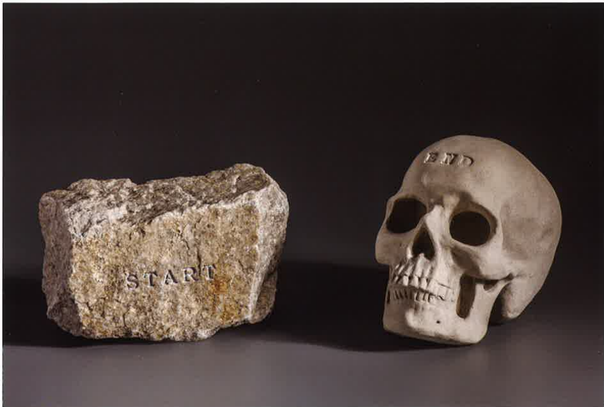
Start-End , 2017. Cuarcita del periodo Cámbrico, gres y fanales, 23 x 37,5 c.u