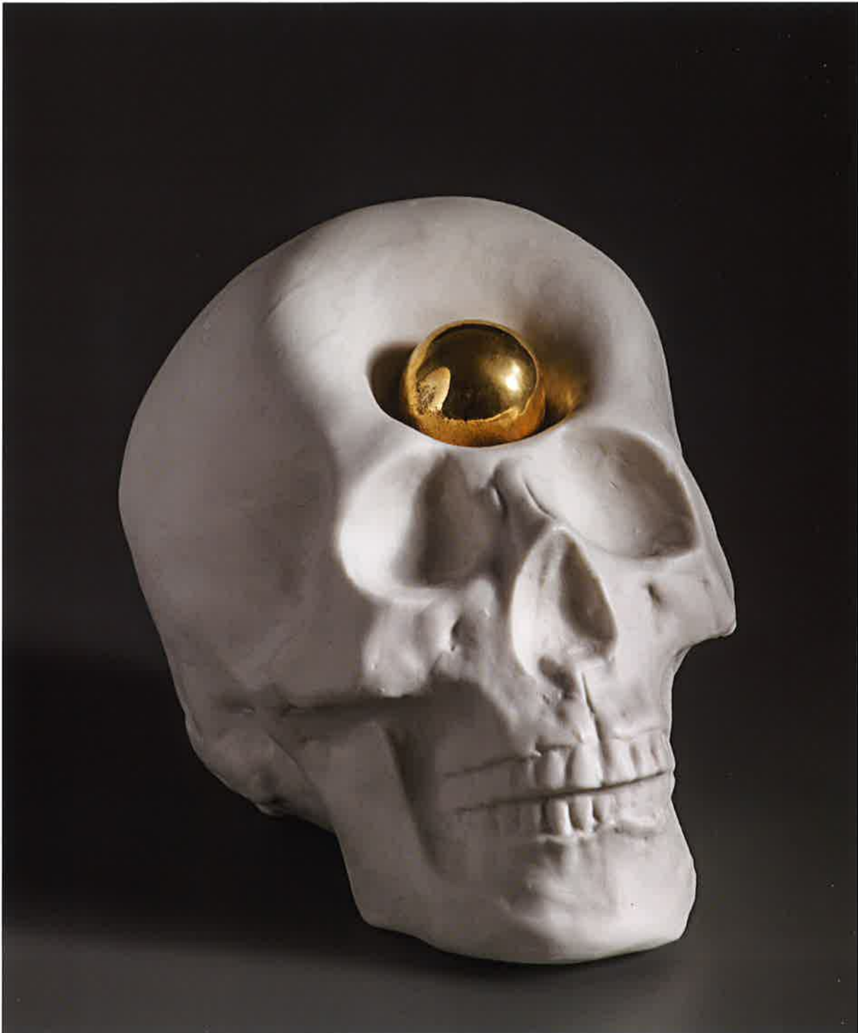
Impacto esférico II, 2017 Gres, porcelana y lustre, 19 x 12 x 11