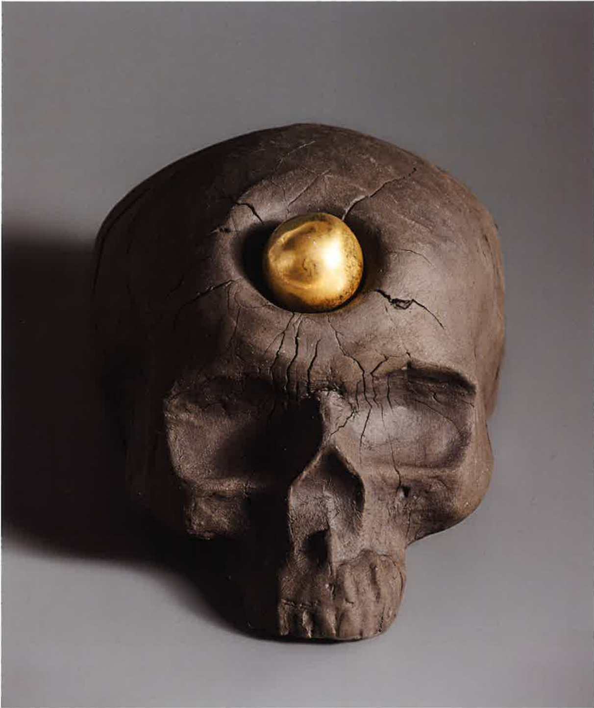
Impacto esférico I , 2017. Gres, porcelana y lustre, 11 x 12 x 19