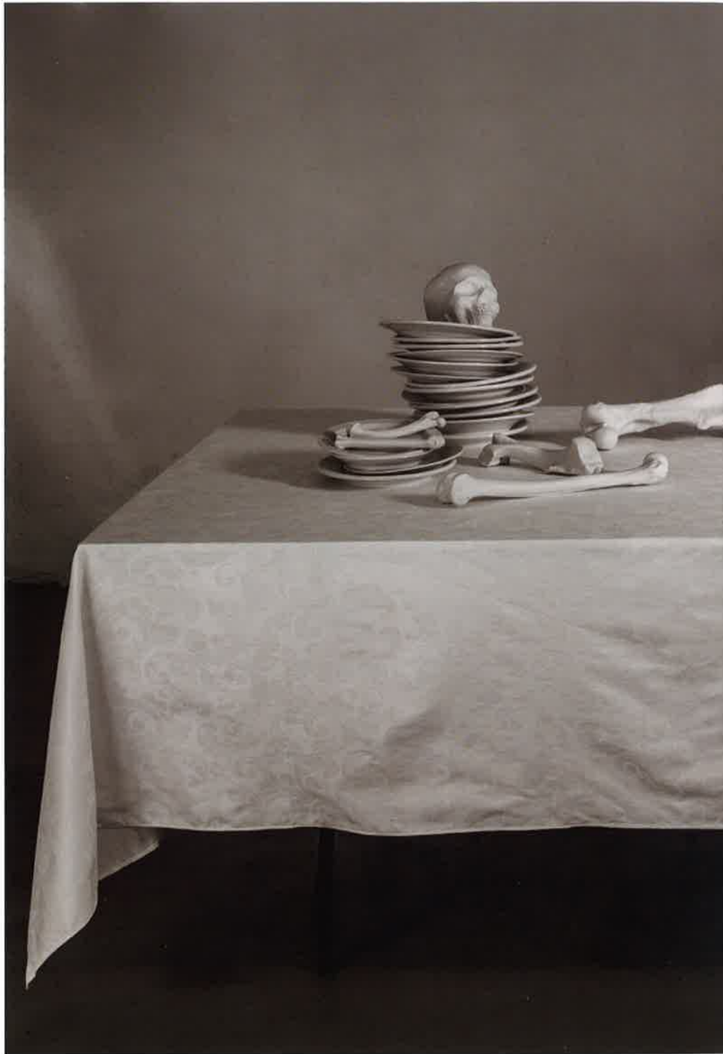
La última cena, 2017. Porcelana y esmalte. Candelabro, mesa y mantel. Medidas variables