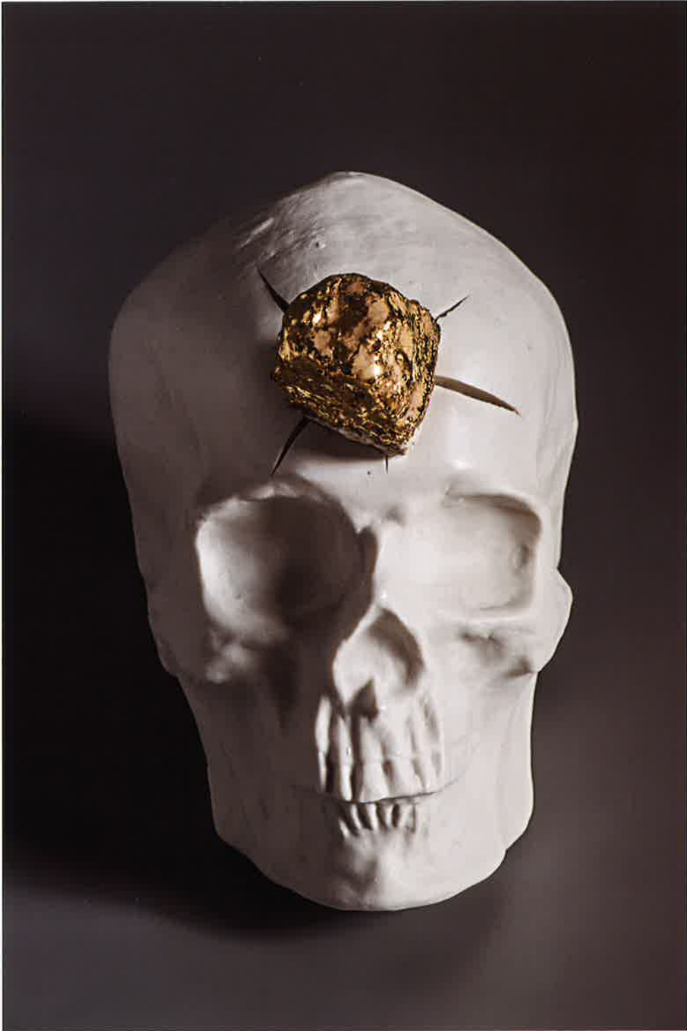
Apedreado I , 2017 Porcelana y cuarcita esmaltada, 11x 17 x 15