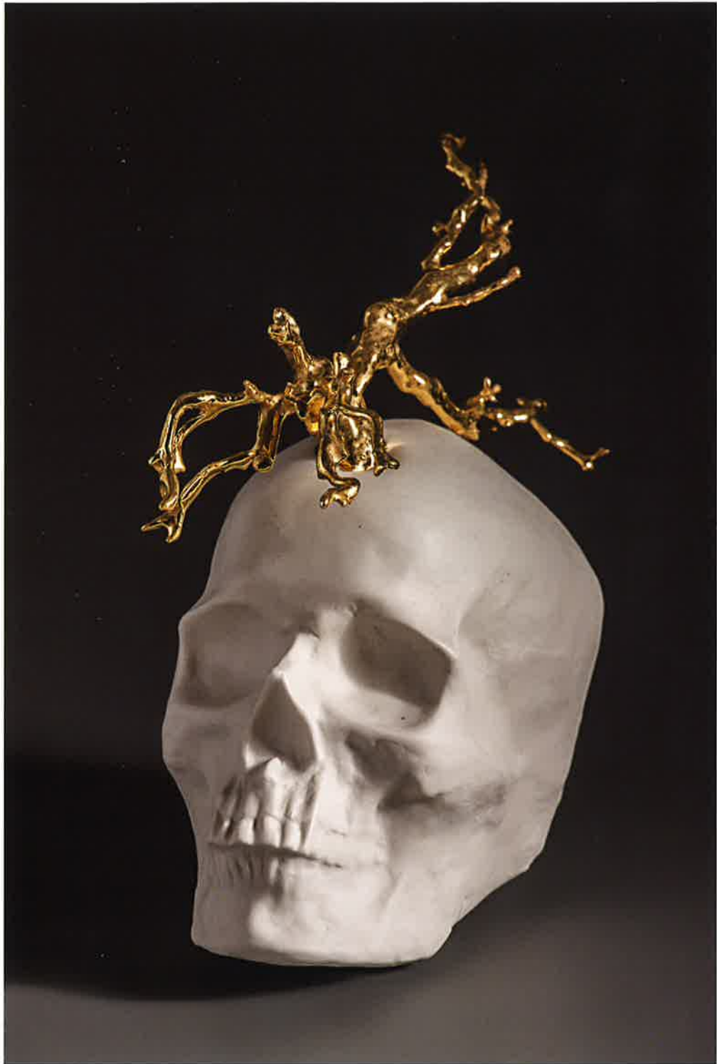
Vida sobre muerte , 2017. Porcelana y lustre, 11 x 19 x 20