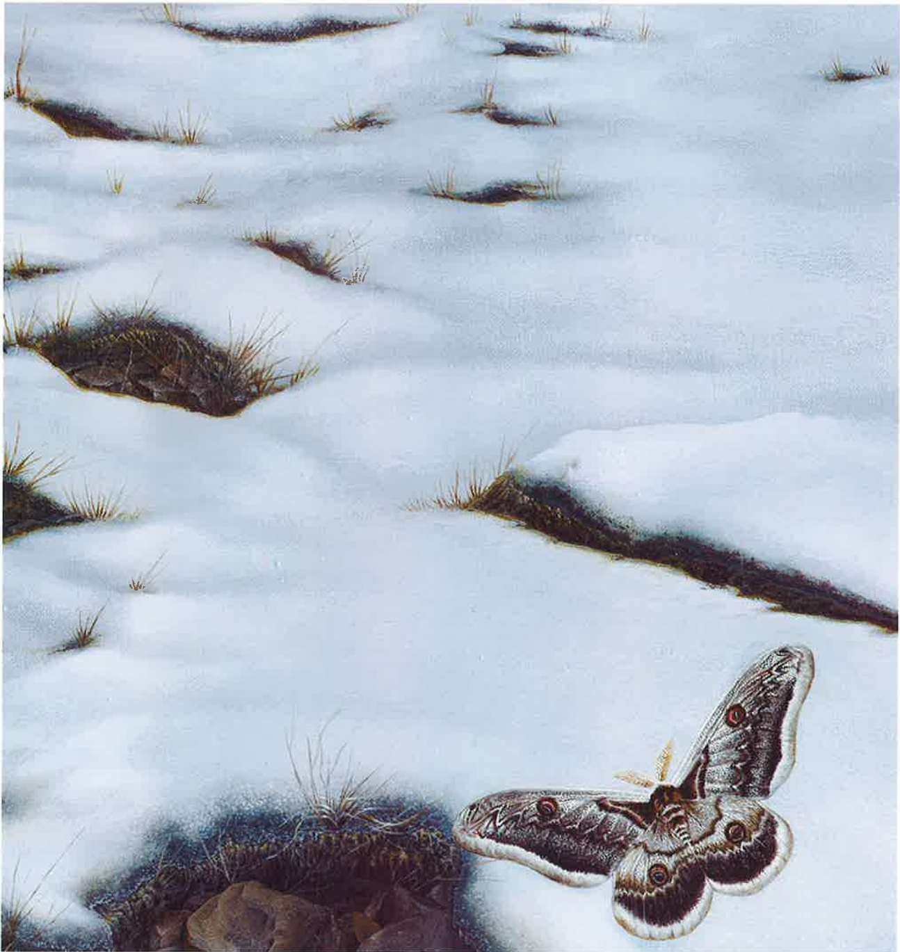
Polvo de diamante (detalles), 2016. Acrílico sobre lino, 87 x 277