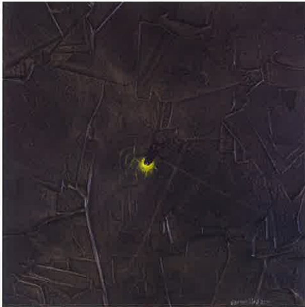
Firefly X , 2016. Acrílico sobre tabla, 20 x 20