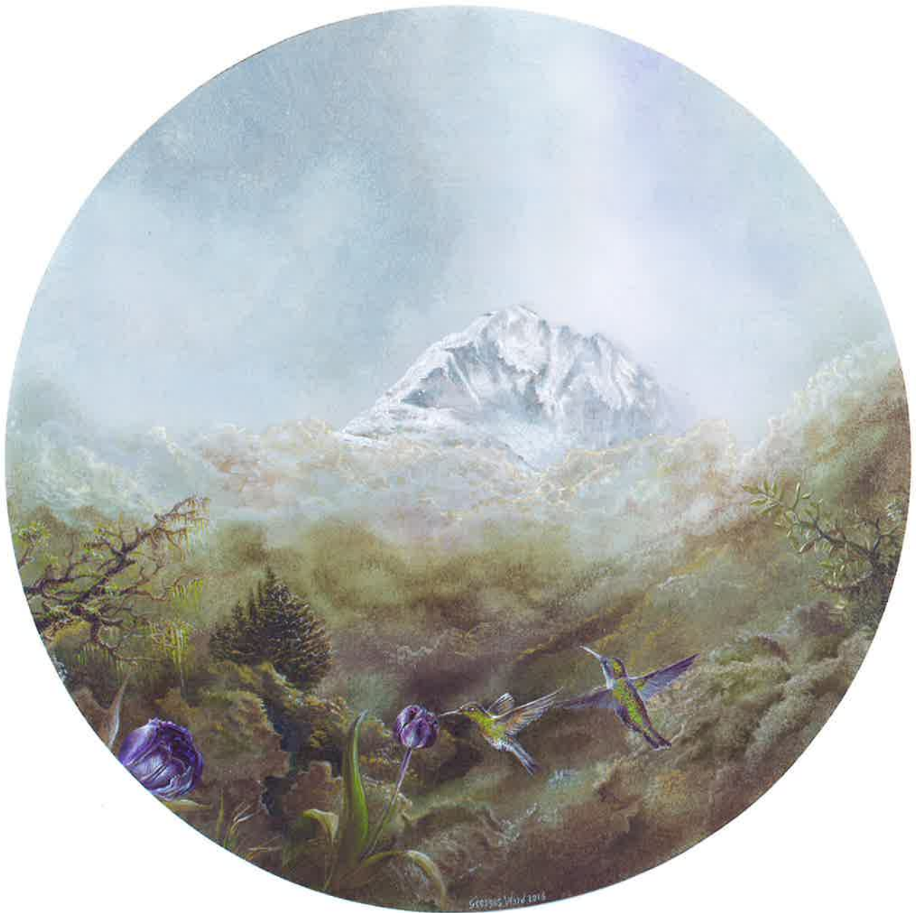
Aneto , 2016. Acrílico sobre tabla, 31 Ø