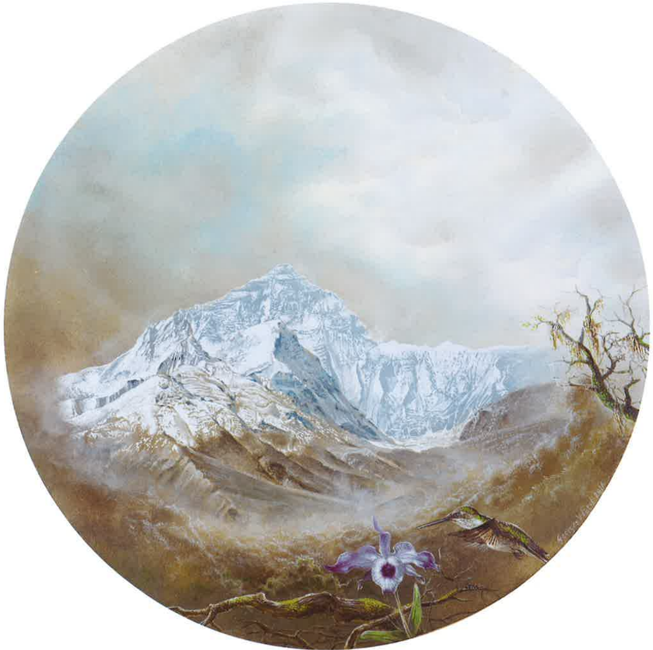
Everest , 2016. Acrílico sobre tabla, 31 Ø