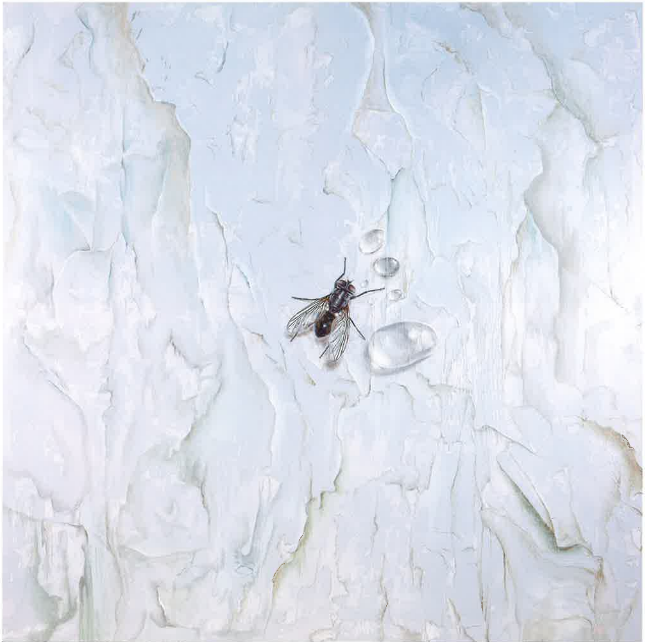
Fly on the wall , 2016. Acrílico sobre tabla, 150 x 150