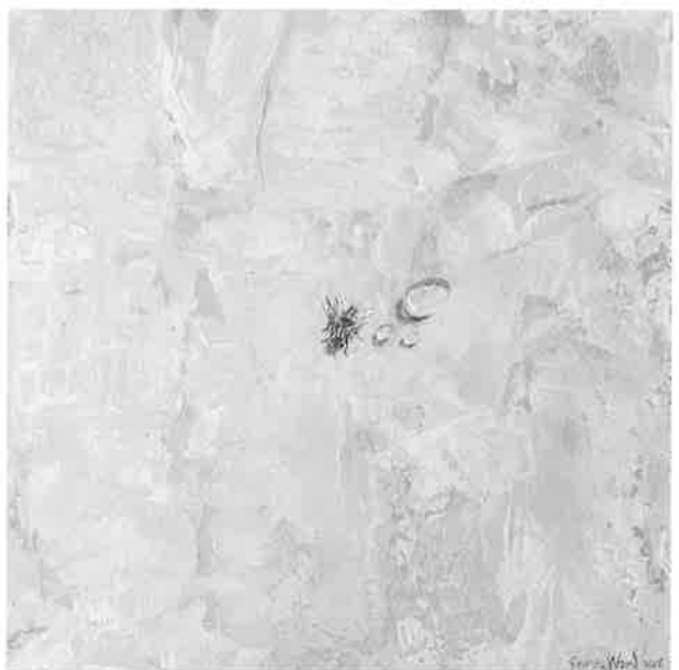
Fly I , 2016. Acrílico sobre tabla, 20 x 20 Fly III , 2016. Acrílico sobre tabla, 20 x 20