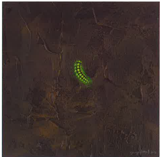
Firefly V , 2016. Acrílico sobre tabla, 20 x 20 Firefly VII , 2016. Acrílico sobre tabla, 20 x 20