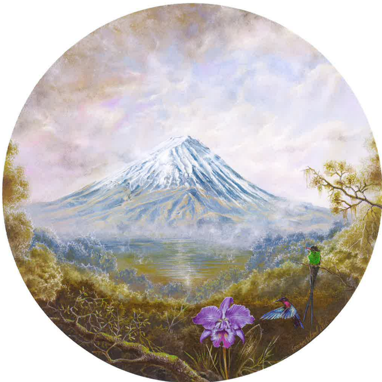
Fujiyama , 2016. Acrílico sobre tabla, 31 Ø