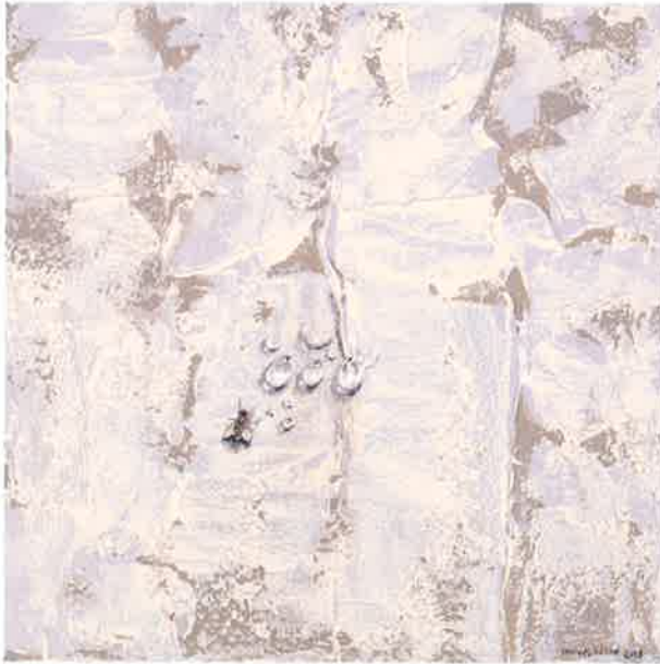
Crane-fly IX , 2016. Acrílico sobre tabla, 20 x 20