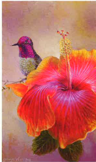
Herbario I , 2015 Acrílico sobre tabla, 13,5 x 8,2