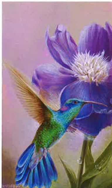
Herbario LXIV , 2016 Acrílico sobre tabla, 13,5 x 8,2