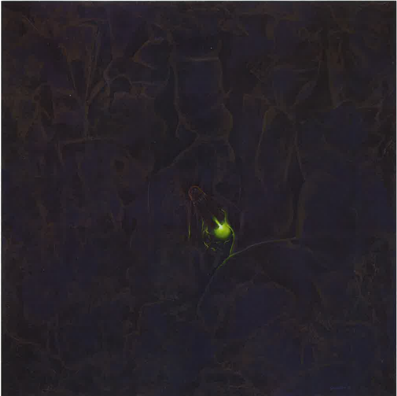
Firefly on the wall , 2016. Acrílico sobre tabla, 150 x 150.