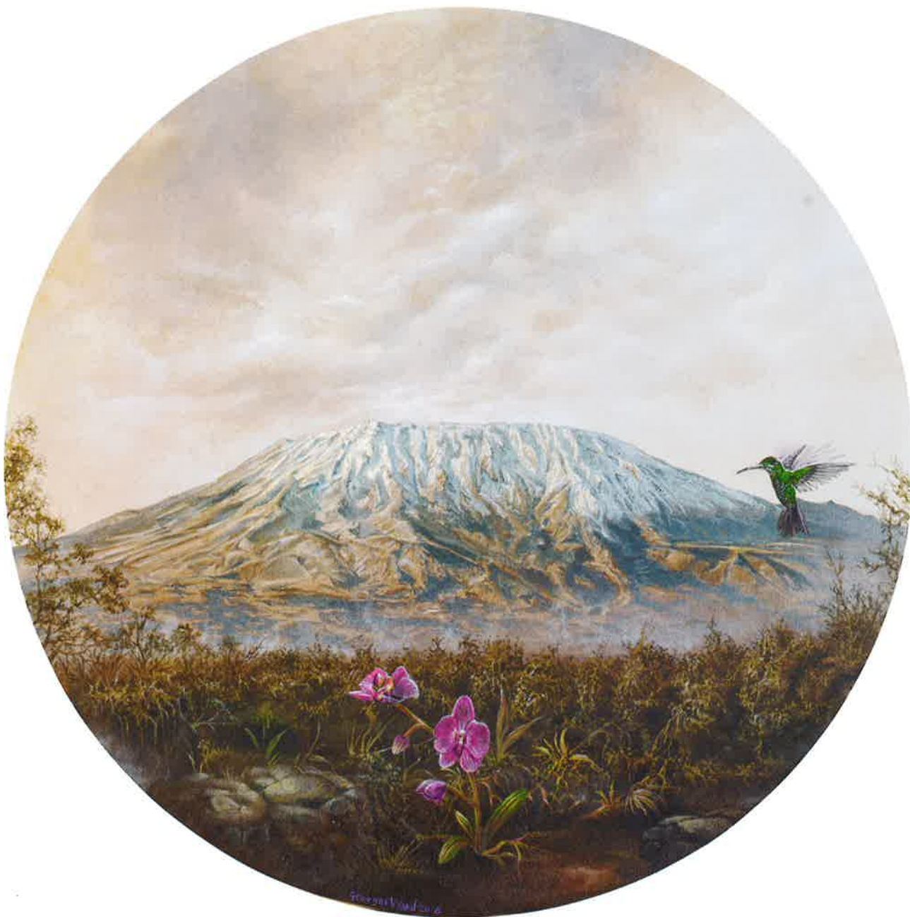
Kilimanjaro , 2016. Acrílico sobre tabla, 31 Ø