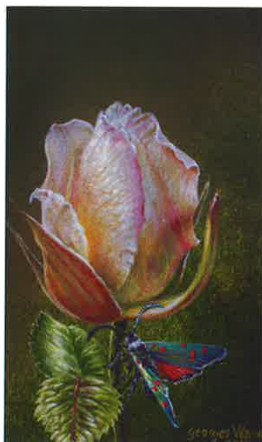
Herbario XLVII , 2015 Acrílico sobre tabla, 13,5 x 8,2