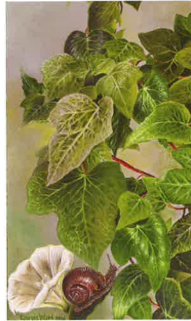
Herbario LX , 2016 Acrílico sobre tabla, 13,5 x 8,2