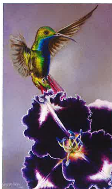
Herbario LIV , 2016 Acrílico sobre tabla, 13,5 x 8,2