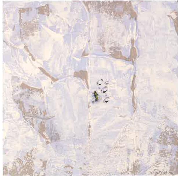
Fly V , 2016. Acrílico sobre tabla, 20 x 20 Fly VII , 2016. Acrílico sobre tabla, 20 x 20