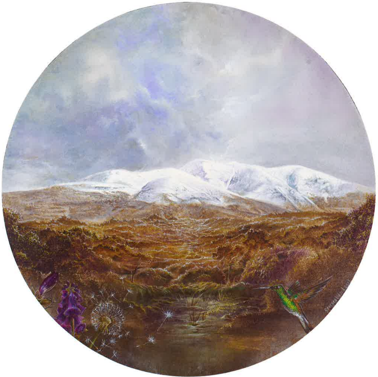
Moncayo II , 2016. Acrílico sobre tabla, 31 Ø