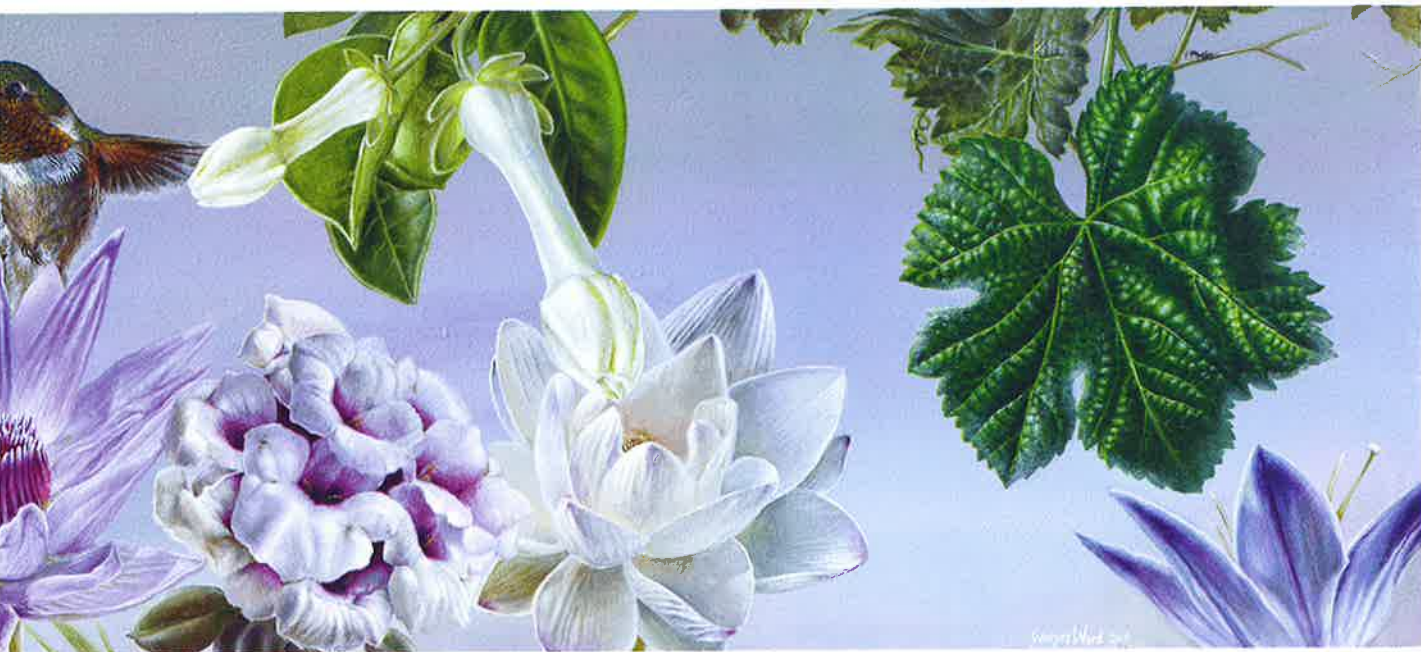
The garden of the sun II , 2016. Acrílico sobre tabla, 20 x 92