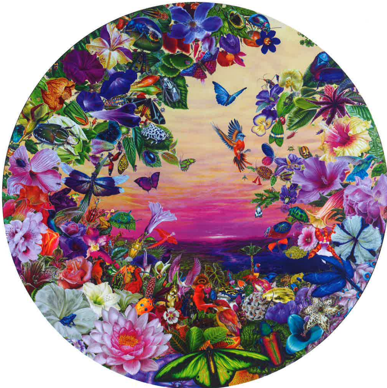
Biosfera , 2015. Acrílico sobre tabla, 121 Ø