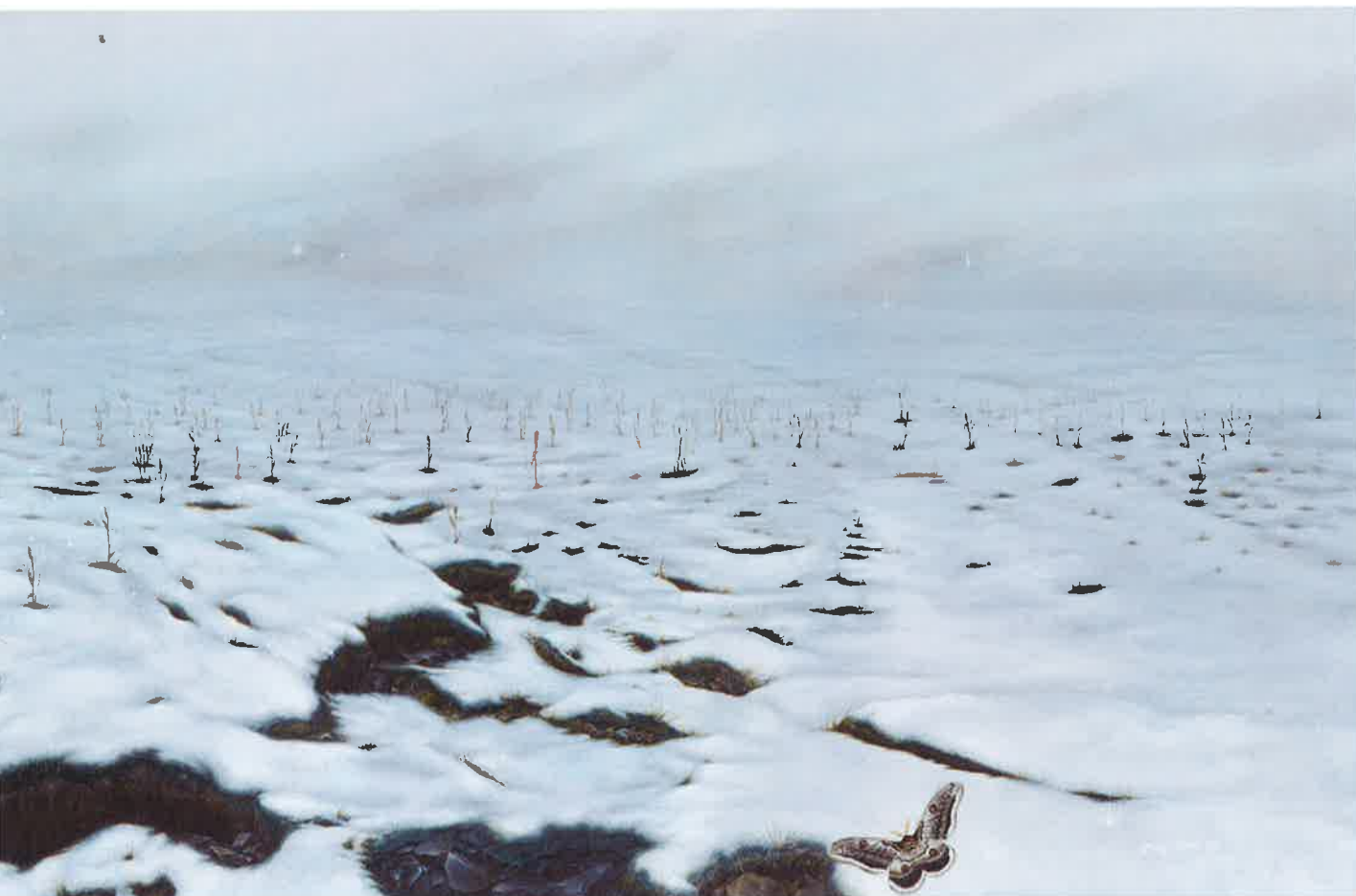
Polvo de diamante , 2016. Acrílico sobre lino, 87 x 277