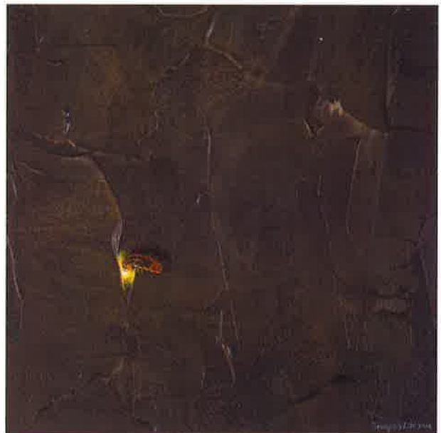
Firefly I , 2016. Acrílico sobre tabla, 20 x 20 Firefly III , 2016. Acrílico sobre tabla, 20 x 20