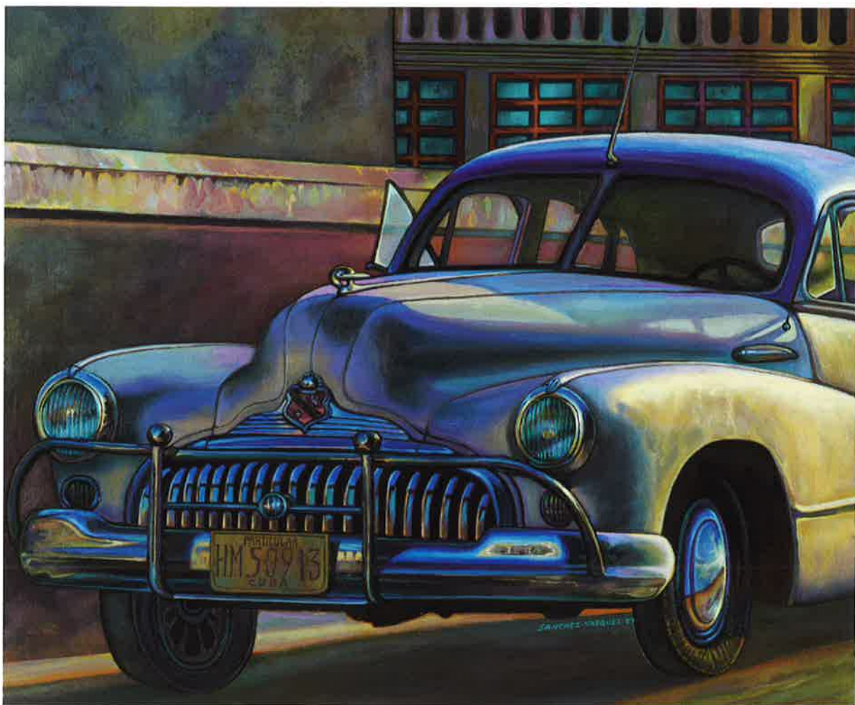
Buick , 2009. Óleo/lienzo, 60 x 70