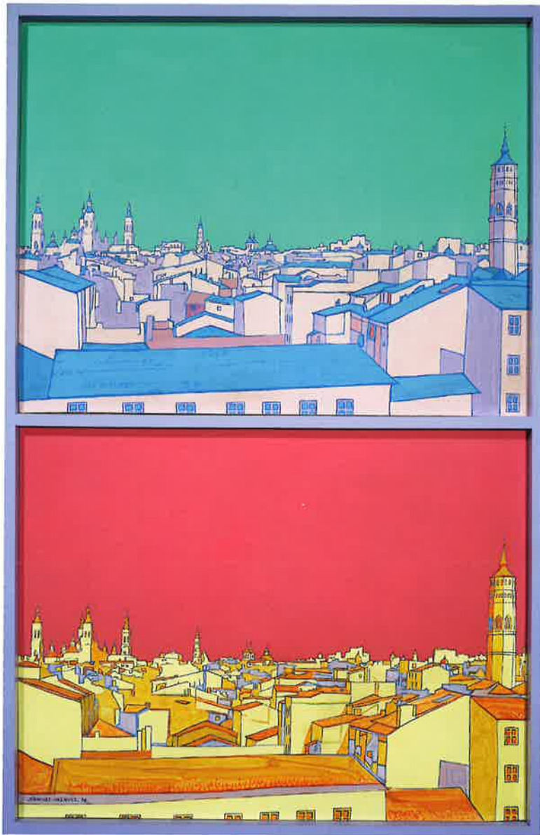
Desde mi estudio , 1978. Acrílico/tabla, 100 x 65