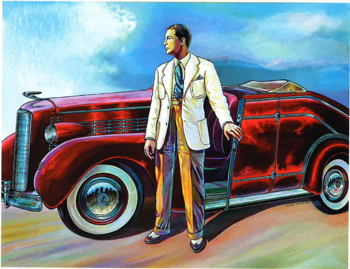
Robert Taylor en su Lasalle , 2000. Óleo/lienzo, 89 x 116