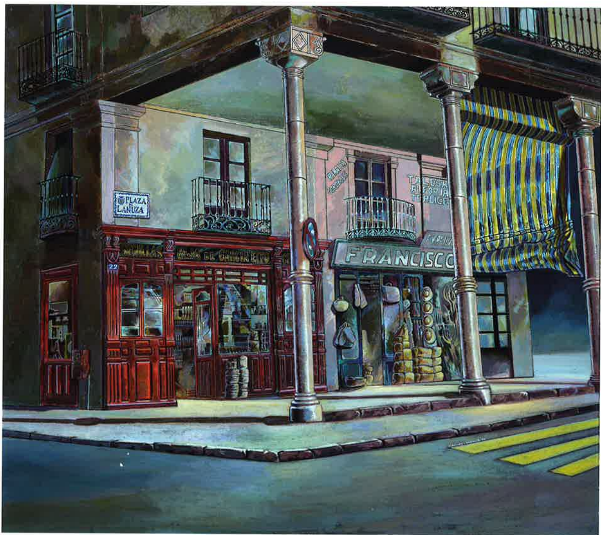
Semillas hija de García Eito, 1997. Acrílico/tabla, 122 x 137