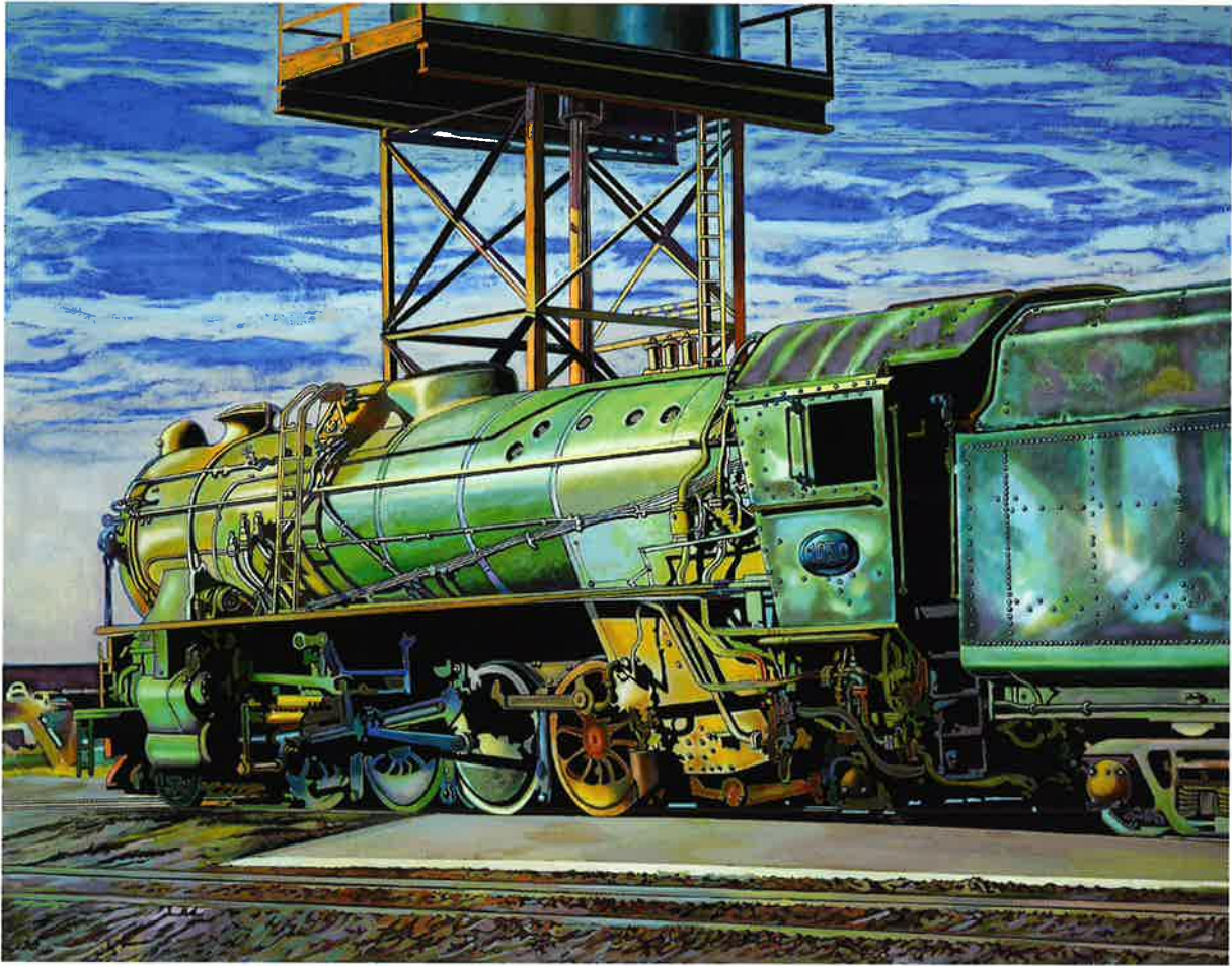
Locomotora 1950, 2016. Óleo/lienzo, 114 x 146