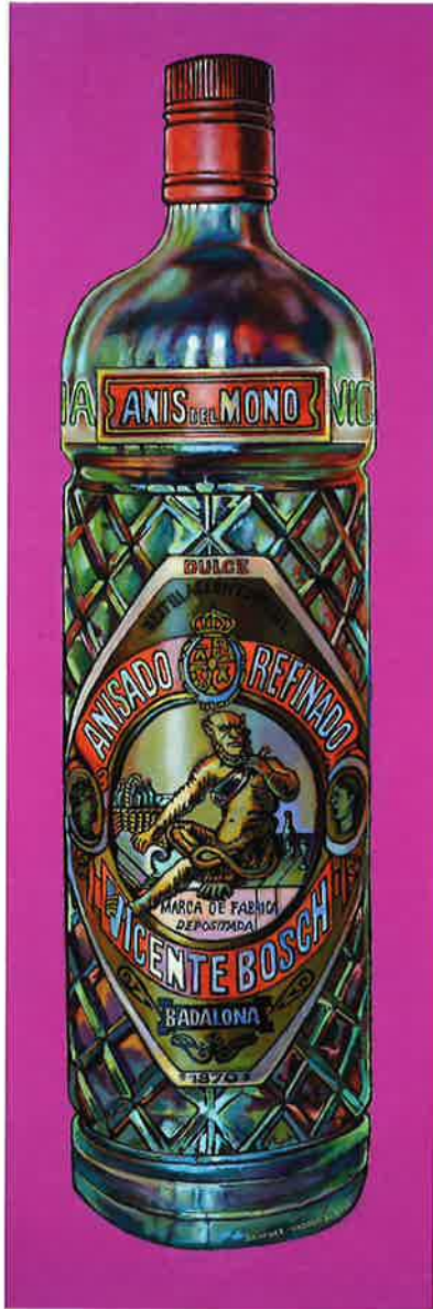
Anís del mono , 2010. Óleo/tabla, 62 x 20