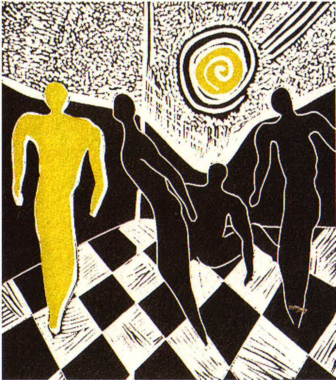
El sol amarillo , 1991. Linograbado, 38 x 33