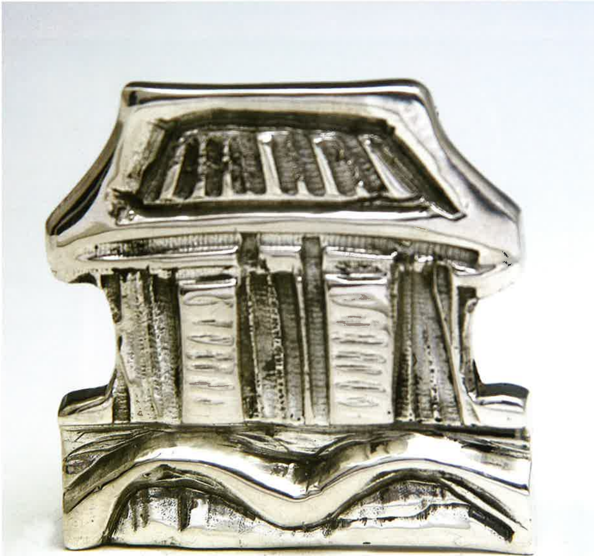
Templo , 2004. Plata, 3,5 x 3,5 x 0,8