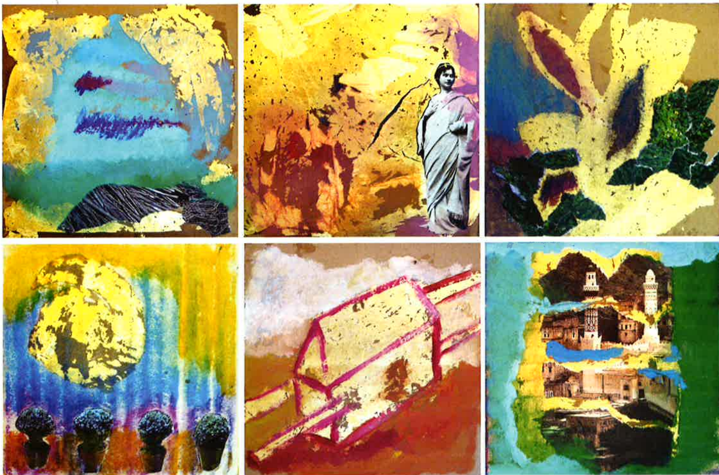
Visiones , 1994. Técnica mixta (6 piezas), 14,5 x 14,5 c/u