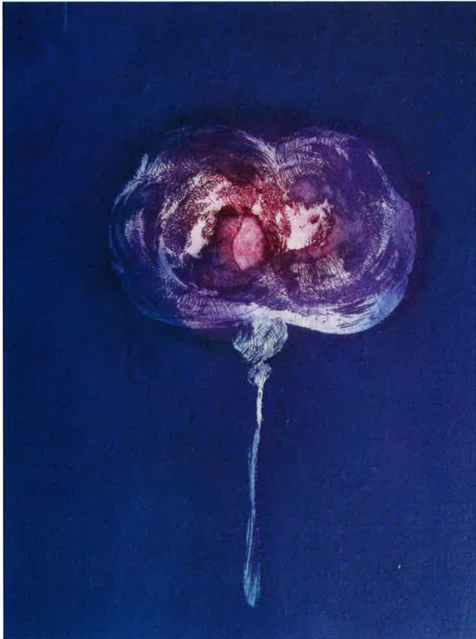
Flor 2 , 2007. Aguafuerte y aguatinta sobre plancha de zinc, 32,5 x 24