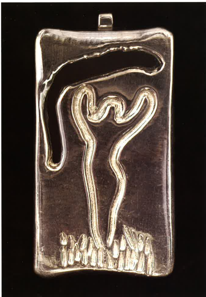
Bailarín , 2004. Plata, 6,5 x 3,3 x 0,2