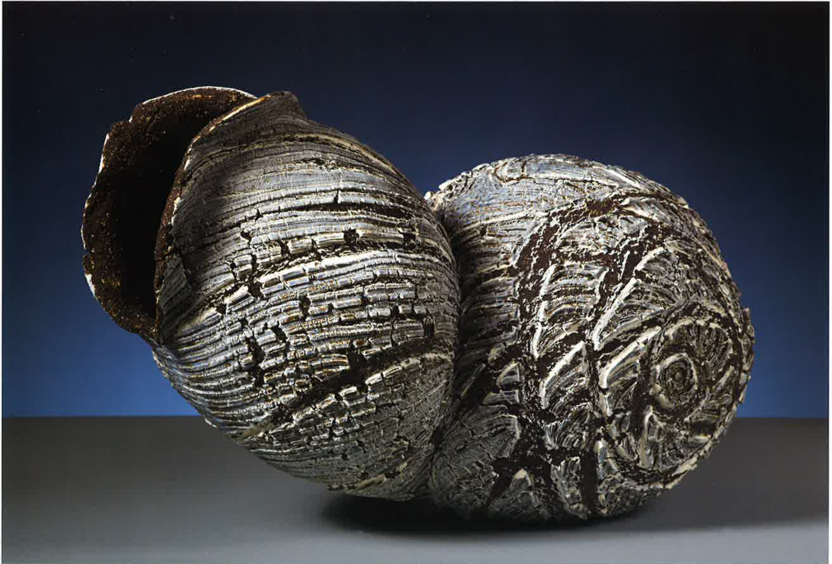
Arcano abisal , 2012. Gres expandido 1260°, 30 x 48 x 28