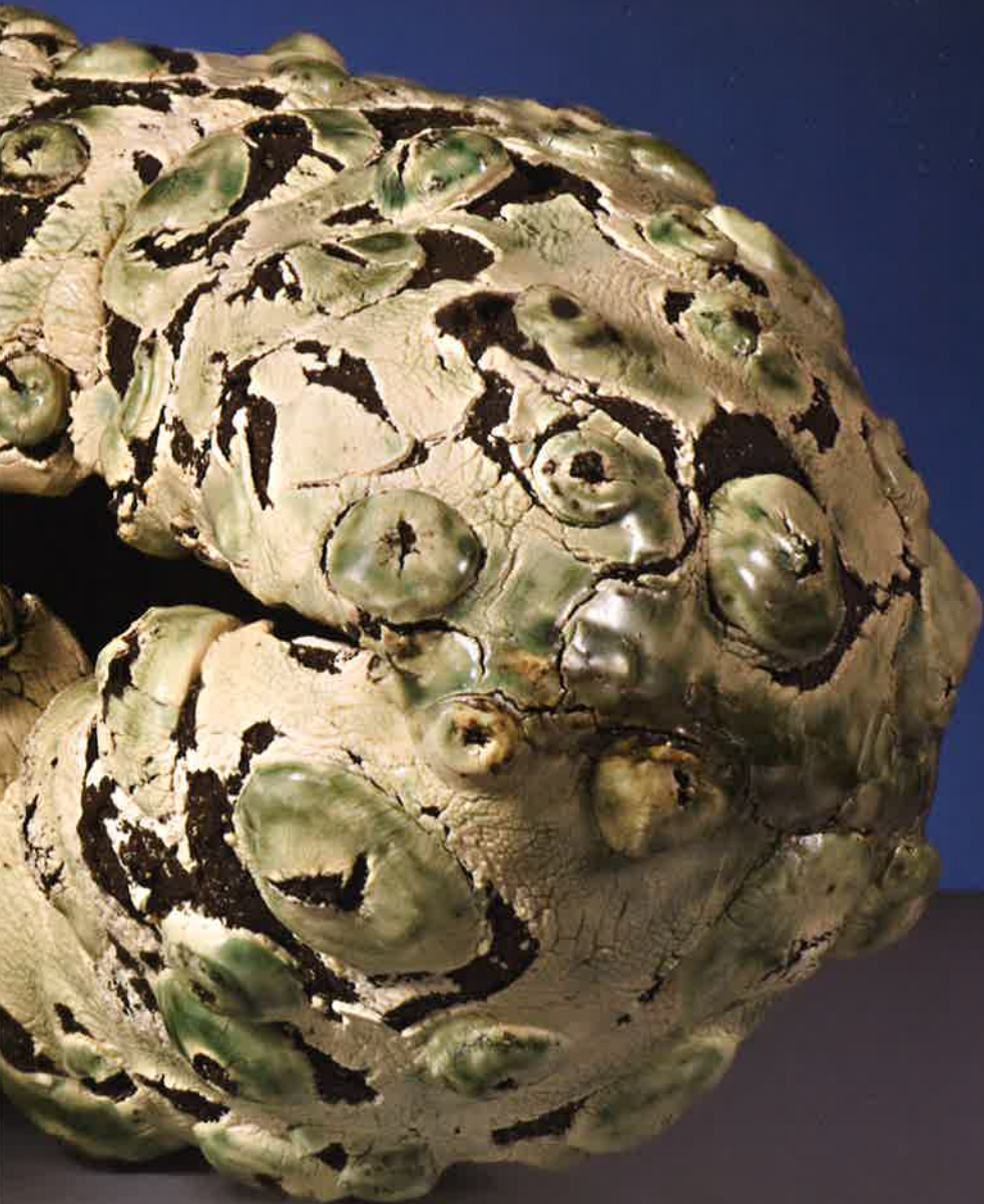
Amenaza compartida , 2012. Gres expandido 1260º, dos piezas de 25 x 50 x 25 y 24 x 41 x 31