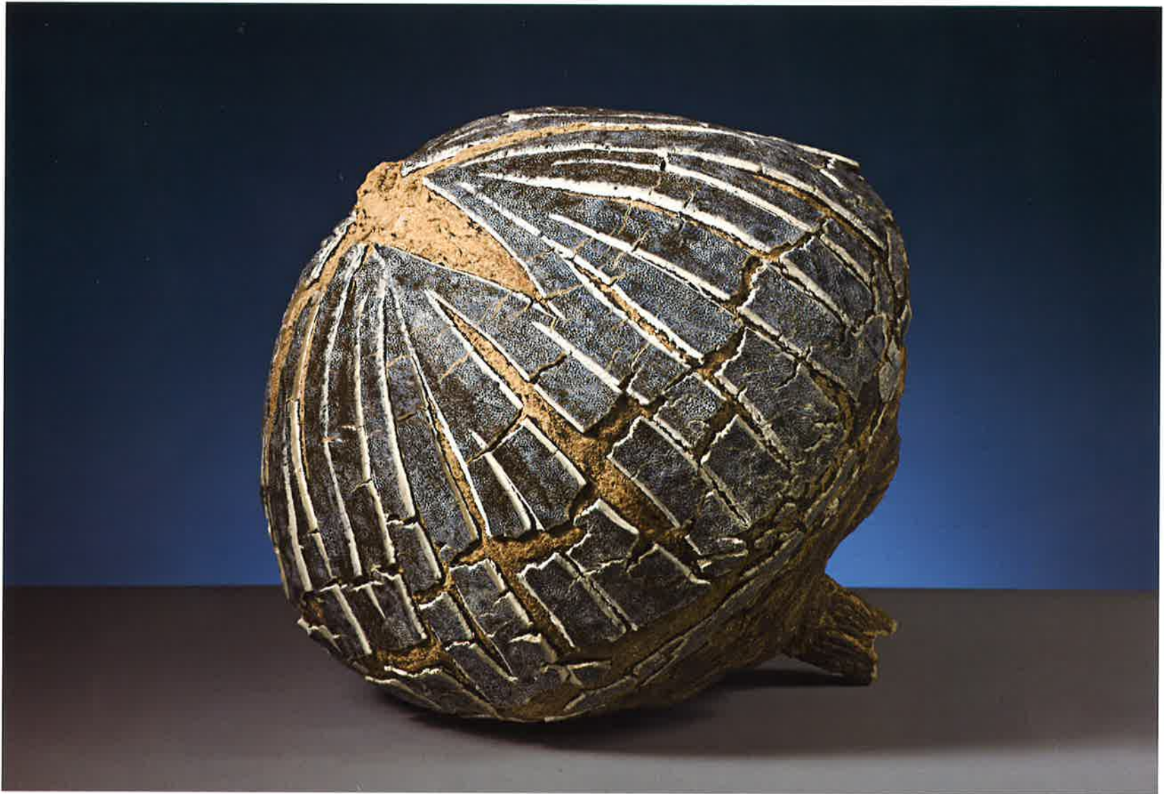
Fruto místico , 2013. Gres expandido 1260°, 42 x 36 x 36