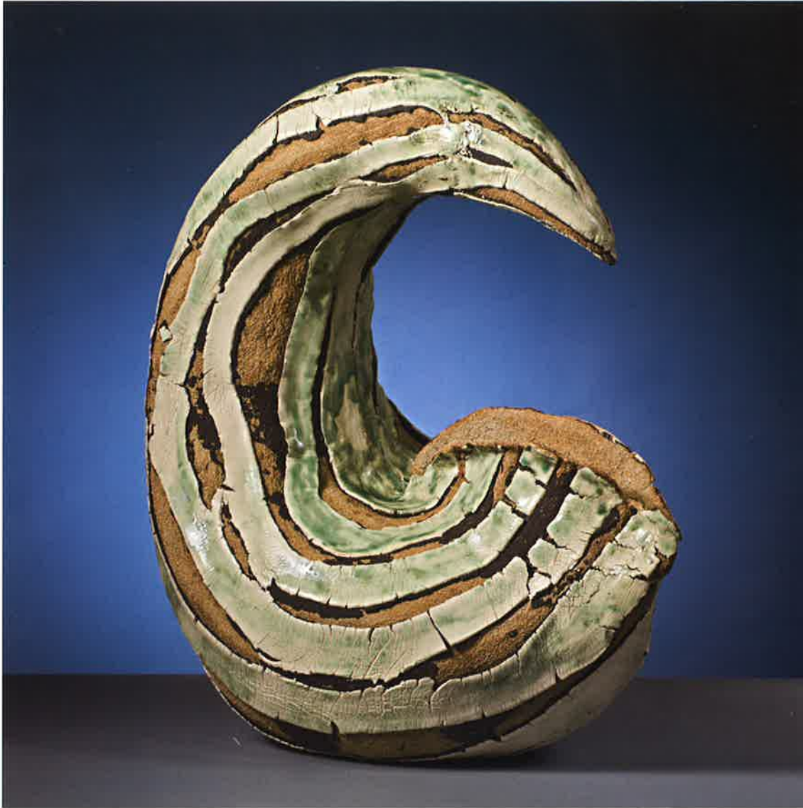
Talismán esmeralda , 2013. Gres expandido 1260°, 56 x 48 x 28