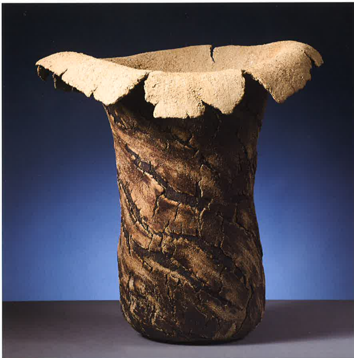
Dádiva , 2012. Gres expandido 1260°, 50 x 46 x 26