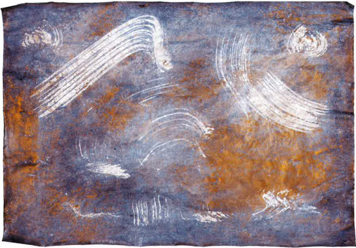
Sin título , 2012. Técnica mixta sobre papel, 44 x 62