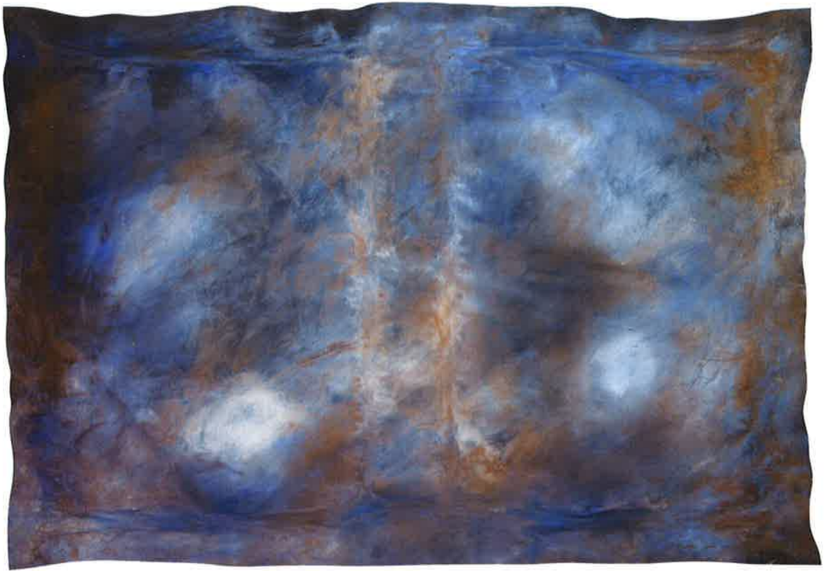
Sin título , 2012. Técnica mixta sobre papel, 70 x 100