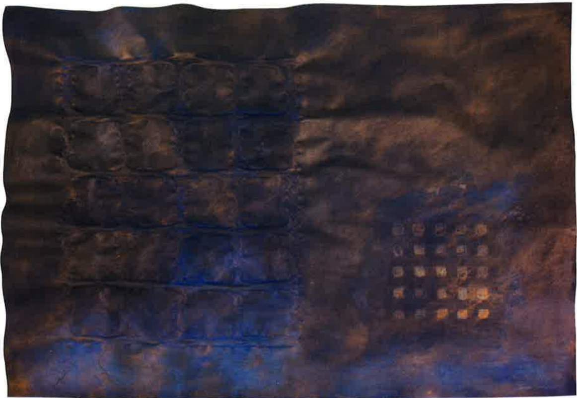
Sin título , 2011. Técnica mixta sobre papel, 70 x 100