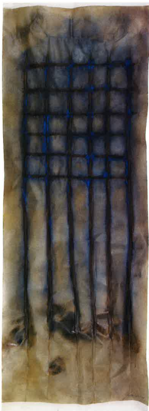
Estela 2 , 2011. Técnica mixta sobre papel, 160 x 60