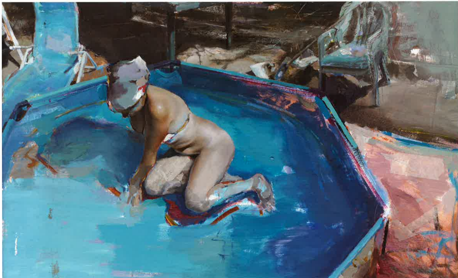
Piscina II , 2010. Óleo / tabla, 70 x 110