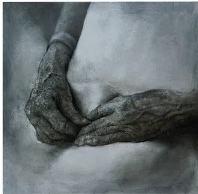
Manos , 2008. Carbón y lápiz / tabla, 52 x 53