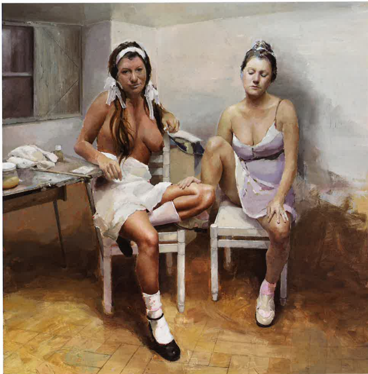
Mujeres en el estudio , 2009. Óleo / papel pegado a tabla, 95 x 90