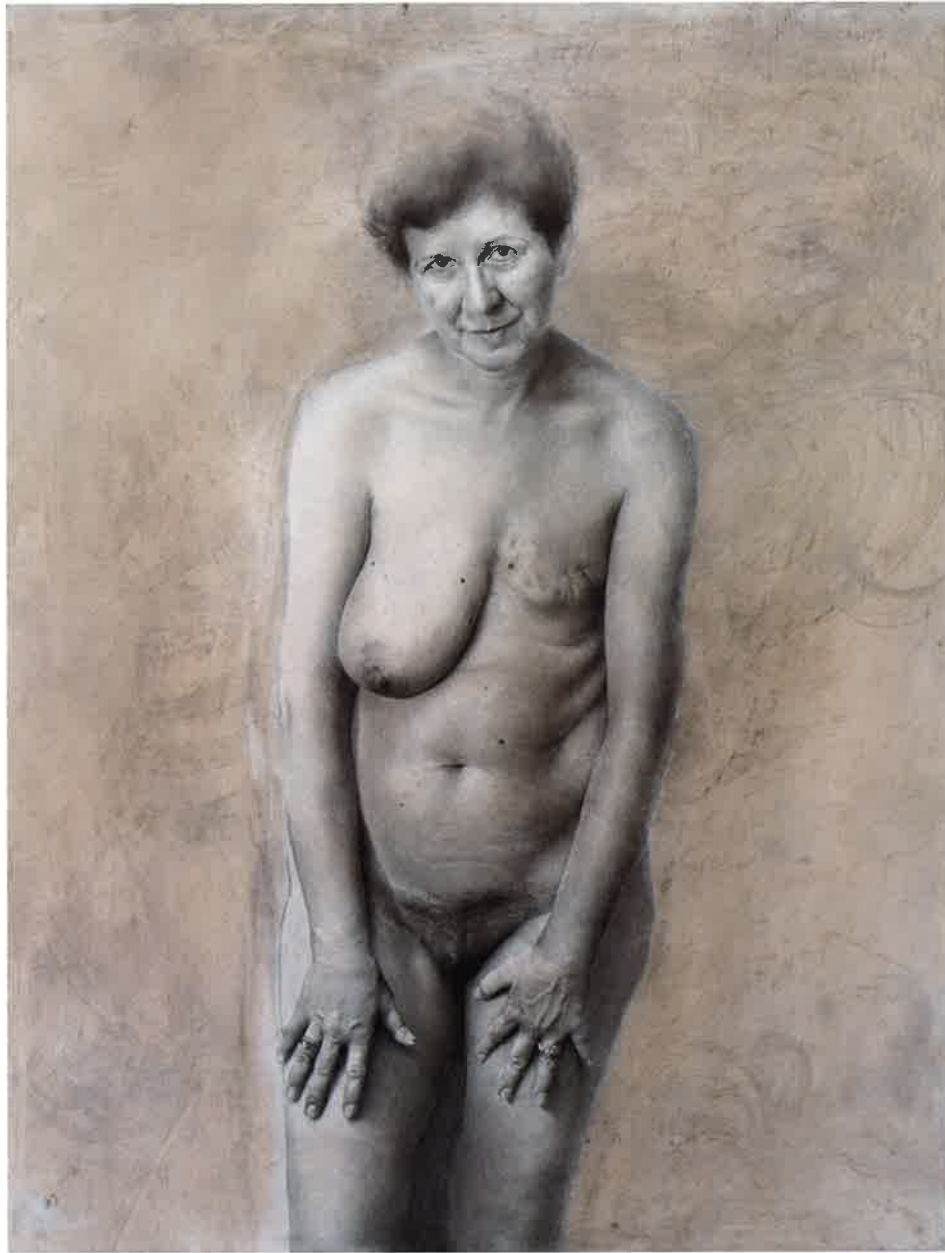
Hueco-drama , 2008. Carbón y lápiz / tabla, 96 x 75,5