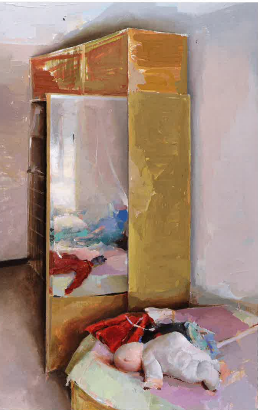
Interior , 2011. Óleo / tabla, 130 x 195