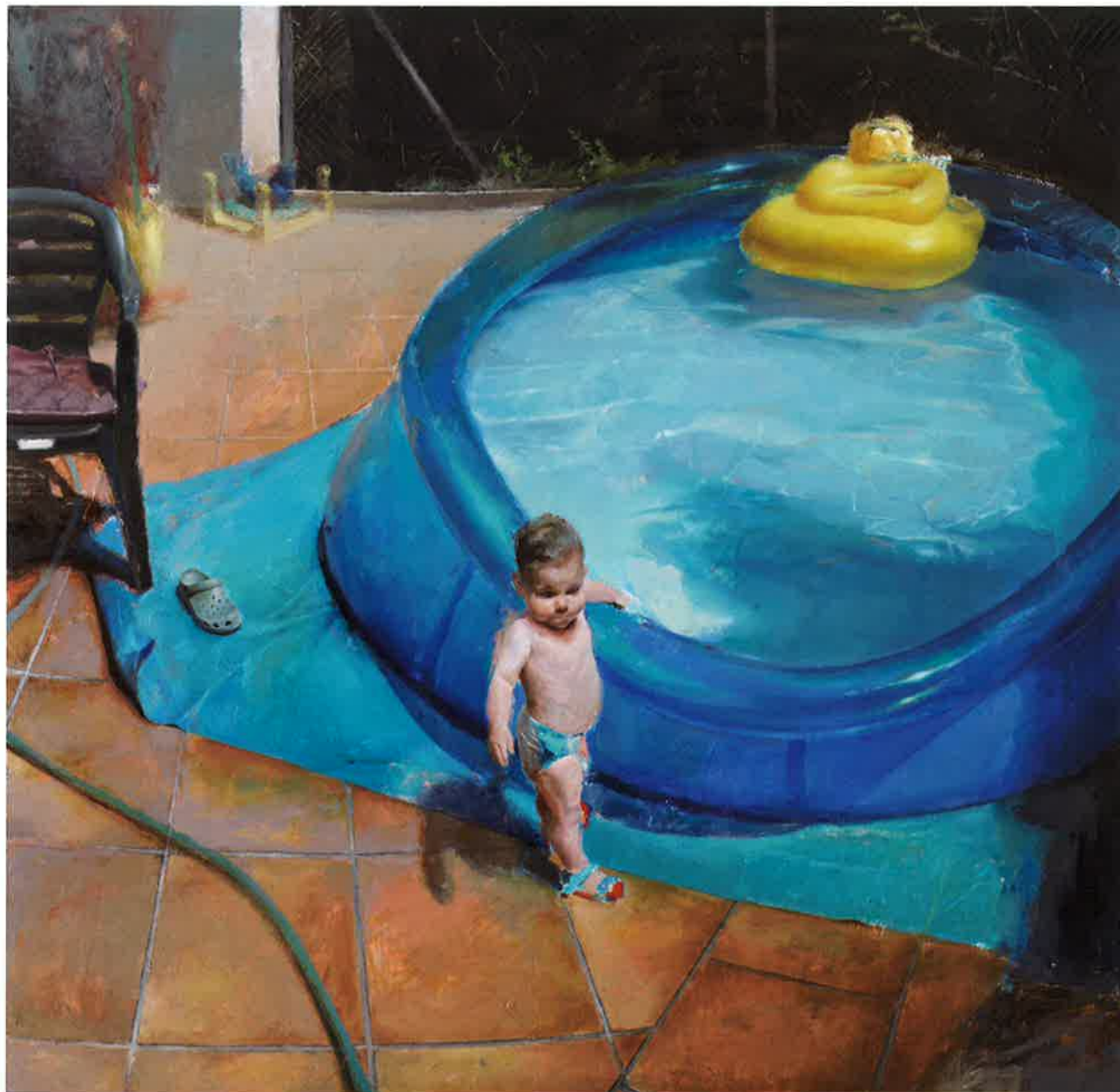
Piscina V , 2011. Óleo / tabla, 118 x 122