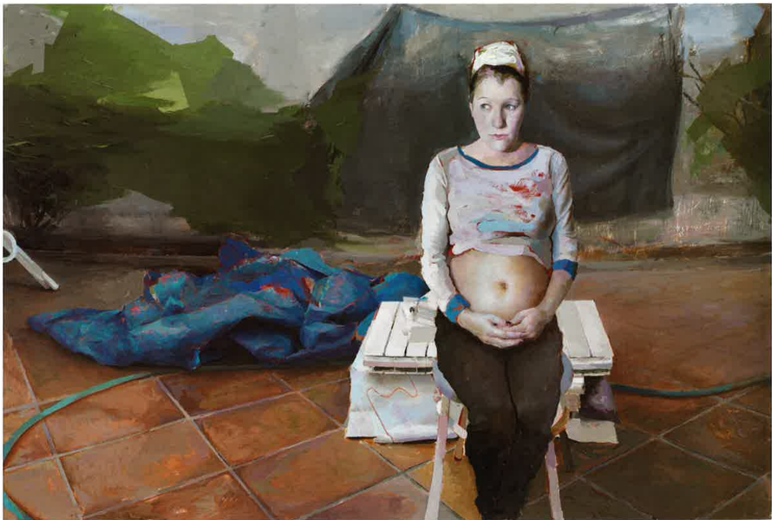
Piscina III, madre , 2010. Óleo / tabla, 80 x 120