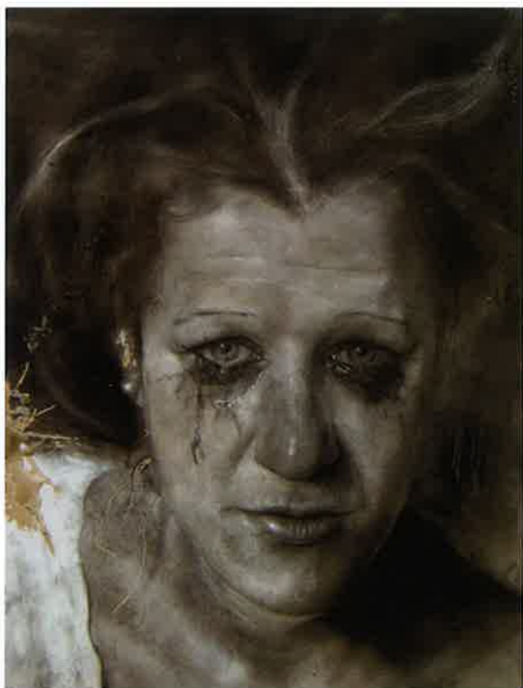
Rastro de lágrimas , 2006. Carbón y lápiz / tabla, 118 x 85

De esta cosa tan impertinente y de tan difícil definición que es la pintura doy clases los jueves, desde hace algún lustro, en un aula que a tal efecto tiene la Obra Social de Ibercaja.