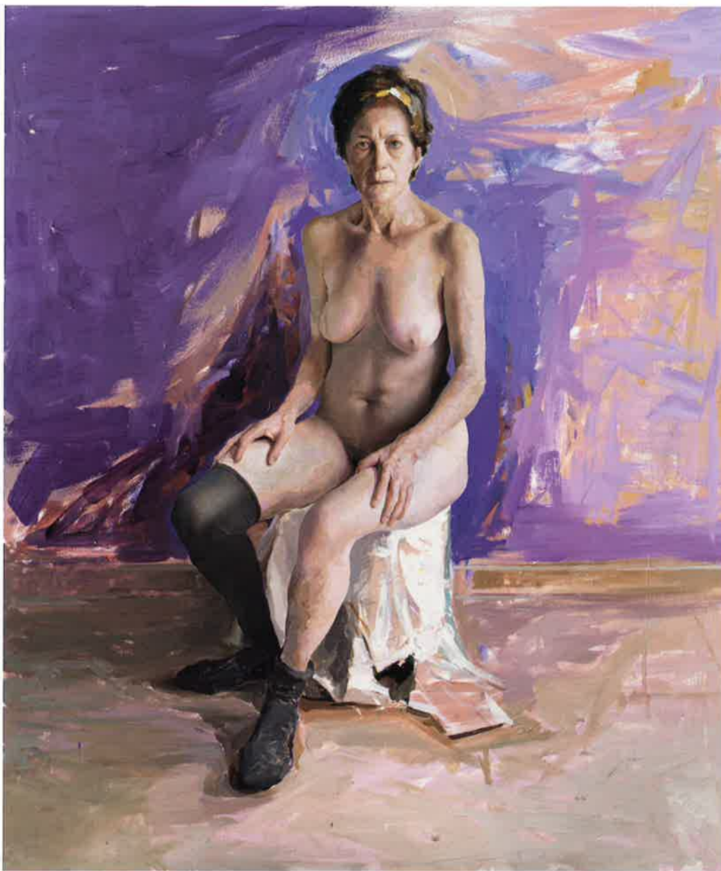
P , 2010. Óleo / tabla, 116 x 97