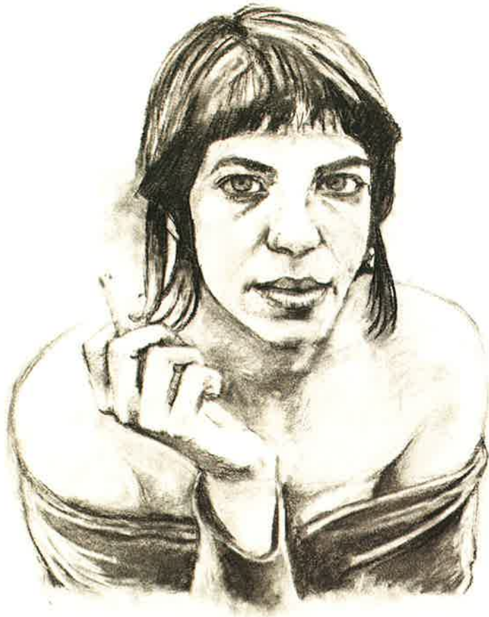
Asun I , 2009 Carboncillo sobre papel fabriano, 140 x 115