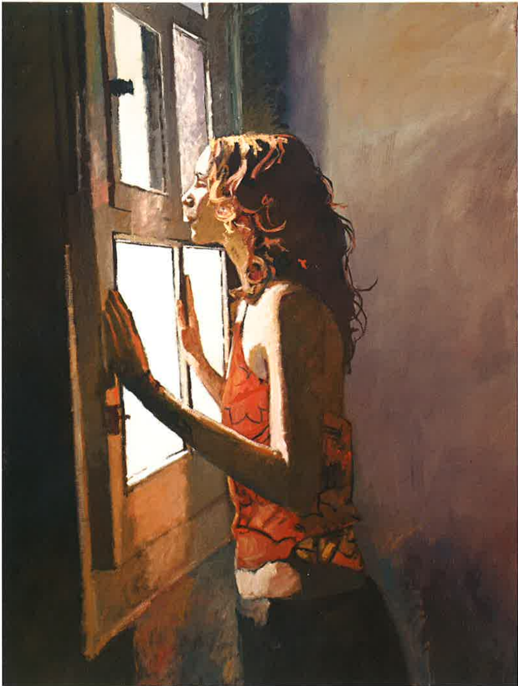
Lorena Sanz I, 2009/2010 Cretas de diferentes colores sobre papel fabriano, 130 x 97