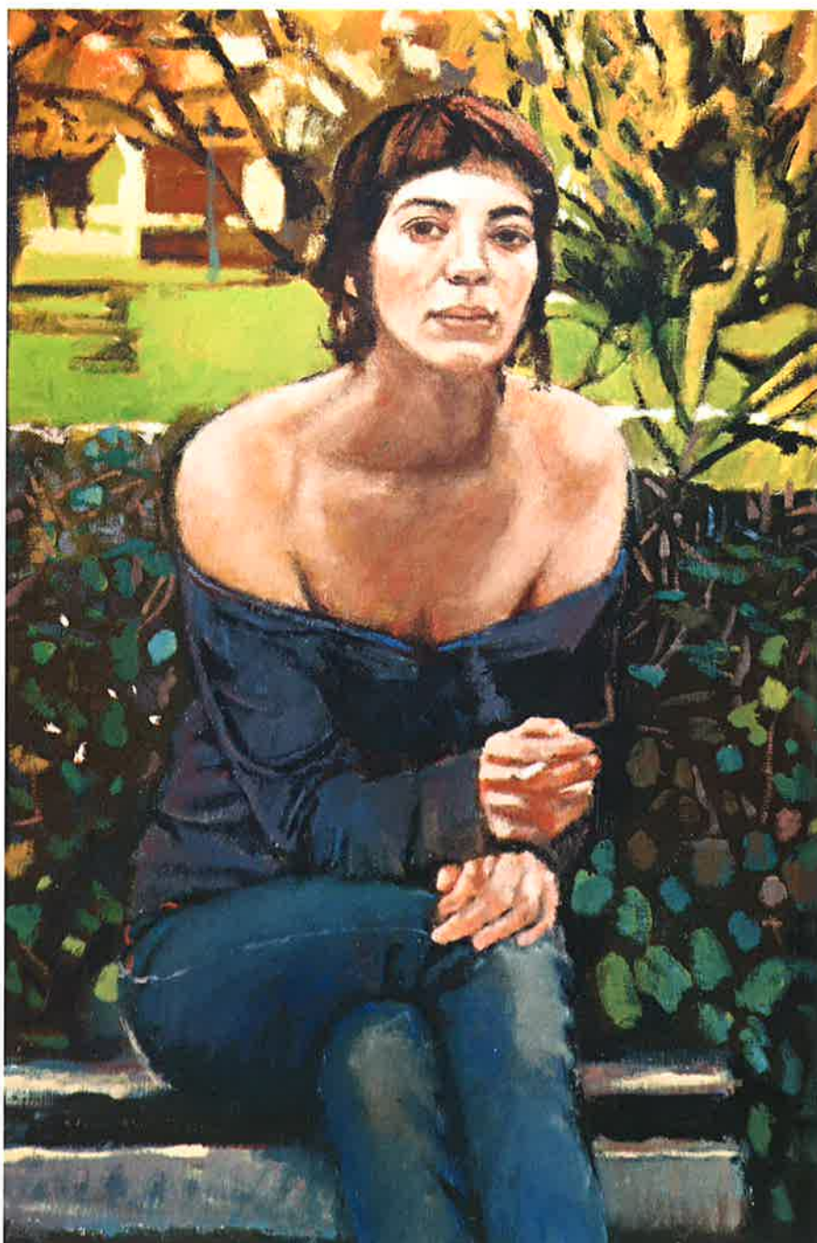
Asun II , 2009 Óleo sobre lienzo, 59,5 x 40