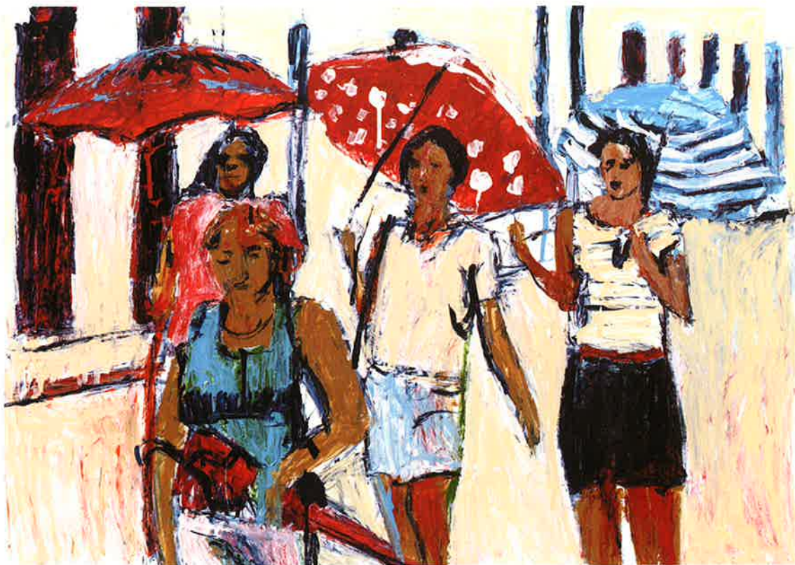
Quitasoles en Santa Clara, 2010 Esmalte titanlux sobre papel, 50 x 70