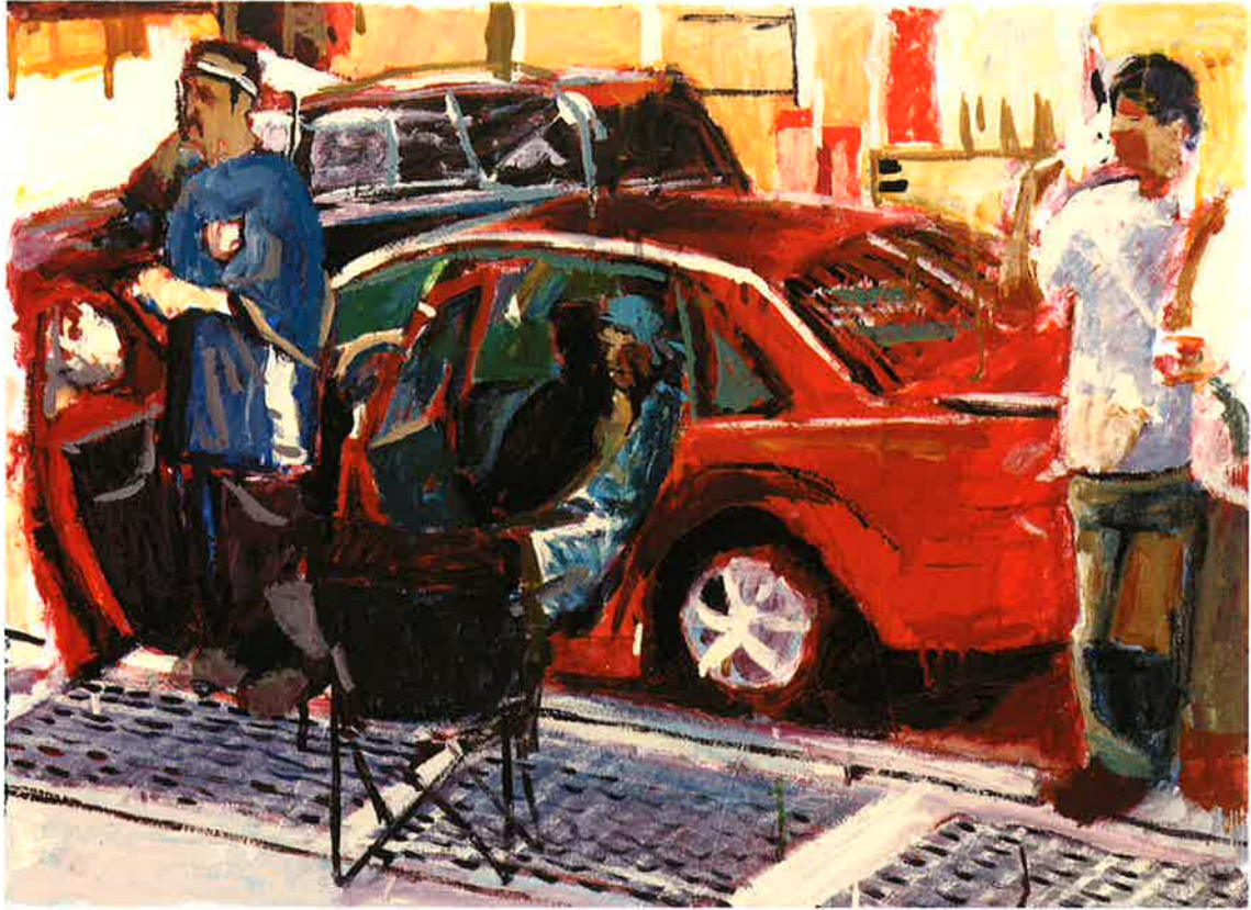
South Broadway , 2010 Esmalte titanlux sobre papel, 50 x 70