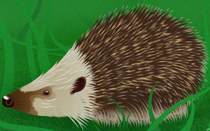
Erizo común ( Erinaceus europaeus )