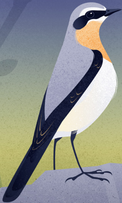
Collalba gris ( Oenanthe oenanthe )