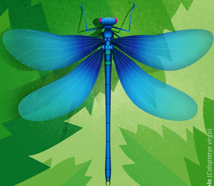
Caballito del diablo ( Calopteryx virgo )