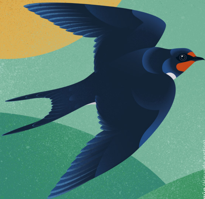
Golondrina común ( Hirundo rustica )