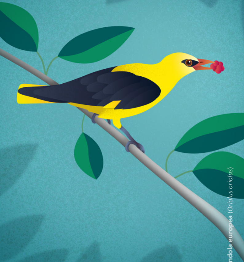
Oropéndola europea ( Oriolus oriolus )