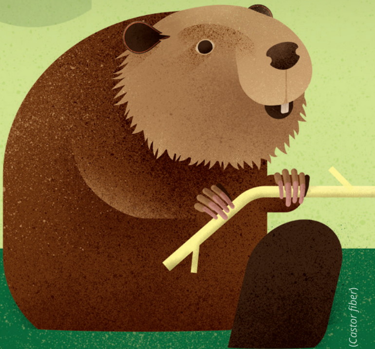
Castor europeo ( Castor fiber )