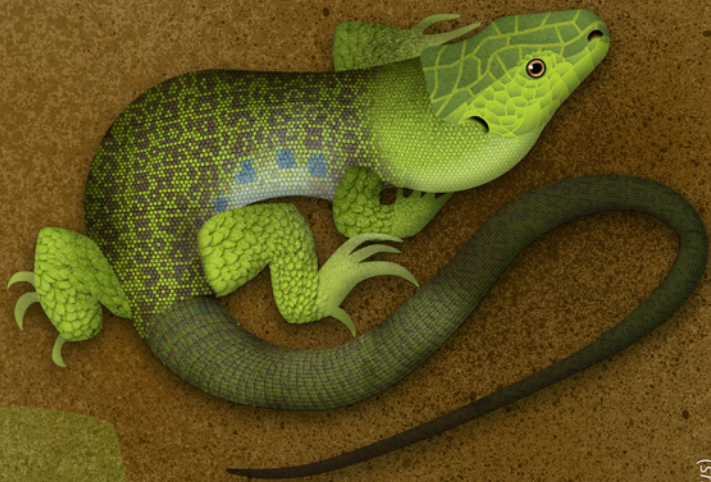
Lagarto ocelado ( Timon lepidus )