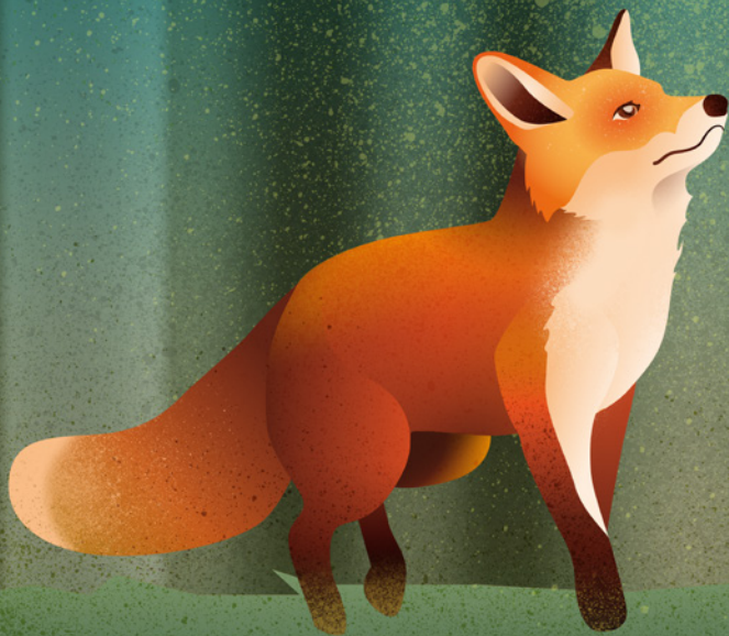
Zorro común ( Vulpes vulpes )