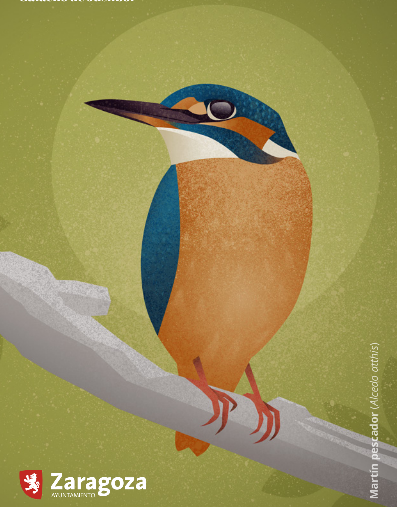
Martín pescador ( Alcedo atthis )