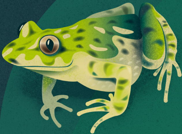
Sapillo moteado ( Pelodytes punctatus )