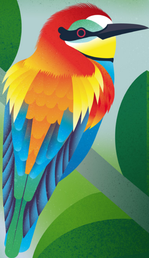
Abejaruco europeo ( Merops apiaster )