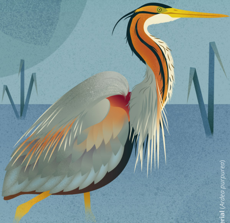
Garza imperial ( Ardea purpurea )