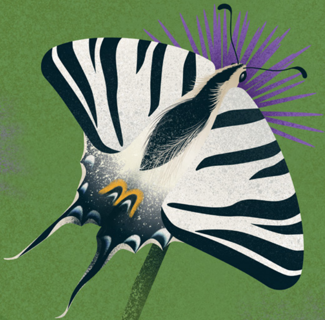
Podalirio ( Iphiclydes podalirius )