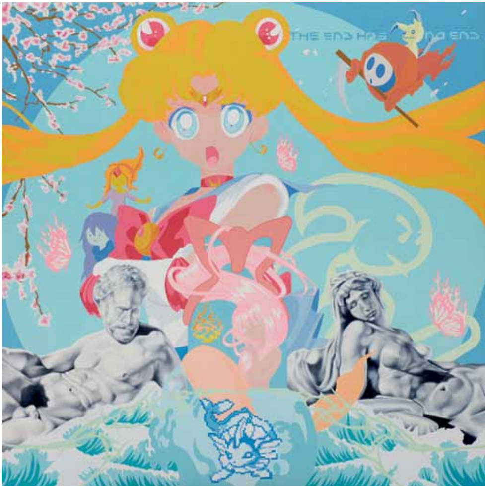
Ira Torres (Zaragoza, España, 1991). Medici , 2022.

Óleo y Molotow marker sobre madera, 100 x 100 x 3,5 cm.