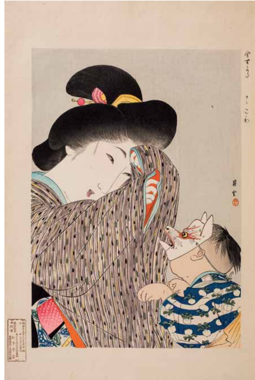
Yamamoto Shōun (Kōchi, Japón, 1870 – Tokio, Japón, 1965), Modas de hoy en día (Ima Sugata) , 1907. Libro de estampas ukiyoe, 35,5 x 23,7 cm. [cerrado], Museo de Zaragoza

Alejandra Rodríguez Cunchillos Comisaria de la exposición