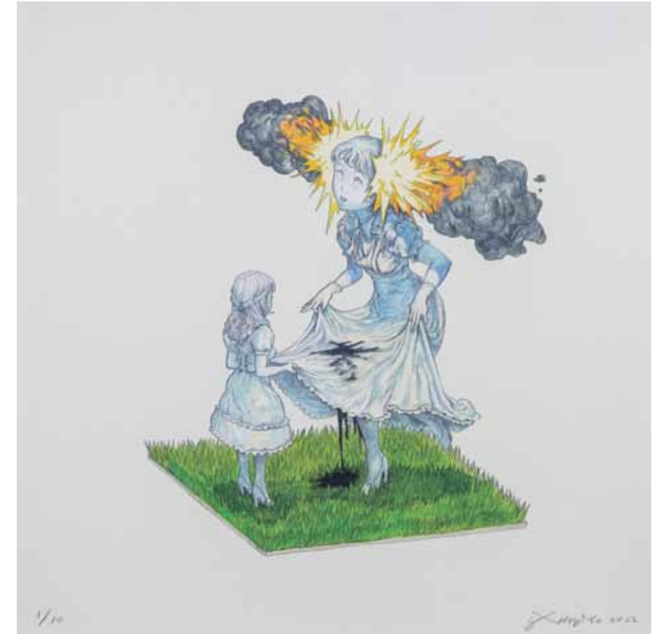
Lee Hongmin (Seúl, Corea del Sur, 1982), Bomb 2 , 2022, Impresión digital sobre papel, 29 x 29 cm. Colección SOLO.