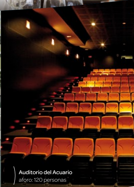
Auditorio del Acuario aforo: 120 personas