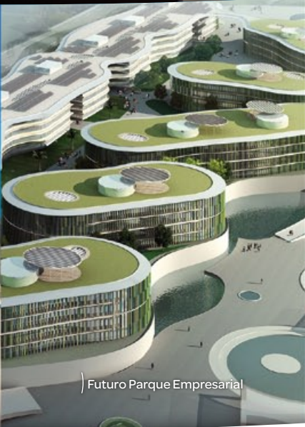
Futuro Parque Empresarial