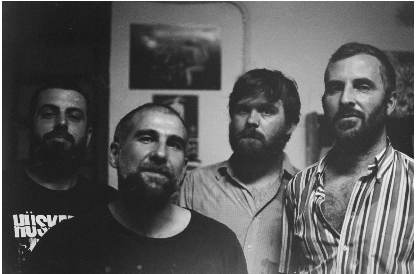
Les Conches Velasques