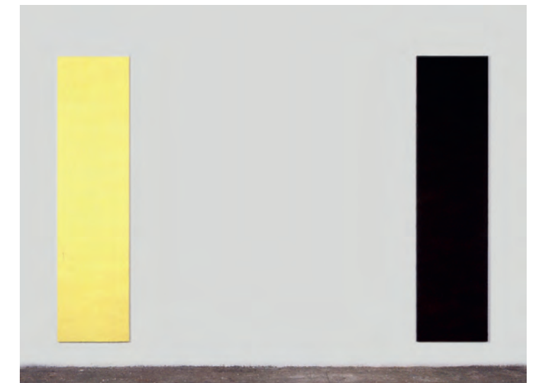
Ignasi Aballi, Sin límite II , 1990