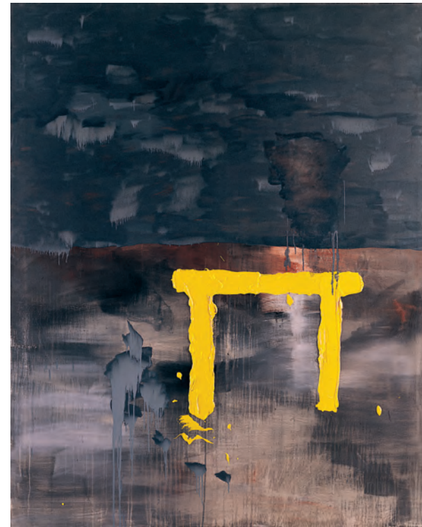
José Manuel Broto, Dolmen , 1986

Es en este doble sentido que debemos comprender Estancias, una exposición que reúne una selección de obras de la Colección de Arte Banco Sabadell escogidas por su capacidad de evocar lugares y espacios, exteriores e interiores, privados y públicos, estancias en las que nos movemos, pensamos y vivimos.