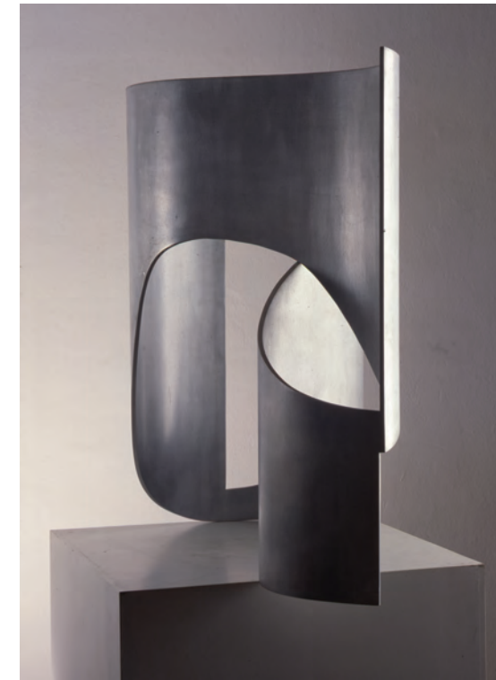
Equipo 57, S/T. E-2b , 1962-1963