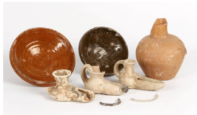
• Cultura Islámica 1.200 dC