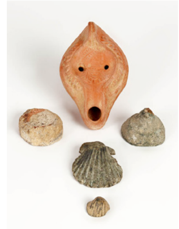
• Cultura Paleocristiana 450 dC