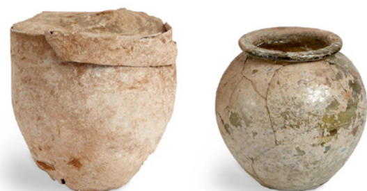
• Cultura Romana 300 dC