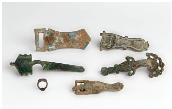
• Cultura Visigótica 700 dC