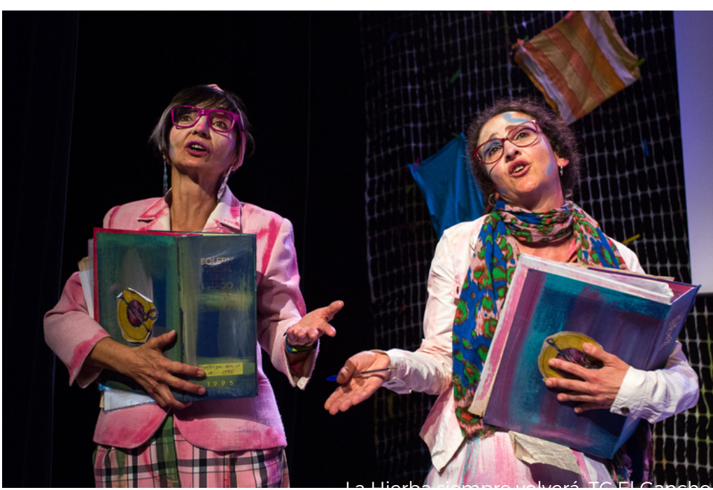
La Herba sempre uxoré T.C. El Carabó