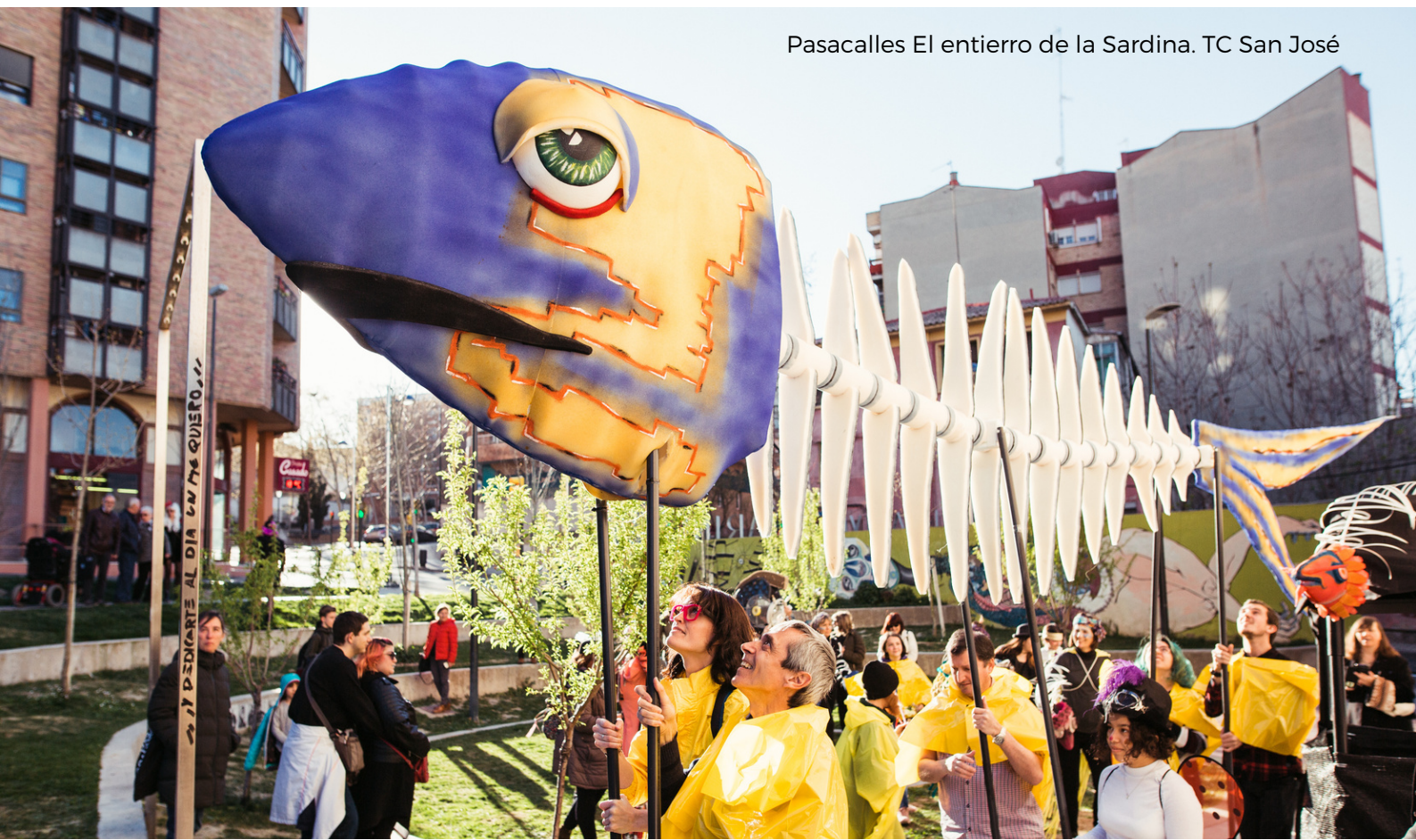
Pasacalles El entierro de la Sardina. TC San José

2018-2019 Organización y actuación en el Pasacalles de las Fiestas del Gancho. Como miembros de la comisión organizadora de las fiestas del barrio, organizamos durante dos años consecutivos un pasacalles con actuaciones musicales y teatrales por las calles del barrio de San Pablo. Participaron alrededor de 20 colectivos con sus actuaciones y asistieron alrededor de 300 personas en las dos ediciones.