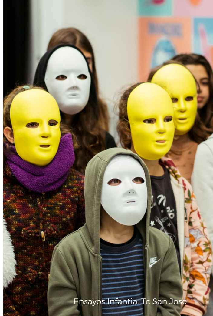
Ensayos Infancia. Tc San José