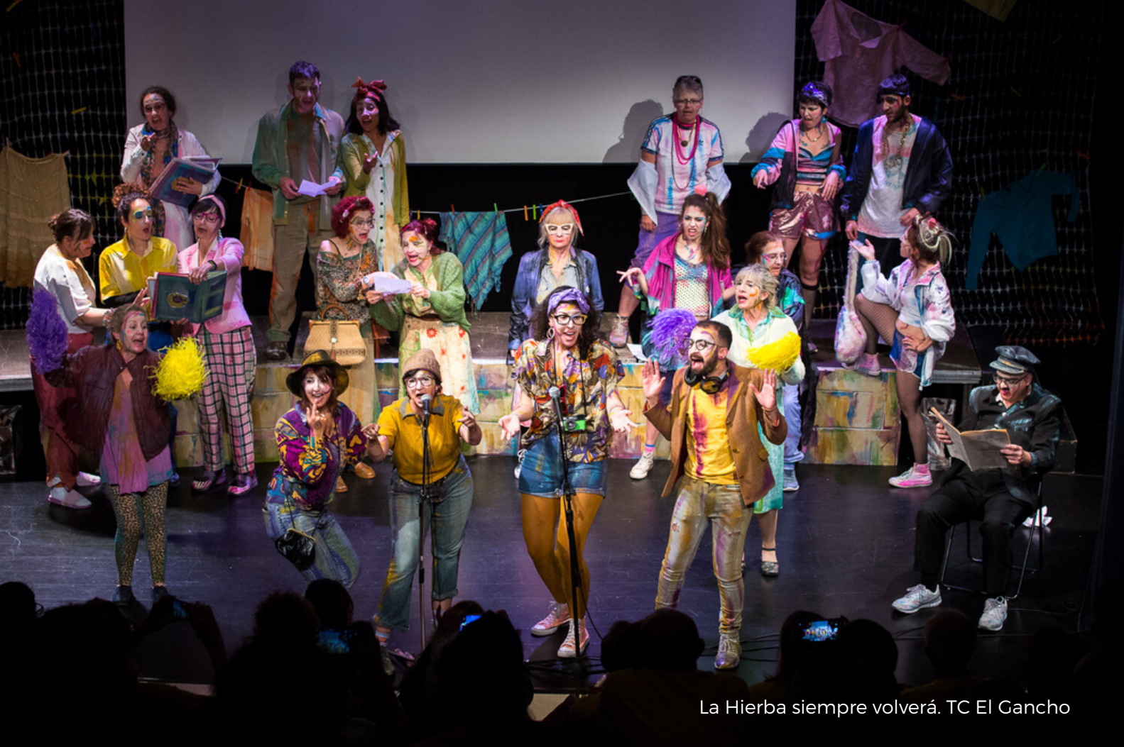
La Hierba siempre volverá. TC El Gancho