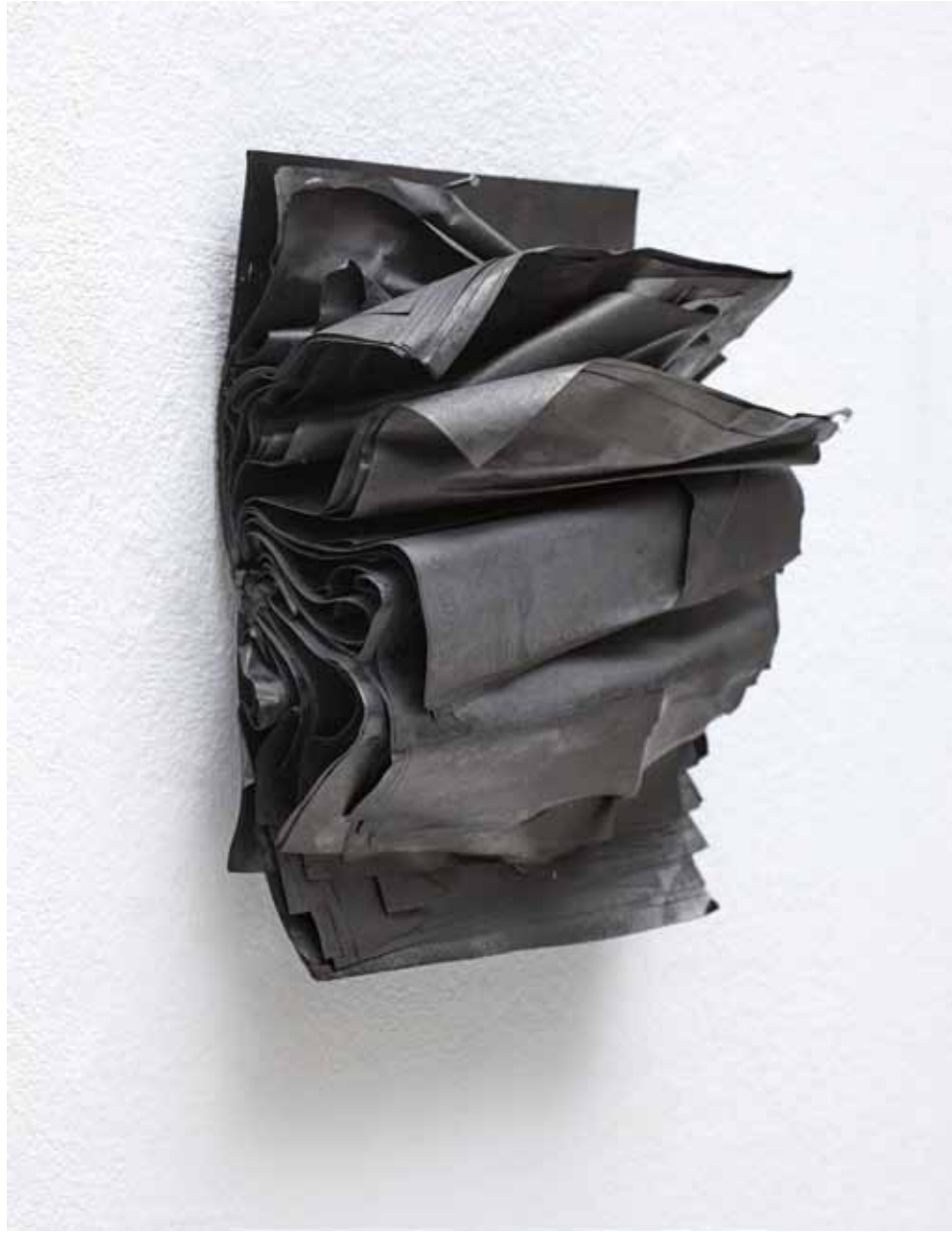
Estratos IV 2019 Tinta sobre papel 21 x 15 x 6,5